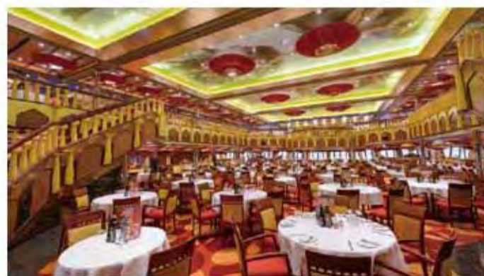
| 米開朗基羅1965餐廳 |