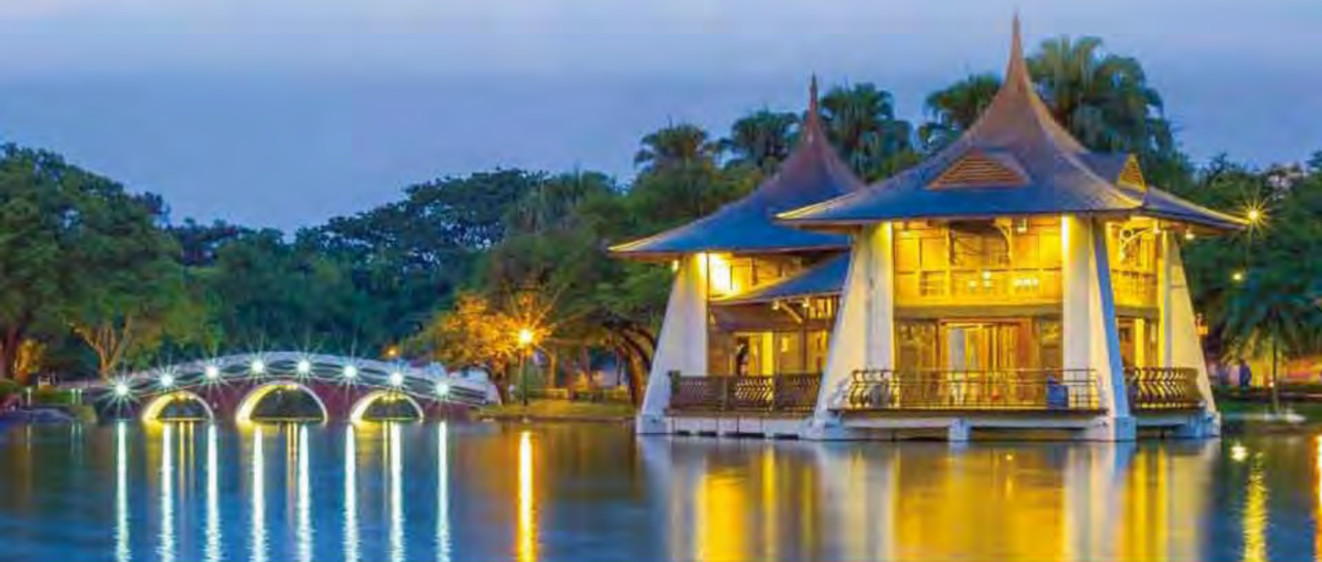
越捷航空 2017 年班機時刻表