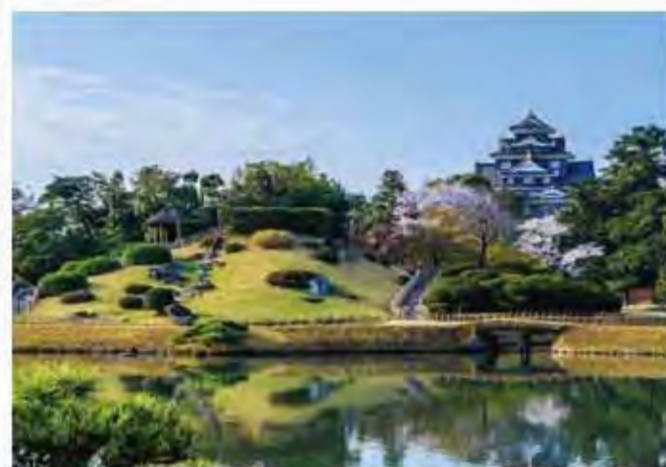
▲岡山後樂園的櫻花。

岡山兩大知名賞櫻景點，岡山市的「旭川櫻花道」和津山市的「津山城(鶴山公園)」。「津山城(鶴山公園)」建於約400年前的古城遺跡，保留高約10公尺的石牆群，從遠方能看見石牆交疊的風貌。4月上旬至中旬櫻花盛開時期也舉辦「津山櫻花祭」，能夠欣賞約1,000棵櫻花樹佈滿石牆的壯麗景象，獲選為「日本知名賞櫻景點100選」之一，賞花期間也有日落後的夜間點燈。