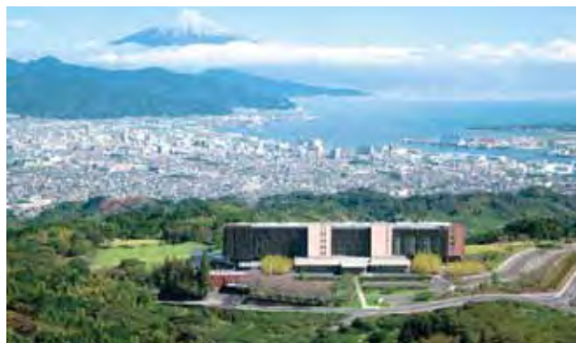
▲居高臨下的日本平飯店可眺望富士山、駿河灣、伊豆半島景致。

由時報旅遊、金龍旅遊、鳳凰、理想、豐華、良友、汎佳、巨匠等8家菁英業者組成的富士靜岡PAK，透過華航台北—靜岡直航航班，推出「富士靜岡～日本平飯店～大井川鐵道、櫻桃小丸子、靜岡全覽、華麗極品5日遊」，