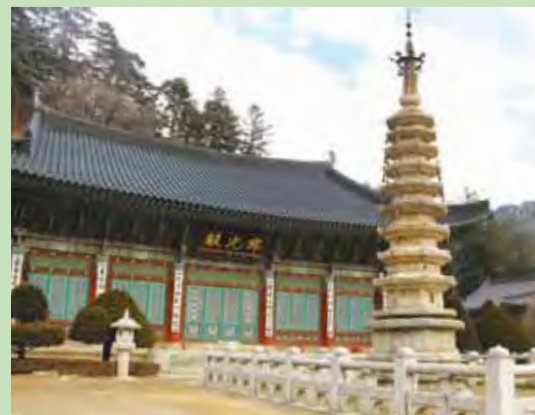
▲五台山月精寺的八角九層石塔是高麗時期留存至今的重要國寶。

從入口處的月精大伽藍門，到主寺前的這條步道，是綿延近800公尺的冷杉林綠色隧道，饒富禪意；這裡的氣候四季分明，秋季也成了賞紅葉的勝地之一。