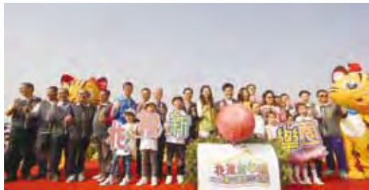
▲台中國際花毯節於日前正式登場，在台中市市長林佳龍（後排左12）、台中市觀光旅遊局局長陳盛山（後排左8）等嘉賓見證下揭幕序幕。

首次移師后里花田綠廊舉辦 登場首日湧入8萬人次 4大亮點展區、10大主題展區、主題平面花毯超吸睛