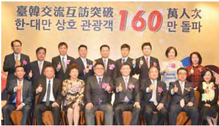
▲在台灣與韓國雙邊共同努力下，台韓雙方互訪人次終於於2016年正式突破160萬人次，朝2017年200萬人次繼續邁進。