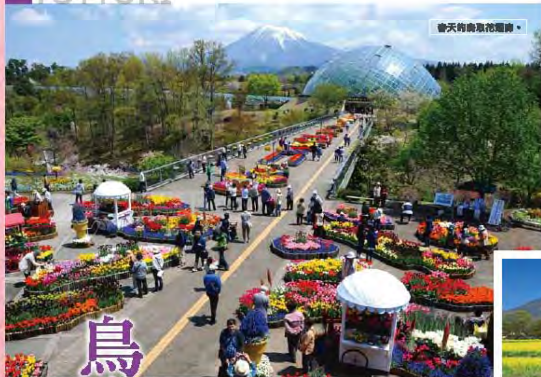
會天的鳥取花迴廊。