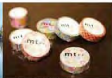
▲岡山倉敷為紙膠帶的故鄉。