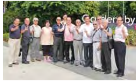
▲台灣國際郵輪協會會員們恭賀協會成立滿2週年了。