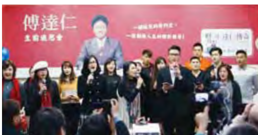
▲主播何戎與藝人朋友一起合唱福音。