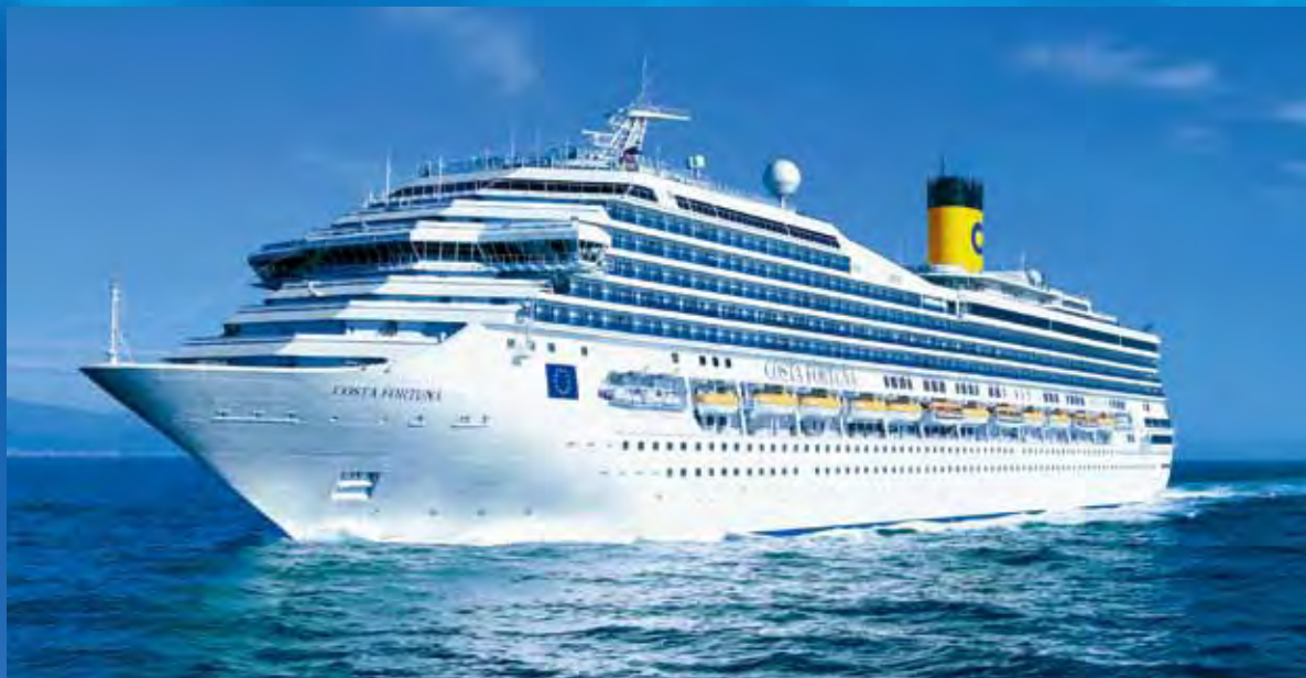
▲歌詩達·幸運號將在2017/6/16於基隆啟航。

不同的主題作為設計理念，為旅客準備道地的義大利美食，並特選義大利著名的ILLY咖啡豆，濃濃的義大利風情非常迷人。此外，幸運號上唯一的付費餐廳—海上撈，用新鮮的雪蟹及多種湯底打造最頂級的美食饗宴。