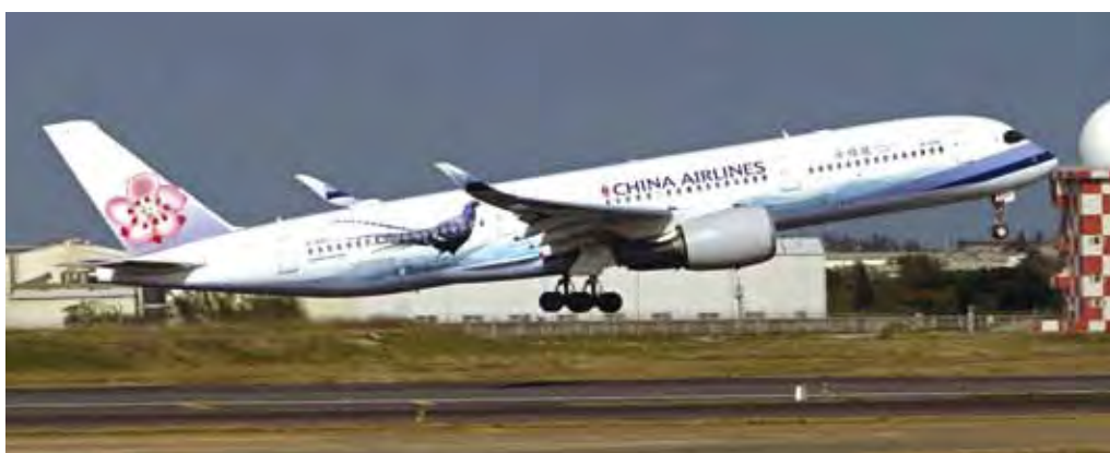
▲華航A350帝雉號新機彩繪亮相。

彩繪新機啟航！台灣特有種帝雉聞名全球 翱翔於萬呎高空 1/9起執飛阿姆斯特丹、維也納、羅馬 全面布局歐洲航線