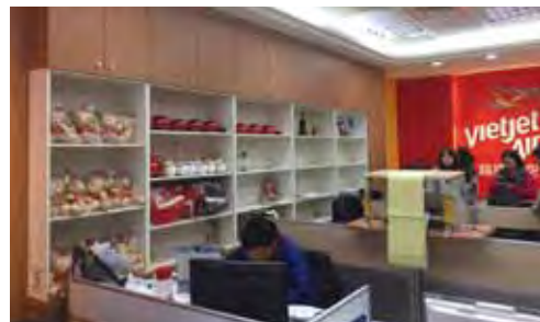
◀▲透過據點的直接設立，越捷航空將提供中台灣市場最迅捷的服務。

目前台中—胡志明市航線初期將以每週一、三、五、日飛航，由於相當看好中台灣市場的發展性，待市場逐漸穩定