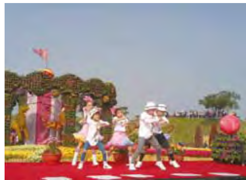
▲台中國際花毯節開幕邀請索布雷特舞團表演。

同時，為降低花毯節周邊幹道枋寮路交通衝擊，市府也於活動期間實施交通管制計畫，規劃在三豐路與枋寮路口禁止私人車輛進入枋寮路；花毯會場周邊道路活動期間，也搭配單行管制、禁止停車等管制措施，希望民眾屆時多利用大眾運輸賞花。