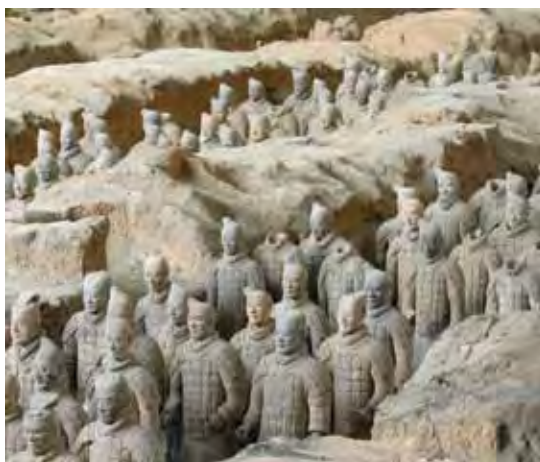
▲西安是世界4大文明古都之一，其中以兵馬俑區最具代表性。