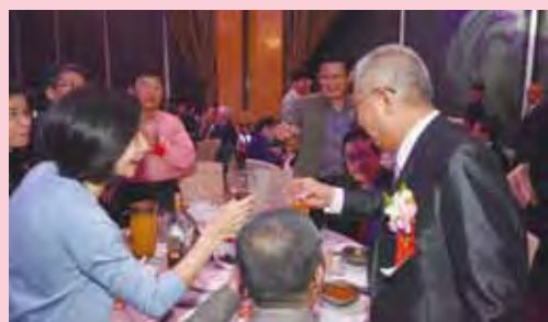
▲賓客一同恭賀名生旅遊的盛事。