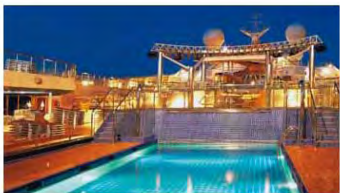
| 大洋洲1932泳池 |

是亞麻色巴拿馬帽、針織駝色上衣、白色長褲 船長之夜，就換淺黃色喬琪紗禮服上場 泳池邊，不能少了桃紅色繫帶比基尼 全程當然要戴上超大鏡面反光太陽眼鏡 塑造剛剛好的神秘感！ 在陽光燦爛的那一天，準備好最時尚的自己 最義大利的歌詩達遊輪，出發！