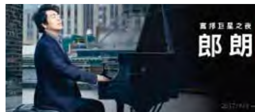
▲鋼琴巨星郎朗於4/3再度訪台。