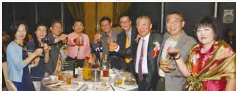
▲與名生旅遊站在同一陣線的PAK夥伴也特別到場慶賀。