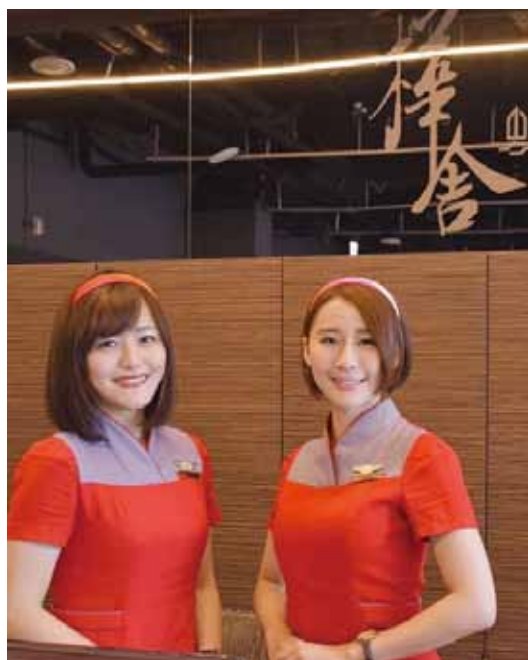
▲樺福遠航集團積極建構起航空旅遊一條龍，打造完整的旅遊產業鏈。