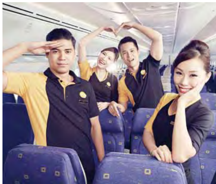
▲酷航連續2年被評選為「亞太最佳低成本航空」，深獲年輕客群喜愛。

為了進一步推廣酷航／酷鳥航的航線網絡優勢和多樣化產品，特別於12/21~28期間舉辦台北、台南和高雄場產品說明會，介紹酷航波音787夢幻客機特點和2017年的飛航計畫，充分展現「亞太最酷航空」品牌魅力。