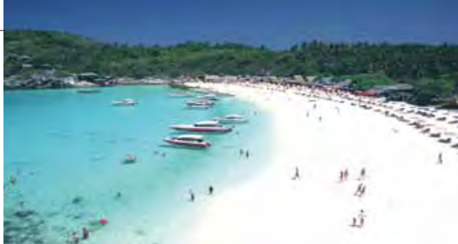
▲你心目中最爽的度假模式為何？快來普吉神秘海灘放空吧！