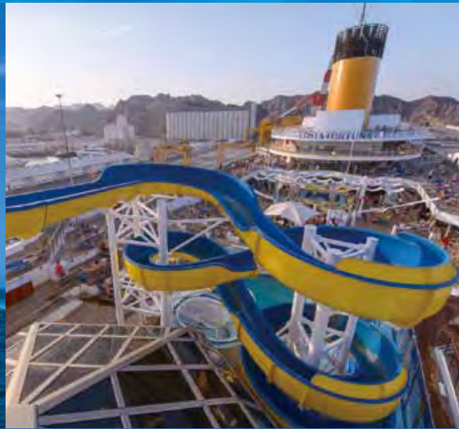
▲滑水道是大型郵輪才有的設施。

府、大阪、神戶、高知5點，包裝基隆出發較少去到的景點；與7/10出發，獨家橫跨大阪、釜山的「6天5夜」日韓雙國遊等行程，產品選擇豐富，滿足不同旅客需求。