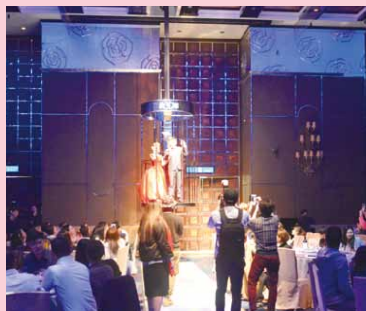
▲新人透過從天而降的方式進場，以及開啟目前最熱門的直播，讓賓客看到屬於年輕人的活力與創意。