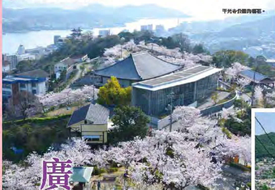
千光寺公園的櫻花。