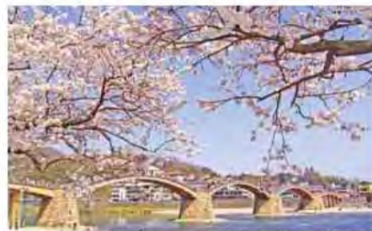
▲日本三大奇橋—錦帶橋。

另外也推薦同時坐擁「日本三大名橋」、「日本三大奇橋」兩大頭銜的錦帶橋，結構保留傳統木工的精細技術，春天背景襯著櫻花，夏天則能賞煙火，秋季紅楓、冬日雪景，一年四季展現不同樣貌。