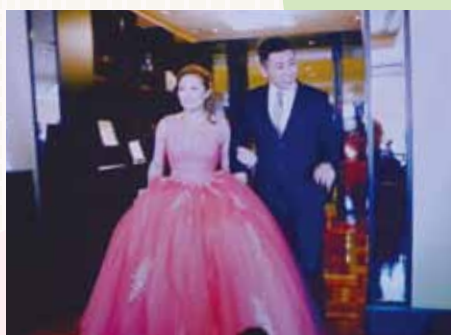
▲新人訂婚的片段也成功吸引現場數百位嘉賓的目光。