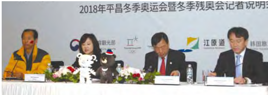
▲(左起)江原道知事崔文洵、韓國文化體育部部長趙允旋、韓國平昌冬季奧運組織委員會委員李熙範、韓國旅遊發展局局長鄭昌洙。

迎接2018年冬季奧運，江原道將以高品質的場地、完善的道路等周邊設施、尖端的科技等，為世人打造一場結合體育、文化與旅遊的完美盛宴。