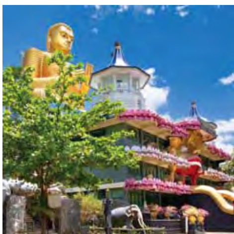
▲斯里蘭卡最大、保存最完整的千年寺廟—丹布拉金寺。

斯里蘭卡位於印度洋，被譽為「印度洋上的明珠」，以獨特的自然風貌和佛教文化風情，吸引全球旅客爭相造訪，近年來成為南亞地區最熱門的