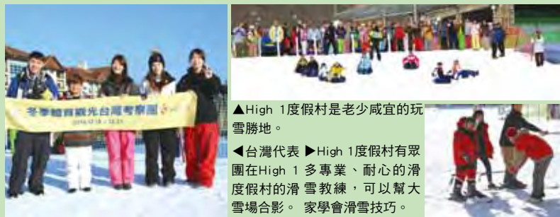
▲High 1度假村是老少咸宜的玩雪勝地。

位於旌善郡的High 1度假村，向來以重視環境保護聞名，建設的過程中完整保護山林間的樹木，並且利用天然的石頭打造出美麗的生態河川。擁有初、中、高級不同難度共18條滑雪道、租借流程順暢的滑雪裝備、海拔1,340公尺處的最高峰上還有觀景台和旋轉餐廳，可以盡覽太白山脈的美景，非常適合全家大小一起體驗玩雪的樂趣。每年冬季，High 1度假村會在韓國旅遊發展局的帶領下推動「Go Go Ski」活動，不但韓國居民踴躍參加，也有香港等不少海外旅行社會帶領團體前往參加競賽，趣味無窮。