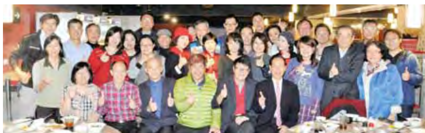
▲2016年A咖導遊歲末感恩餐會來賓大合照。