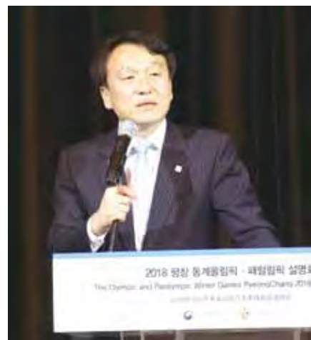
▲韓國旅遊發展局局長鄭昌洙肯定台灣對韓國而言是非常重要的旅遊市場。

2018年的冬季奧運會以及殘障奧運會，即將在韓國江原道的平昌盛大舉行，韓國相關建設正如火如荼進行之中，期待以最佳狀態迎接這場難得的國際盛會。韓國文化體育部、冬季奧運組織委員會、江原道與韓國旅遊發展局特於年底前邀請台灣、大陸、香港、新加坡、越南、泰國等地共84位旅遊業者與媒體，前往考察實地的建設情況。