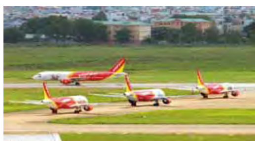
▲越捷航空不斷引入新機擴大機隊，包括新型的波音737-800MAX與空中巴士A321、320。