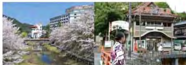
▲春天川畔櫻花美不勝收。