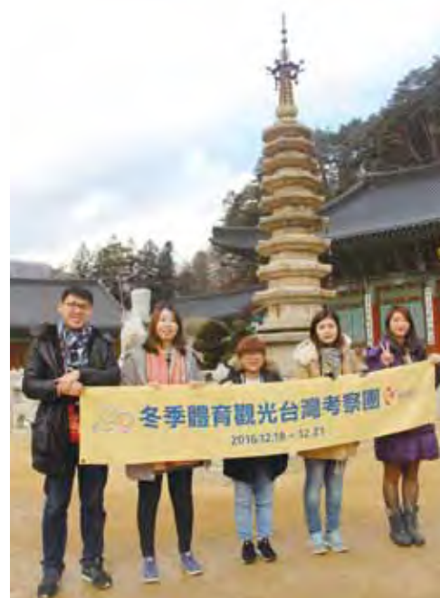
▲台灣代表團在五台山月精寺的八角九層石塔前合影。