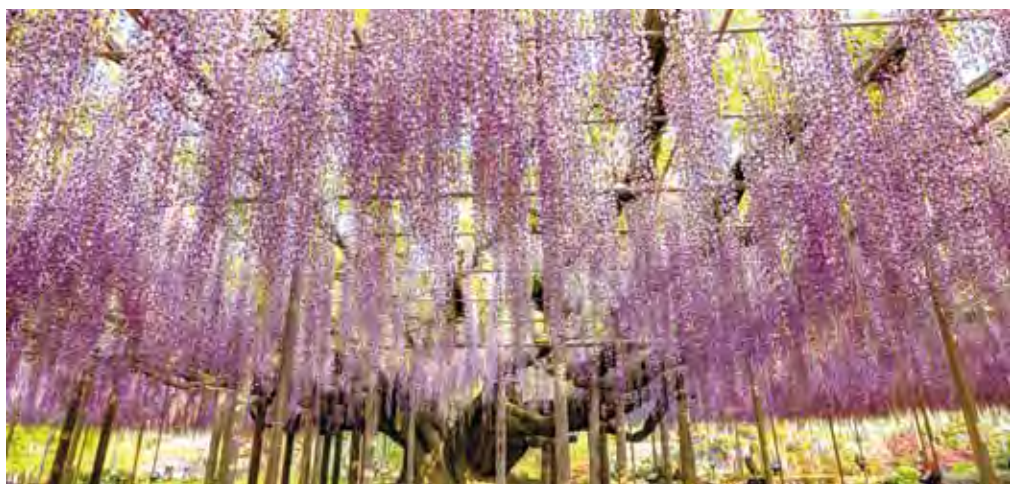
▲整片的紫藤花讓人沉醉。

目前推出以日本航空松山—羽田早去晚回的「關東紫藤花·芝櫻祭·粉蝶花季·春花爛漫5日」，出發日期僅4/19一個出發日期，機會難得。而「東京足利花卉公園賞紫藤·芝櫻祭·日光東照宮5日」則是運用國泰航空，桃園—成田航點包裝，出發日期為4/19、22、26。喜歡九州、四國秘境的旅客也可以選擇「新~環九州滿山春色·櫻花花海·賞櫻之旅6日」、「春之饗宴四國·瀨戶內海·山陰山陽·百選櫻花之旅8日」，以長天數的包裝，讓旅客盡情享受春花的魅力。