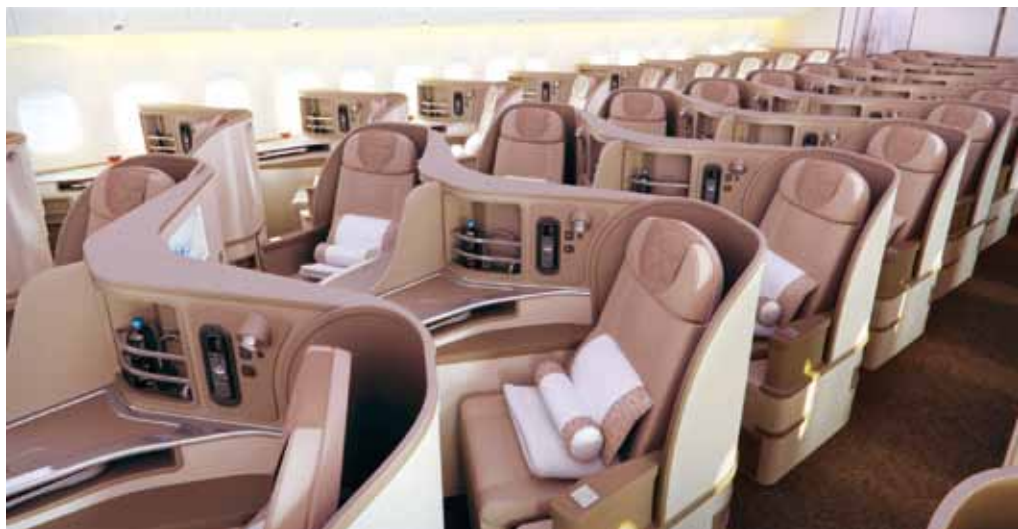
▲東航波音777-300ER機上配置頭等艙6席、商務艙52席、經濟艙258席，帶給旅客最優質的飛行服務。

東航為回饋廣大旅客，提供優惠價格：經濟艙單程666元起（未稅），來回1,999元起（未稅）；商務艙單程3,089元起（未稅）、來回5,149元起（未稅）。開票日期為即日起至2017/1/27止，旅行日期為2017/1/5~1/29止。