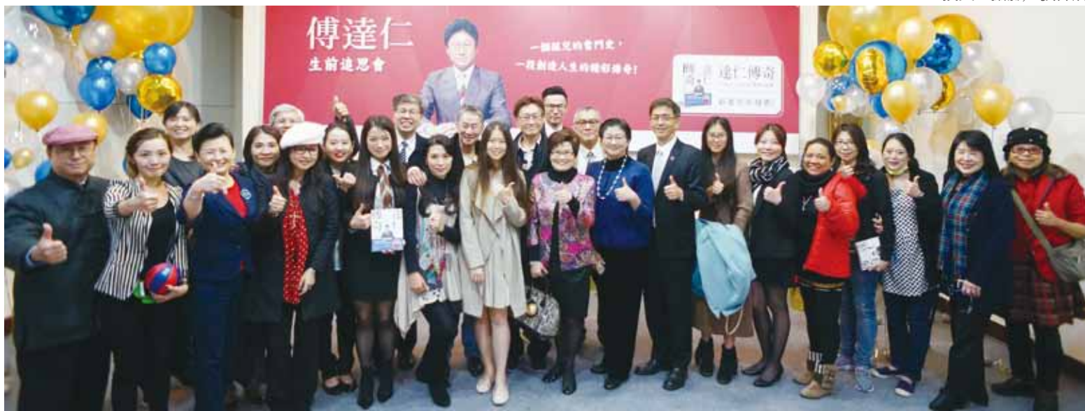
▲(後排左3)時報出版社董事總經理趙政岷、李恕權、傅達仁、(前排左10起)太平洋島國際旅行社董事長鄭貽、雷倩、總經理雷均，與全體貴賓一起合影。

84歲的台灣第一體育主播傅達仁於12/27在長官邸舉辦自傳書《達仁傳奇》記者會，用「生前追思會」的方式與大家分享抗戰漂流孤兒的一生與種種奇遇經歷，以及努力奮鬥的精彩故事。