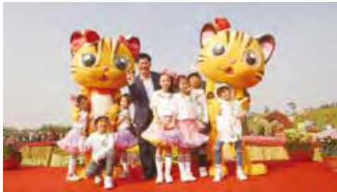
▲台中市市長林佳龍與小朋友、活動代言人石虎兄妹小福跟樂樂合照。