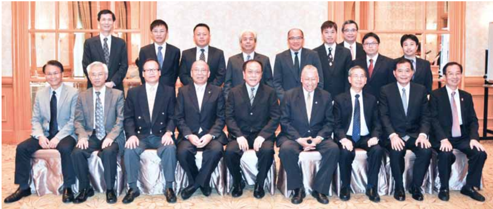
◀ 第1屆台灣國際郵輪協會理事監事合影。

接軌亞太 放眼國際 積極增加國際能見度 提升亞太地區郵輪產 大陸郵輪市場崛起 兩岸簽證問題亟待解決 期望台灣郵輪產業