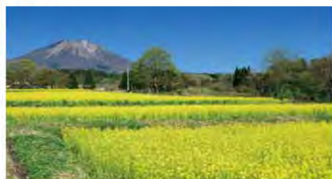
▲西日本第一名峰大山。

四季不僅能欣賞到上百種百合，在日本保有並展示全日本野生百合16種品種的也僅此一處。公園中央直徑50公尺、高21公尺的圓形溫室內栽培著熱帶、亞熱帶的禮物與近千株蘭花。而花迴廊周圍附有1公里加蓋的展迴廊，即使下雨天也無須撐傘，能輕鬆漫步、賞花。