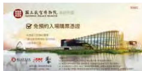
▲樺福遠航集團整合旗下觀光產業多方優勢，推出各種優惠活動，如購買遠東航空離島線機票，即贈送限量故宮南院免預約購票券。