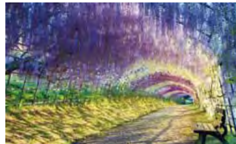
▲浪漫的紫藤花隧道。

另外也有華航九州福岡進出的「深度九州名勝6日」，景點囊括湯布院、別府溫泉、日本復活島SUNMESS、關尾大瀑布、仙巖園，深入九州經典之美。