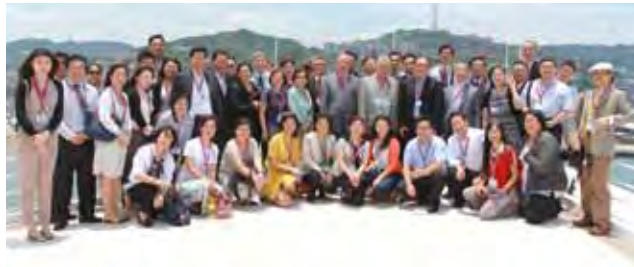
▲台灣國際郵輪協會全體會員在郵輪上合影。