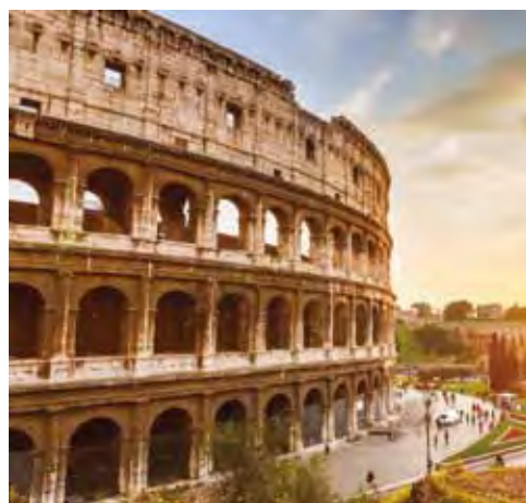
▲「西羅馬、東長安」自古以來代表著歐亞文明的重要古城。

深 耕大陸旅遊多年的雄峰旅行社，以專業、多元、高品質之行程設計，深獲同業信賴與肯定，2016年下半年開始，雄峰旅行社運用各大航空一手機位優勢，包裝多款歐洲系列產品，從8天的短天數，到10~12天的長天數深度遊行程，應有盡有，滿足各種客群需求。