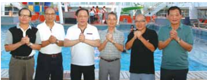
▲台灣國際郵輪協會向大家拜年。

品豐富度 加大市場胃納量 吸引旅遊業者爭相投入郵輪市場 穩定成長 攜手觀光局、郵輪及航空公司、業者推廣fly cruises