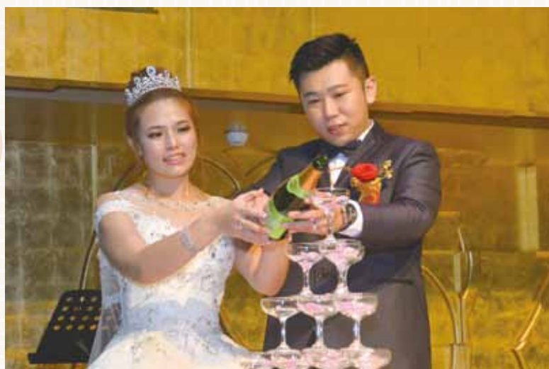
▲新人共同倒香檳塔，象徵兩位的愛情甜美、結實，以及愛情綿延不絕。