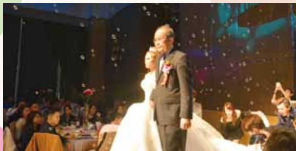
▶新娘在父親的牽引下邁入禮堂中，成為當天最受賓客感動的環節之一。