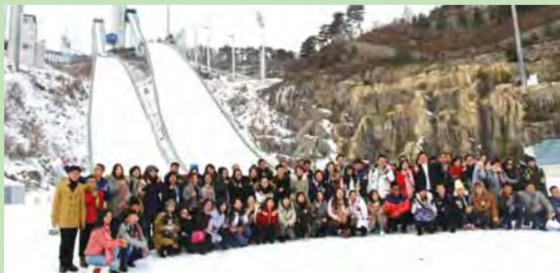
▲冬季體育觀光考察團全員在阿爾卑希亞度假村的滑雪跳台前合影。

阿爾卑希亞度假村2013年已經作為世界冬季特殊奧運會的比賽場館之一，2018年更晉升為冬季奧運及殘障奧運會的主要場地。已經完工的滑雪跳台，高約150公尺，可說是阿爾卑希亞度假村最具代表性的地標，不但是2018年冬季奧運的重要競技場，其它時間普通遊客可以輕鬆乘著單軌列車或電梯，登上觀景台欣賞度假村的全景，周邊大關嶺美麗的景致同樣盡收眼底。