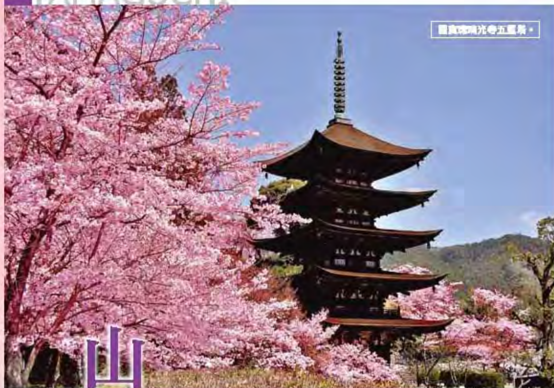
圖為山口光寺五重塔。