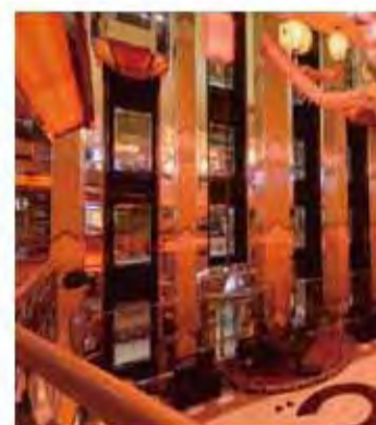
| 幸運大堂 |