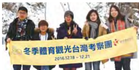
▲台灣代表團在阿爾卑希亞度假村最具代表性的滑雪跳台前合影。