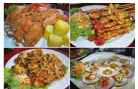
▲在羅永的棕櫚灣渡假村可以享用美味的海鮮BBQ。