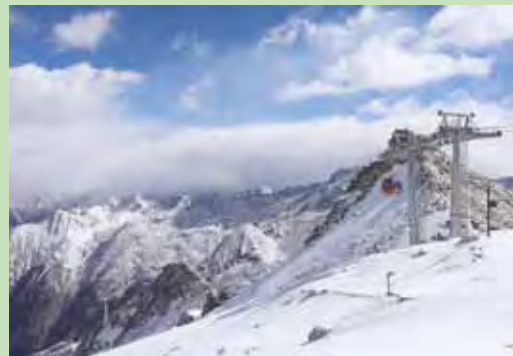
▲海拔4860公尺的達古冰川上纜車站是本次行程最大的亮點。

位於黑水的達古冰川是國家4A級景區，也是大陸第1的彩色冰川，除此之外，還有海拔最低、面積最大、年紀最輕、纜車最高等幾項世界第一的紀錄。進入景區要換乘景區大巴再走約40分鐘才會抵達纜車站，在此搭纜車可直達山頂，到了山頂景色豁然開朗，洛格斯聖山、一號冰川還有環繞四周的雪景都讓人為之震撼，只是在這海拔4,860公尺的地方最好溫柔的輕聲細語、步調緩慢，必要時最好攜帶氧氣瓶以備不時之需。如果覺得不適就盡快搭乘纜車下山，回程可以到景區內的鴻運坡、達古湖、紅石灘、金猴湖等景點觀光，達古冰川景區也是四川金絲猴的保育區，還有野牛、盤羊、山鹿、錦雞及獼猴等多種野生動物棲息，是旅遊資源豐富不可多得的優質觀光景點。