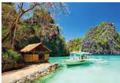
▲科隆島純淨悠閒宛如世外桃源。

針對熱愛海旅遊的旅客，「5J巴拉望愛妮島精彩7日遊」，搭配宿霧太平洋航空公主港進、馬尼拉回，以及中段的愛妮島的島嶼航空，每週五出發、2人成行，沒有成團限制，說走就走。產品包裝2晚阿普莉度假村全包式1島1飯店、1晚朵絲帕瑪，有如馬爾地夫的度假氛圍，讓旅客徹底放鬆。行程前往巴拉望的地底河流，路尼島、海星島、班丹島的跳島之旅，旅客可探索紅樹林、浮潛、獨木舟，Zip Line