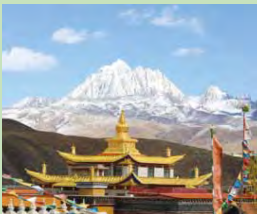
▲塔公寺是甘孜州著名的薩迦派（花教）寺廟。

塔公寺最有名的鎮寺之寶就是釋迦牟尼12歲等身佛像（覺臥佛），相傳在西元641年唐太宗命文成公主下嫁藏王松贊干布和親，並將一尊釋迦牟尼12歲等身佛像賜予公主和藏王用以鞏固邊疆。當隊伍途經塔公地區，這尊覺臥佛彷彿落地生根再也走不動，眾人不知所措，後來佛像自己開口示意要留在這裡，文成公主便指示在此取金沙重塑一尊金身並建寺供奉，和親隊伍才能繼續前進。這尊覺臥佛保存至今並免費開放信眾參拜，從此之後聞名康巴地區，而塔公寺也被譽為「小大昭寺」。有許多一生無法到達西藏的康巴藏民選擇到塔公寺朝拜也同樣功德圓滿。