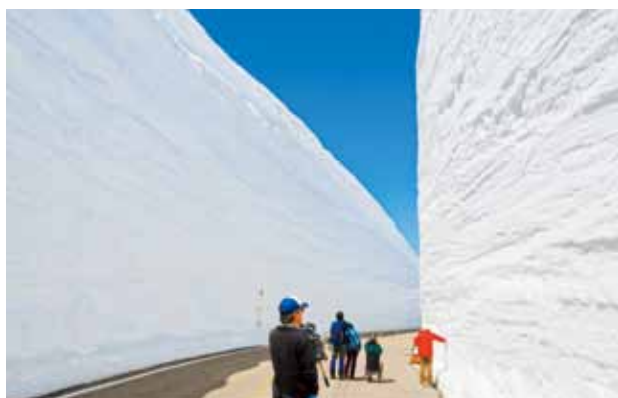
▲立山雪壁絕景每年吸引無數旅客前往。