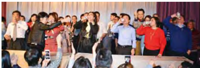
▲極具創意的喝啤酒接力賽，把氣氛炒熱到最高點。