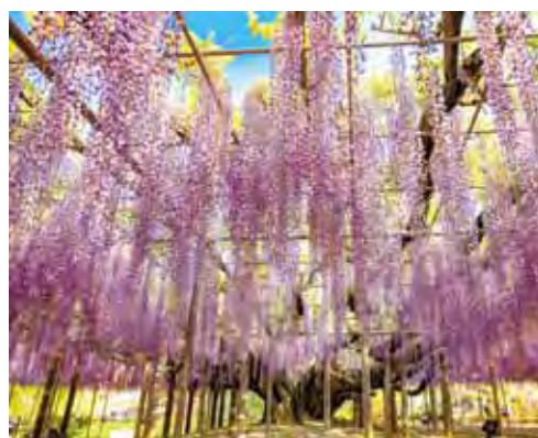
▲紫藤花是日本春季的一大「嬌」點。

傾力打造旅日最佳品牌的大榮旅遊，多年來憑藉著豐富的經驗與充沛的資源深耕日本旅遊市場，成功在日本市場占有一席之地。隨著即將到來的春天，大榮旅遊要帶領旅客前往日本人氣最高的旅遊目的地，迎接4月中的立山黑部開山，並結合賞花元素，感受春天的氣息。