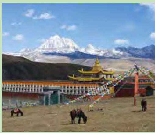
▲塔公草原四季草原四季景色截然不同，後方的雅拉雪山長年雲霧繚繞，能見到全貌是很幸運的。

塔公草原位於康定市塔公鎮境內，海拔3,730公尺的高原地帶，川藏公路穿境而過，是甘孜州最著名的草原。這條318國道風景秀麗，沿線的河流、草原、森林、山體、寺廟、藏房建築和濃郁的藏鄉風情構成特殊的藏族風情，「塔公」這兩字在藏文意謂「菩薩喜歡的地方」，四周是一望無際的高原風光，從塔公草原可以遠眺雅拉雪山，呈現花瓣簇擁的蓮花寶座形狀。雅拉雪山是康巴地區有名的大雪山。雅拉雪山海拔5,820米，山頂終年白雪皚皚，雲霧繚繞，能看見雅拉雪山的雪峰，是你的好福氣。雅拉雪山也是著名藏族史詩《格薩爾王傳》裡記載的藏區4大神山之一。