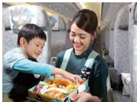
▲機上餐點也設計酷企鵝主題，吸引孩童目光。