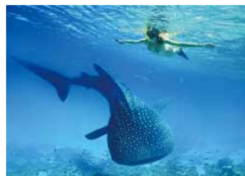
▲在歐斯陸與鯨鯊共游是難得的旅遊體驗。

歐斯陸與鯨鯊共游，入住市場少見的娜魯蘇安1島1飯店是「經典宿霧5日」的最大亮點，另外安排高空冒險2選1、市區觀光、前往奧蘭哥野生生物保護區等，受到旅客一致好評。