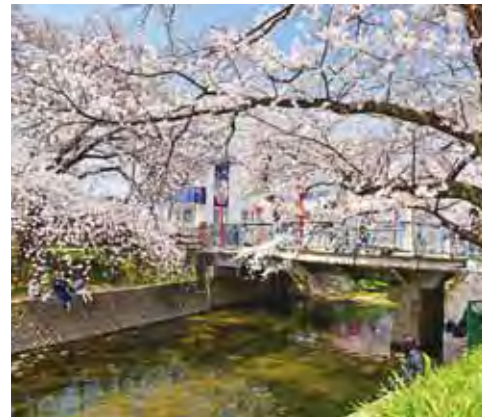
▲櫻花是春季限定的美景。

而住宿部份特別安排1晚蘆原溫泉，是福井縣首屈一指的溫泉地，擁有上百年的歷史，自古便受到許多文人雅仕喜愛，被稱為關西的奧座敷，意為關西的內廳，隨著溫泉熱氣蒸騰，傳遞日本溫泉文化。