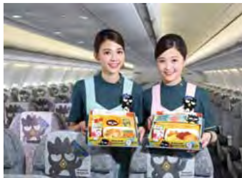
▲搭乘長榮航空酷企鵝「郊遊機」輕鬆前往首爾或福岡，感受東北亞迷人魅力。