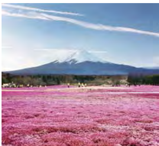
▲羊山芝櫻也能看到富士山景致。