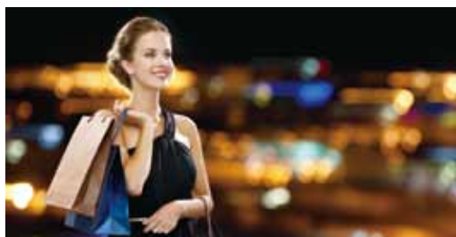
透過泰國所具備的多元魅力，為市場帶來更多精彩的操作選擇。

泰國以多彩多姿的節慶活動、夢幻迷人的自然景色，成為世界最受歡迎的旅遊目的地。為了吸引更多旅客拜訪優美的泰國，泰國觀光局更打出「Amazing Thailand」旅遊品牌，完美呈現出「驚艷泰國」魅力，同時透過文化、美食、藝術，訴說著每一個令人驚豔的故事，吸引全球旅客造訪。