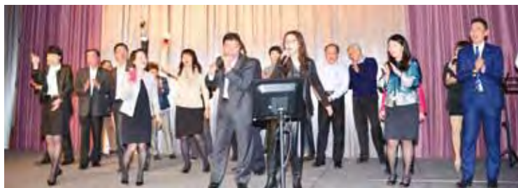
▲華航集團主管上台合唱《愛拚才會贏》和《感恩的心》，動人歌曲感謝同仁辛勞。

華航近幾年陸續引進全新B777及A350新機，不但進一步落實機隊年輕化，更展現「新世代」創新美學，全新的客艙設計，呈現東方生活美學和與眾不同的高雅品味，打造最為舒適的飛行體驗，深獲旅客喜愛。尤其今年初已運用A350新機直飛歐洲航點，另外全新14架A350-900 XWB客機，預計在2018年底陸續交付完畢，華航將持續鞏固市場領先地位。