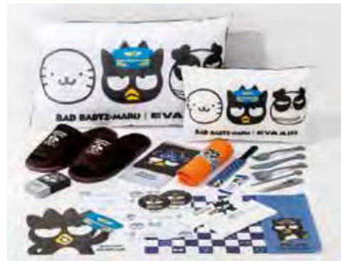
▲酷企鵝周邊商品，超級吸睛！

長榮航空彩繪機不斷的推陳出新，除了酷企鵝首度榮登國際航線的主角外，2017上半年將推出一系列全新的彩繪機，以滿足廣大粉絲及旅客的期待。欲知更多長榮航空彩繪機相關訊息，請至 http://evakitty.evaair.com/ 網站查詢。