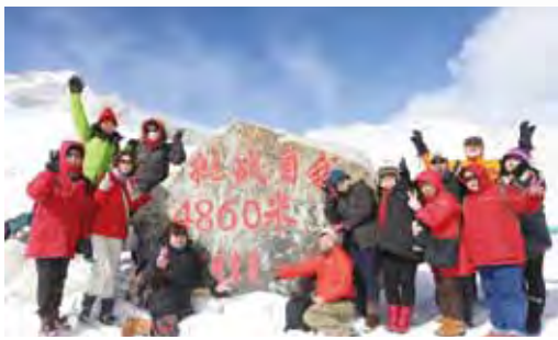
▲團員們開心的在海拔4860公尺高的達古冰川合影留念。

卓克基土司官寨、塔公草原、塔公寺、康定情歌景區 寺廟 品嚐正宗川味美食&藏族特殊飲食文化魅力無限