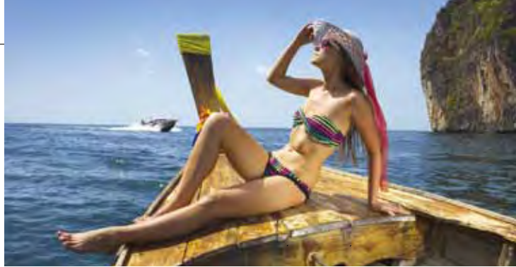
▲網紅盛行的年代，旅遊行銷也將變得更加多元新鮮。