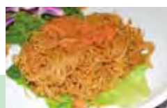
▲李家菜是老饕們極力推薦的澳門隱藏版美食。