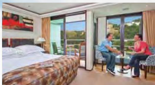
▲旅客可以在船艙內輕鬆享受美食、美景。