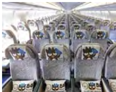
▲長榮航空最新「郊遊機」，讓愛耍帥的酷企鵝陪伴旅客度過難忘的飛行時光。