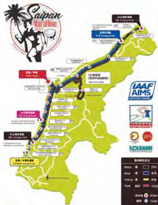
▲塞班島馬拉松地圖。

De Marianas領取參賽包。比賽出發地點在地點在美國紀念公園，50K和全馬將於凌晨4點正式開始；半馬於凌晨5點出發；10K於凌晨5:45。50K和全馬的比賽時限在上午8:30於Beach Road和Chalan Pale Arnoldn Rd 交叉口。報名表格可在位於海灘路的馬里亞納觀光局辦公室領取。在聖荷西或在馬里亞納觀光局官方網站活動日曆www.mymarianas.com。