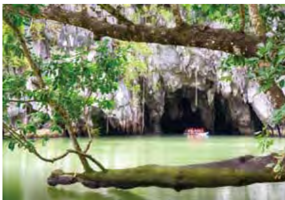
▲地底河流是遊巴拉望最不容錯過的景點。

「菲翔巴拉望5日」2人成行，3/31前報名付訂加贈菲律賓個別觀光簽證費用，市價1,200元，提高銷售誘因。行程規劃前往世遺—地底河流，