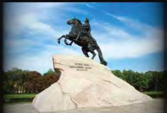
彼得大帝雕像 Peter the Great Statue