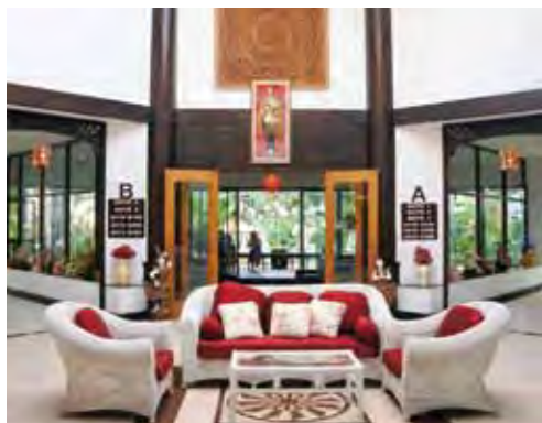
▲棕櫚灣度假村以時尚典雅的風格，吸引著世界各國旅客前往。