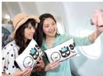
▲超可愛的酷企鵝靠枕，一秒擄獲粉絲的心。