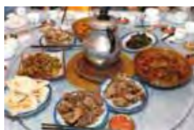
▶道地的藏族火鍋口味比較重，搭配的飲料是酥油茶與馬茶。

游，在古代稱為「巴蜀」，三國志中蜀漢的故事就發生在此，四川除了川菜、熊貓之外還有高原、雪山及藏族文化，是非常適合深度旅遊的地方，有句話說「蜀道難難上青天」早期許多人視為畏途，但也因為蜀道難，茶馬古道更令人悠然神往，如今四川道路規劃越來越完善，走蜀道上青天已經輕鬆許多。