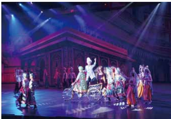
▲在芭達雅的金宮歌舞劇場，欣賞華麗精彩的人妖秀演出。