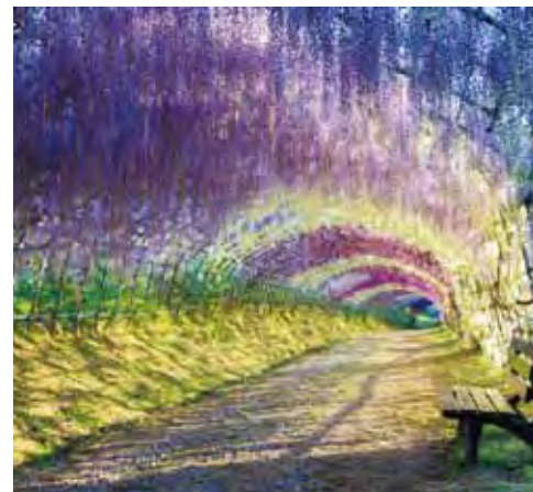
▲浪漫的紫藤花步道。

喜歡紫藤花的旅客，九州也是不錯的選擇，大興亦推出「豪斯登堡·御船山樂園·黑木大藤·湯布院·溫泉美食5日」產品，安排旅客前往吉祥寺、中山大藤、黑木大藤，漫步在浪漫的紫色藤花之中，相當夢幻。而喜歡泡溫泉賞花的旅客則可參考「九州古城～花見季節·尋幽賞櫻溫泉豪華5日」，一次飽覽別府扇山、水前寺成趣園、熊本城、菊池神社、西海橋公園等花見名所百選大賞。