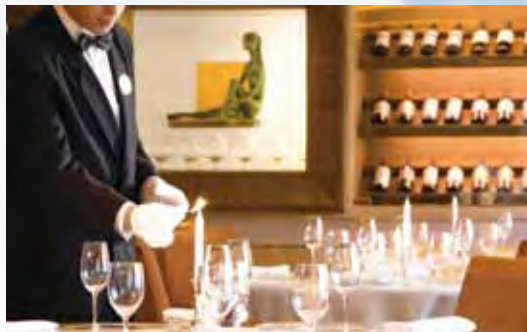
▲管家服務旅客高檔香檳酒。

航程包括了台灣旅客熟悉的宮古島，還有灑落在太平洋上的八重山諸島、沖繩中城。其中八重山群島是位於日本最南端的美麗群島。以石垣島為中心，離島散佈在世界上屈指可數的美麗珊瑚礁海域。中城則位於沖繩南部，其中中城公園是包含了世界遺產中城城跡在內的綜合公園，向東可以眺望中城灣。宮古島由隆起的珊瑚礁構成，全島地勢較低海水清澈，最適宜開展包括潛水在內的各項海上運動，海水的透明度極高，珊瑚礁和沙地所形成的不同大海色彩被稱為「宮古藍」。