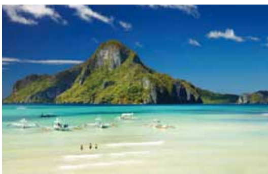
▲巴拉望愛妮島是菲律賓的人氣島嶼之一。

為了迎合各種客群需求，巴拉望推出多種產品路線，搭配市場唯一台北直飛巴拉望公主港的菲律賓航空，每週三、五出發早去晚回的定期航班，最推薦「巴拉望陸海空尊爵／精彩5