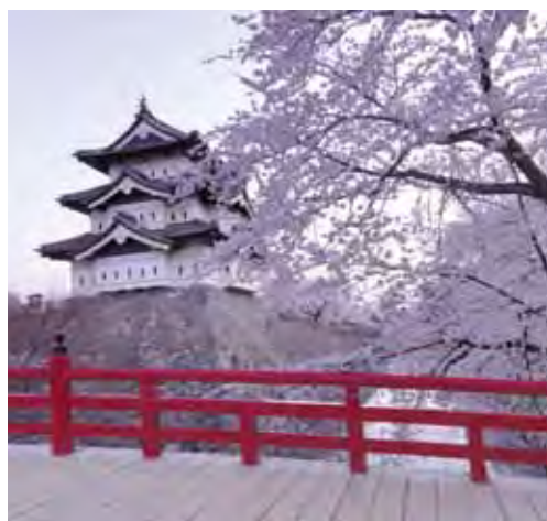
▲白色弘前城點綴著粉色的櫻花之美。