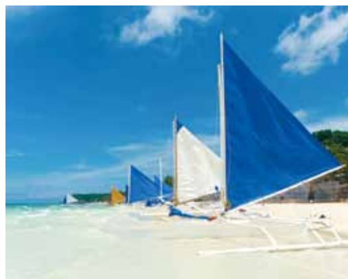
▲長灘島是亞洲前10大必去的海島之一。

「菲趣不可5日」是最受廣大旅客青睞的入門款行程，一舉涵蓋珊瑚礁浮潛、香蕉船、風帆船、沙灘按摩等體驗，並前往聖母礁岩、D' Mall等知名景點，特別安排麗晶酒店豪華自助晚餐增加產品質量。另外，針對高端旅客規劃的「菲你莫屬5日」，強調飯