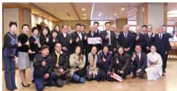
▲台中考察團成員與下呂溫泉業者合影。