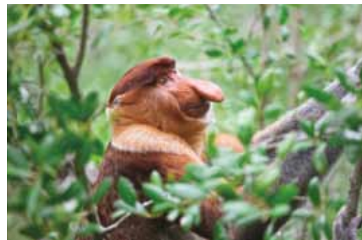
▲觀賞長鼻猴生態是沙巴旅遊最道地的體驗。