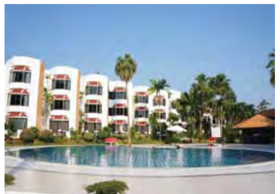
▲棕櫚灣度假村擁有戶外泳池，旅客擁有充裕時間能盡情享受。

看好泰國免簽證費延長至8月所帶來的話題與商機，由華泰旅遊、東南旅遊、喜鴻假期、春暉旅遊、品冠旅遊、鳳凰旅遊所組成的「金喜泰國PAK」，運用華航直飛曼谷班機，全新推出泰國曼谷、羅永、金莎美島和芭達雅之豐富行程，帶給同業今夏最佳銷售產品。