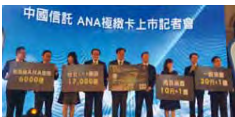
▲中國信託ANA極緻卡記者會正式亮相。

全日本空輸株式會社於台灣再新增發行聯名信用卡等級中最高等級的「中國信託ANA極緻卡／CTBC ANA JCB Eternity Card」，於2017／3／1正式發行。中國信託ANA極緻卡採用限量發行台灣第1張3D飛翔特殊卡面，新卡首刷額滿回饋最高ANA哩程6,000哩。上市期間優惠：台灣海外消費NT10元=1哩，台灣一般消費NT20元=1哩，搭乘ANA營運航班飛行哩程額外回饋50%；ANA機內購物除了購物9折還能享每100日圓再獲得加碼ANA哩程。（機內購物哩程+ANA Card Mile Plus 加碼哩程）。