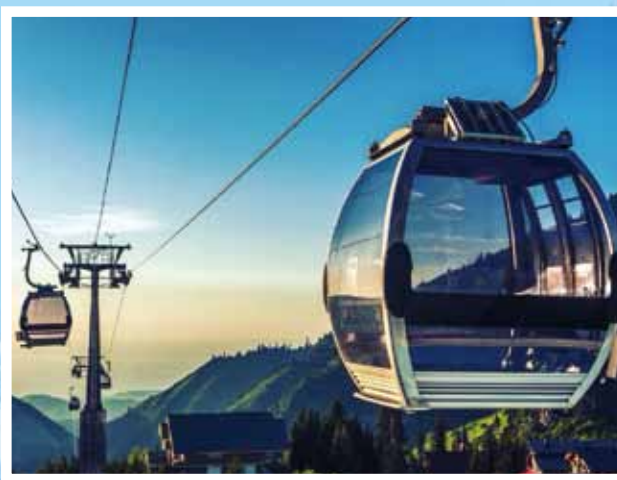
▲旅客可搭乘纜車眺望阿拉木圖山谷美景。

涵蓋潘菲洛夫公園、俄羅斯東正教堂，並安排旅客搭乘纜車到市區最高點—Kok Tobe山丘，俯瞰整個阿拉木圖市區風光，此外，亦有深度感受哈薩克民族的文化和美食的體驗，是行程中不容錯過的環節之一。