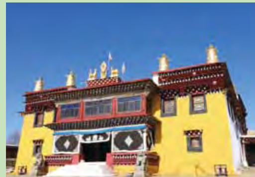
▲位於八美與塔公之間的惠遠寺因為有7世達賴喇嘛講經而聲名大噪。

7世達賴喇嘛格桑嘉措寢宮、11世達賴凱珠嘉措出生地—四川藏區唯一一座由清廷御賜修建，鼎鼎大名的惠遠寺，地處甘孜州道孚縣境內八美至丹巴山間小盆地內，海拔約3,500公尺，惠遠寺始建於西元1729年，藏語為「嘎達向巴林」。在雍正7年清政府因西藏局勢不穩而請7世達賴喇嘛格桑嘉措避難於此，特撥白銀，征地5百餘畝修建廟宇。此後，出生於惠遠寺附近甲窪絨群的11世達賴凱珠嘉措，成為第一位由中央政府選中的轉世靈童。惠遠寺四周群山如同八瓣蓮花，惠遠寺便坐落於這山間的「蓮花寶地」的中心，寺前有一條筆直的路通向寺門。寺門兩側為紅牆，108尊白塔嵌在紅牆上，有許多藏民會到這裡苦修參拜，惠遠寺後方也設有佛教學院，傳承藏傳佛教的教義。