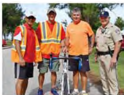
▲AIMS副總裁和IAAF亞洲太平洋賽程測量管理員Dave Cundy於2017/2/2到訪馬里亞納。