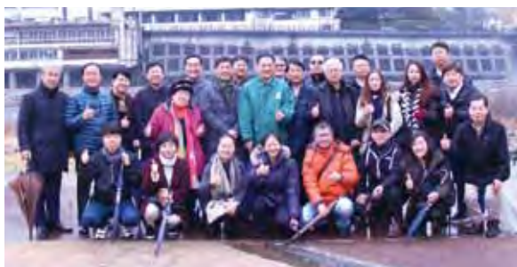
▲藉由簽約儀式，台、韓2團至下呂溫泉實地走訪景點。