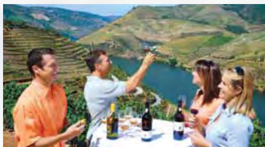
▲藉由河輪的便利性，愜意的在酒莊品嚐當地美酒。