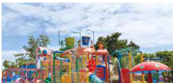
▲泰國觀光局將鎖定運動、家庭、仕女、遊學，以及獎勵旅遊等客群，