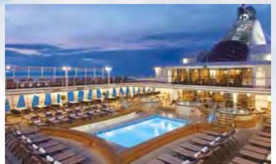
▲旅客可以在甲板上享受自我時光。

24小時送餐服務、與廚師討論設計菜單、整理行李、挑選合適的衛浴用品，提供9種不同功能的枕頭、提前擺放您喜歡的飲料，讓旅客在整趟行程中都能享受溺愛的感受。