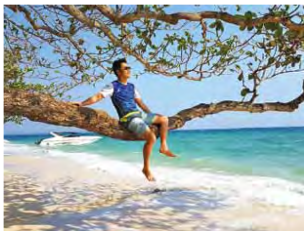
▲在金莎秘境島嶼的沙灘，享受悠閒發懶時刻。