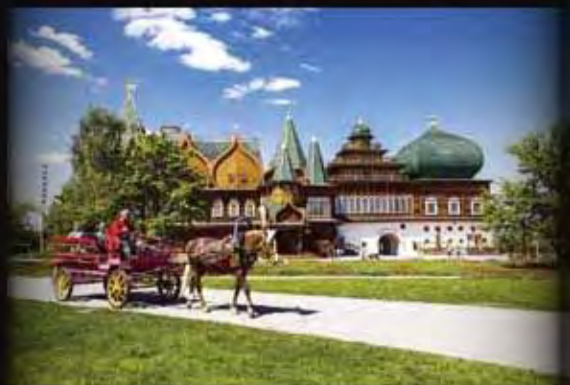
卡洛緬斯可也莊園 Kolomenskoye