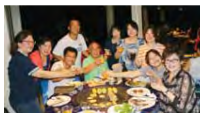
▲中區甲聯會會員品嘗BBQ烤肉大餐。