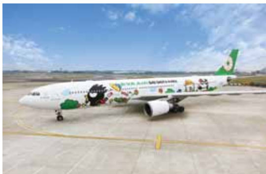
▲酷企鵝彩繪於A330-300機身，超級卡哇伊。