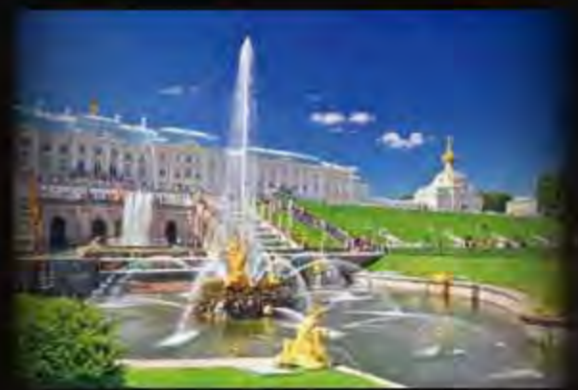
夏宮花園 Peterhof Palace