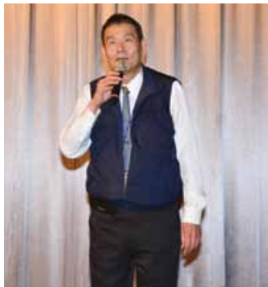
◀ 中華航空總經理謝世謙上台致詞勉勵同仁，展現好心情。

為答謝同仁一年來的辛勞，中華航空台北分公司於2/24假台北威斯汀六福皇宮舉辦春酒聯誼晚會，席開30桌，場面盛大熱鬧，當日貴賓包括中華航空總