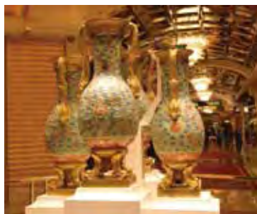
▲永利皇宮藝術珍藏~1套4件稀世中國清朝陶瓷花瓶—巴克勒公爵花瓶。