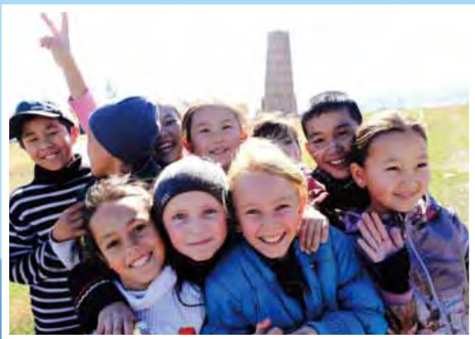
▲位居歐、亞、俄交界的哈薩克，糅合了種族、文化、宗教等特色。

李直掛 2.5小時內快速銜接 A330 30席商務艙迎合高端旅客需求的王國—哈薩克 天山子民—吉爾吉斯 帶您走入伊塞克湖詩畫仙境