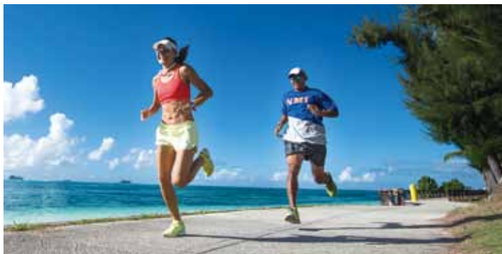
▲馬拉松跑者在海天一線的塞班島活力開跑。