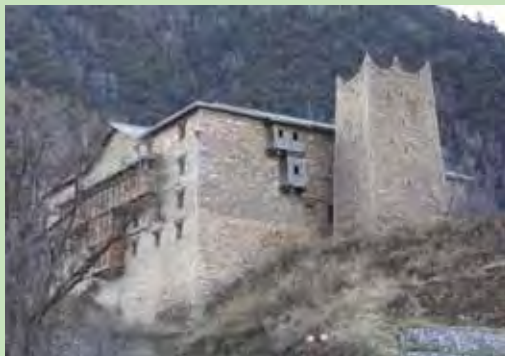
▲卓克基土司官寨樓高5層，寨內收藏多種。

位於馬爾康的卓克基土司官寨因為特殊的建築工法與時空背景被譽為東方建築史上的一顆明珠。卓克基土司官寨依山而建樓高5層，一進門可見到一座畫著大老虎的照壁，照壁左方是牢房區，沿著石階走進大門，整棟官寨中央是採光天井，四周的房舍依照階級分層，目前一樓以展示官寨歷史、當地文化為主，2樓展示紅色文化包括毛澤東的房間，3樓主要展示土司文化，包括土司居室、餐廳及管家房間等，四樓展示嘉絨文化，5樓展示宗教文化。看完官寨別急著離開，對面的西索民居同樣很精彩，西索民居有嘉絨藏民「壘石為居」的傳統建築特色，屋頂大多採用石板，牆面則是內直外收以石板堆疊再用黃泥混糯米漿黏合，這樣的房舍下寬上窄極為堅固，歷經幾次地震仍然屹立不倒。