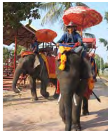
◀在泰倫風情園可以體驗騎大象繞園區一圈。