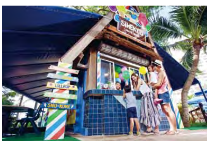
↑ PIC渡假村內最受小朋友歡迎的甜點屋Siheky's Snack Shack，提供各項甜品。 ← 擁有面積十幾公頃的PIC渡假村是關島最大的度假中心，計有777間各類型客房。