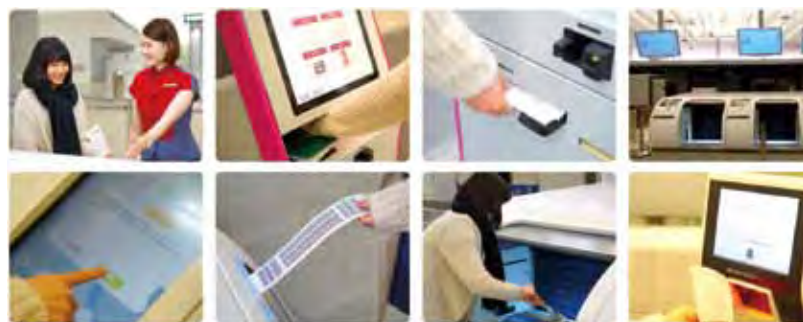
▲桃園機場捷運線正式通車後，可提前在台北車站A1站內辦理報到劃位、自助行李託運等手續。

桃園機場捷運線於3/2正式通車，為了提供旅客更便捷的服務，中華航空推出台北車站預辦登機服務。旅客可提早在台北車站（A1站）內辦理報到劃位、託運行李手續，輕鬆自在於市區觀光、購物、洽商後直接前往機場登機，不僅可減省在機場排隊等候的時間，亦可有效規劃及掌握行程，讓搭機旅途更加輕鬆便捷。