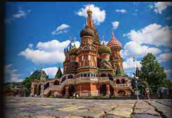
聖瓦西里教堂 St. Basil's Cathedral