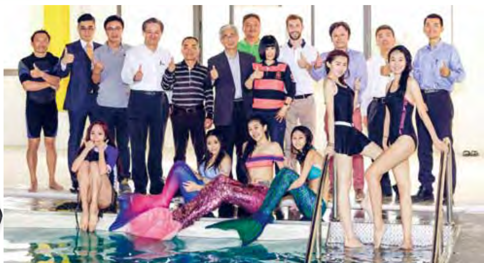
▲台中市觀光旅遊局特別與潛立方旅館合作，將於8月份攜手推出首屆的「亞洲美人魚節」。

說 到體驗式旅遊，在地方觀光推廣中，台中市觀光旅遊局局長陳盛山可說是將這類旅遊植入在城市觀光的佼佼者，不論是美食、自行車、溫泉、葡萄樹下野餐，或是讓銀髮族旅客到新社山區體驗3慢（慢活、慢遊、慢食），都成功創造話題。