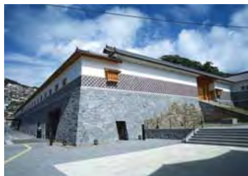
▲長崎歷史文化博物館前身是「長崎奉行所」，如同現今的檢察廳，為政府辦公處所。