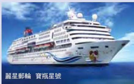
麗星郵輪 寶瓶星號

迎接2018年的到來，將有更多國際郵輪以彎靠和母港形式執航寶島台灣，包括3大國際郵輪航商—公主遊輪、麗星郵輪、歌詩達郵輪都將有更多以母港營運模式的艘次停靠台灣。其中，麗星郵輪5月以前全年度以基隆為母港營運的「寶瓶星號」和「處女星號」就有48個航次，公主遊輪「盛世公主號」、「太陽公主號」和「鑽石公主號」，至少上看52航次。