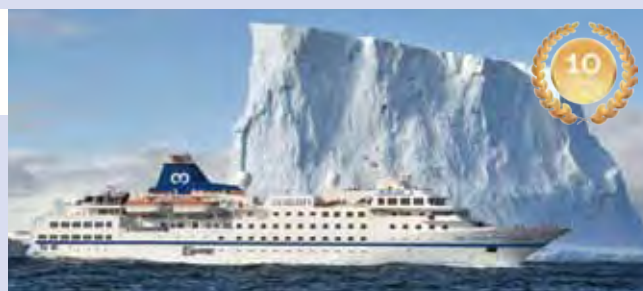
▲One Ocean Expeditions 羅斯福號。

行家旅遊執行長白中仁表示，行家旅遊於2016起獨家總代理One Ocean Expeditions極地探險船，將於2018年11月至隔年3月期間，提供近50個航次探訪極地風光。One Ocean Expeditions極地探險船目前有3種船型，分別為載客量百人以下的阿卡德米克·約夫費號（Akademik Ioffe）、知名旅遊達人Janet婚禮包船的阿卡德米克·瓦維洛夫號（Akademik Sergey Vavilov），以及載客量146人的羅斯福號（RCGS Resolute）。破冰能力高居1A等級，同時配有內部平衡系統，是安全度極高的頂級破冰船，除極高的客房比例及大量的專家學者隨船，由於乘客人數少，登岸時間長，岸上行程1價全包，旅客還可參加坊間少有的露營行程，可謂物超所值。行程選擇多元，包含10~12天的南極半島、14~16天的福克蘭島或南喬治亞島，以及16天以上南極全覽行程。針對自由行旅客，1月底前購買船票最高可享美金1,500元折扣，同業透過行家訂購再享豐厚退佣金，團客部分也有超值優惠。