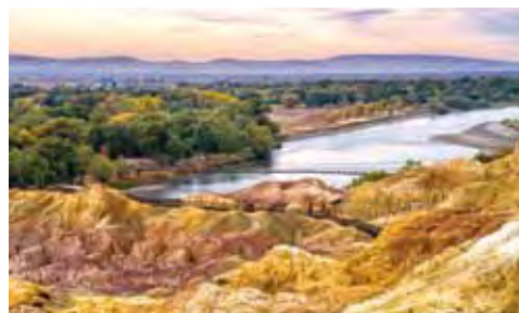
▲色彩繽紛的五彩灘是欣賞額爾齊斯河日落最佳位置。

最不能錯過的是昭蘇油菜花田，一望無際、隨地形起伏的金黃色地毯覆蓋的昭蘇草原上，壯闊而瑰麗，將帶給旅客全新的視覺衝擊。