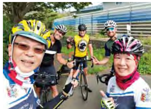
▲We come from Australia! 我們來自台灣!

「旅行的終點，是下一次的起點！」下一站要去哪？或許橫斷日本，或許橫斷美洲？經營旅行社，往往是在滿足客戶