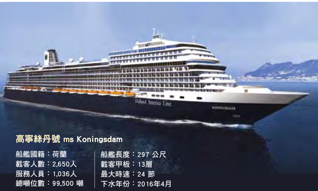
高寧絲丹號 ms Koningsdam

遊系列—越洋航程(橫越太平洋、大西洋) 3.極地熱,南極圓夢 ／溫哥華進出7夜、地中海10夜、北歐北角14夜、北歐冰島14夜