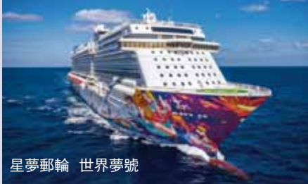
星夢郵輪 世界夢號