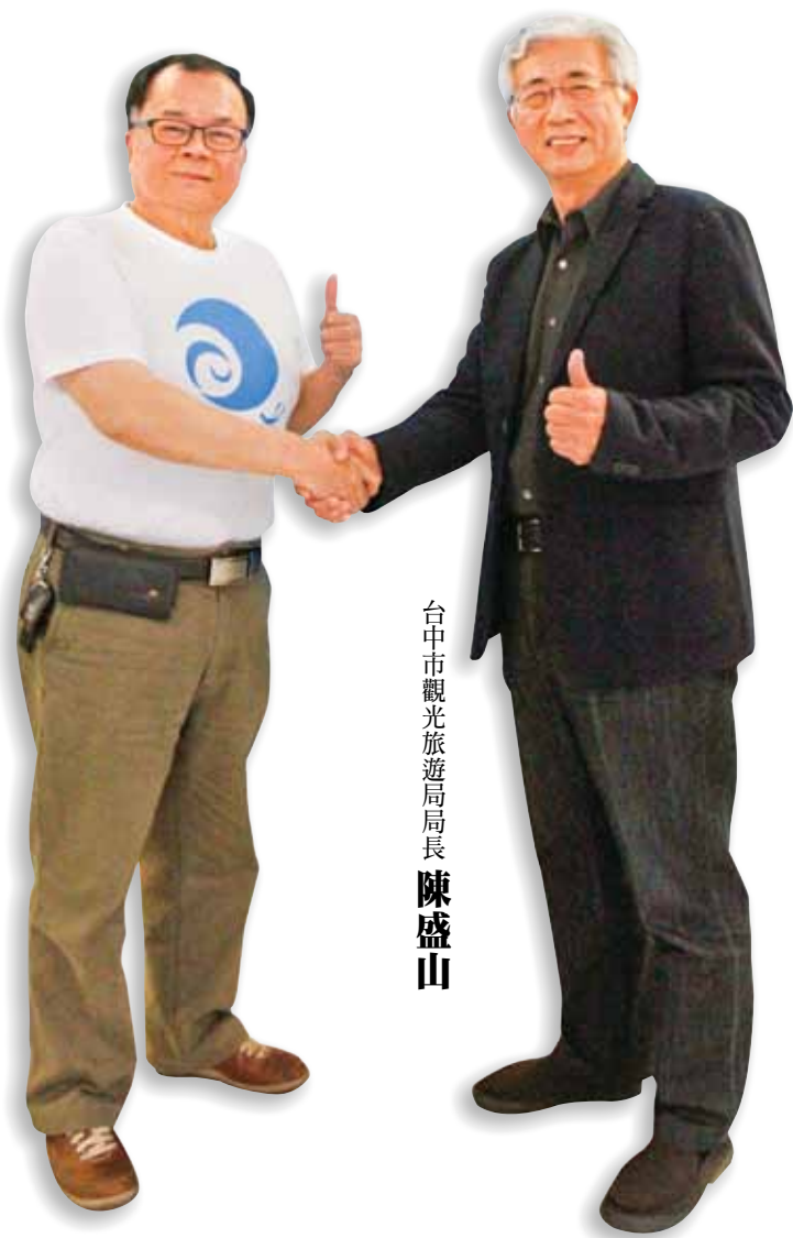
台中市觀光旅遊局局長 陳盛山