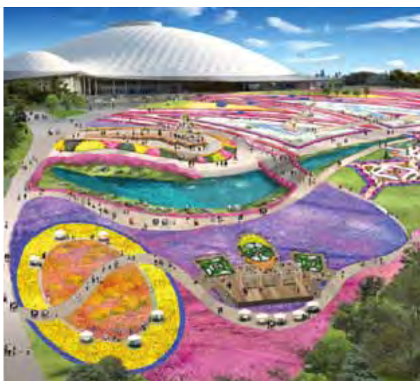
▲山口YUME花博以百萬花卉打造夢幻花毯。