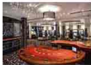
豐富娛樂 精彩不歇