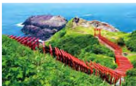
▲元乃隅稻成神社的123座紅色鳥居美景迷人。

此次大會也熱情招募熱愛自行車的台灣好手參加，為了讓自行車大會的參加者體驗更豐富的山口觀光魅力，向日遊顧問有限公司特別推薦包含10/7自行車大會的5天4夜套裝行程，利用福岡機場進出，搭乘新幹線只要45分鐘即可抵達山口，交通十分便利。行程走訪被CNN評選為日本最美31處風景之一的「元乃隅稻成神社」，以及規劃有31公里長自行車道的秋吉台，大會前的每日行程皆安排有騎乘路線，讓參加者徜徉在山口的自然美景，並適應環境為大會活動暖身。