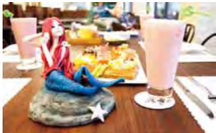
▲因應首屆的「亞洲美人魚節」舉辦，屆時也將推出美人魚套餐下午茶來抓住旅客目光。