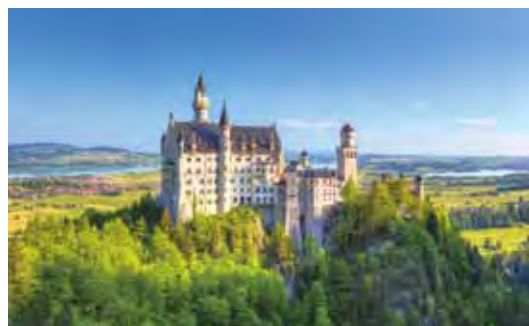
▲新天鵝堡一百多年來，以白牆藍頂的經典童話城堡的夢幻身姿，年復一年地吸引著參觀仰慕者。

世邦旅遊特別德瑞企劃，搭乘泰國航空蘇黎世進、法蘭克福晚班機出的路線，包裝「德國瑞士浪漫10天」，省去近800公里的拉車之苦！安排瑞士最精彩且神祕的登雪山之旅—彼拉特斯山、遊覽瑞士湖光山色搭乘著名景觀火車「黃金路線列車之旅」升等頭等艙！規劃南德必走3大路線及最古老的大學城古樸寧靜的小城—海德堡，展開萊茵河遊船浪漫之旅，悠閒欣賞沿岸風景；走訪咕咕鐘的發源地—蒂蒂湖及德國最美麗的山中夢幻城堡—新天鵝堡，入城堡參觀內部陳設，隨後搭乘馬車下山，享受難得的森林浴。同業價只要$74,900起！