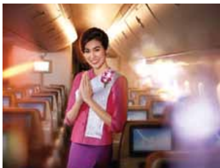
▲泰國航空以優質貼心的服務，深受台灣旅客喜愛。