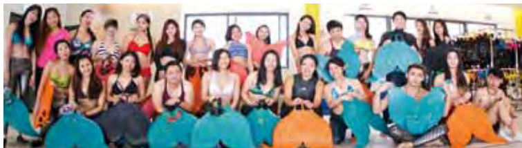
▲首屆的「亞洲美人魚節」將於潛立方旅館舉辦，屆時將吸引香港、義大利、新加坡、台灣等大專院校學生共同角逐參加。