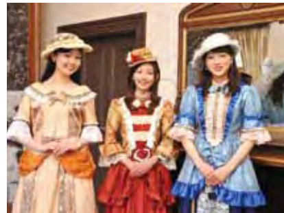
▲換上歐風宮廷禮服，在充滿西洋老建築的哥拉巴園拍照格外合適。