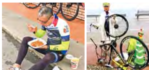
▲秉持著「關關難過，關關過」的精神，克服艱難。