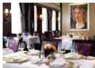
純正義式 美食饗宴