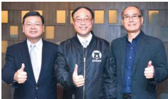
▲觀光局局長周永暉(中)、副局長張錫聰(左)、主任秘書林坤源(右)。

鐵路管理局等職務，觀光局是要讓國際看見台灣，讓台灣走向世界。回首2017年，透過穩紮穩打的模式，來台旅客已連續3年突破1,000萬；而放眼未來，觀光局與13個風景管理處將會更加接地氣，把台灣觀光推展出去。