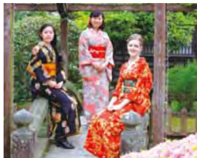
▲出島和服體驗快速換裝，還有多種體驗方案可選擇。