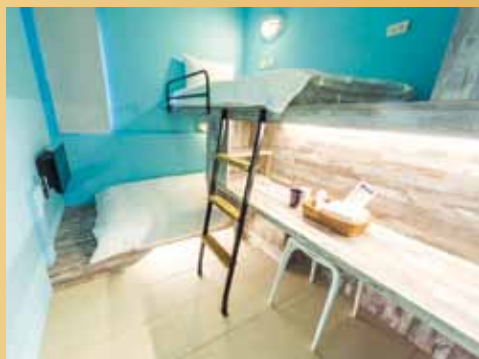
▲採用城市潛水概念的潛立方飯店，將大海搬到台中的大肚山山腳下，用安全、衛生、便捷的模式，提供一個全新的城市旅遊方式。