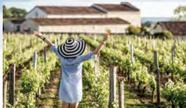
▲世界葡萄酒中心法國波爾多是品酒達人的黃金天堂。

第7天進入Sauternes地區品嚐久負盛名的Château Guiraud白葡萄酒甜蜜的滋味，或騎乘自行車前往梅特拉特堡品嚐Grand Cru Class莊園釀品。除此之外，也可以參觀由查理大帝創建的Roquetaillade城堡，或探索中世紀聖馬克西村，喜愛料理的旅客，也可以待在船上參加Culinaire法式美食大師烹飪班課程。第8天返回波爾多，與大廚到當地市集溜達採買，或騎自行車穿梭在波爾多歷史街區，一睹皇家之門與羅漢宮的壯觀。第9天專車返回波爾多機場，意猶未盡的旅客還可前往馬德里，參加3日的延伸行程。