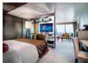
豪華艙房 優雅精緻