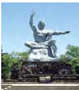
▲來到長崎原爆資料館還可順遊知名地標「和平紀念像」。