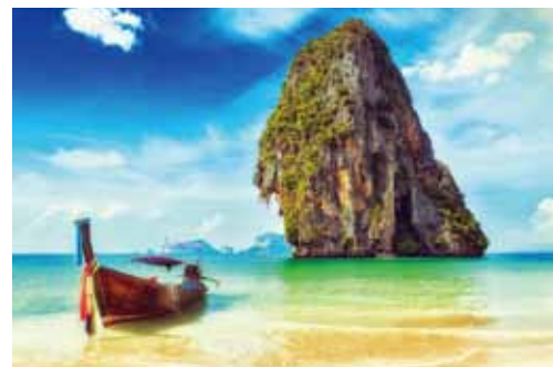
▲針對泰國國內線航點：普吉、清邁、喀比等航點，推出促銷票價11,000元起。

深 耕台灣市場多年的泰國航空，向來致力提供高品質及最便捷的飛行服務，在2017年底，泰國航空從原有每日2班的台北—曼谷，再新增TG633/TG632航班，每週6班，無論是早午晚皆可輕鬆出發；此外，為加大南部市場，泰國航空旗下子公司—泰國微笑航空Thai Smile也於2017年10月開航高雄—曼谷，每天1班，對台灣旅客而言，前往泰國度假旅遊或中轉至世界各地都將更加方便！