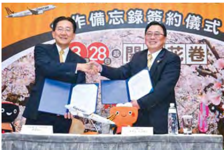
▲岩手縣知事達增拓也（左）與台灣虎航董事長張鴻鐘（右）簽署合作備忘錄後握手合影。

岩手縣知事達增拓也與台灣虎航董事長張鴻鐘於本月15日公開簽署合作備忘錄，期待能促進台灣與岩手縣兩地交流發展、以及盼望早日促成定期