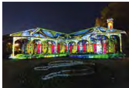
▲豪斯登堡光之王國in 哥拉巴園光雕秀，每晚18：30～21：00。

由豪斯登堡一手打造的光之王國3D立體光雕秀首次在世界遺產舊哥拉巴宅邸上演！即日起至3月底每晚都能欣賞。哥拉巴園及出島也有深受女性歡迎的變身體驗，一趟旅程中可享受和服與歐風宮廷禮服兩種變身樂趣（※費用另計）。