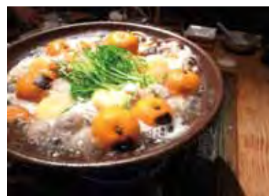
▲周防大島特產美食橘子火鍋。