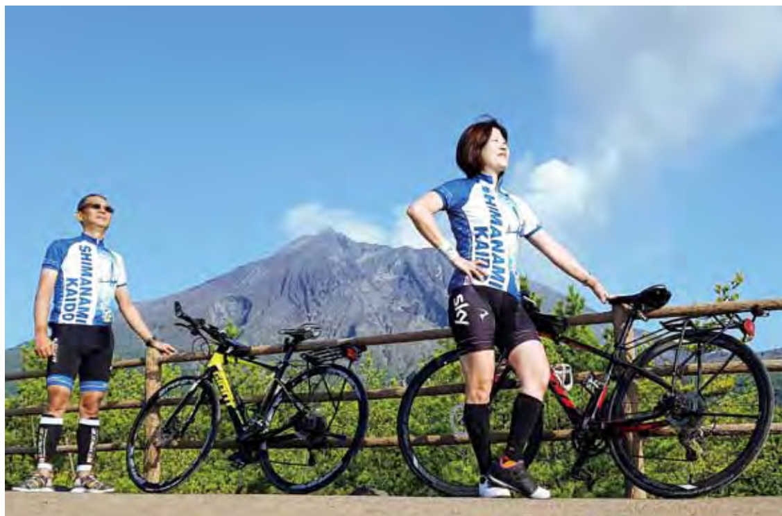
▲風雨過後，總有陽光，歷經千辛萬苦，終將品嚐甜美的果實。