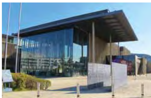
▲長崎縣美術館除了藝術鑑賞，館內還有輕食咖啡廳可小歇片刻。

長崎縣美術館由國際建築大師隈研吾設計，到此能購買長崎波佐見燒等特色伴手禮，憑周遊卷可免費參觀常態展區。長崎歷史文化博物館收藏長崎古往至今的對外貿易紀錄，而長崎原爆資料館則紀錄長崎原爆事件史實資料，能夠深入了解歷史文化淵源，為歷史必訪聖地。