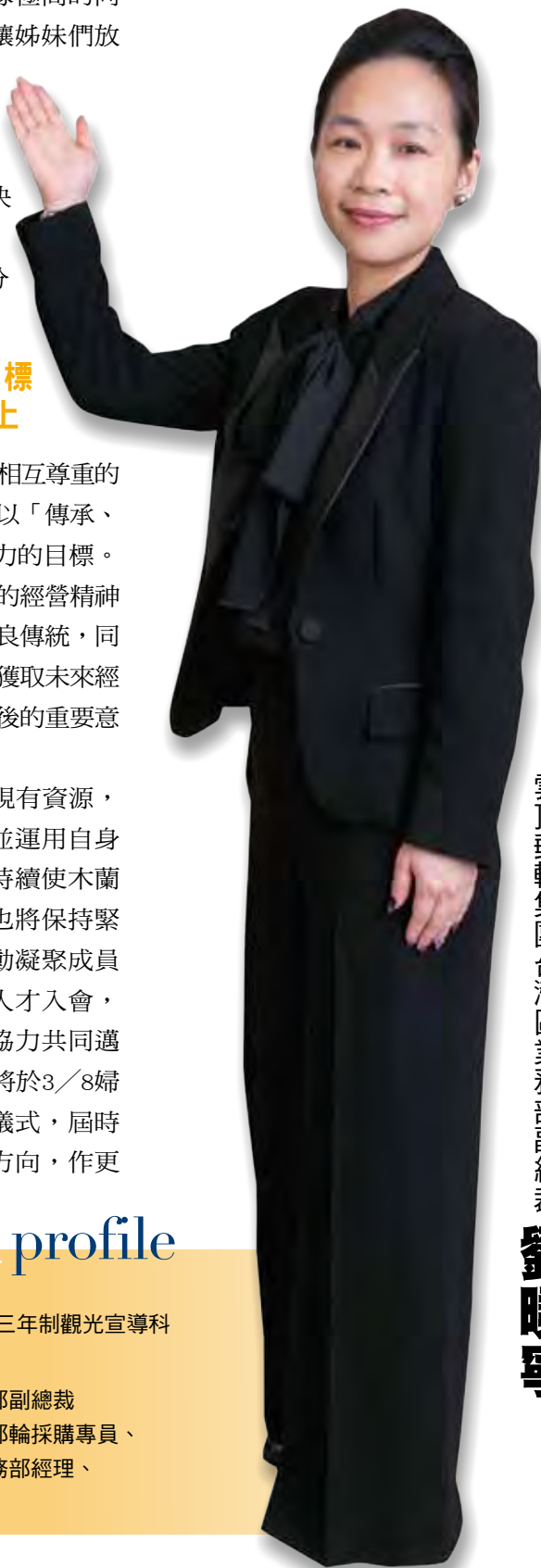
雲頂郵輪集團台灣區業務部副總裁

現任 雲頂郵輪集團台灣區業務部副總裁 曾任 西華飯店執行秘書、麗星郵輪採購專員、麗星郵輪登輪部經理、業務部經理、業務部助理副總裁