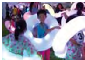
▲本次新增互動式夜間活動。

為迎接明治維新150週年紀念「山口未來維新」系列活動盛大展開，「山口YUME花博（第35屆全國都市綠化山口博覽會）」，將於9/14~11/4期間長達52日盛大舉行，預期將吸引50萬人來場參觀。會場位於山口市的山口KIRARA博紀念公園，分為歡迎區、花之谷區、庭園展示區、森林戶外野餐區、山之戶外遊樂區、海之戶外遊樂區、2050年的森林區、海之大草原區等8個特色區域。將以多達1,000萬株的山口之花，打造如夢似幻的花毯公園，其中更包含榮獲國際園藝博覽會金賞的山口縣原創花卉。此次更挑戰日本第一長的竹製飛車、日本第一高的鞦韆、日本第一長的鞦韆、日本第一寬廣的草皮廣場等諸多的「日本第一」，還有互動式發光泳圈「KIRARA RING」及1萬個發光的「夢之種子」等，是綠化博覽會初次正式舉辦的夜間項目。