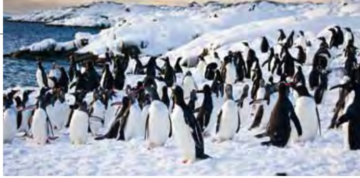
▲請問南極原住民企鵝大軍團，極地冰洋是什麼顏色？