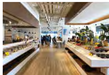
▲河畔餐廳可以品嚐到使用在地農作的料理，以及人氣的淡水小吃。

由新北市政府與財政部國有財產署合作開發，並於2019年9月正式開幕的公有土地招商案「滬尾藝文休閒園區」，是市府力推的「青春山海線」亮點之一，面對新冠肺炎疫情，2/26首度結合5家淡水在地美食商家，以聯合行銷、共榮共好的合作模式，將園區內河畔餐廳變身移動淡水老街，讓顧客在將捷金鬱金香酒店的河畔餐廳內一次吃到「淡水排隊美食」。