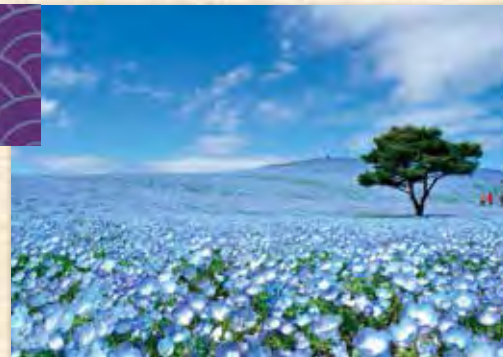
▲國營常陸海濱公園的藍色粉蝶花海，極致的藍色美景有如仙境。

除了笠間市絕美的杜鵑花與紫藤花，茨城縣非常有名的粉蝶花季也在4月中旬至5月上旬粉墨登場。粉蝶花原本只是花園中的配角，但茨城國營常陸海濱公園裡以驚人數量取勝的藍色小花，約450萬株遍佈山丘，無邊無垠，在眼際與藍天彼此交融，就像成千上萬隻美麗的蝴蝶繽紛地飛舞。畫面中除了澄淨的藍，幾乎看不到其他顏色，絕美景象有如仙境，每年到訪的賞花客更是滿山滿谷。