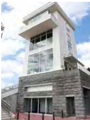
▲海拔約55公尺的海望館展望台，早晚各有不同風情。