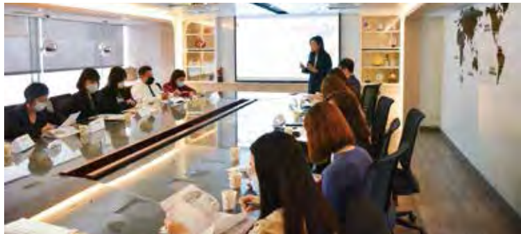
▲◀「IF聯合旅宿券」說明會吸引眾多飯店業者出席並聆聽。

受到疫情的影響，讓旅遊產業面臨到巨大的衝擊，而許多公司行號的預算執行辦法都暫停，包括傳統的團體旅遊都無法成行，更讓業者雪上加霜。為此，易福網特別攜手墨攻網路、靈知科技，三方共同推出「IF聯合旅宿券」合作方案，透過聯合全台各大星級飯店，製造更多住宿選擇，藉此來挖掘各大企業、上市櫃公司的福利預算，為市場創造更多銷售利基。