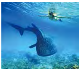
▲不少人指定來宿霧與鯨鯊共舞，獨一無二的體驗，市場詢問度相當高。