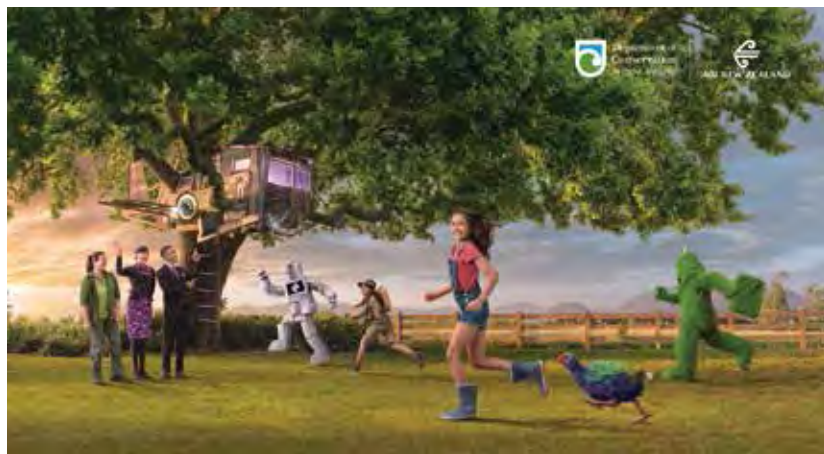
▲紐西蘭航空發布最新飛行安全宣導短片「A Journey to Safety一起安心啟航」。