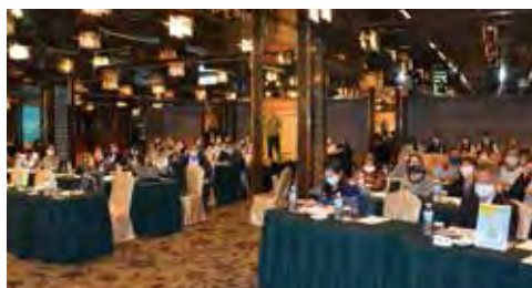
▲台北場說明會吸引眾多業者出席，仔細聆聽補助相關要點。

全球因為2019新型冠狀病毒(COVID-19)持續發燒，各國亦紛紛祭出「停航」、「禁止入境」等措施，也讓旅遊同業們面臨到大量的退團、退費等問題。為此，政府特別釋出疫情補助專案，旅行公會總會也在交通部觀光局委辦下，於3/16~3/27期間，分別於台北、新北、台中、高雄、台南、桃園、嘉義、花蓮、澎湖、金門等地進行12場「旅行業營運損失救濟補助宣導說明會」，讓業者了解因疫情導致旅客解約退費無法成行，觀光局提供補助行政作業費用之申請方法及注意事項。