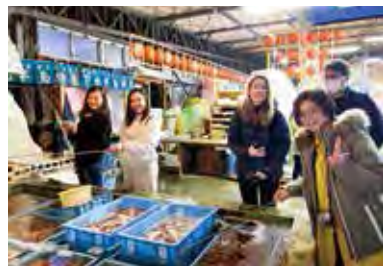
▲釣帆立貝體驗相當有趣，歡迎前來挑戰。

結合伴手禮中心與餐廳的複合式設施「Travel Plaza SUN・SHINE」不僅能品嚐到漁港新鮮直送的美味帆立貝，也能在此體驗釣帆立貝、試吃帆