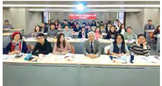
▲3/13「郵輪國外旅遊定型化契約及郵輪綜合保險」研習講座。