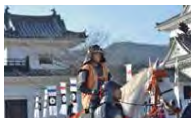
◀入住大洲城，感受非日常的城主體驗。

愛媛縣大洲市的大洲城是日本首個木造天守閣，自4/24開始遊客有機會當一日城主，體驗「城泊」魅力。入住時間為大洲城對外開放結束後的下午5點至隔日早上9點，主要規劃春、秋兩季入住，預計年間將有約30日開放體驗，每日限定1組，費用2人1晚100萬日圓（包含古城保存費），自1/20起開放預約。大洲城2004年根據被認為在江戶時代建造的天守雛形及明治時代拍攝的古老照片等史蹟為資料復原而成，是戰後首個被復原的木造天守，住客化身為城主加藤貞泰，體驗騎馬或坐禪等活動，也能欣賞鐵砲隊表演等，餐點部分則使用城主實際品嚐過的食材進行料理。