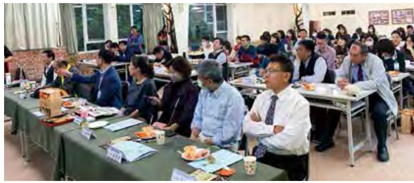
▲與會會員聚精會神聆聽相關業務報告與討論。

飲、零售、會展、商圈、夜市及傳統市場等5大內需服務業為對象，然全台各家觀光工廠亦受疫情嚴重衝擊，致團體客群幾近取消預約、一般散客人數驟減，觀光工廠協會於2/14召開會員大會的同時，除了日常會務及年度活動討論外，並交流各家業者如何進行防疫措施，包括體溫量測、自