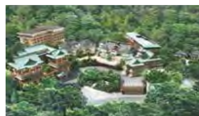
◀富士屋飯店全景示意圖。

神奈川縣箱根町的富士屋飯店歷經2年耐震補強工程，將在創業142年紀念日的7/15起重新營業，即日起開放電話及網路預約。本次整修不止強化建築構造，也強調復原其文化價值，擁有歇山頂式大片瓦葺屋頂、玄關為唐破風樣式等建築特色的本館，飯店前台將會恢復至1965年代前的位置，也復刻了景觀休憩大廳。1960年代打造的Forest Wing最上層新設置美容美體SPA，能邊欣賞箱根外輪山壯麗景色，邊享受箱根七湯之一的宮之下溫泉，客房則復刻為建造初期的模樣，營造令人放鬆的和風氛圍。新建的Cascade Wing最上層規劃成餐廳，復刻出1920年代舊宴會場「cascade room」。