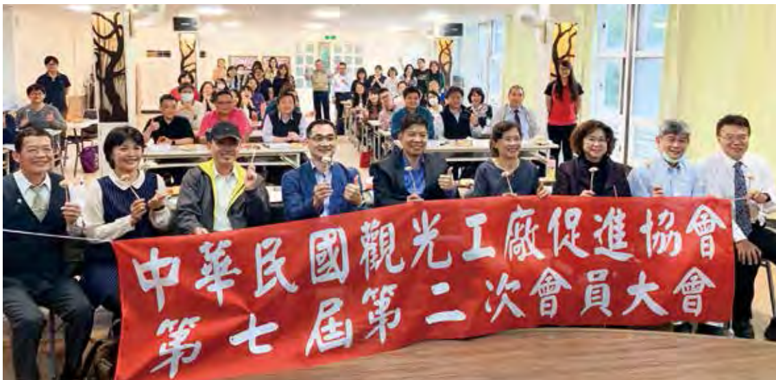
▲第7屆第2次會員大會活動圓滿成功。

觀光工廠產業多元，涵蓋5大類，分別為：藝術人文超歡樂、健康美麗超亮眼、醇酒美食超級讚、居家生活超幸福還有與生活息息相關的開門七件事。觀光工廠透過整體環境營造、實際互動與故事行銷，不僅強化民眾對品牌的識別度，使參觀民眾深入了解觀光工廠的企業文化與產業價值，也因各觀光工廠設廠地點不一，還能與各鄉鎮景點串成旅遊動線，期望在經濟部持續的推動與輔導之下，透過與觀光工廠協會交流，激發無限的合作模式，為觀光工廠的業者再次創造多贏商機。