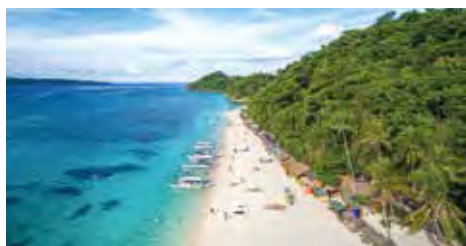
▲長灘島2人成行，促銷2萬5千元有找！

後也推出多樣化的機加酒自由行和MINI TOUR，價格一樣很超值！例如近幾年非常火紅的宿霧，透過長榮航空、星宇航空直飛，推出「超值宿霧鯨鯊共舞沙丁魚風暴」行程，直售價18,388元起，特別安排鯨鯊共舞、參觀資生堂島、宿霧市區觀光和一日自由活動，全程無進站購物，行程豐富又愜意。