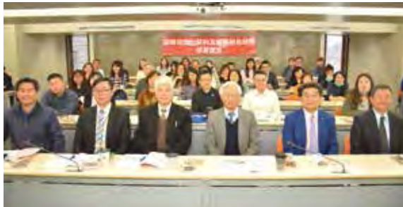
▲3/11「郵輪國外旅遊定型化契約及郵輪綜合保險」研習講座。