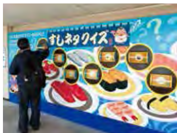
▲館內也規劃有餐廳、伴手禮中心、互動體驗區等，能安排半日暢遊。