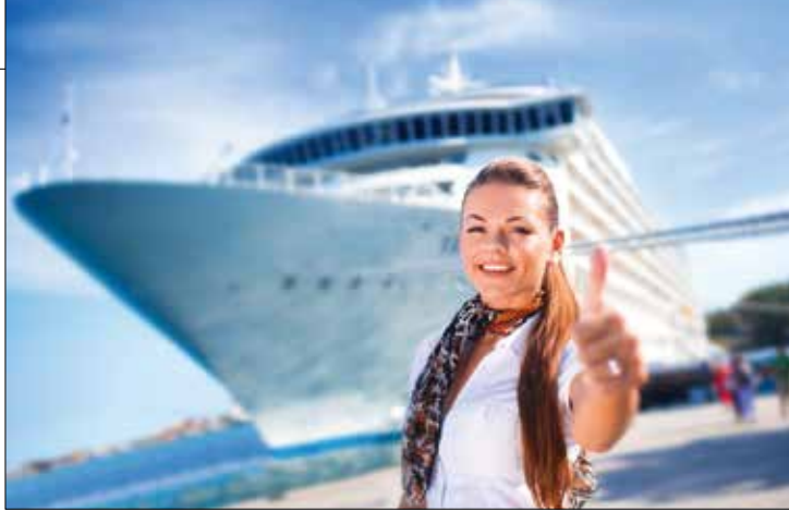
▲郵輪旅客大讚「好險有兆豐」！