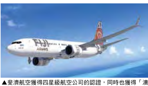
▲斐濟航空獲得四星級航空公司的認證，同時也獲得「澳洲及大洋洲最佳航空公司員工」的冠軍。

即日起，斐濟航空調整所有國際航線的經濟艙行李限額為30公斤。請參考詳細表列如下：