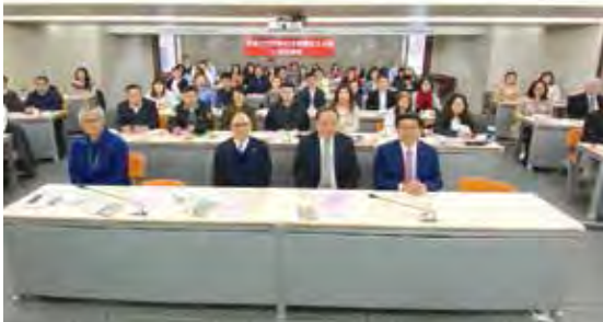
▲3/4「郵輪國外旅遊定型化契約及郵輪綜合保險」研習講座。