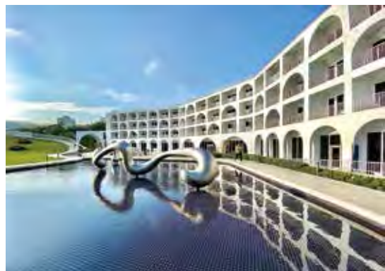
▲建築設計以淡水重要文化資產「滬尾砲臺」為藍圖，用拱形作為意象，打造融合在地特色的飯店。