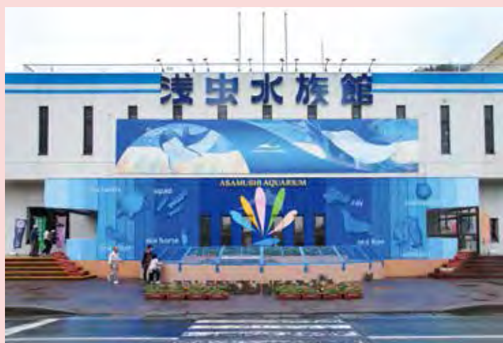
▲淺蟲水族館距離淺蟲溫泉車程只需5分鐘，相當適合安排順遊。

青森縣位於本州最北端，相隔津輕海峽與北海道對望，搭乘直飛班機前往約3.5小時就能直達，不僅蘋果魅力和弘前睡魔祭遠近馳名，更有十和田湖及奧入瀨溪流等自然絕景，長久以來深受旅行同業愛用，四季魅力無限。青森市東北方的淺蟲溫泉坐擁陸奧灣美景，還能串聯鄰近的水族館順遊，距離青森站車程只需30分鐘，也能搭青森鐵道前往，交通相當便捷；陸奧灣對側的陸奧市能夠體驗騎馬之外，也能欣賞津輕海峽和獨特的軍港風光，或是安排體驗釣帆立貝、品嚐美味的帆立貝料理、大間黑鮪魚等，擁有多元觀光及美食魅力的青森縣，歡迎同業多加利用與介紹。