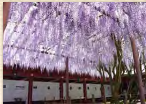
▲笠間稻荷神社5月時兩棵百年紫藤盛開，為神社增添浪漫春意。