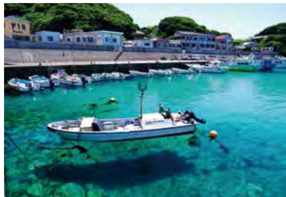
▲清澈海水使得船隻看起來彷彿飄在空中。

高知縣西南端的大月町鄰接宿毛市和土佐清水市，盛行漁業及水肺潛水等水上運動，近年來位於町內西南邊的「柏島」備受