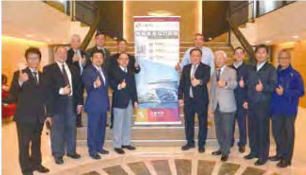
▲台灣國際郵輪協會（ICCT）與兆豐產物保險團隊合影。

「郵輪綜合保險」提升產業能量 以期未來郵輪商機再創輝煌年代 從業人員、郵輪航商從業人員 3梯次場場爆滿 受益良多