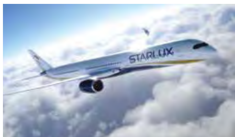
▲使用Sabre的全球分銷系統平台可以擴大星宇航空在全球的足跡。

台灣最新開業的星宇航空宣布與Sabre建立合作夥伴關係。在這個長期協議之下，星宇航空將可聯繫Sabre的全球分銷系統平台，使用Sabre龐大的全球旅遊市場聯繫全球超過425,000家旅遊代理，為旨在成為亞太及其他地區領先的豪華、全方位服務精品航空公司的星宇航空提供支援。星宇航空首席執行官Glenn Chai表示，星宇航空對未來的計劃非常具有野心，因此，選擇能支持我們業務目標的適當合作夥伴是至關重要的。