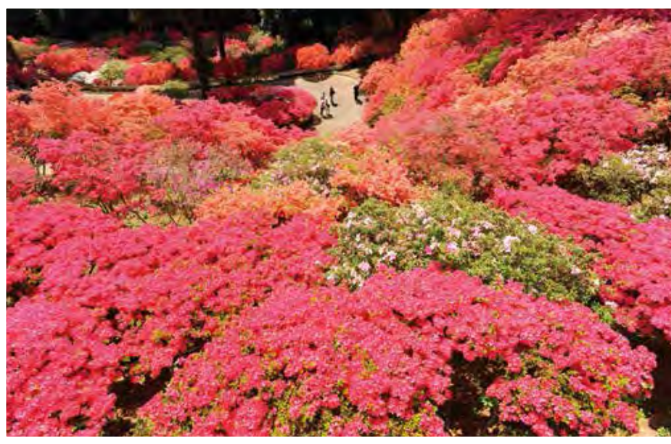
▲笠間杜鵑花節8500株的杜鵑花染紅山頭，壓倒性的美景一覽無遺。

每年4到5月的茨城縣笠間市百花爭鳴！4月中登場的「笠間杜鵑花節」，8,500株杜鵑花在山頭盛放，每年都吸引大批遊客朝聖。「笠間稻荷神社」院內兩棵巨大的紫藤也在5月滿開，為神社增添爛漫春意。而位於茨城「國營常陸海濱公園」450萬株的粉蝶花海更是連年火紅。春天的茨城就像一幅巨大畫布，繽紛的花朵們作為調色盤，為這座城市點綴輕柔優雅的顏色。笠間杜鵑花的豔紅、紫藤花的粉紫、國營常陸海濱公園粉蝶花的湛藍，一起感受茨城縣朝氣宜人的春天氣息吧！