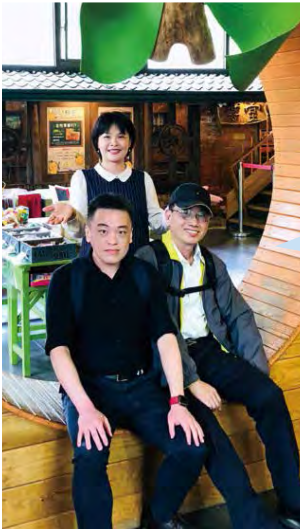
▲經濟部中部辦公室與工業技術研究院，積極推動跨域合作。

交流各家業者如何進行防疫措施 並鼓勵業者期間藉此進行 課程包括培養服務能力、打造餐飲力、伴手禮的認知與實踐、