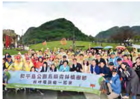
▲交通部觀光局局長周永暉（第1排右6）及超過150位貴賓合影。

交通部觀光局北海岸及觀音山國家風景區管理處於3/12植樹節當天在和平島公園舉辦歡慶植樹節暨防疫安全宣導活動，由交通部觀光局局長周永暉、立法委員蔡適應及超過150位貴賓一同種下台灣原生種毛柿、苦楝及厚葉石斑木，期待復育原始的島嶼林相。北觀處表示，和平島公園自納入轄區後，進一步完成漫遊廣場周邊整修，增加綠地面積及夏日水霧及噴水區，此次植樹活動為和平島公園增添綠意。