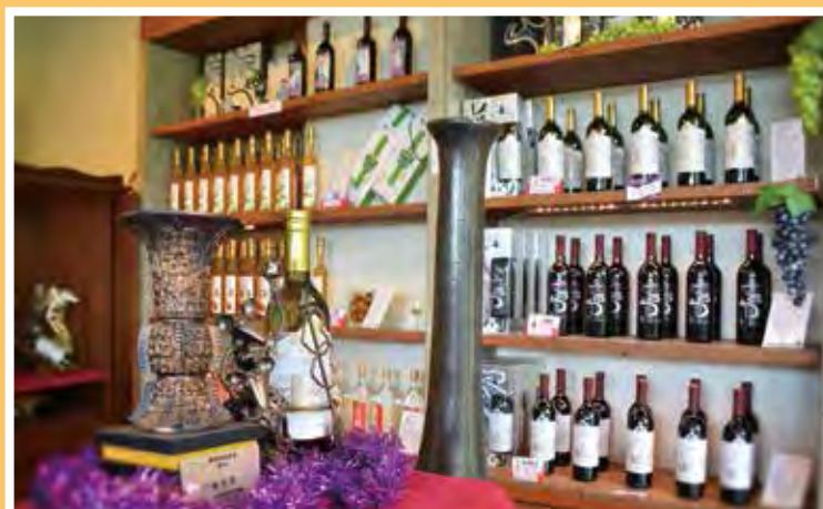
▲從農場跨足到釀酒，藏酒酒莊已經成功開發出各式各樣的酒、醋，以及週邊商品。