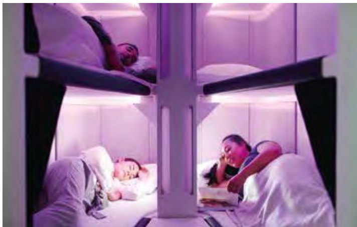
▲紐西蘭航空推出Economy Skynest原型，讓經濟艙的旅客也能享受靜謐的私人空間與全平躺的睡眠體驗。

總是不斷在進步時，又能帶來與眾不同驚喜的紐西蘭航空，近期同樣動作連連，不斷推出全新飛行安全宣導短片外，更推出經濟艙全新附加選擇—Economy Skynest，讓旅客只要踏上紐航的機艙，便能感受到全新的旅程感受。