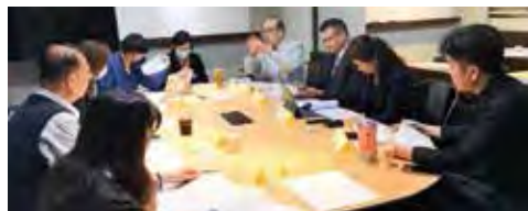
▲中華觀光人力資源暨資訊發展學會於3/9召開客戶關係專員會議，邀請各方專家一同熱烈討論。

觀光局委託中華觀光人力資源暨資訊發展學會辦理旅館職涯發展計畫，並於3月初召開旅宿電商操作人員及客戶關係專員2項職能基準初稿專家會議，會中產學專家就兩項職能基準初稿內容，進行熱烈討論，除依業界專家所指出實際狀況進行修正，同時納入學界專家在教育端的寶貴意見，期望未來建置完成得以提升企業生產力，達到勞資雙贏。