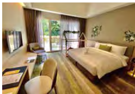
▲親子房設有小朋友專屬的臥床，還有充滿童趣的繪本，讓家庭度過一個愉快的假期。