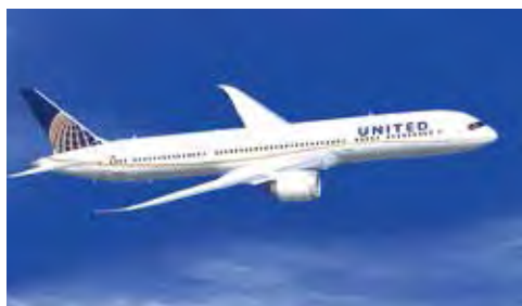
▲聯合航空所有機隊皆採用HEPA空氣清淨機進行空氣過濾。

因應全球新型冠狀病毒疫情影響，以及各國政府最新入境管制或禁止旅行的相關措施，全球旅遊需求減少，美國聯合航空宣布將於即日起至4/30期間，暫時停飛台北直飛舊金山航線。聯合航空台北分公司指出，若因政府限令，導致國際航班中斷或取消影響超過6小時，旅客可免費更改或保留機票價值至將來使用。該機票價值可抵用於將來任何航班、任何目的地。如旅客選擇退票，公司於開票日起12個月後，依原付款方式退還款項。