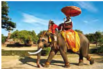
▲越來越多人選擇來到泰國度假輕旅行，一掃疫情苦悶及都市壓力。

旅客最安心又舒適的飛行體驗，並搭配4~5家泰國最新開幕、地理位置最優越的飯店，讓旅客自行挑選，探索泰國各大城小鎮暢行無阻。