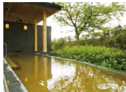
▲匯聚歷史、自然魅力的淺蟲溫泉。

淺蟲溫泉相傳起源於日本平安時代，由慈覺大師圓仁所發現，起初僅用來蒸麻以利織布，直至1190年圓光大師法然造訪此地，看見傷鹿用