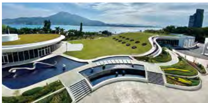
▲從飯店窗台可以眺望觀音山與淡水河交織的美景。