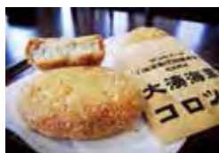
▲超人氣必吃美食「大湊海軍可樂餅」。

免費參觀的海望館展望台能遠眺充滿歷史風味的大湊市街、蘆崎灣外，由於此處是日本海上自衛隊基地之一，也有機會感受軍港風情，每天日落後至晚上9點半更會施行浪漫的夜間點燈；安渡館的設計風格以海軍大湊要港部廳舍為概念打造而成，無論外觀還是內部裝潢都飄散出濃厚的明治、大正時代風情，兼設餐廳、伴手禮中心和交流廳，能品嚐大湊海軍咖哩飯或是匯聚下北半島山珍海味的大湊海軍可樂餅等，也能購買海軍、海上自衛隊周邊商品。