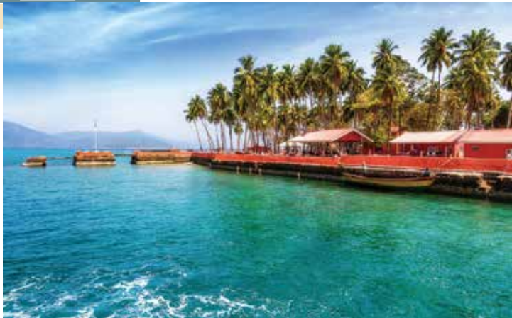
▲安達曼島位於孟加拉灣與緬甸海之間，景色非常夢幻。

安達曼群島分為3個大島，分別為北安達曼、中安達曼、南安達曼，以及周邊兩百多個小島，群島成長串型，自北而南排列，長467公里，最大城市為布萊爾港，要來到這夢幻秘境，可從印度清奈、新德里、加爾各答、布巴尼斯瓦爾等城市搭飛機前往位於布萊爾港的韋埃爾·薩瓦卡國際機場（The Veer Savarkar Airport），或是從清奈、加爾各答、維薩喀巴坦等地搭船前往布萊爾港，不過航程太久，較不太適合外國旅客。