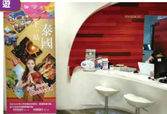
▲雄獅旅遊門市擺放「下一站, 泰國」的廣告。 ◀泰國觀光局台北辦事處處長邱杰(左6)及雄獅旅遊團隊合影。