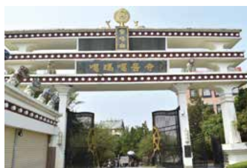
▲許多人不知道台南也有藏傳佛教寺廟—左鎮噶瑪噶居寺，有機會可走訪，體驗不同宗教文化。