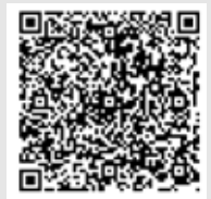
旅奇週刊官方網站

日本合作刊物：旬刊旅行新聞 Collaboration with JAPAN 讀者人的必讀 的業界專刊 月刊旅行新聞