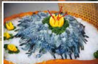
▲來到汶萊一定要品嚐看看美味可口的「藍蝦」。

另外，汶萊知名藝人吳尊所經營的麵包店—BAKE CULTURE，也是許多遊客特地朝聖、打卡的地點，這裡最熱賣的麵包有：鹹蛋黃流沙可頌、巧克力麵包、葡式蛋塔，還有多種甜點和餅乾，是購買伴手禮的好地方。