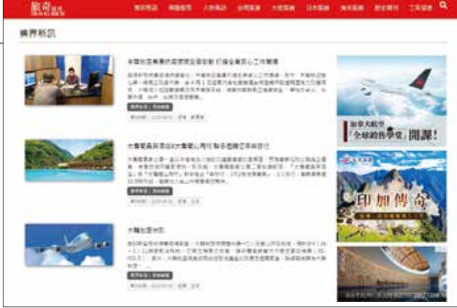
▲為了讓同業能掌握最新資訊，旅奇週刊採用即時更新的方式，將市場的最新動態呈現於官方網站中。