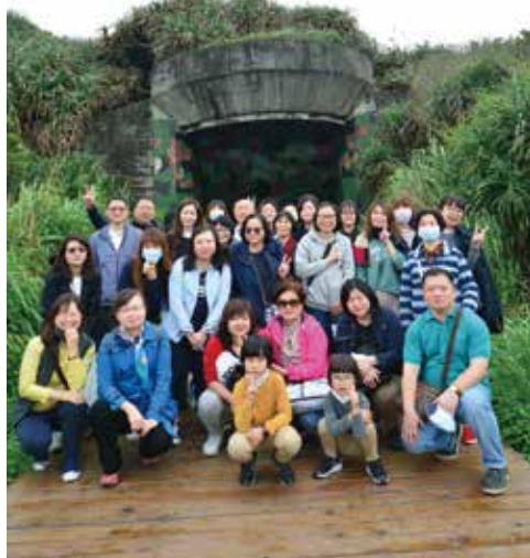
▲東南旅遊員工旅遊於四八高地戰備坑道合影。