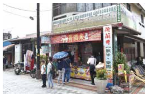
▲東南旅遊精選台南在地特色商鋪與景點，讓旅客新鮮感十足。