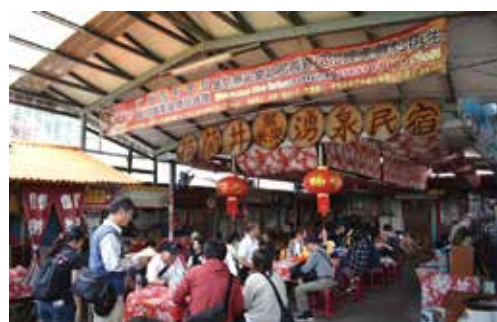
▲無米樂社區能充分體驗到台南在地文化特色與可口美食。