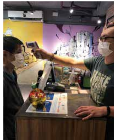
▲台北市推出6家防疫旅館，總計約為320間客房。

防疫旅館從旅客接待流程、餐飲服務、垃圾清運等都能依照市府完整清晰標準作業流程，提供檢疫旅客安全又安心的住宿環境，有效管控疫情蔓延，將與市府共同架構堅實完整之防疫體系。