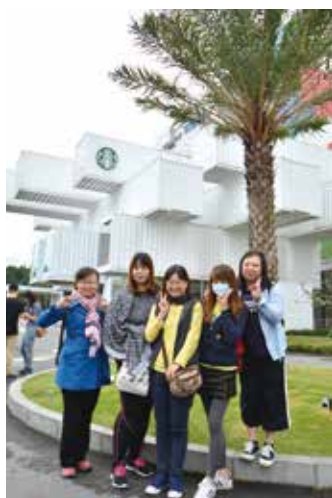
▲東南旅遊員工於花蓮貨櫃屋星巴克合影。