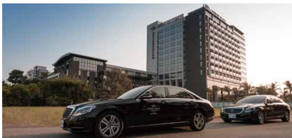
▲台南大員皇冠假日酒店為IHG洲際酒店集團在台灣唯一的皇冠假日酒店高端品牌。