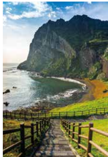
▲樺一旅行社行程多安排戶外行程，輕鬆探索濟州島的自然風光。

求，來進行客製化安排，例如不進購物站的行程，或是整組招待團、獎勵旅遊等，都可協助同業來操作，一起逆轉勝！