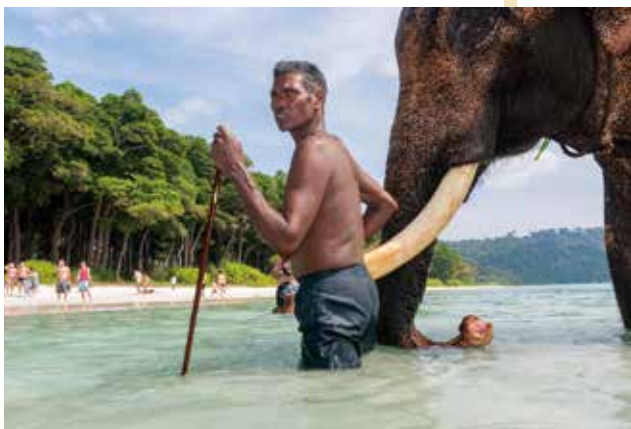
▲安達曼島上居住著孟加拉人和矮黑人，擁有獨特的島嶼文化。

安達曼群島樹木繁茂，動植物資源豐富多樣，根據統計，島上存在超過270種鳥類，還有長尾麝香貓、儒艮等稀有野生動物，並且當地設有96個野生動物保護區、9個國家公園和1個生物圈保護區，來到這，除了參觀這些動物