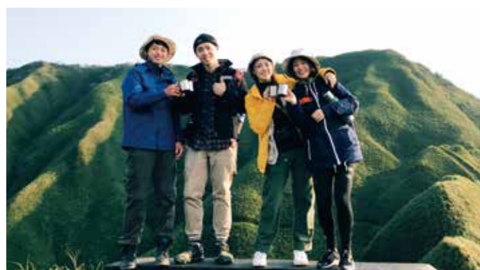
▲礁溪老爺主打攻頂明星抹茶山行程。

11家老爺盡出奇招、祭出前所未見的最強優惠，最低只要2,499元即可享受老爺級的旅宿體驗，專案期間從4/6~5/31止，即日起可透過各飯店官網或電話訂房。