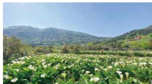
▲北投老爺推春遊賞花行程，鼓勵旅人戶外踏青。

位於台北市中山區的商務型飯店「老爺會館台北南西」、「台北林森」，首次祭出兩天一夜2,499元起的破盤價，訂房再