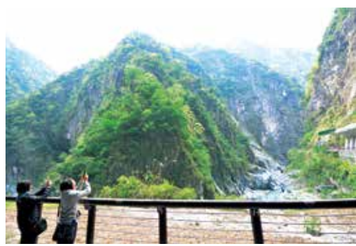
▲睽違6年的九曲洞美景重新開放，吸引旅客拍照打卡。

為進一步推廣國旅，東南旅遊在3月份舉辦多場花蓮和台南兩條線路行程，成功活絡地方觀光，獲得好評，尤其在這段期間，東南旅遊運用自有巴士車隊，做到最高規格的清潔與滅菌，