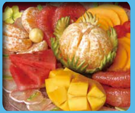
▲盛產鮮甜水果的大堡，讓無數饕客都垂涎不已。