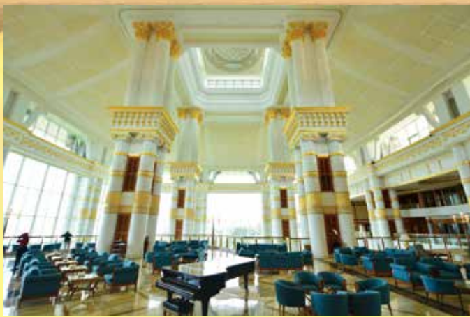
▲帝國酒店金碧輝煌、挑高設計，讓人備感尊榮。