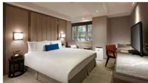
▲樂遊季住台北老爺3,990元起。