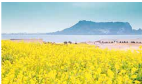
▲每年春季的濟州島百花齊放，宛如仙境，景色相當夢幻。

酒店—神話藍鼎一晚，再贈送酒店內早餐，讓旅客以超值價格出遊，還能享有頂級又舒適的住宿體驗，以及超豐盛的自助早餐，讓旅客全方位感受濟州魅力。