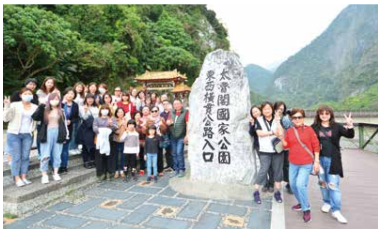
▲東南旅遊舉辦花蓮2天1夜行程，邀請員工及眷屬來大自然森呼吸。

東南旅遊為配合政府法令至4/30前禁止團體出國旅遊，便開始加大推廣國旅，陸續舉辦1日、2日遊的輕旅行活動，不僅吸引全台數百名東南員工報名，更貼心開放員工眷屬一起參加，同時國旅系列行程也開放民眾報名，獲得市場熱烈迴響。