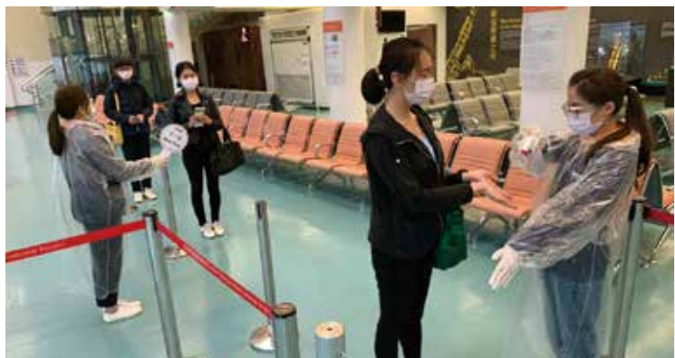
▲台灣虎航即日起率先推動「維持安全距離」，以提供旅客一個更安心的搭機環境。

為提升防疫層級，台灣虎航即日起率先推動「維持安全距離」，以提供旅客一個更安心的搭機環境。自3/29起，台灣虎航便已在機場櫃檯放置紅絨柱作為安全距離，且在地上標出定位點，供旅客參考適當間距，可和前、後旅客保持固定距離，藉此引導旅客以維持安全距離的方式進行報到手續。此外，4/1也將於機場櫃檯正式完成透明防護板的設置，報到櫃檯以僅開放單數號櫃檯的方式，拉開間隔距離，且每位旅客報到後，皆有專人用酒精進行消毒後，以減少人員近距離接觸及飛沫傳播，降低感染風險。