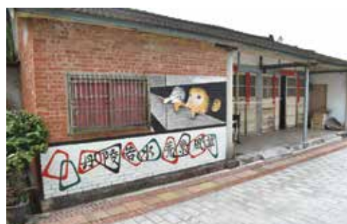
▲電視劇《俗女養成記》拍攝取景地—菁寮老街，是近年來人氣景點。