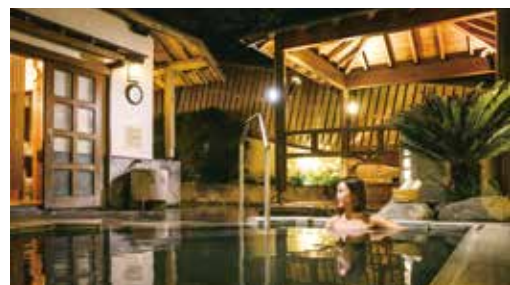
▲春遊到知本老爺泡湯，一泊一食4,599元起。