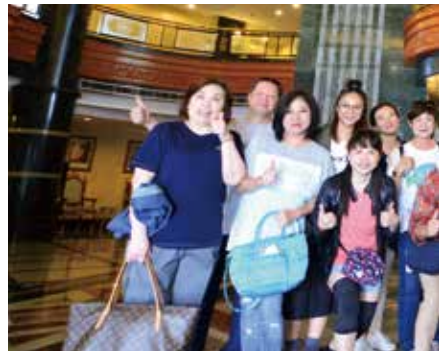
▲汶萊考察團考察飯店合影。