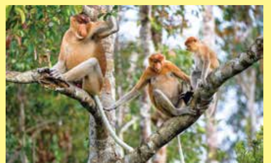
▲來到汶萊也能欣賞到野生長鼻猴，受到小朋友的喜愛。

在汶萊除了欣賞華麗的清真寺和穆斯林文化，還能安排「戶外自然之旅」，搭著小艇出遊，深入紅樹林和水椰林區，探訪婆羅洲特有的長鼻猴，因長鼻猴喜歡聚集在紅樹林和河畔森林，以群居為主，看到野生長鼻猴群的機率很高。行程中並搭船前往超過500年歷史的水上人家，別看建築外觀有些破破爛爛，但走進屋內卻「別有洞天」，室內裝潢華麗且乾淨，主人還會準備好當地特有點心來招待每位來訪的客人。