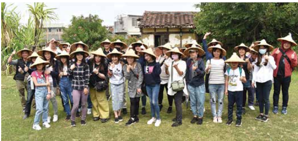
▲東南旅遊台南路線員工合影。

隊 做到最高規格清潔與消毒 讓大家出遊玩得開心又放心 大國旅行程 陸續推出太平山、阿里山、南投等多款行程