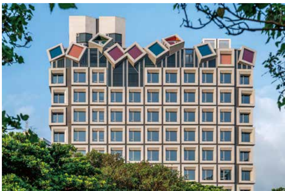
▲老爺酒店集團11家飯店推出《老爺樂遊季Royal Festival》全新企劃，讓國人留在台灣重遊舊地也能玩出新花樣！

樂遊全台11家老爺2,499元起 輕鬆抓住旅客目光 解悶大補帖：登明星抹茶山、城遊尋寶、戶外散策