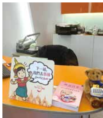
▲百威旅遊門市桌上擺放Q版泰國風格卡通廣告，讓大小朋友都覺得相當有趣。