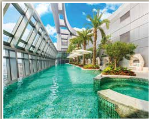
▲板橋凱撒大飯店32樓無邊際泳池。