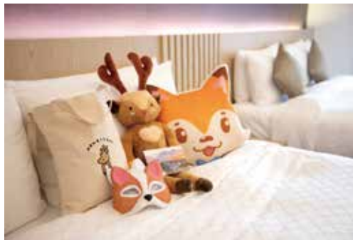
▲瞄準清明連假商機，宜蘭綠舞觀光飯店首度與在地人氣景點「斑比山丘」合作，推出優惠專案吸引目光。

坐落於宜蘭五結鄉，鄰近蘭陽溪、宜蘭河與冬山河的綠舞觀光飯店，為全台唯一日式主題庭園飯店，園區內經典浴衣、抹茶體驗、忍者體驗營等豐富主題活動。