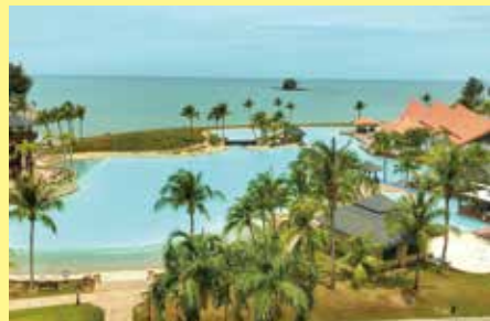
▲帝國酒店設有5個游泳池，讓每位住客都能享受到完美的海島假期。