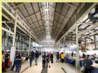
▲加東夜市是汶萊最大的美食市集，能嚐到最正宗、美味的小吃。