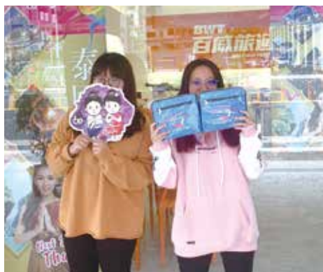
▲百威旅遊門市同仁拿著泰國amazing bag與打卡板，帶動買氣。