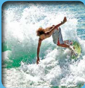
灣組織 (The Most Beautiful Bays in the

Balete 三海灣入列 嬉遊珊瑚海、潔白沙灘、潛水地NO.1 優美自然風光成最佳誘因 邀您走進總統故鄉感受亮麗風景線