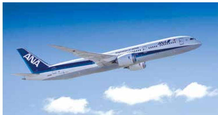
▲ANA再次榮獲SKYTRAX評選「5星級航空公司」。

憑藉著優異的服務與不斷挑戰自我的創新理念，讓ANA再次榮獲英國世界評級機構SKYTRAX的肯定，評選為World Airlines Star Ratings最高榮譽—「5星級航空公司」，而隨著此次的再度獲獎，讓ANA達成自2013年起連續8年獲得最高榮譽5星評價的里程碑。