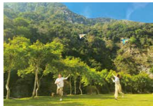
▲太魯閣晶英酒店與太魯閣山月村聯手推出『森旅行·3天2夜住房專案』，讓旅客前進國家公園度假。

太魯閣國家公園一直以來皆為旅人造訪花蓮最喜愛的風景區，而隨著蘇花改公路完工通車，自駕悠遊花蓮更便利。即日起，太魯閣國家公園二家秘境飯店—『太魯閣晶英酒店』與『太魯閣山月村』聯手推出『森旅行·3天2夜住房專案』，2人成行，專案優惠價10,999元起，邀請旅人在山林裡享受悠閒時光，自駕隨興走訪鄰近步道景點，享受峽谷裡清新的自然風。