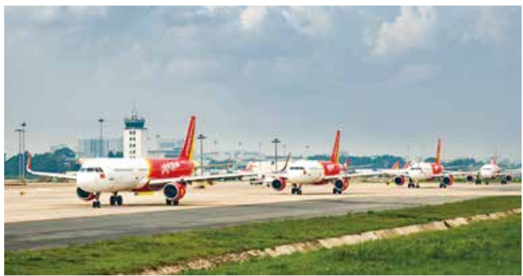
▲越捷航空祭出「SKY COVID CARE」安心保險方案。

越捷航空祭出「SKY COVID CARE」安心保險方案，凡於2020/3/23~6/30搭乘越捷航空國內航班之旅客，若於起飛日30天內確診感染新型冠狀病毒COVID-19，不論感染源頭，皆可向越捷航空申請越南盾2千萬（約新台幣2萬5千元）至最高越南盾2億（約新台幣25萬）的保險補助。越捷航空將會投入數百億越南盾來支持「SKY COVID CARE」安心保險方案；同時，越捷以年輕現代機隊及專業的空服員提供安全的飛航服務，其所有乘客及空服員將接受最完善的防疫措施，以確保旅客能安心享受飛航。