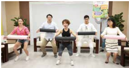
▲基隆市長林右昌（左2）與藝人們一起為基隆市運動i台灣的運動三部曲揭開序幕。

基隆市運動i台灣計畫今年再推出運動愛基隆三部曲，科技、觀光、明星尬運動，全年無休陪您一起來運動。