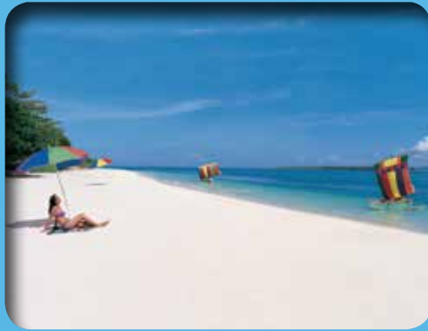
▲大堡優美的海景，是成功吸引旅客到訪的最佳誘因。