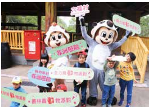
▲六福村最新一季「動物派對」準備開趴。

六福村最新一季「動物派對」準備開趴，4月起至5/31即將熱鬧登場，園區裡的動物明星們元氣滿滿，準備和大小朋友一起歡度假期。