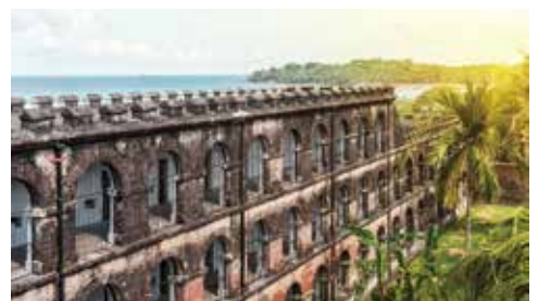
▲蜂窩監獄國家紀念館建於1896年，當年的大型監獄如今已成為來到這必訪的展覽館和網美打卡點。