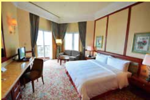
▲帝國酒店內客房古典優雅，採光良好，非常適合度假。