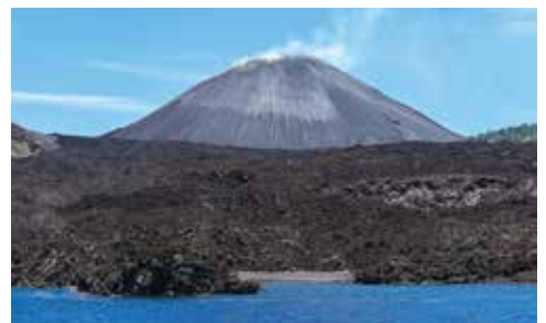
▲巴倫島（Barren）巨大的火山外觀，讓人想一探究竟。

不僅如此，還可前往安達曼南部和中部之間巴拉丹島（Baratang）可展開石灰岩溶洞之旅；或是擁有美麗白沙灘、蔚藍清澈大海，以及原始野生叢林的斯瓦拉傑島（Swaraj），距離布萊爾港約39公里，是不可錯過的夢幻景點；或前往巴倫島（Barren），這是印度難得一見的活躍火山島嶼，有著巨大且驚人的火山外觀，旅客可在船上從海面上觀看感受，無法登島。安達曼旅遊資源豐富，相當適合旅客一探究竟。