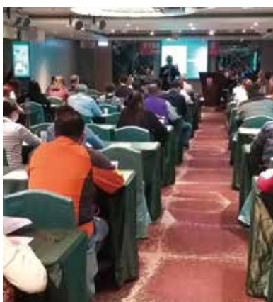
▲台北最終場吸引眾多旅行業者參加。

因為2019新型冠狀病毒（COVID-19）持續發燒，造成觀光產業動盪，政府特別釋出疫情補助專案，旅行公會總會也在交通部觀光局委辦下，於3/16~3/27期間，分別於台北、新北、台中、高雄、台南、桃園、嘉義、花蓮、澎湖、金門等地進行12場「旅行業營運損失救濟補