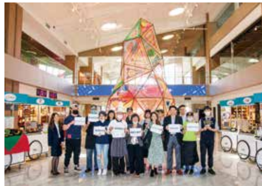
▲新北淡水「滬尾藝文休閒園區」推出一系列優惠活動，讓民眾能來趟親近自然的舒適安心之旅。

近期受疫情影響，不少民眾取消出國計畫改為國內旅遊，為迎接清明連假出遊及母親節感恩月，即日起至6/30止，結合餐飲及住房專案貼心推出一系列優惠活動，讓民眾能來趟親近自然的舒適安心之旅。