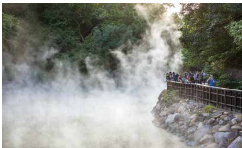
▲水美溫泉會館特別推出「水美小旅行三部曲」，用溫泉來增加自身免疫力，跟疫情說再見。