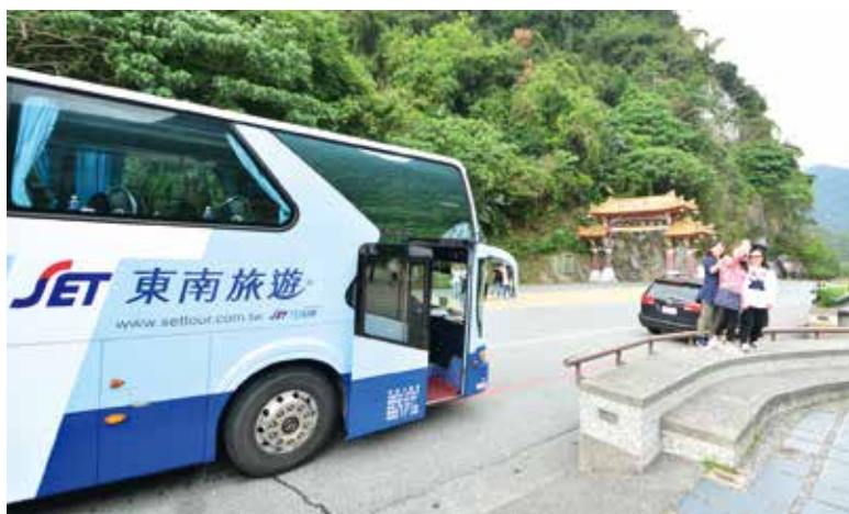
▲東南旅遊特別安排賓士遊覽車，讓員工也能體驗到最高檔、優質的出遊體驗。