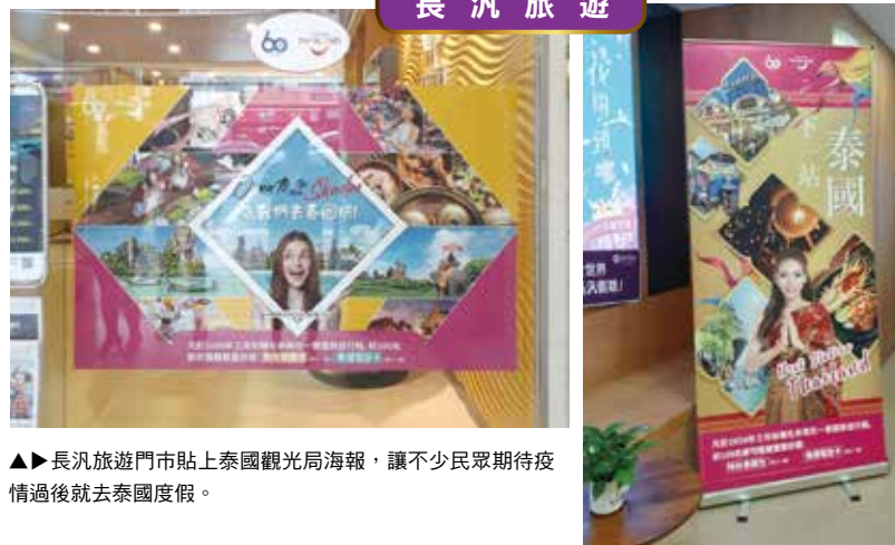
▲長汎旅遊門市貼上泰國觀光局海報，讓不少民眾期待疫情過後就去泰國度假。