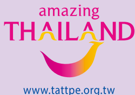
▲▲泰國觀光局推出一系列可愛又充滿泰國味的圖，非常吸睛。