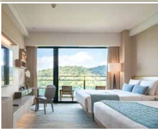
▲雲品溫泉酒店尊榮湖景家庭房。