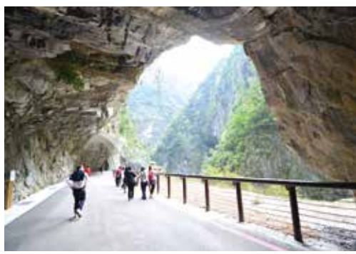
▲東南旅遊安排前往太魯閣九曲洞，壯麗景色宛如世外桃源。