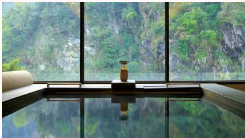
▲沐蘭SPA每間芳療室皆有大片玻璃窗，體驗療程之餘還可一覽山水之美。

溫馨的五月天，太魯閣晶英酒店邀請旅人帶媽媽到大自然散心，推出「買8,000送8,000·山中療癒」住房專案，提供住宿、餐飲、沐蘭SPA抵用券，總計8,000元現金回饋！為了呵護辛勞的媽媽，5/4~5/15期間，至沐蘭SPA體驗全身按摩療程，加碼贈送複方精油1瓶，從裡到外享受身心靈全然的放鬆。烘焙團隊也推出2款不同風味的母親節蛋糕，每款980元起！預訂「山中療癒」住房專案，即贈送3,000元餐飲抵用額度，住宿期間可於飯店餐廳或客房餐飲使用，旅人可依度假行程與媽媽的喜好，將額度使用於早餐、午餐、晚餐或宵夜。