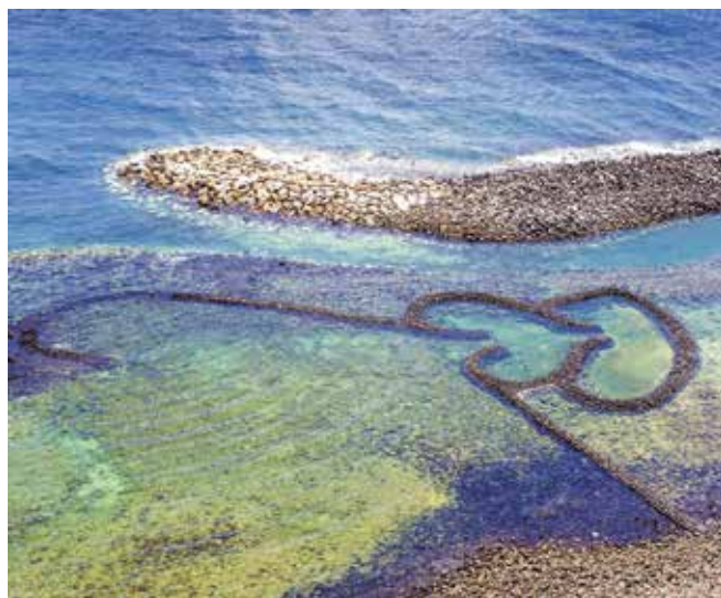
▲瞄準澎湖著名的海上花火節商機，長汎旅運推出4人同行，總價再折2,000元的加碼優惠。