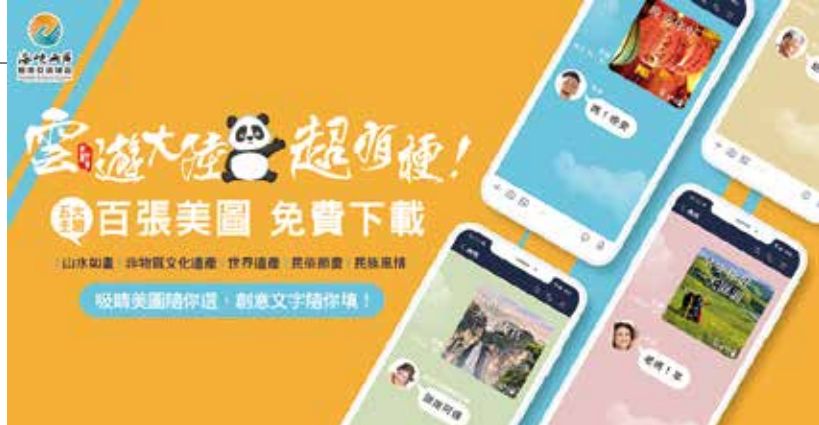
▲海旅會推出「雲·遊大陸」，邀您一同與親朋好友分享大陸旅遊的美好和祝福。