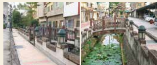
▲新町老街位在台灣彰化縣彰化市，民族路與華山路口之開彰祖廟後側，南郭排水支線旁，該渠道稱為「新町溝」。

老街，保有部分日治時代的日式老屋和老樹，充滿著濃濃日式風味，將老街規劃為散步道，同時增添鳥居、石燈籠、涼亭等設施，課程由導覽老師帶領學員實際探訪。