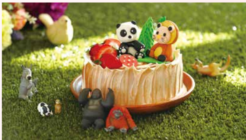
▲母親節限定「蛋糕廚藝教室」，為媽媽打造心意滿分的甜蜜獻禮。

母親節蛋糕廚藝教室 為媽媽打造夢幻蛋糕 消費滿2千 1千元加購「豐邑聯合住宿券」