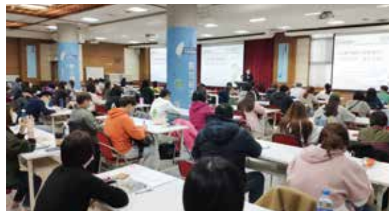
▲「觀光相關產業轉型培訓旅行業從業人員訓練」從業人員認真聽講。