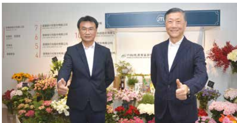
▲（左起）農委會主委陳吉仲、雄獅集團董事長王文傑。

新冠肺炎疫情衝擊全球經濟，也重創台灣各產業，台灣向來引以為傲的農特產品，在這波各國封城管制的情況下，從產銷單位到百大農業精品都面臨銷售危機，因此在農委會與相關政府部會的牽線下，農委會主委陳吉仲與雄獅旅遊集團董事長王文傑共同出席