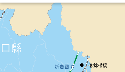
北九州機場→湯田溫泉·約1小時20分