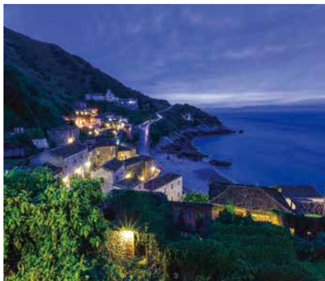
▲5~6月的夢幻馬祖藍眼淚即將登場，長汎旅運特別推出4人成行再享優惠。

透過此次長汎假期與立榮航空攜手的國內防疫旅遊，讓台灣民眾旅遊不群聚，落實防疫措施，安心出外透透氣。