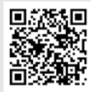
旅奇週刊官方網站 旅奇週刊粉絲團