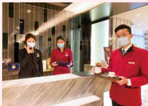
▲福容大飯店第一線服務人員配戴口罩防疫。

福容高雄店推住辦合一 客房變獨立辦公 每天/房1,500起 住滿5天送8餐飲優惠券1張