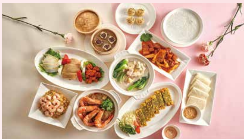
▲台北福華江南春4人合菜（外帶外送）每套3,600元。

豪華中西海陸自助餐美饌 4人同行媽媽免費 搶攻母親節大餐商機 只要3,600元免費外送到府