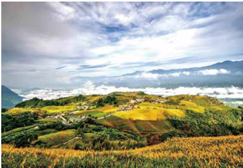
▲花蓮首推成旅晶贊雙人房」限時優惠價2天1夜，每人1,999元起，下殺45折。