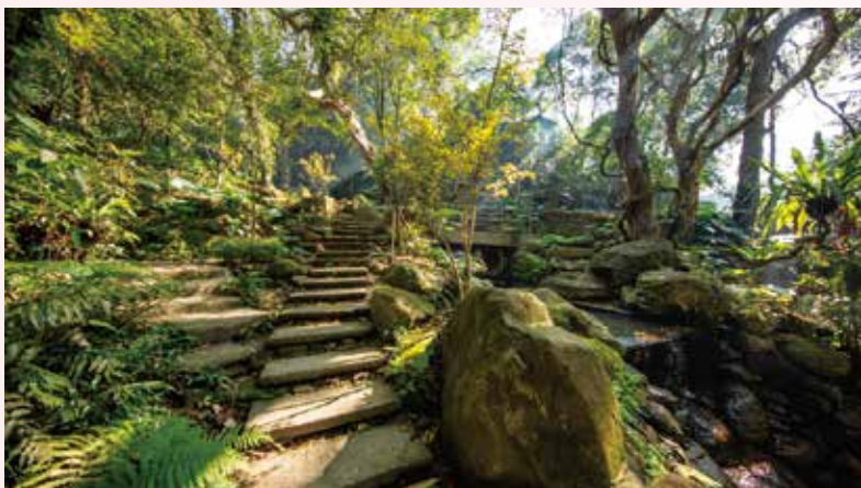
▲沿著溪流而上，映入眼簾的是一處難得的養生祕境—大板根森林溫泉酒店。

大板根是全台唯一同時擁有「低海拔熱帶雨林」與「優質溫泉」的優質度假村，5月推出「珍愛媽咪」1日遊賞味美食、幸福芬多精SPA之旅。包含「珍愛媽咪」中式合菜專案，每桌只要7,500+10%，含主廚特製母親節合菜1桌、森林門票10人、8吋手工蛋糕「碧螺春奶酪」1個，訂此方案還可享露天溫泉SPA優惠。或是「珍愛媽咪」西餐雙人1日遊雙人成行只要2,800元（假日需另加價400元）專案內容包含：母親節特製晚餐（2人1套，每人價值880元），並可免費森林入園享受雨林芬多精，90分鐘雙人湯屋1間，泉美人手工皂1個。