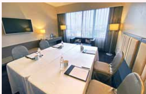
▲台北花園大酒店異地短期辦公-客房日租專案。

台北花園大酒店 客房日租專案 每日最低1,000元起 3至30日以上彈性選擇短租期間