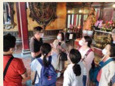
◀媽祖文化與遊程解說規劃、媽祖文化歷史發展。

來及歷年盛況，並舉辦媽祖文化座談會，分享媽祖文化與遊程解說規劃、媽祖文化歷史發展、遊程成本規劃設計、媽祖文化遊程規劃範例及設計，最後前往彰化老街體驗文化導覽學習。彰化老街有別於一般