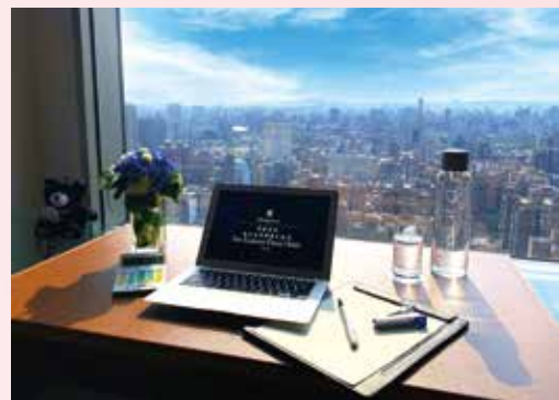
▲【行動辦公 立即成行】專案每日每人最低不到600元起。

香格里拉台北、台南遠東 異地辦公成趨勢 推行動商務辦公室 每人每日最低均價600元起 安心辦公