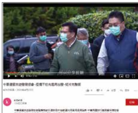
▲中華優質旅遊發展協會宣傳影片「疫情我不怕充電再出發」。