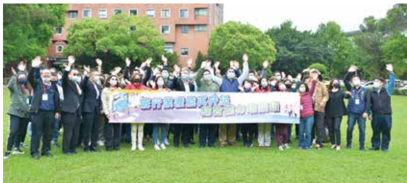
▲交通部部長林佳龍特別前往中華優質旅遊發展協會人才培訓班鼓勵學員。