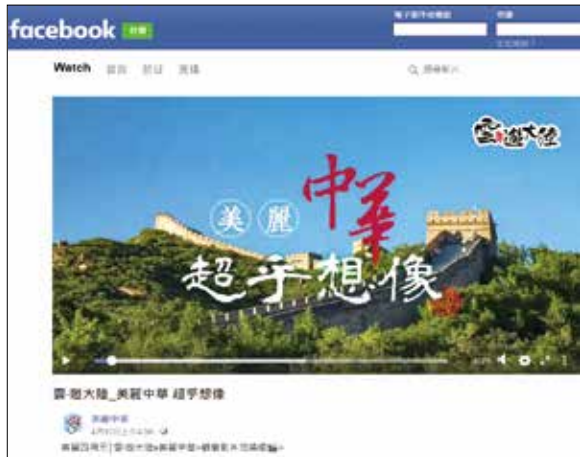
▲海旅會「美麗中華」臉書粉絲團全面更新，陸續增加50多部大陸文化和旅遊精彩宣傳片。

海旅會在2010年來台設立台北辦事處，2014年設立海旅會高雄辦事分處，積極推廣大陸旅遊。創立臉書粉絲專頁除了針對年輕族群進行市場推廣，同時也發佈海旅會重要活動訊息，是服務業界與業界溝通、交流的網路平台。目前美麗中華facebook粉絲團提供旅遊攻略、仙境美景、奇風異俗、跟著名人戀戀中華等精彩單元PO文分享，更提供名人精選好禮、機票、文創小品、名人講座等好康活動！海峽兩岸旅遊交流協會報你知！