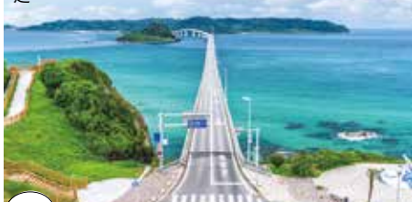
北九州機場→角島大橋·約1小時40分