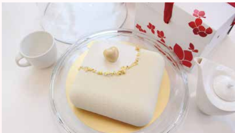
▲「母親之心」外型以純白巧克力淋面襯托出女性典雅的氣質。

經由旅覓酒吧點心坊廚藝團隊精心設計 內餡選用水蜜桃搭配乳酪慕斯 每個售價520元