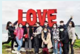
▲白沙灣著名的LOVE地標。