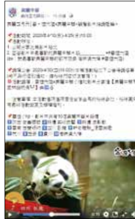
▲海旅會「美麗中華」臉書粉絲團近期推出多項抽獎活動，吸引網友熱烈迴響。