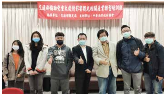
▲「觀光相關產業轉型培訓旅行業從業人員訓練」上課合影。