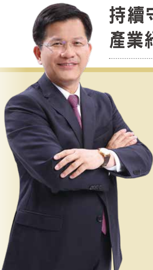
交通部部長 林佳龍

自新型冠狀病毒的疫情發生以來，政府各單位沒有一天鬆懈，隨著1/20起中央疫情指揮中心開設後，從邊境到境內、國門到家門、前線到後勤、政府到民間團體及每一位國人，都全部總動員，並守候台灣突破百日，更在近期創下連續18天無本土案例、連續5天0確診（已4/30截稿日為準），如此傲人成果得歸功於每一位盡心盡力的台灣守門員。