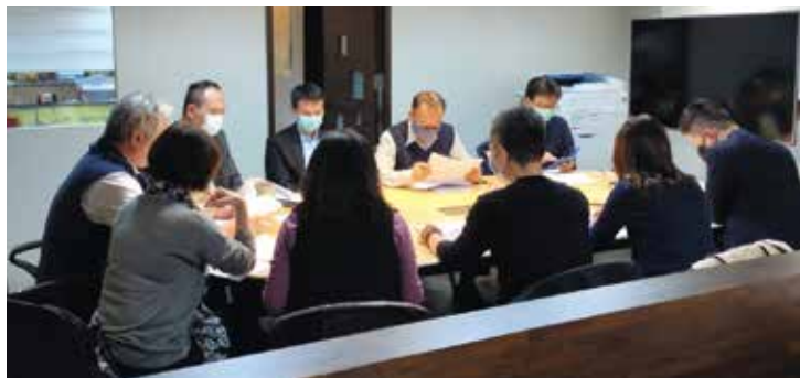
▲旅館電商操作人員會議。

交通部觀光局委託中華觀光人力資源暨資訊發展學會辦理旅館職涯發展計畫，其中第二階段三項職能基準建置一電商專員（旅館電商應用員）、客戶關係專員、休閒／娛樂服務人員（休閒／活動員），既基準初稿修正討論專家會議後，已如火如荼發送各項基準初稿問卷給各產學專家及從業人員