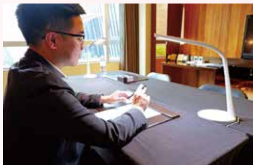
▲Home Hotel信義日租辦公室專業辦公空間。

Home Hotel信義客房日租 依天數人數不同有超低優惠 加贈主廚特製點心&QAFE優惠