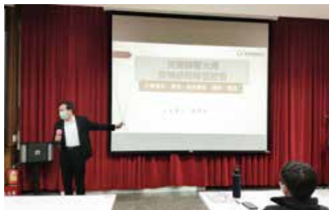
▲「觀光相關產業轉型培訓旅行業從業人員訓練」一上課實況。