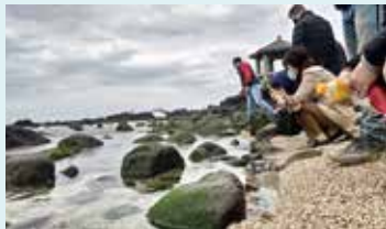
▲北海岸的美麗風光讓學員們駐足。