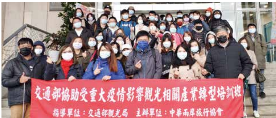
▲中華兩岸旅行協會於北觀處前合影。

共150人 提升旅行業從業人員專業實務知識與技能 地質旅遊考察 活絡食、宿、遊、購、行 加速國旅復甦