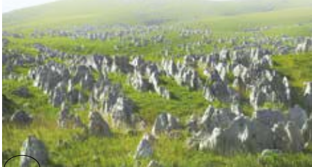
北九州機場→秋吉台、秋芳洞·約1小時25分