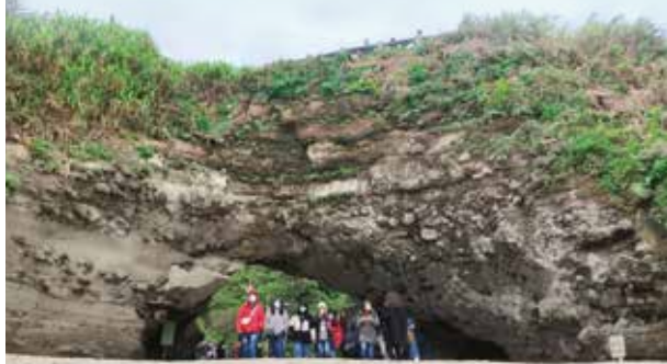
▲石門區的顯著地標，也因此而得名。