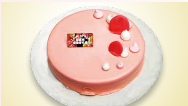
▲飯店贈送8吋法式草莓蛋糕、紅酒、康乃馨，讓賓客共享無價的天倫之樂。

推出「感恩媽咪·白金饗宴」餐飲優惠活動 自取、外送享85折 贈送8吋法式草莓蛋糕