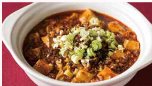
▲川菜餐廳—麻婆豆腐。

飄香近40年的國賓川菜廳，提供南台 灣最正宗道地的巴蜀美饌，且是南 部觀光飯店中唯一川菜餐廳。為傳遞更 精緻美好的用餐體驗，位在高雄國賓飯店 20樓的國賓川菜廳自即日起全面改裝， 預計10月初以嶄新風貌亮麗登場，整修 期間移至2樓與粵菜廳合併營運，這半年 期間，首度讓賓客體驗「一張桌可吃兩種 菜系」。此外，只要加入高雄國賓大飯店 Line好友(ID: @xot2617s)，即可馬上現領 250元餐飲抵用券，於5月底前至川粵餐廳 消費滿1,000元出示抵用券頁面，即可現 折250元，相當划算。