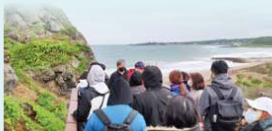
▲交通部觀光局北海岸及觀音山國家風景區管理處親自推廣介紹。