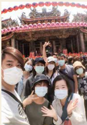
▲學員們在大甲鎮瀾宮開心自拍。

除了一系列的室內課程，更規劃了2個單日的考察活動，包括台灣宗教文化探索考察、北海岸文化及地質旅遊考察。台灣宗教文化探索考察走訪大甲鎮瀾宮，了解歷史由來及認識建築風貌，繞境典故與由