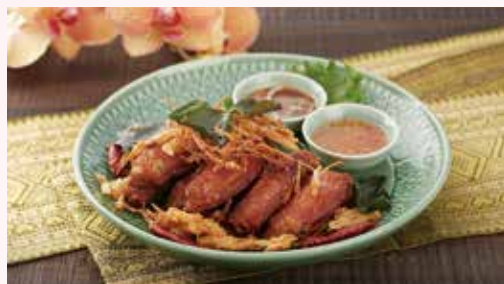
▲台北喜來登SUKHOTHAI香茅雞翅。

火熱延燒的疫情，遇上逐漸變熱的天 氣，悶壞的身體、躁動的心情，此 時最需要來點酸、辣味振奮精神！兼容 傳統口味與創新泰菜聞名的台北喜來登 SUKHOTHAI即日起至6/30止推出「THAI 豐富」泰式料理無限享用，凡4人（含） 以上用餐，即可以超划算價格，無限續點 多道精選料理。餐廳精選平日20道、假日 30道人氣料理，包含宮廷酸甜楊桃豆鮮蝦 沙拉、月亮蝦餅、香茅雞翅、金沙咖哩海 鮮、酸辣蝦湯、泰式炒河粉、塔香霜降牛 肉，繽紛驅暑的「摩摩喳喳」等3項甜點 任君品嚐。