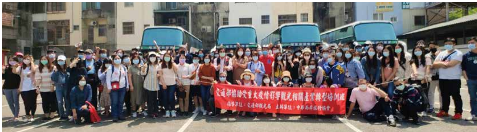
▲中華兩岸旅行協會4台遊覽車出訪考察。

因應重大疫情對觀光相關產業營運之影響，交通部為協助觀光相關產業之營運穩定，並促進觀光相關產業之轉型升級，由下而上透過與公協會組織及觀光相關科系之合作，進行跨區交流、標竿學習，活絡食、宿、遊、購、行，提振市場信心加速國旅復甦等方式，以提升服務品質及行銷技能等方式，協助並補助其觀光相關從業人員之短期專案輔導培訓與產業升級與轉型之準備，從業人員的實務訓練是不可或缺的重要工作。