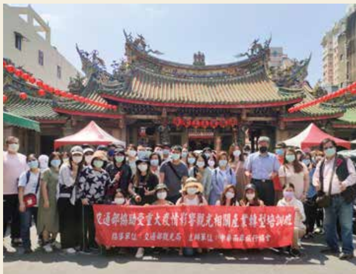
▲台灣宗教文化探索考察走訪彰化南瑤宮。

除了一系列的室內課程，更規劃了2個單日的考察活動，包括台灣宗教文化探索考察、北海岸文化及地質旅遊考察。台灣宗教文化探索考察走訪大甲鎮瀾宮，了解歷史由來及認識建築風貌，繞境典故與由