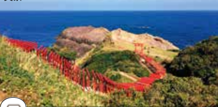
北九州機場→元乃隅神社·約2小時