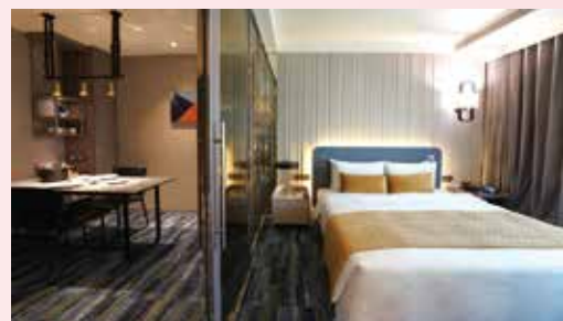
▲雲朗觀光集團君品酒店、翰品酒店、兆品酒店、品文旅 推出日租辦公方案，圖為翰品桃園。

雲朗觀光集團推出「客房辦公室」，提供企業可租用飯店客房讓員工分組異地辦公、分散風險，達到全面的防護與人力備援，更解決了員工居家辦公環境可能存在對工作的干擾。包括君品酒店台北、翰品酒店（新莊、桃園、高雄、花蓮）、兆品酒店（嘉義、台中、礁溪）與品文旅礁溪都推出以客房作為「獨立辦公室」的短租方案，公司可以每日為單位租用飯店房間作為員工異地辦公的場所，每日可使用10小時，每房自2人起，至多5人共用，君品酒店每房2,100元起。