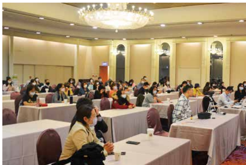
▲旅行公會總會針對旅行業者量身規畫「觀光產業轉型培訓課程」，提供旅行業者進行職涯提升。

為了讓廣大旅遊從業人員能參加相關補助課程，全台各地方公協會無不積極舉辦相關培訓課程，而旅行公會總會也針對旅行業者量身規畫出「觀光產業轉型培訓課程」，由觀光局指導，提供旅行從業人員在職訓練，期盼扶助各旅行業者在這段時間，能夠強化員工在職能力，讓各旅行業者員工及雇主可攜手渡過此次困境，進而有效達成政府補助的效果。而第一梯次於4/7~4/