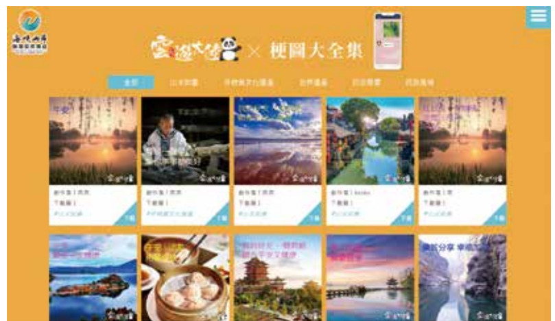
▲除了自己發揮創意製作梗圖，也可到「梗圖大集合」看看網友的創意。