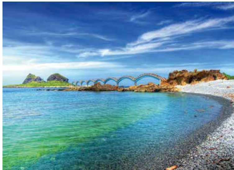
▲台東推出5星知本老爺酒店限時優惠價，等於買機票送住宿。

長汎旅運不僅出境旅遊表現亮眼，在國旅方面亦用心耕耘，透過立榮航空的航班優勢，加上跳脫坊間傳統設定，特別打造出更具溫度的旅遊商品，以多元的旅程來滿足市場需求。