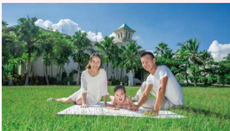
▲今年母親節陪媽媽吃得安心食的健康，同時創造歡樂滿滿的佳節回憶。

五月理想大地的花季，百花盛開，尤其是聖潔的百合花，在理想大地園區內處處可見；此時正逢溫馨滿溢的「母親節」，是表達感恩孝心的時刻。理想大地度假飯店推出「900元消費券」，只要指定住宿專案，可抵用飯店內消費，吃喝玩樂一次滿足全家大小的期待！為感謝母親們的辛勞！於5/9~5/10期間，飯店里拉自助式西餐廳推出2人成行第2人半價或3人同行第3人免費優惠。多款主廚創意西式餐點與每日精選的新鮮食材，滿足全家的味蕾，餐廳濱臨河畔，戶外視野絕佳，彷彿置身在庭園中享受美食餐點。