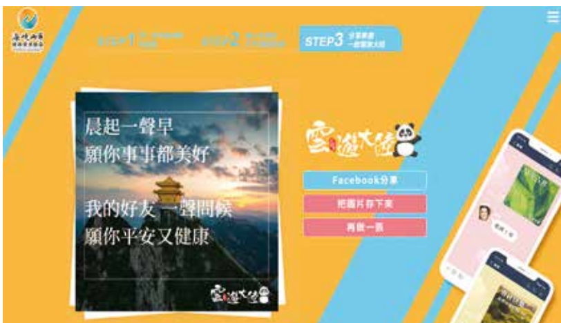
▲一秒下載圖片或是立即分享製臉書，將大陸文化和旅遊之美分享给親朋好友。