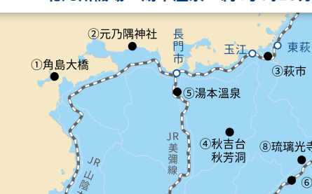
北九州機場→湯本溫泉·約1小時25分