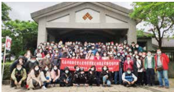
▲「觀光相關產業轉型培訓旅行業從業人員訓練」出訪考察全程配戴口罩。