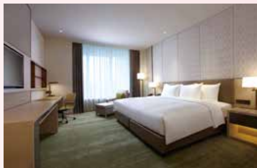
▲台北六福萬怡酒店推出「防疫辦公好安心一日租方案」，客房多元利用化身為「獨立辦公室」。

六福旅遊集團旗下台北六福萬怡酒店、六福居、六福客棧共同推出「防疫辦公好安心一日租方案」，即日起至5/31止，將客房多元利用，化身為「獨立辦公室」，滿足公司行號及商務人士的辦公需求，出外上班更安心。辦公室開放時間為上午9點至下午5點，每日可使用8小時，台北六福萬怡酒店每房日租價格為2,800元、六福居每房1,800元、六福客棧每房1,000元，若超過使用時間，將依照每間飯店標準，每小時加收150~300元。