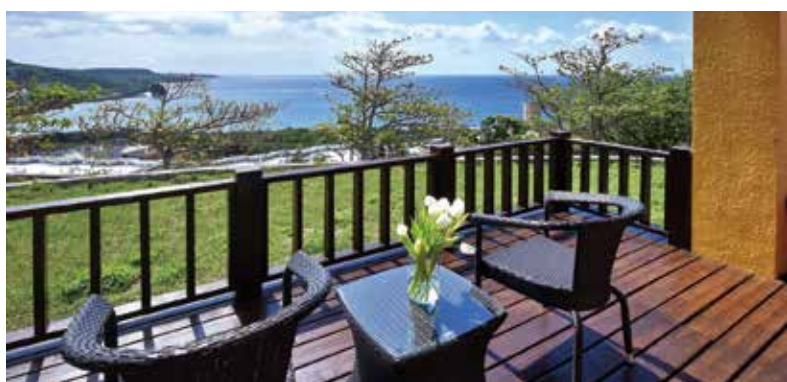
▲福容墾丁店與花蓮店邀您親近大自然。

住高雄送美棧2,999 花蓮加墾丁只要4,999元 福容桃園店+高雄+花蓮 3店只要5,999元起