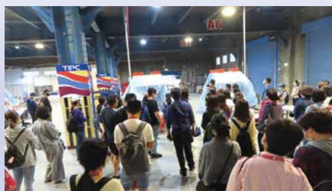
▲資深導遊帶領學員進行港務大樓巡禮。