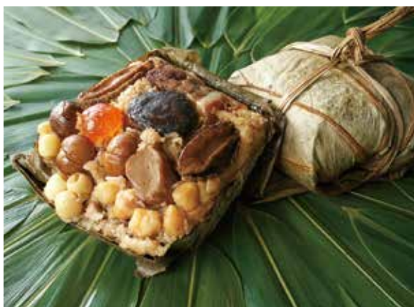
▲珍珠坊—吉利富貴裹蒸粽。

由於近來養生當道，就有飯店業者將特殊食材入粽，台北福華大飯店今年推出江南湖州粽禮盒、廣式福粽禮盒與冰心Q粽禮盒及專為素食者設計的