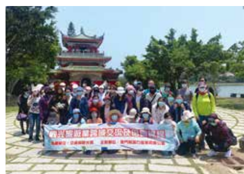
▲觀光旅遊業跨域交流及培訓課程。

疫情的影響之下，衝擊金門旅遊市場，為了提振金門旅遊，金門縣旅行商業同業公會在5/4~22舉辦觀光產業職能培訓產業轉型課程，內容包含戶外與室內課程，室內課程內容五花八門、多元優質，像是大陸實務、Inbound來台操作實務、數位行銷、社群小編觀念與操作、短影片實戰，手機拍攝技巧實作、服務品質、旅行業產品包裝設計、郵輪旅遊產業介紹與行銷、服務品質視野與觀點、觀光產業服務技巧盤點、旅行業法規問題爭議與處理、緊急狀況處理、長程實務等等，提升學員職能技巧。