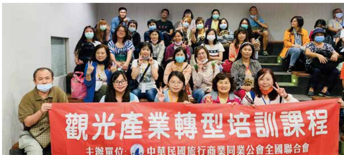
▲「觀光產業轉型培訓課程」學員合影。

新冠疫情影響之下，許多旅行業從業人員受到偌大衝擊，面臨無薪假或停業，而為了協助業者度過這段艱辛時刻，在交通部觀光局指導下、旅行商業同業公會總會舉辦了一系列全台「觀光產業轉型培訓課程」，攜手業者共渡難關，在生意停擺之時，一同上課進修、充實自我，同時也能獲得政府的課程補助，獲得各地業者熱烈迴響。