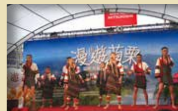
▲傳源文化藝術團開場表演。