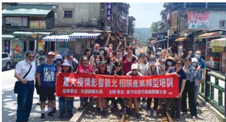
▲新竹旅行公會培訓班第三期登場。

在疫情的持續影響下，對於觀光產業造成莫大的衝擊，許多同業生存也面臨到巨大的生存挑戰。為此，交通部特別推出「協助受重大疫情影響觀光相關產業轉型實施要點」，期盼能盡速輔導業者轉型與升級。為此，新竹市旅行商業同業公會舉辦觀光產業職能培訓產業轉型課程，第三期A班與在5/4~22舉辦，課程內容網羅戶外考察與室內教學，包括數位行銷、旅遊保險、風景資源+國旅實務、觀光法規、大陸實務、大洋洲實務、加州實務、歐洲實務、亞太實務、來台Inbound，多樣課程幫助學員提升能力，並在未來迎接更多挑戰，一起迎接疫情後所復甦的無限商機。