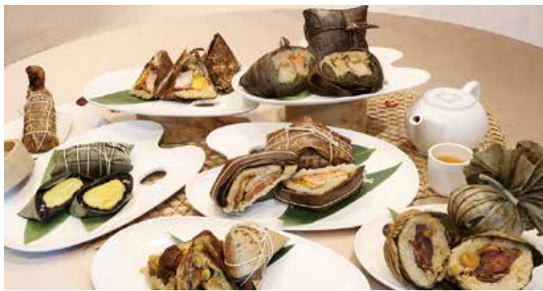
▲台中金典酒店端午金粽系列。

隨著端午佳節即將到來，應景過節的粽子是絕對不能少的，台中金典酒店今年推出組合多元風味且別具特色的「金粽」系列，其中包含：以八寶醬搭配和牛臉頰肉的「波特酒和牛頰粽」、創新台灣味的「麻油雞腿黃金粽」、融合海陸風味的「蒲燒芋頭扣肉粽」、改良傳統口味的「東坡珍肉粽」、元氣滿分的「養身三杯素味粽」、風味獨特的「紫米榴槤甜心粽」，及傳統廣式「鮑魚裹蒸粽」等，而今年台中金典的「金粽」系列同樣推出禮籃組，方便大家端午佳節饋贈親友。原價1,200元，5/31前訂購可享特價999元。