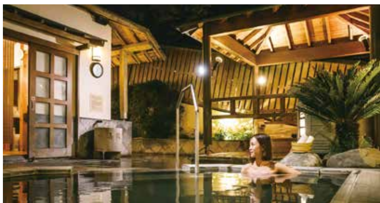
▲知本老爺露天溫泉。

一塊錢可以撥打公共電話，也可以買到雜貨店裡的驚喜糖果，而在新竹老爺「加一元」直接送你到台東知本老爺住1晚！新竹老爺推出買1送1住房專案，每人、每晚最低只要1,750元起，就可以享受到專案內包含全台灣最具魅力的風城—新竹住宿1晚外，加碼贈送2客早餐以及老爺SPA肩頸按摩舒壓體驗，最優惠的是加1元直接送你原價9,800元的知本老爺雙人精緻客房住宿券1張，住宿券優惠時間至今年12/31止，讓您安排假期無負擔。新竹x知本老爺雙強聯手只為給您最好的享受，誠摯邀請您來趟新竹、台東的深度慢旅，為您的假期加點彈性。