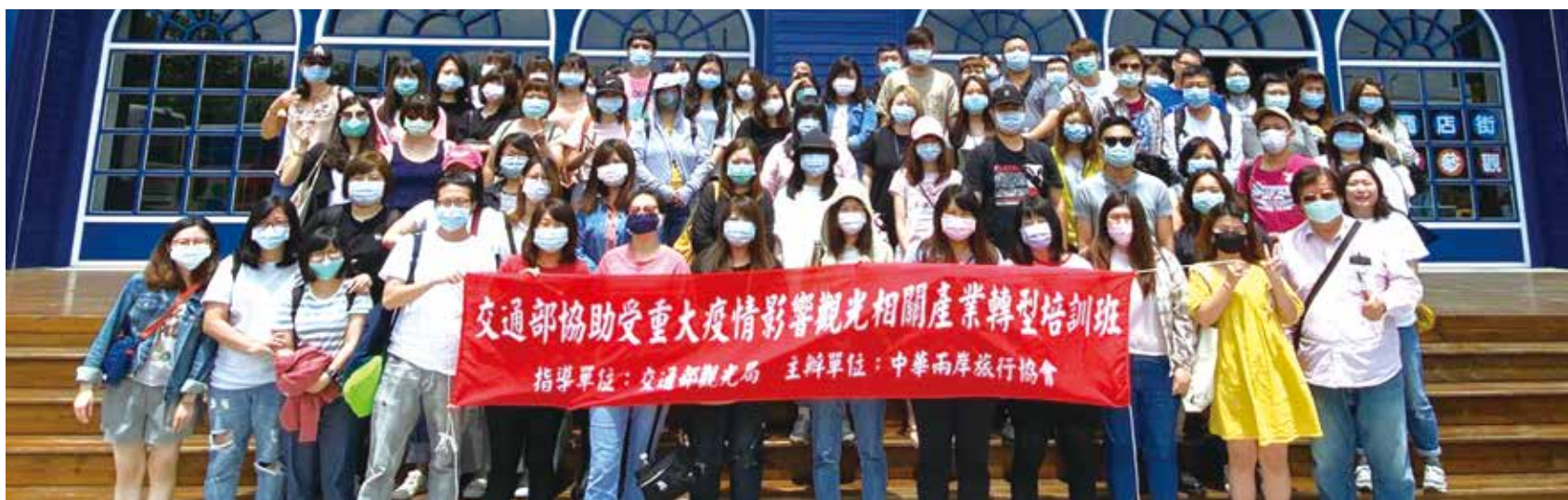
▲中華兩岸旅行協會「觀光相關產業轉型培訓旅行業從業人員訓練」第2期圓滿落幕。

因應重大疫情對觀光相關產業營運的影響，交通部為協助觀光相關產業營運穩定，並促進觀光相關產業轉型升級，因此透過由下而上與公協會組織及觀光相關科系的合作，進行跨區交流、標竿學習，藉此活絡食、宿、遊、購、行，提振市場信心加速國旅復甦等方式，以提升服務品質及行銷技能等方式，協助並補助其觀光相關從業人員之短期專案輔導培訓與產業升級與轉型準備，從業人員的實務訓練是不可或缺的重要工作。