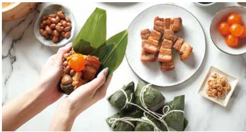
▲台北喜來登大飯店「仲夏端陽」端午包粽。

6/30前 DIY包粽樂入住每晚4,500元起 提供限量親子加床 與佳節香包掛飾小禮