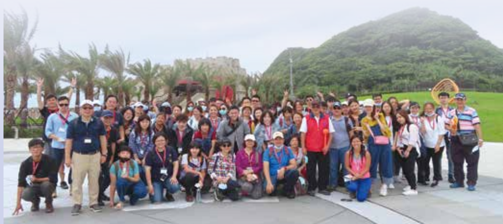
▲學員前往和平島實地考察。