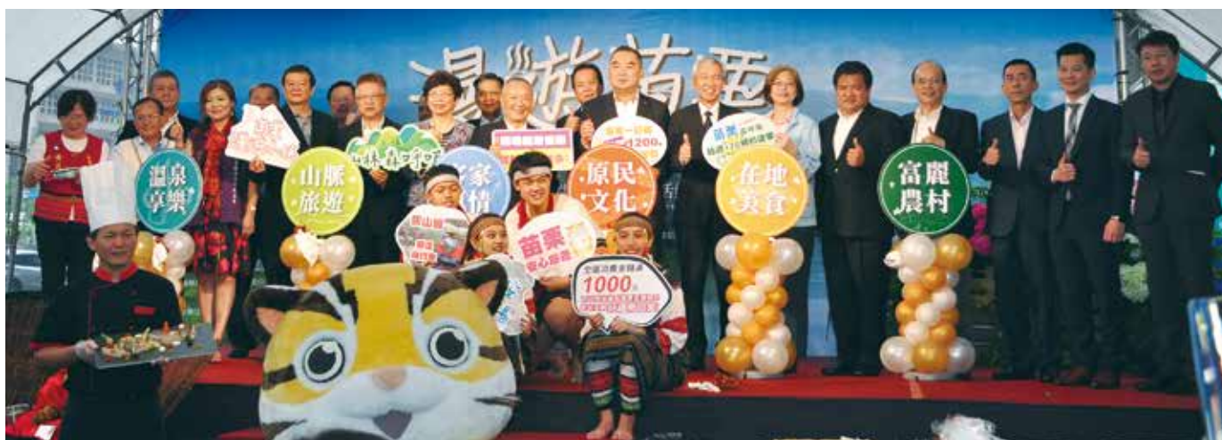
▲「苗栗觀光溫泉美食行銷活動」於5/28~5/31一連4天盛大展開。

苗栗縣「泰安溫泉」名聞遐邇，素有「美人湯」之稱號，榮獲交通部觀光局評選全台10大好湯殊榮。苗栗縣政府文化觀光局於5/28~5/31下午14時至晚上20時為期4天，在台北新光摩天大樓廣場舉辦「苗栗觀光溫泉美食行銷活動」。