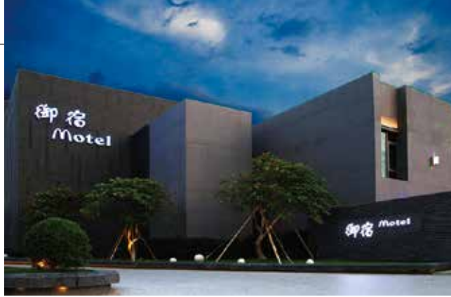
▲可遠眺柴山、壽山的中華館，擁有39間獨棟及配有電梯的客房，是南台灣耗資4億元、耗時4年打造的頂級摩鐵。