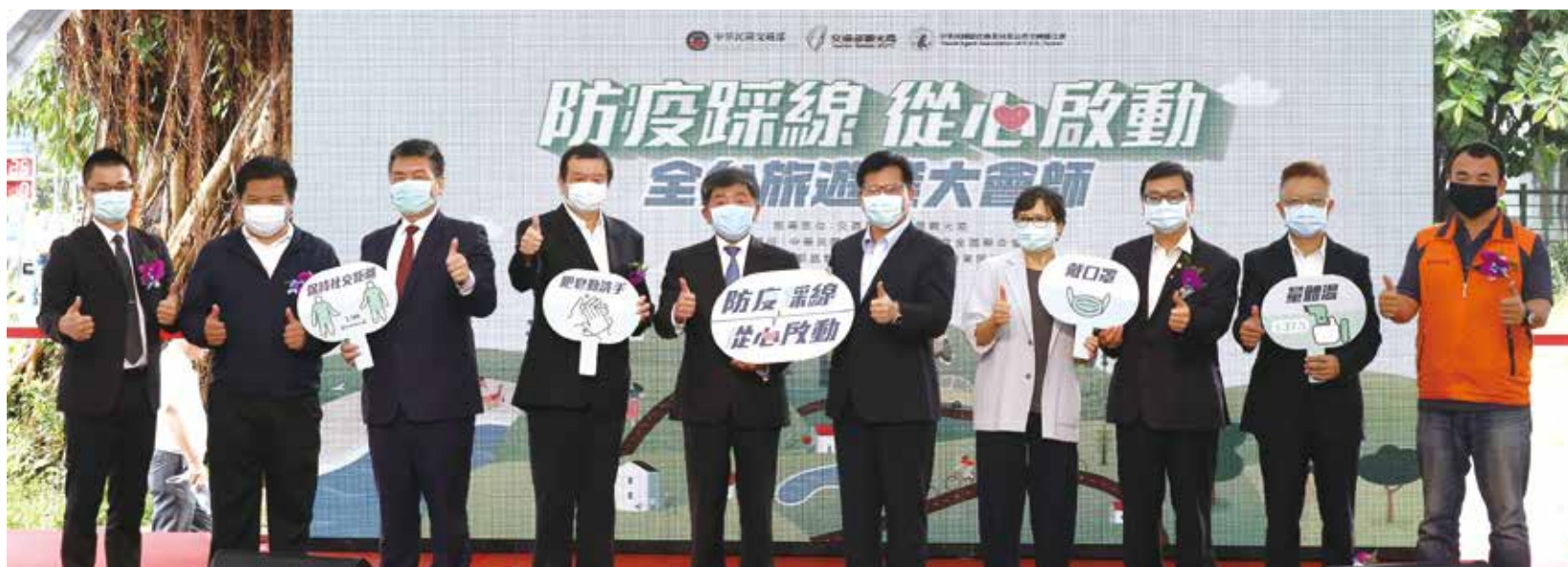
▲(左4起)旅行公會全聯會理事長蕭博仁、衛服部部長陳時中、交通部部長林佳龍與嘉賓們共同宣布「防疫踩線 從心啟動」。

7地直播連線提振國人旅遊信心 活絡觀光 北、中、南、東4大區域共號召了50部遊覽