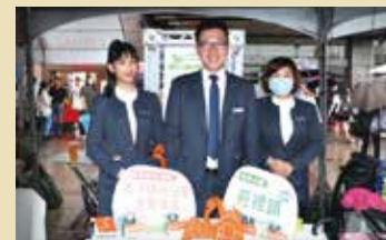
▲享沐時光莊園渡假酒店。