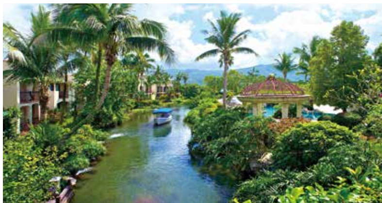
▲老爺的理想假期：台版威尼斯花蓮理想大地。

台灣在後疫情時代下，旅遊開始有不一樣的定義，鼓勵民眾走出戶外。宜蘭傳藝老爺行旅與花蓮理想大地度假飯店，鎖定國內旅遊客群，打造宜花雙城遊「老爺的理想假期」，即日起至12/30止，入住2館1泊1食，雙人住房優惠6,499元，再享尊榮車站免費接駁，吃喝玩樂全包辦，輕鬆暢遊宜蘭、花蓮，感受東台灣的好山好水好空氣。若想攜帶物入住，宜蘭傳藝老爺行旅可以另加價升等寵物客房，與毛小孩一起度假去；7/14前入住花蓮理想大地，不限專案享活動4贈2的好康優惠，竹筏、單車、釣魚、射箭等多元好玩活動，讓您住得高級、玩得盡興，享受無限樂趣！