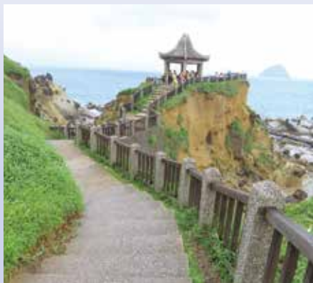
▲學員在和平島的涼亭眺望基隆外海景。