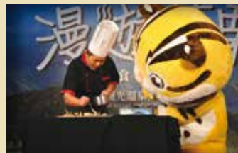
▲溫泉美食秀表演-湯悅溫泉會館林主廚。