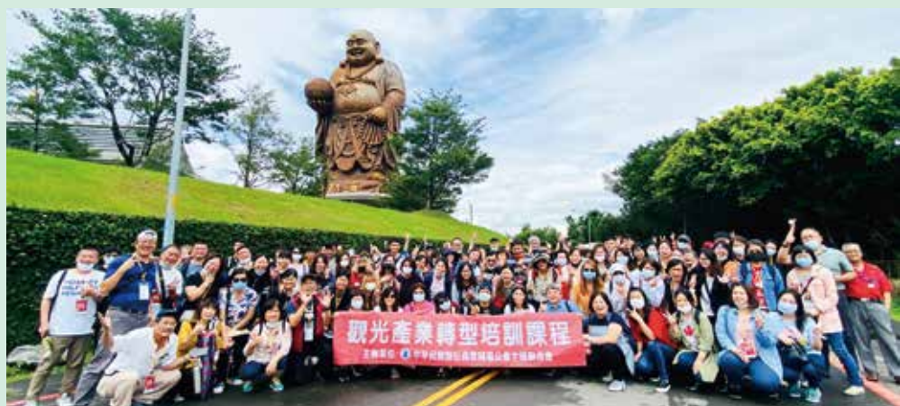
▲戶外課程來到十二寮休閒農業園區和峨眉湖步道。