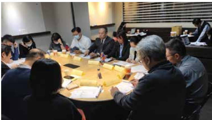
▲旅宿電商操作人員職能基準初稿會議。

交通部觀光局委託中華觀光人力資源暨資訊發展學會辦理旅館職涯發展計畫，研究團隊除調查文獻、透過學界需求訪查、產業需求研討，最後召集產業、學界專家會議就產業界觀點及現況進行盤點，旅館業可以發展的職能基準優先前3項為旅宿電商操作人員、活動指導員及客戶關係專員。依據建置3項旅館基層從業人員職能基準，從初稿建立、訪談業界代表專家，並依建置的職能項目蒐集相關的工作任務、行為指標、工作產出、對應的職業內涵，選出合適與科學方法進行職能分析、依選定德菲法進行職能分析、完成分析後產出之職能基準。