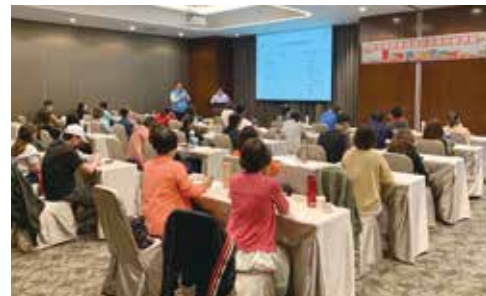
▲室內課程多元，提供學員最豐富的知識。