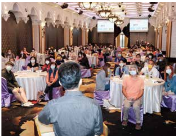
▲旅行公會總會「觀光產業轉型培訓課程」。

景區管理處之觀光資源介紹、數位及精準行銷、產業升級與服務轉型之準備等等，對於學員在工作上有很大幫助，大家收穫滿滿。