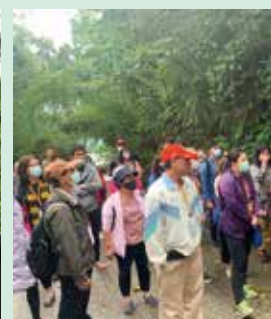
▲戶外課程前往薑麻園，從不同角度重新探索在地美好。