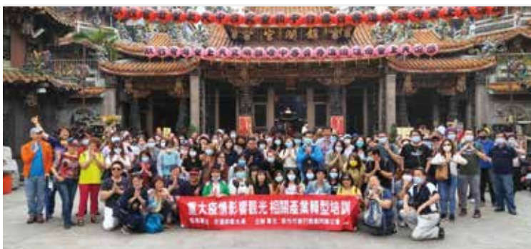
▲新竹旅行公會轉型培訓第4期學員合影。

在交通部觀光局指導之下、由新竹旅行公會主辦「協助受重大疫情影響觀光相關產業轉型培訓班」第4梯次圓滿結訓，課程從5/4～5/22，包括室內課程