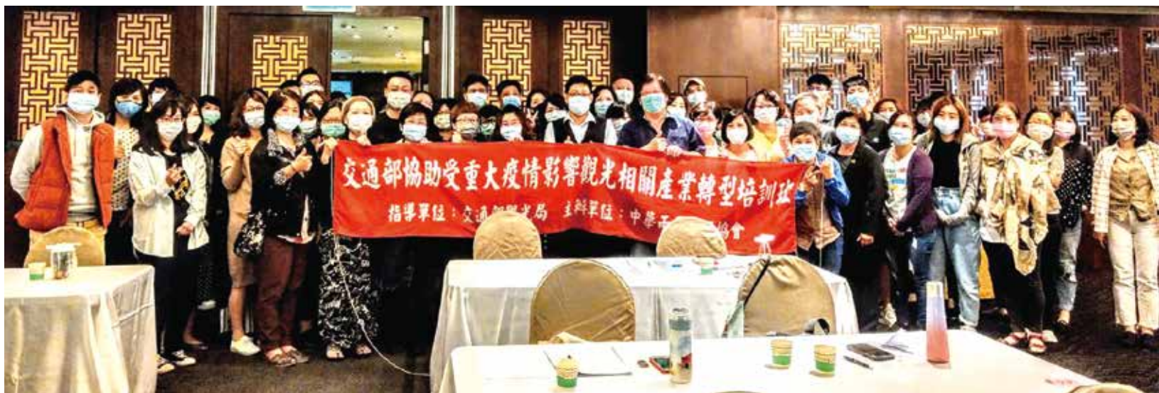
▲中華兩岸旅行協會第3期「觀光產業職能培訓及產業轉型課程」。

為了協助受到新冠肺炎疫情影響的旅行業從業人員，在交通部觀光局指導下、中華兩岸旅行協會於5/5~5/25舉辦第3期「觀光產業職能培訓及產業轉型課程」，協助廣大會員業者紓困，大家一同上課，吸收新知、提升競爭力，在學習的過程中，也能獲得每小時158元的轉型培訓費用，讓業者獲益良多。