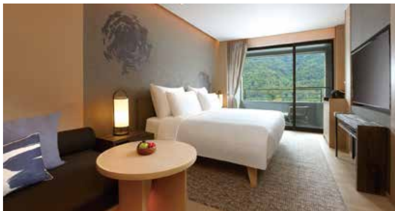
▲台北喜來登大飯店「雙城遊記」礁溪寒沐客房照。

台北+礁溪 2泊2食專案 超值價6,300元 礁溪寒沐提供「住宿券」7/30前自由使用