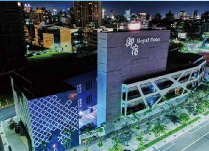
▲總共39間獨棟客房的中華館坐落於九如、中華路口，不僅交通便利，更有著鬧中取靜的優勢。