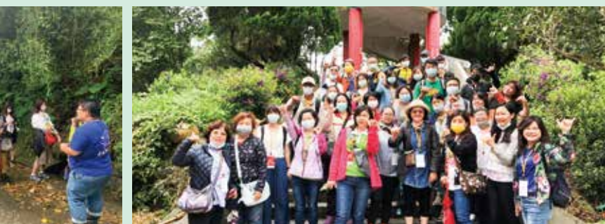
▲旅行商業同業公會總會「觀光產業轉型培訓課程」學員合影。

公會總會也依照中央流行疫情指揮中心的指示，除了每天簽到時為學員測量額溫、酒精消毒之外，室內課堂中學員也必須全程帶上口罩，並保持安全社交距離，以營造安全、安心的學習空間，讓每位業者能夠放鬆心情聽課，準備迎接疫情後的反彈商機。