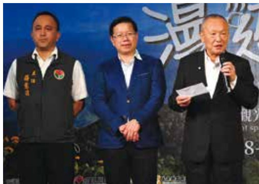
▲(左起)苗栗縣原住民族事務中心主任蔣意雄、苗栗縣政府文化觀光局局長林彥甫、苗栗縣縣長徐耀昌。