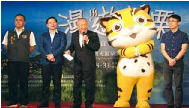
▲苗栗縣縣長徐耀昌(左3)致詞。