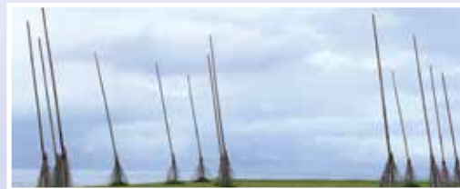
◀基隆潮境公園IG打卡熱點!哈利波特飛天掃帚。