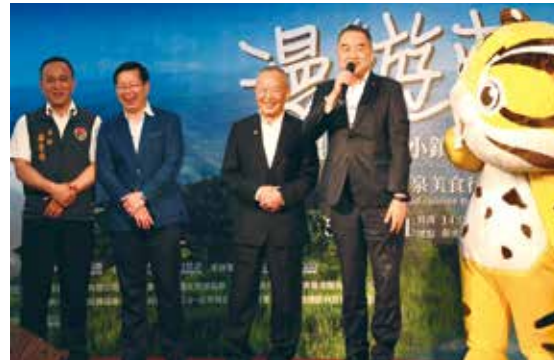
▲立法委員徐志榮(左4)致詞。

為了讓更多民眾了解到苗栗的好山好水與人文風情，苗栗縣政府文化觀光局特別於5/28舉辦盛大的開幕式，並邀請交通部觀光局執行秘書蔡明玲、立法委員陳超明與立委徐志榮、苗栗縣議員黃月娥、議員楊文昌、新光人壽資深副總劉信成、新光樂活事業協理張枝明，以及來自全國的觀光公協會代表、縣內觀光公協會代表及溫泉業者等貴賓蒞臨現場。