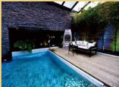
▲高雄御宿Motel—中華館」耗時4年、斥資4億元打造，更有領先市場的高規格硬體設備。