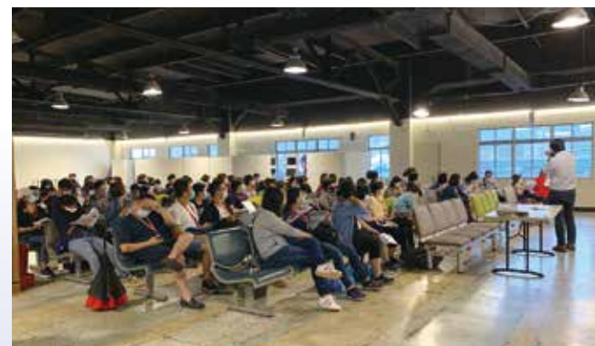
▲學員在基隆港務大樓實際探訪港務大樓。