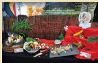
▲苗栗縣在地溫泉美食料理展示。