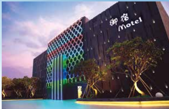
▲御宿旅館集團擁有21個據點分布於南台灣，如「高雄御宿Motel—鳳山館」便聘請最優秀室內設計大師團隊，以最好的軟硬體設施，歡迎貴賓蒞臨。