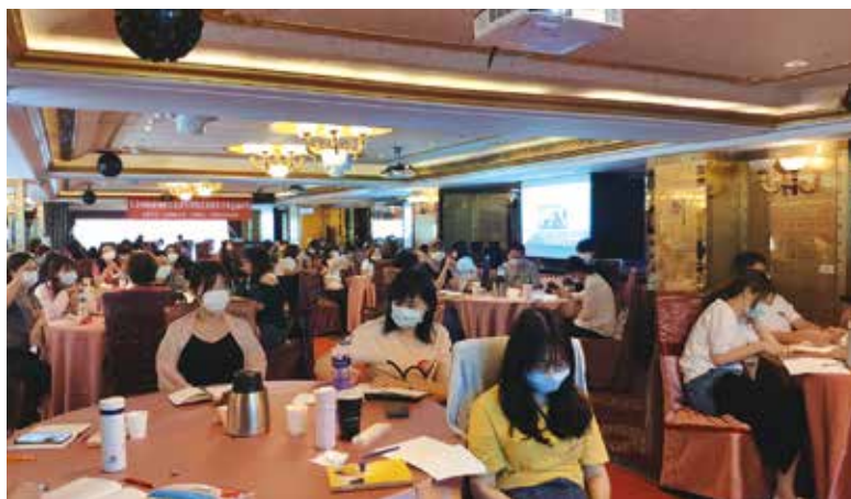
◀課程期間，學員在室內都落實配戴口罩。

線操作旅遊業人員，能更加深入了解台灣的文化和自然魅力所在，未來能夠靈活運用、包裝出創新行程，提供給國旅、甚至外國旅客不一樣的出遊選擇。