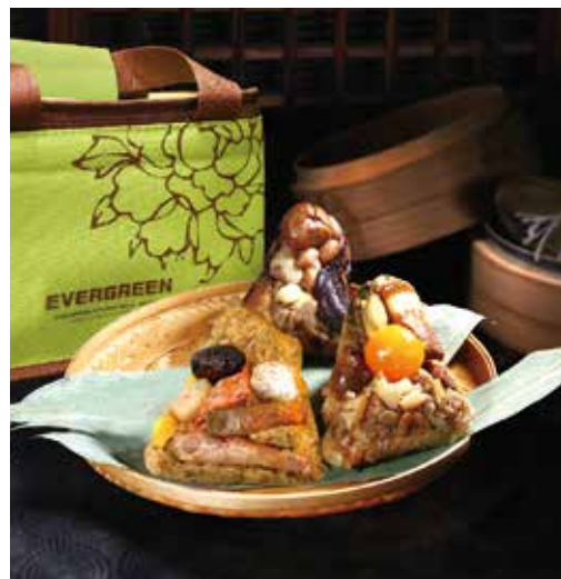
▲長榮桂冠酒店端午粽子，保證滿足您的口腹之慾。

時序已過立夏，端午節已緩緩來到，長榮桂冠酒店（基隆）即日起至6/25止推出「端午香粽」，經典呈獻歷年來暢銷產品—荷香裹蒸粽、飄香台鮑粽、羅漢香素粽（素）、桂冠海味粽及紫米八寶粽（素甜粽）；每顆單價從120至220不等，5/31前預訂可享