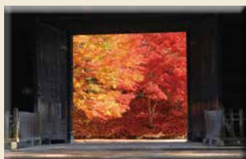
▲自JR弘前站搭乘巴士即可輕鬆抵達弘前公園。

弘前公園的紅葉美景由1,000株楓樹和2,600株櫻花樹所組成，和春季粉嫩的景色截然不同，呈現出古雅典緻之美，公園每個角落都染上一片秋紅。往年10月中下旬至11月上旬在弘前城植物園會舉辦盛大的「弘前城菊花紅葉節(※)」，還可兼賞睡魔燈籠及特色菊花展。 ※2020年尚未公告。