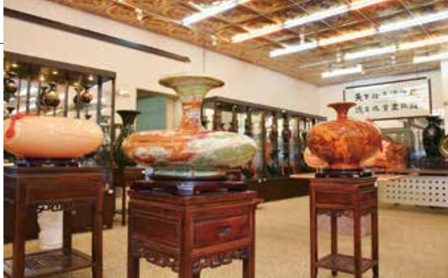
▲天億寶石博物館矢志推廣台灣玉石之美。