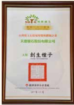
▲天億寶石博物館獲得經濟部中小企業處「台灣寶石情境導覽與體驗計畫」輔導執行。

境導覽與體驗計畫」輔導執行，特別建立了一個跨網路與實體的展售平台，提供線上部分產品的展售服務，運用線上RWD模式，針對不同工具使用進行最佳化的適配。