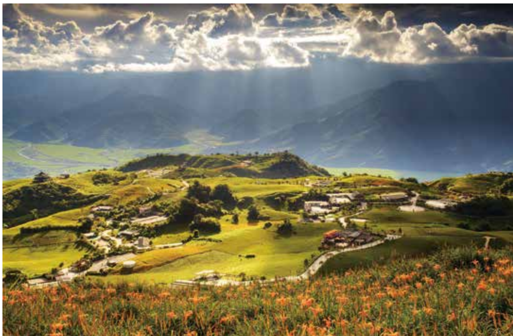
▲不論是國道一號沿線、國道三號沿線、台61線幸福公路沿線、花東縱谷沿線、花東海岸沿線等，都有諸多美景等待您去探尋及開發及熟悉。

很多旅行社可能從來沒想像會有這麼一天，會需要來加入申請交通部觀光局「安心旅遊補助」的團體35團額度行列！其實想想台灣3,900多家旅行社，營運項目都不一樣，每一家的專長及專精業務都各有絕門功夫，但因為無論哪些大型或中小型旅行社，這幾個月來營收都掛零，僅有零星的一些收入而已，只能仰賴政府不同措施的政策補助來支撐。