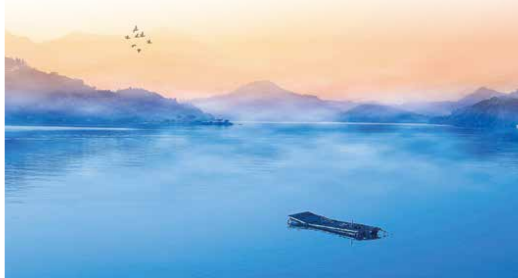
▲建議不需要一窩蜂前往熱門區域，可以反向操作，藉此擴大商機。

不論是國道一號沿線、國道三號沿線、台61線幸福公路沿線、花東縱谷沿線、花東海岸沿線、蘇花及蘇花改沿線、北橫公路沿線、南橫公路沿線、中橫公路沿線、南迴公路沿線、北海公路沿線、東北角海岸沿線，都有諸多美景，等待您去探尋及開發及熟悉。