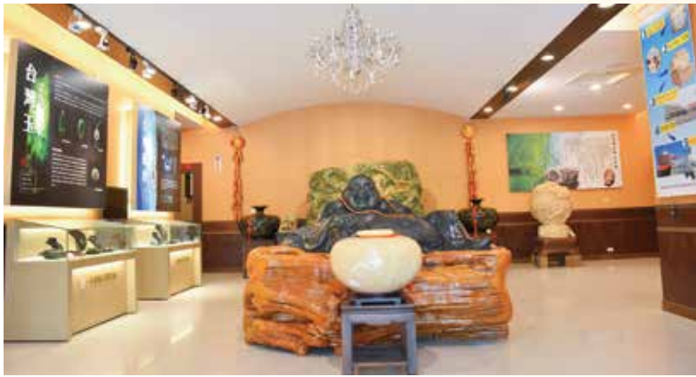
▲▲走進擁有千坪空間的天億寶石博物館，就能發現這個東部最大玉石博物館的館內，整合了花蓮貓眼玉、台灣玉、玫瑰石以及七彩石等各類特色礦石，並開發為具收藏價值的地方特色禮品。

成為國際石材出口重地。而如今的花蓮則演變成玉石加工品的故鄉，雨後春筍便是其中佼佼者，不僅坐擁大量玉石加工品，更因為能在價格與品質兼具的優億寶石博物館也將重新開張，成為同業與消費者的最佳選購中心。