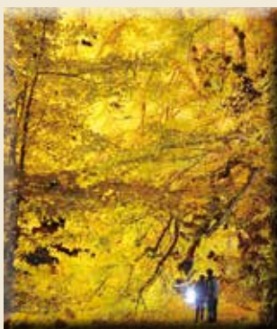
▲大銀杏盛開期間宛如金色瀑布，相當壯觀。

北金澤大銀杏被譽為是日本最巨大的銀杏樹，高約31公尺、樹幹寬約22公尺，自日本鎌倉時代生長至今，樹齡已超越1,000年，現被指定為國家天然紀念物。每年約11月中下旬起就會進入最佳觀賞期，自JR北金澤站下車徒步約10分即可抵達。