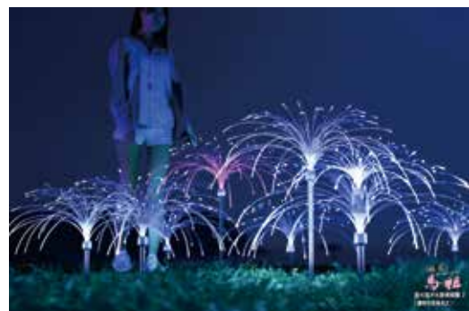
▲微光海洋光廊模擬

本系列活動將於6/30起陸續推出，有官帽山步道輕旅行、戰地餐桌午茶饗宴、微光音樂會、坑道詩歌季、坑道攝影拿獎金及坑道打卡換好禮等精彩活動，好吃又好玩，今夏的馬祖將讓大家耳目一新！本次還特別以藍眼淚微光概念設計夜光藝廊，讓地上微光與海上藍眼淚光芒互相輝