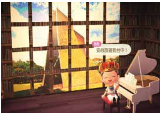
▲森友們可以在遊戲中暢遊東海路思義教堂。