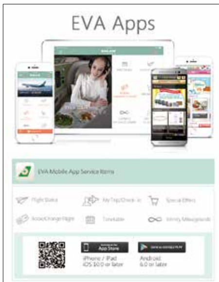
▲EVA Mobile APP報到具有護照掃描功能，採用行動裝置報到的旅客，可使用相機功能讀取護照資料，系統將會自動把護照資料帶入相對應的欄位。

時間一直是近年來努力的目標，此次優化相關系統放寬報到時間為起飛前70分鐘，對於使用行動裝置或電腦報到的旅客將更加便利，在疫情期間旅客普遍有減少接觸的防疫觀念，使用行動裝置報到旅客比率顯著提升，未來機場報到櫃台的主要功能將轉化為服務特殊需求的旅客。