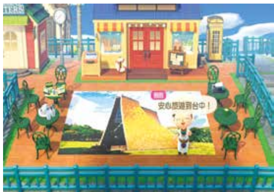
▲抽獎活動範例—東海路思義教堂