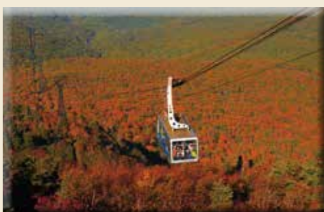
▲搭乘八甲田纜車只要10分鐘就能抵達山頂。

八甲田山為日本百大名山之一，海拔約1585公尺，針葉林、高山植物匯聚，綿延山巒也擁許多濕地景觀，9月下旬起進入紅葉期，搭乘八甲田纜車就能從高空中欣賞360度零死角的絕景，體驗被紅葉包圍的獨特感受，自山頂也能遠眺青森市街、陸奧灣、津輕半島及下北半島等地區。