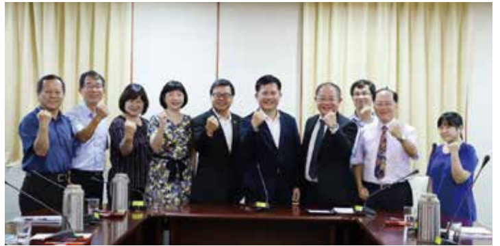
▲交通部部長林佳龍（左6）、交通部觀光局長張錫聰（左5）與觀光導遊協會理事長許冠濱（左7）、觀光領隊協會副理事長嚴從音（左4）等導遊與領隊代表們合影。