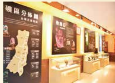
▲天億寶石博物館提供詳盡的介紹，讓顧客能輕鬆了解玉石的特色與奧妙。