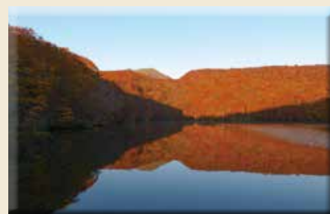
▲清透無比的鳶沼，周圍更有規劃完善的步道可漫遊。

鳶沼坐落於十和田八幡平國立公園內，10月下旬至11月上旬為紅葉最佳觀賞期，近年來以日出時分有機會目睹的絕景「鳶沼朝燒」而聞名，只要滿足晴朗無雲、日出前抵達與正值紅葉季節共3項條件，就有機會欣賞到紅葉倒映在鳶沼的壯麗景觀。