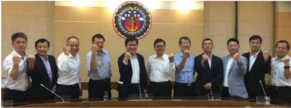
▲交通部部長林佳龍特別於6/20與旅行業代表進行座談會，一起為觀光市場振興努力。

觀光局自5/27啟動防疫旅遊踩線活動後，陸續輔導觀光產業辦理防疫旅遊踩線交流活動，已漸漸提升國人旅遊信心，也規劃自7/1起推出「安心旅遊國旅補助方案」，國民旅遊已漸漸復甦。