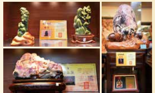
▲天億寶石博物館許多作品都曾榮獲精品獎的設計。