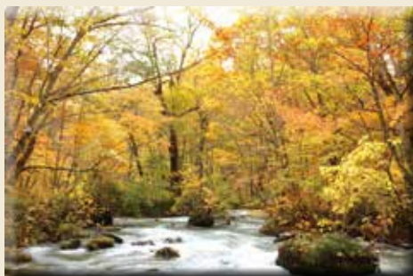
▲奧入瀨溪流進入秋季後逐漸轉變為金黃世界。

奧入瀨溪流不僅夏季期間一片翠綠景色迷人，10月中旬至10月下旬更會進入紅葉最佳觀賞期，由十和田湖子之口到燒山為止綿延約14公里之間，瀑布景觀與奇岩怪石不斷，無論健行或騎乘自行車沿途欣賞都相當推薦，自駕前往以外也能自JR青森站搭乘JR巴士，車程約2小時就能抵達，交通相當便捷。