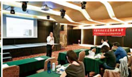
▲中華兩岸旅遊產學發展協會舉辦「旅行業職能精進及產業轉型培訓班」第4梯次中場課程，迴響熱烈。

趨勢發展與轉型準備、提升服務人員溝通與表達能力、臺灣海洋觀光產業初探、旅行業數位及精準行銷、旅遊與咖啡產業結合之方向與體驗等，甚至還有近年來非常熱門無人機操作介面解說課程、航拍攝影器材介紹及構圖美學運鏡技巧、空拍運鏡實操訓練等，讓學員滿載而歸。