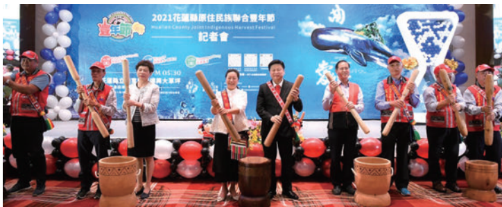
▲（左3起）花蓮縣政顧問（台灣旅遊交流協會理事長）賴瑟珍、花蓮縣長徐榛蔚、立委傅岷萇、立委鄭天財與花蓮部落頭目，共同邀請大家到花蓮參與熱情洋溢的原住民族聯合豐年節。

▶花蓮縣原住民族聯合豐年節活動記者會盛大舉辦，花蓮縣長徐榛蔚與貴賓們共同為此盛會站台對全台旅人發出邀請。