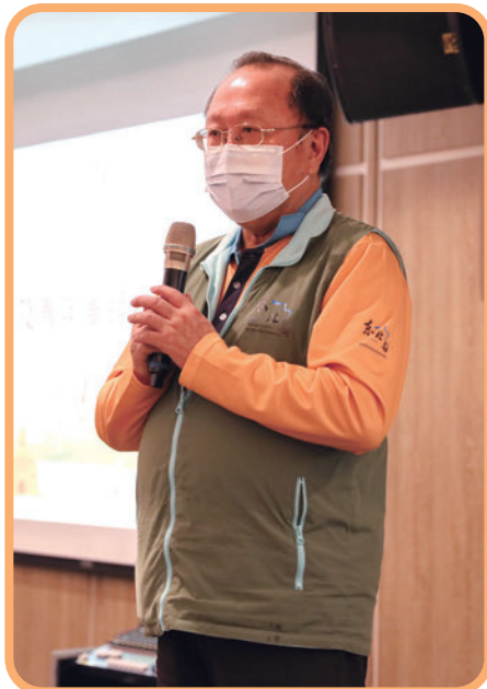
▲東北角暨宜蘭海岸國家風景區管理處處長馬惠達。