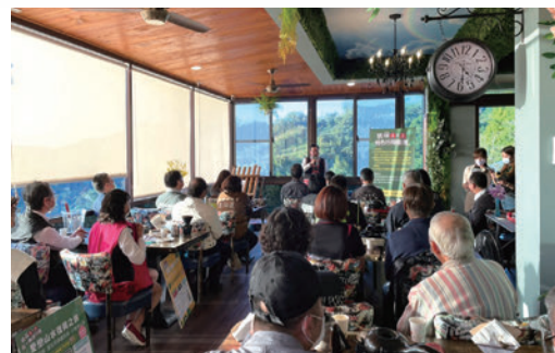
▲「民宿1+1特色行程優惠」請至桃園民宿管家學校官網 https://bnbcourse.tycg.gov.tw/ 。

目前桃園市民宿家數105家，以拉拉山、小烏來、大溪、龍潭區為明顯密集民宿區，附近皆有許多特色觀光資源，都相當值得大家造訪，「民宿1+1特色行程優惠」活動，由20家民宿業者合作規劃共11個方案，其中有9個住1晚送行程（價值1,000元起）及2個住1晚送1晚方案，即日起開放訂房，旅客擇定行程後自行向特定民宿訂房成功始可享優惠，共有1,000名額度。