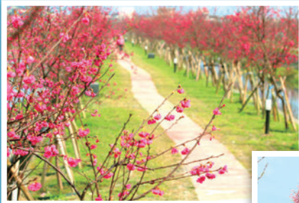
◀▼羅莊櫻花步道長約2公里，共種植了上千株的櫻花，墨染櫻、八重櫻、香櫻、山櫻花等多元品種，搭配一旁水圳、稻田的景致，成功吸引旅客目光。