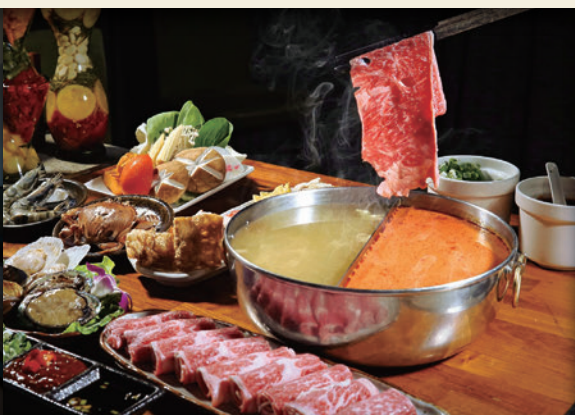
▲隨著秋冬的季節到來，位於東北角的福容大飯店福隆，也開始主打溫泉旅遊以及暖湯美食方案。