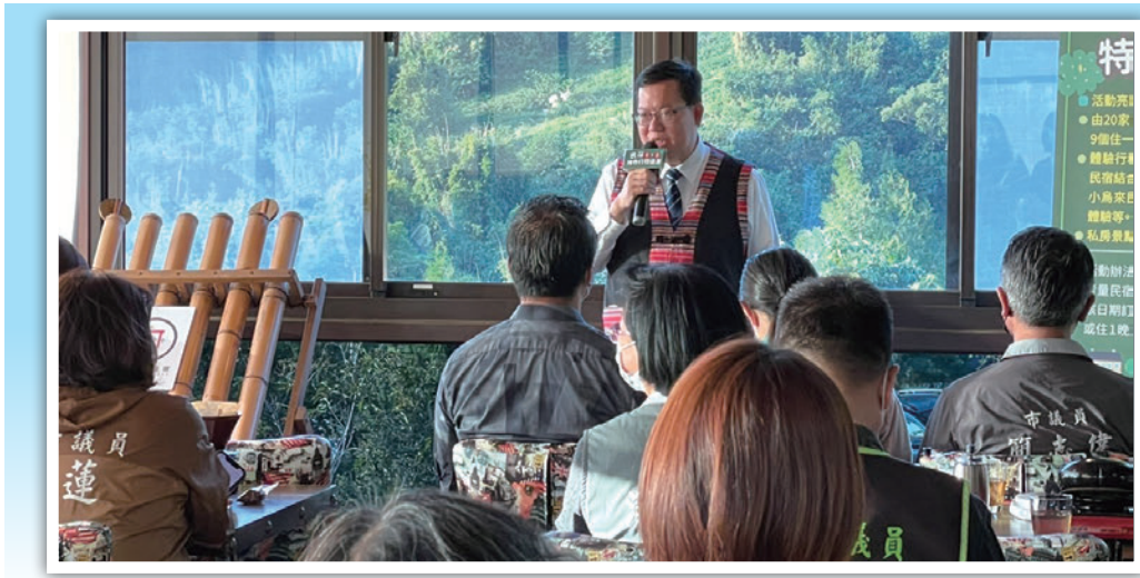
▲桃園市市長鄭文燦。

民宿扮演著帶領旅客認識桃園的重要角色，因此桃園市政府積極推動民宿的申設輔導，包括公告9個具人文或歷史風貌相關區域之都市計畫區，讓老街可以申設民宿，以及針對無法取得建物使用執照之特色老屋專案以合法房屋會勘方式，讓老屋也可成為民宿特色體驗，另亦針對復興區部落訂定「桃園市部落民宿辦理結構安全鑑定項目作業要點」，讓原鄉特色民宿可以安全合法經營。