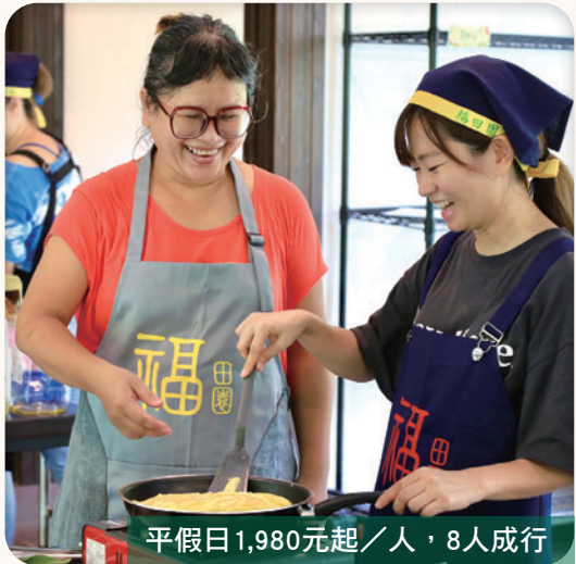
平假日1,980元起／人，8人成行