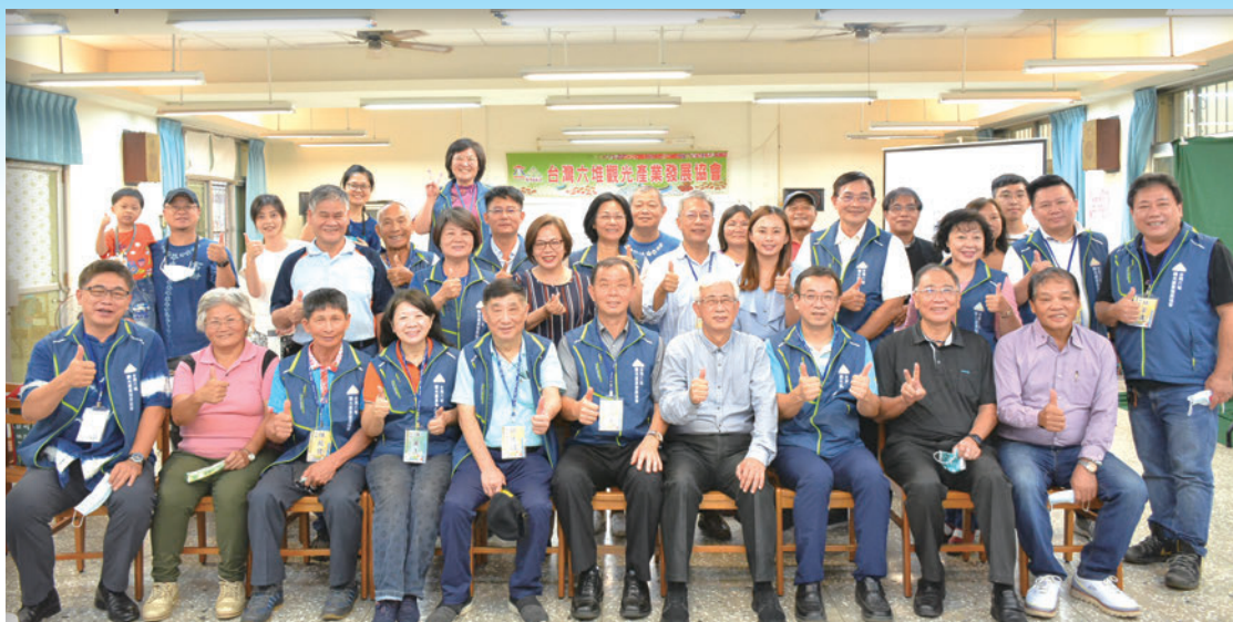
▲台灣六堆觀光產業發展協會舉辦第一屆第二次會員代表大會。

六堆是由左、右、前、後、中、先鋒所組成，其區域橫跨了高雄、屏東眾多鄉鎮，從最早因為客籍墾民大量聚集於此，加上1721年開始的朱一貴之亂，讓當地的居民們團結起來，以常態性的團練組織來維持地方治安與生存空間。也因為歷經了長達百年的大小戰事，使得六堆逐漸成為累積了豐厚的歷史底蘊，加上長期身居於此的客家人所衍生出的客家文化，都讓當地創造出與眾不同的模式。