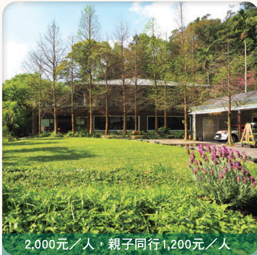
2,000元／人，親子同行1,200元／人