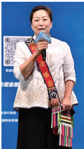
▲花蓮縣長徐榛蔚邀請大家到花蓮參與年度盛會。

▶花蓮縣原住民族聯合豐年節活動記者會盛大舉辦，花蓮縣長徐榛蔚與貴賓們共同為此盛會站台對全台旅人發出邀請。