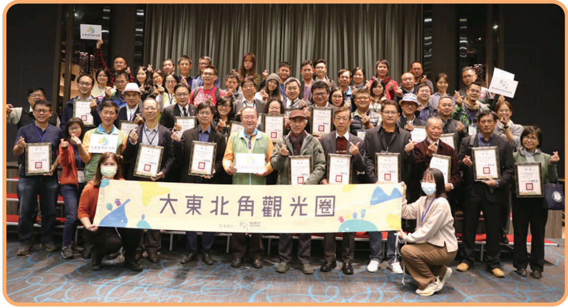
▲東北角暨宜蘭海岸國家風景區管理處，11／9在福容大飯店福隆辦理大東北角觀光圈顧問團與青年軍成立授証儀式。

交通部觀光局東北角暨宜蘭海岸國家風景區管理處（以下稱東北角風管處）11／9在福容大飯店福隆辦理大東北角觀光圈顧問團與青年軍成立授証儀式，邀請全體顧問團與青年軍成員出席，並授予聘書擔任大東北角觀光圈顧問和青年軍領袖，期盼未來藉由顧問團與青年軍挹注新動能，帶領大東北角觀光圈走向新的一頁。