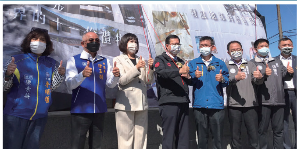
▲桃園市市長鄭文燦（左4）參與「十一份觀光文化園區」營運記者會。

桃園市政府與水利署北區水資源局合作，將十一份佳安市場、舊花園餐廳及北水局舊宿舍重新定位，延續老舊眷舍樣式獨特雋永的味道，活化利用並將周邊聚落景觀重新整治，成為「十一份觀光文化園區」。