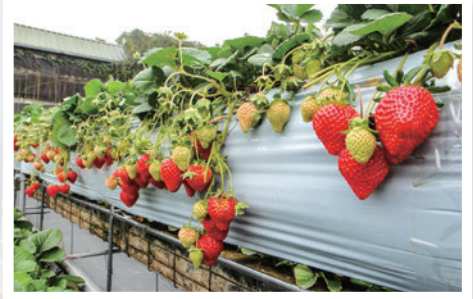
▲大湖鄉有「草莓王國」之稱，產季至每年11月至隔年4月，產量豐富、品質穩定，深受旅客喜愛。

苗栗縣政府拚旅遊商機，推出「苗栗旅遊節」消費抽獎活動，民眾只要於苗栗縣店家單筆消費滿500元，憑10/8至2022/2/28的發票或收據至官網登錄，就有機會抽中Luxgen URX休旅車、10萬現金、Gogoro電動車、iPhone 13、Coleman高級露營組及住宿券等價值千萬元之超級大獎，歡迎全台民眾「苗栗玩起來！」