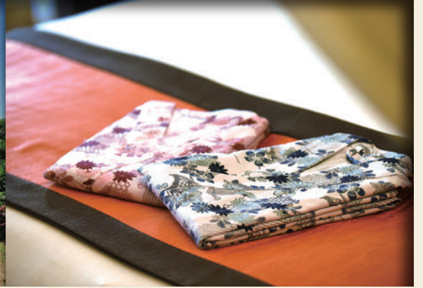
▲旅客可以換上日式浴衣，享受偽出國氛圍。