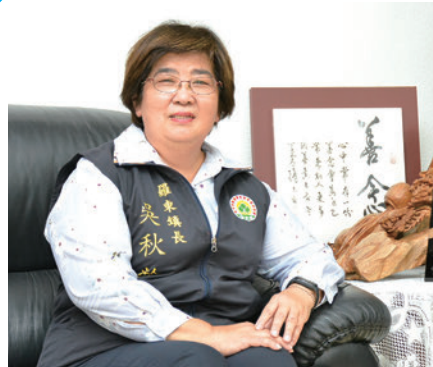
羅東鎮鎮長吳秋齡