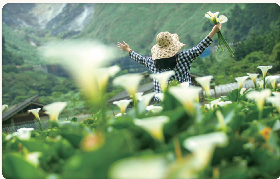
▲財福海芋田可以遠眺小油坑，除了賞海芋外，其他季節也能體驗置身於山嵐繚繞的仙境感受。

隨著國內的疫情逐漸趨緩、「嘉玲」持續重現，民眾再也按耐不住出遊的心思，雖然台北作為首善之都與國際知名城市，但其實現代化的都會生活背後，仍有許多精彩的農業旅遊點值得造訪。為此，財團法人台北市七星農田水利研究發展基金會與台灣休閒農業發展協會、臺北市休閒農業發展協會，將於11/20、21的週末期間，打造精彩的農遊市集，讓民眾感受遠離塵囂卻又大隱於市的農遊魅力。