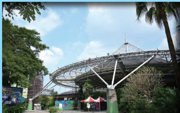
▲▲六堆客家園區是當地的旅遊亮點。

而協會則扮演著協助者的角色，並針對會員成員們的屬性進行分類出國旅市場或國際市場的取向，透過與觀光產業的合作，才能讓越來越多旅遊團走進六堆，甚至催生後續自由行重遊的旅遊意願，讓六堆的觀光市場持續加溫加熱。