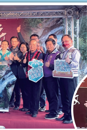
▲桃園市市長鄭文燦（前排中）參加「2021溫泉美食嘉年華—羅浮湯之旅」開幕活動。