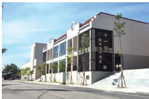
▲桃園市政府與水利署北區水資源局合作，將十一份佳安市場、舊花園餐廳及北水局舊宿舍重新定位，成為「十一份觀光文化園區」。

推廣「零塑園區」、「地產地銷」及「永續建築」的觀光文化園區。民眾來到龍潭旅遊除了吃活魚、賞美景外，更要來「一席食堂」嘗試「自製豆漿」、來香魚咖啡品嚐「洋流咖啡」、還能體驗手作課程、購買小農產品，提供民眾更多元的觀光服務外，並在週末及假日園區可以提供遊客導覽、手作體驗，培養在地文化人才，舉辦工藝課程與講座，提昇在地民眾對文化產業的興趣與接觸，歡迎所有大小朋友一起來參加。