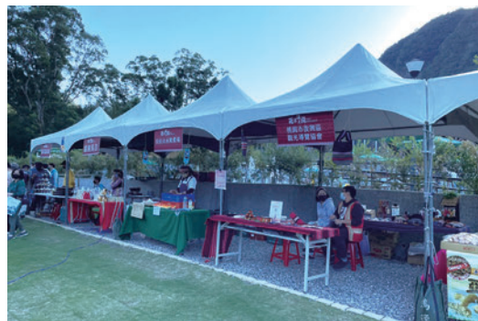
▲羅浮溫泉湯池對面的旅館區已經啟動細部計畫擬定作業，希望將來完成重劃後能引進觀光旅館進駐，帶動地方發展。此外，也將輔導民間設置溫泉民宿、原民市集等，帶動觀光發展。

羅浮溫泉湯池內建戶外6池大眾池，共可容納120人，溫泉泉質為碳酸氫鈉泉，亦即俗稱的「美人湯」，其中一SPA池設