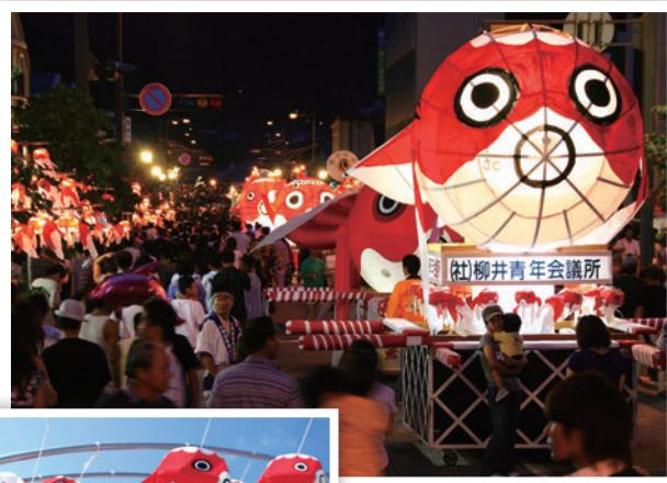
▲巨型金魚燈籠花車繞行市街，吸引遊客爭相拍照留念。

燈籠花車創意無限，每年造型都不盡相同，有些更會設置在轎子上由多人抬轎登場、進行高速旋轉等熱血表演。紅白相間、擁有圓滾滾大眼睛與飄逸長尾巴的柳井金魚燈籠，其誕生的靈感據說源於商人看到孩童憧憬青森縣弘前市的金魚睡魔燈籠而來，因此便採用金魚造型。竹製骨架黏上和紙做出燈籠主結構後，需要經過上蠟風乾、以當地傳統織物「柳井縞」的染料塗上紅色、裝上魚鰭與魚尾才算大功告成，造型可愛無比且蘊含傳承在地工藝的使命，為充分展現當地特色的傳統工藝品。