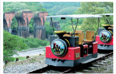
▲全台首創的舊山線鐵道自行車深受民眾喜愛，至今年底預估可突破130萬人次搭乘。