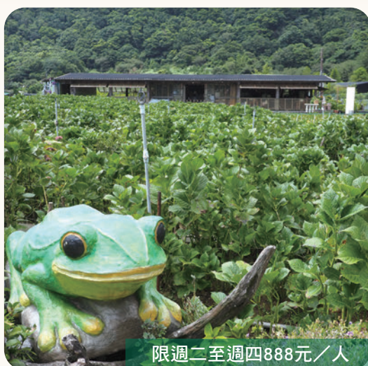
限週二至週四888元/人

個人杯裝飲料（200元以內）每人任選1杯+茶香炸物摩天輪（含炸茶葉、炸茶丸、季節炸物），以上行程原價：690元/2人。