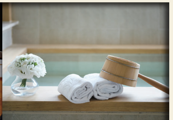
▲風呂系列客房設有泡湯池，引進的溫泉為在地探鑽的氯化物碳酸氫鹽泉。