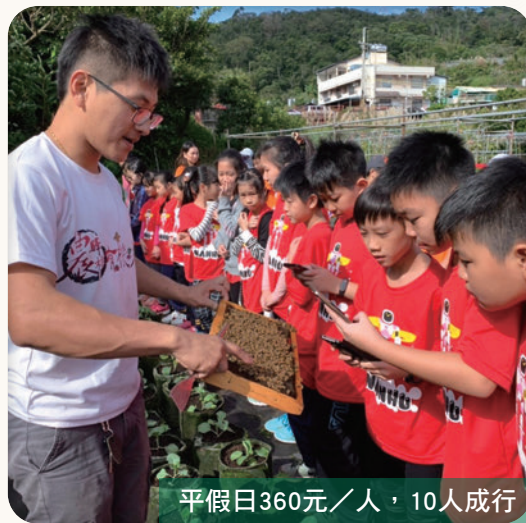
平假日360元／人，10人成行