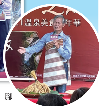
▼開幕活動先由在地泰雅族耆老吟唱泰雅古訓，邀請現場民眾與市長共同向天地祈福。

有氣泡床、腳底、臀部及背部按摩等設施，池區劃分還有兒童遊戲池、賞景池及水引流自小烏來溪流的冷水池，值得一提的是，來此泡湯不僅身體能夠感到放鬆，眼睛往遠方眺望也能看見桃園美麗的插天山群，除此之外，結合當地風味的法式溫泉蛋、馬告紅茶、馬告咖啡、檸檬汁、檸檬乾、甜柿、香菇及小米辣椒醬等，也是民眾不能錯過的美食佳餚。