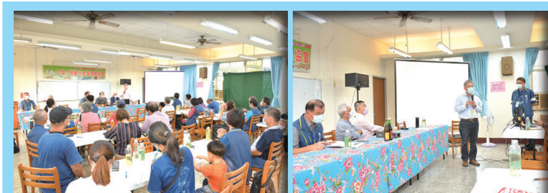
▲會員代表大會中特別安排各家會員進行分享，展現其特色與亮點。