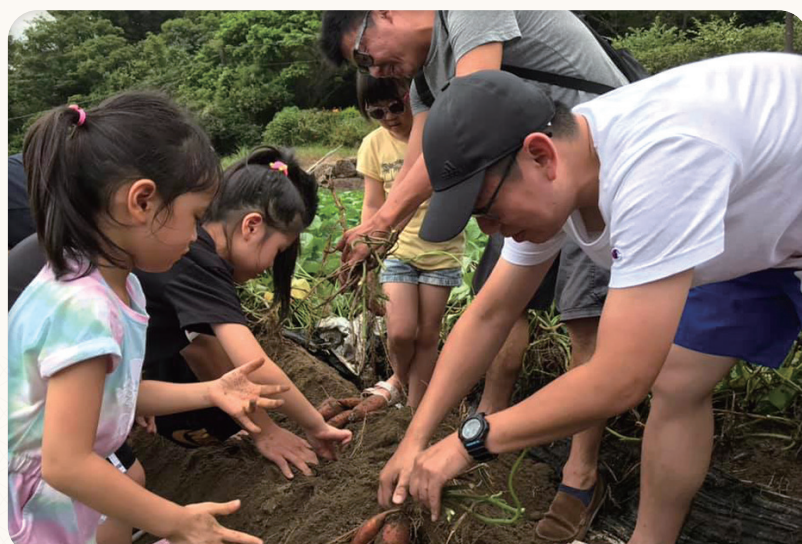
▲造訪清香休閒農場，大人小孩一同趣味體驗挖地瓜。