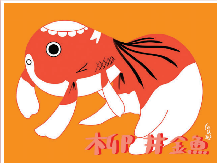
▲可愛無比的「柳井金魚燈籠」不僅能純欣賞，也有機會參加DIY親手製作。

山口縣坐落於日本本州最西側，相隔關門海峽與九州地區對望，無論自福岡機場、北九州機場延伸遊程，或是由廣島一路暢玩至此都合宜。交通便捷、串聯選擇性多元，且縣內擁有許多獨特美景與美食，使其成為近年來深遊日本、規劃自由行的熱門地點。幅員寬廣的山口不光只有河豚、角島大橋、元乃隅神社與錦帶橋等觀光資源，東南方的柳井市更是因可愛與兼具傳統工藝的夏日祭典「柳井金魚燈籠祭」聞名全國。為了讓遊客感受山口迷人魅力，即日起只要到訪新光三越各館的日本商品展會場，就有機會欣賞柳井金魚燈籠的可愛身姿！旅行同業日後若有任何山口縣觀光資訊需求，歡迎隨時洽詢向日遊顧問有限公司。