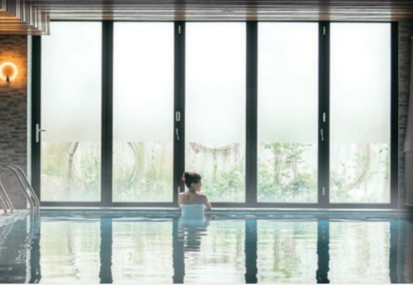
▲氯化物碳酸氫鹽泉能讓皮膚角質軟化、輕易地洗去污垢，讓皮膚古溜古溜的，故又稱「美肌之湯」。