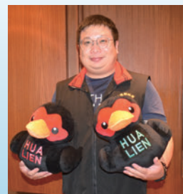
▲花蓮縣觀光處也在記者會現場熱推花蓮旅遊。