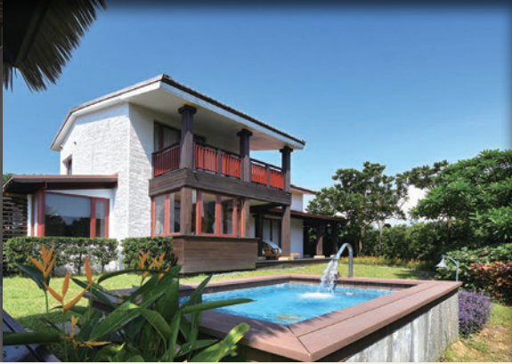
▲Villa區為高度不超過兩層樓的別墅群，沒有高樓大廈遮擋的低天際線，讓旅客可以充分舒緩壓力。