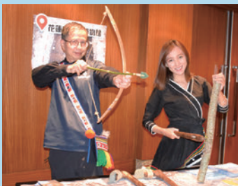
▲花蓮縣考古博物館帶領旅客穿越時空。