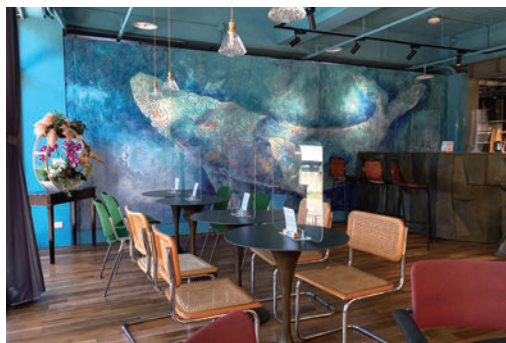
▲「十一份觀光文化園區」咖啡廳一景。

桃園市政府將「十一份觀光文化園區」委託民間業者「一習」經營，將園區定位為「以教育為基底的永續自然幸福生活推廣中心」，成為一座提供觀光、藝術及教育平台的園區，更是全台首創全區落實並