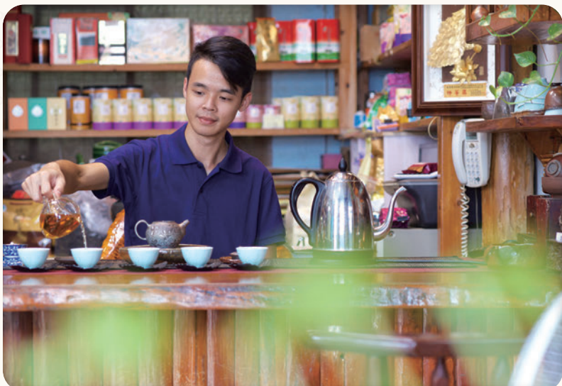
▲美加茶園位於貓空休閒農業區，悠閒品茶之餘，也可來親身體驗一日茶農。

此次由財團法人台北市七星農田水利研究發展基金會與台灣休閒農業發展協會、臺北市休閒農業發展協會，三方攜手整合台北市3大休閒農業區與大坑產業文化協會等轄下業者，讓「秋