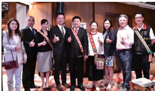
▲（右起）花蓮縣原住民行政處處長陳建村、旅館公會全聯會副理事長（花蓮怡園渡假村總經理）陳義豐、（右4起）花蓮縣長徐榛蔚、立委傅岷萇。