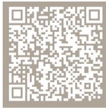
阿里山導覽解說報名連結