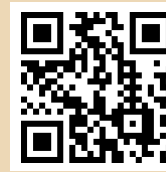
日本旅遊情報局官網