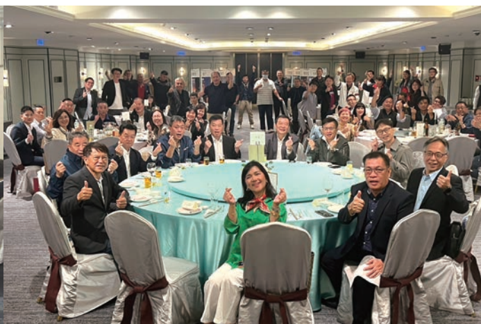
▲菲律賓觀光部台北分處分別於台北、高雄舉辦年末感恩餐會活動。