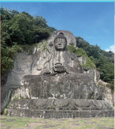
▲鋸山的大佛比鎌倉大佛還要巨大，慈祥的面容祈求著世界和平。

與鹿野山、清澄山並列為千葉3大名山的鋸山，在江戶時代曾是採石場，目前還可看到許多因採石造成的垂直峭壁，也因殘留的痕跡讓山壁看似一把鋸子，因此得名。前往海拔329公尺的鋸山山頂除了健行上山外，也可選擇直接開車至日本寺東口停車場或是搭乘「鋸山纜車」。鋸山纜車為千葉縣內唯一的纜車設施，全程僅4分鐘就能抵達山上，不過沿途能夠欣賞東京灣，這裡也被認為關東富士見100景，運氣好的話就有機會眺望到美麗的富士山。山上的日本寺有許多必看景點，包括能俯瞰總半島和東京灣的地獄展望台、雕刻在花崗岩壁上的百尺觀音像，以及高達31公尺的日本第1大巨型石佛像等，其他還有多達1,500多尊羅漢石像群等，境內遍布了許多佛像。此外，在纜車山頂站賣店也有充滿巧思的黑漆地獄包子、地獄霜淇淋等，增加旅行樂趣。