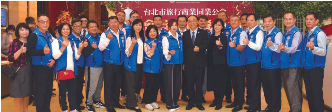
▲2023年會員歲末聯歡晚會特別邀請（前排左10起）交通部觀光署署長周永暉、組長湯文琦蒞臨會場。