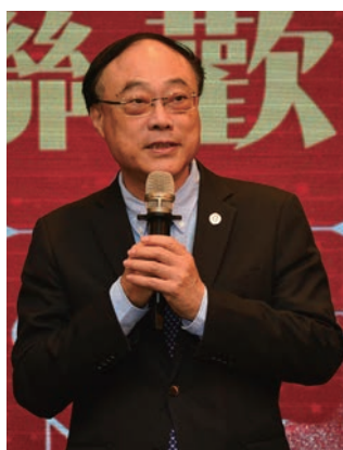
▲交通部觀光署署長周永暉。