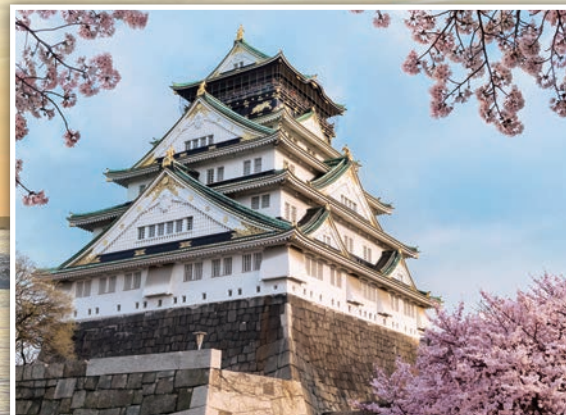
▲海上旅程結束後，剛好可以銜接日本櫻花祭。圖為大阪城櫻花盛開。