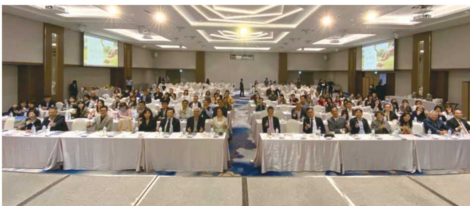
▲秧悅美地度假酒店舉辦「歲末感恩·共向永續旅遊」，邀請產官學界一同參與。