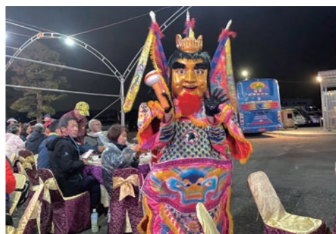
▲席間特別安排電音三太子表演，讓與會民眾感受傳統宮廟文化特色。