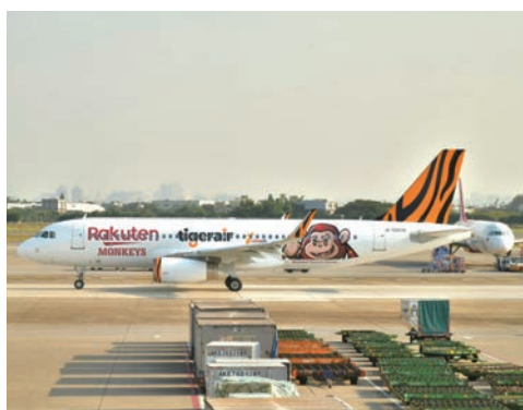
▲樂天聯名彩繪2號機正式起航。

繼2021年3月台灣虎航與Rakuten Monkeys推出首架聯名彩繪機，獲得各界熱烈迴響以來，台灣虎航12／8宣布與Rakuten Monkeys再推出聯名彩繪2號機，初次亮相即執飛桃園—新潟航線，為了慶祝聯名彩繪二號機首航，特別在桃園機場的候機室舉辦首飛慶祝活動，和搭乘首航班的旅客共同歡度這值得紀念的一刻。