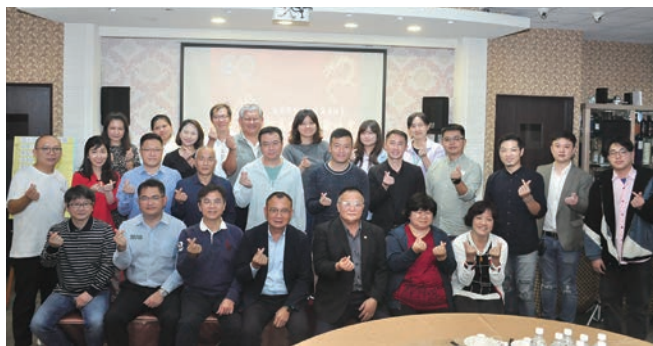
▲宜蘭縣觀光工廠發展協會理監事團隊合影。