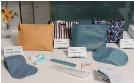
▲長榮航空豪華經濟艙長程航線提供義大利知名品牌FURLA及比利時流行品牌Kipling過夜包，陪伴旅客舒適度過長途飛行。

世界旅遊大獎（World Travel Awards）日前頒發年度大獎，星空聯盟成員長榮航空連續多年入圍評選名單，今年首度榮獲「亞洲最佳航空公司—2023年最佳豪華經濟艙（Asia's Leading Airline—Premium Economy Class 2023）」的肯定，同時星空聯盟也連續4年奪下「全球最佳航空聯盟（World's Leading Airline Alliance）」。