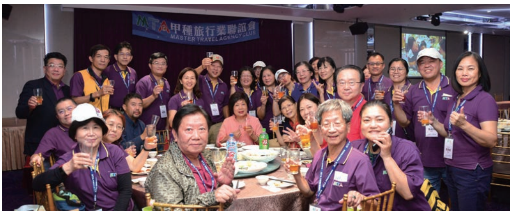
▲甲聯會於11/24~25舉辦「中彰雲嘉南感謝之旅」。