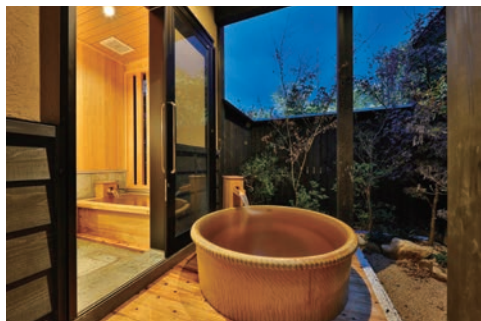
▲那須四季之館飯店全30間客房均配有露天浴池。

日本連鎖「四季之館飯店」限制國小以下孩童入住，專為成年人提供寧靜舒適的住宿體驗。目前在那須和箱根兩地營運，活用自然資源，並提供在地食材烹調的美食，療癒來訪客人。那須分館今年邁入5週年，客房均備露天溫泉浴池，另外還有公共半露天溫泉浴池與大浴場，讓顧客享受極致泡湯樂趣。晚餐以法式料理為主，選用當地食材烹製，早餐則採用自家農園的新鮮蔬果和那須御養蛋，提供豐盛美味用餐體驗。