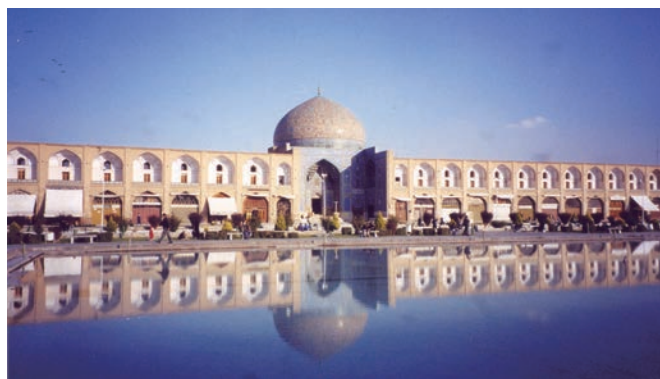
▲伊斯法罕舊國王廣場。

在《從旅行看世界風情》的結尾後序中提到「活在當下，把握出國機會」。綜觀近20年的旅遊業動盪，2003年爆發SARS、2008年金融危機、2010年冰島火山爆發、2020年新冠疫情、2022年烏俄戰爭、2023年以巴戰爭等，不僅導致古蹟文物損壞、在地文化逐漸式微，對全世界觀光產業更是造成劇烈的影響，因此鼓勵民眾持續創造旅遊價值，把握能出國的機會，收穫無限的旅遊回憶。