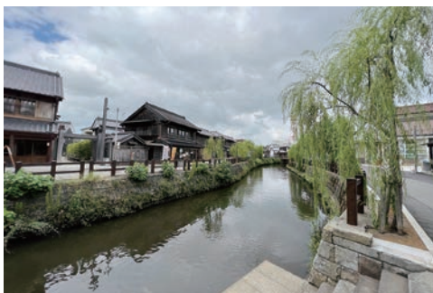
▲佐原的小橋流水及老街風貌，很適合穿和服拍照。

位於香取市的佐原地區，在江戶時代為利根川水運的物資集散地，因此繁榮起來。昔時商人的住宅及倉庫等老建築，都保持原貌保留下來，現今入列為傳統建造物保存地區。踏入此地彷彿穿梭時光隧道，來到古代日本，因此這裡又被稱為小江戸，也吸引過許多電視劇組前來拍攝。傳統的古民宅目前仍保有50間左右，其中約有10間被改裝為法式、義大利餐廳與咖啡館，相當具有歷史風韻。在水鄉佐原最能體驗當地氣氛的，首推搭船悠遊小野川，在沿岸垂柳吹拂下，聽著船夫介紹兩岸歷史建築，透過不同視角更能欣賞佐原之美。逛累了可以來佐原町屋館，這是仿照周邊傳統房屋打造的觀光休息區，明亮的木造建築內設有咖啡店、美甲店及和服體驗店等，還有販售當地物產的甜點。