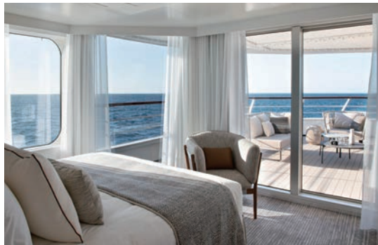
▲卡地亞號由法國知名設計師Jean Philippe Nuerl打造。