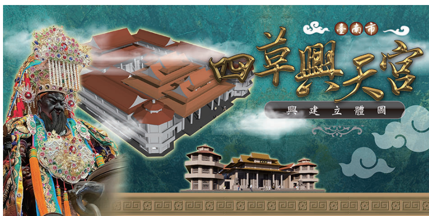
▲四草興天宮未來將會持續擴大，以迎接更多旅客及香客。