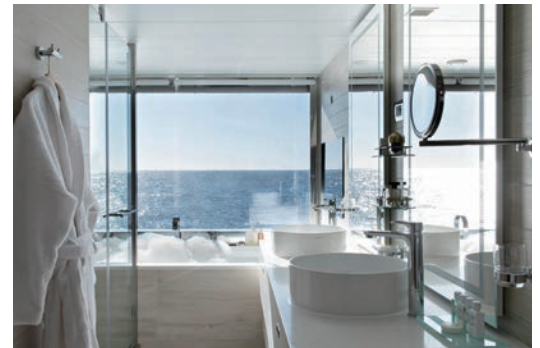
▲舒適奢華的個人浴池，可將廣闊的海景一覽無遺。