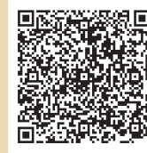
旅奇週刊官方網站

中華郵政臺北誌字第825號執照登記為雜誌交寄 本刊圖文版權所有，未經同意不得轉載或翻印！ All rights reserved.