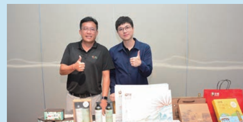
★果然茶香（左）、老楊方程式（右）