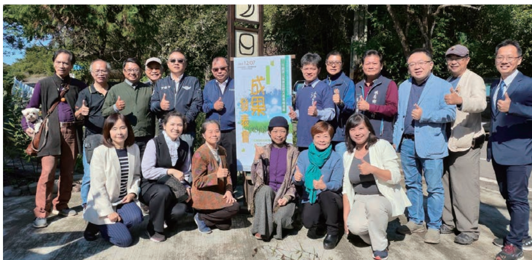
▲交通部觀光署參山風景區管理處協助峨眉鄉十二寮社區推動「時光生態村」於12/7舉辦成果發表會。