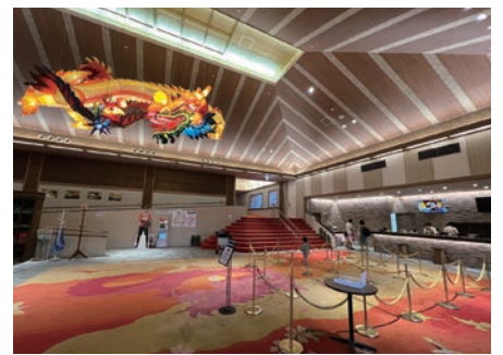
▲龍宮亭大廳中裝飾著象徵幸運及和平的龍鳳花燈。

位於木更津地區的三日月溫泉飯店龍宮城就位於東京跨海公路附近，交通非常便利。龍宮城分為3棟，分別為富士見亭、龍宮亭以及溫泉SPA棟，全部的客房皆為海景房，且空間十分寬敞。富士見亭全部有219間客房，每間都附有露台及半露天浴池之外，還有頂樓露天溫泉，能夠從40公尺高瞭望東京灣及周邊景色。龍宮亭則是以童話中的龍宮城為意象打造，彷彿置身海底世界的祭典一般，各種充滿童趣的設施如小朋友專用的充氣樂園、大人也喜愛的懷舊遊樂場等，絕對會令人玩到流連忘返。溫泉方面，館內共有60種以上的溫泉設施，包準泡到不亦樂乎；室外則是超貼心的溫水游泳池，即使天候稍涼也都能在戶外邊享受東京灣景色邊戲水；夏天限定的漂漂河長達250公尺，也是非常受歡迎的設施之一。餐點部分則是大量使用千葉產的食材，提供親子都喜愛的自助餐料理。