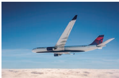
▲台北至西雅圖的每日直飛航線將由空中巴士A330-900neo運行。

達美航空將在明年夏季進一步擴大其亞洲航線網路，於2024/6/7正式開通從台北桃園國際機場（TPE）直飛西雅圖（SEA）的航班，此計畫尚待政府核准中。這條台北至西雅圖的每日直飛航線將由空中巴士A330-900neo運行，提供套房式「達美至臻商務艙」、達美尊尚客艙、「達美優悅經濟艙」、經濟艙共3種客艙、4種座椅體驗，讓客戶在飛越太平洋旅行時，可以尊享達美一流的服務和獨特的機上體驗。