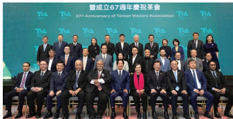
▲台灣觀光協會舉辦捐贈人茶會暨成立67週年慶祝茶會，活動現場貴賓雲集。

台灣觀光協會12/13舉辦67週年年會，賴清德、行政院副院長鄭文燦、交通部部長王國材、交通部觀光署署長周永暉、多位駐台大使、代表、與近300位觀光產業經理人共襄盛舉。會中邀請中華文化總會秘書長李厚慶及全球永續旅遊委員會總經理岳湖進行專題演講，盼持續與觀光業界積極爭取國際客源，籌備未來！台灣觀光協會會長葉菊蘭表示，根據聯合國世界觀光組織最新報告指出，今年全球國際旅客人次可望達13億人次，恢復至疫情前的9成。期盼在觀光署升格後，能夠落實觀光主流化，成立行政法人專責觀光國際推廣工作，並設立觀光研訓院，分析境內外的市場脈動，精準布局觀光市場策略，帶動台灣觀光的永續發展。