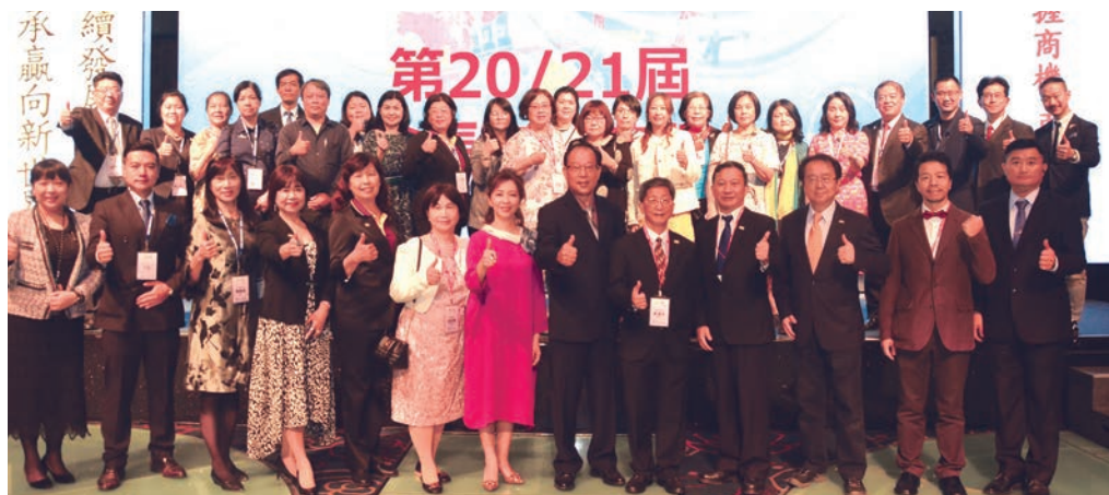
▲甲聯會於12/11舉辦第20 & 21屆會長交接典禮。