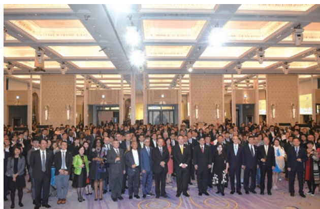
▶ 「2023年泰國國慶、蒲美蓬先王陛下冥誕紀念日及泰國父親節酒會」邀請到台泰雙邊經貿、觀光產業代表齊聚。

為了歡慶泰國國慶，泰國貿易經濟辦事處 (Thailand Trade and Economic Office) 特別於12/4假台北文華東方酒店，舉辦「2023年泰國國慶、蒲美蓬先王陛下冥誕紀念日及泰國父親節酒會」，晚宴中台泰雙邊的政商、觀光產業皆蒞臨，一起慶賀泰國重要節慶。