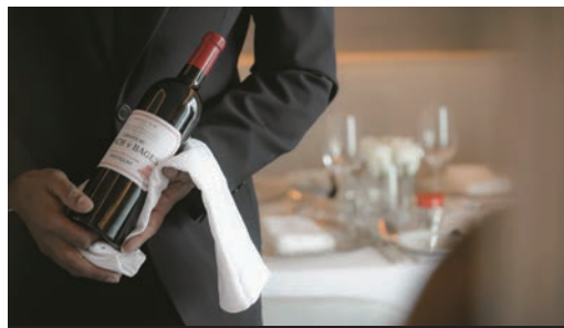
飲酒過量，有害健康