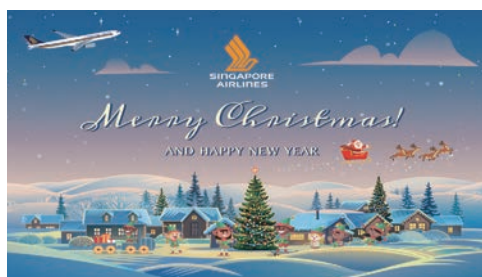
▲新加坡航空推出KrisMas聖誕獻禮，以優惠票價和專屬好康開始規劃2024年的旅程。

新加坡航空推出KrisMas聖誕獻禮，讓旅客迎接聖誕與新年假期，以優惠票價和專屬好康開始規劃2024年的旅程。機票銷售日期自即日起至2024/1/2，前往新加坡每人經濟艙來回含稅票價9,698元起、印度17,078元起、澳洲22,608元起，以及聖誕獻禮亮點—馬爾地夫28,328元起。KrisFlyer會員於機票銷售日期前完成開立自台北出發前往新航之所有航點，在此期間內於官網SingaporeAir.com或SingaporeAir行動APP以最高6折加購Forward Zone Seat座位，讓飛行旅途更加舒適便利。