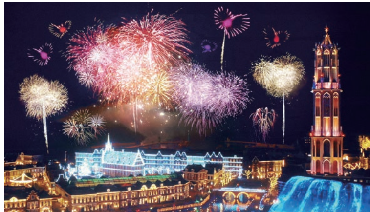
▲豪斯登堡聖誕煙火大會在票選活動中人氣第一。