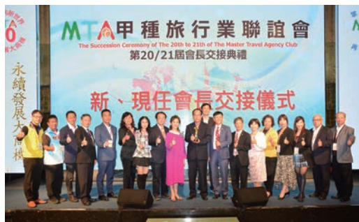
▲邀請北、中、南區歷任會長一同見證交接儀式。