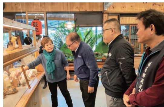
▲透過交通部觀光署參山風景區管理處與在地業者的深度挖掘，讓台灣觀光蛻變出更多元的面貌。