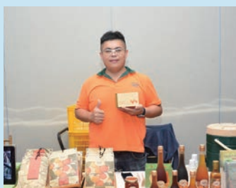
★民雄金桔觀光工廠