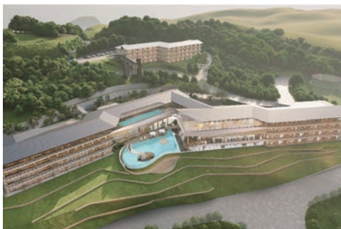
▲預計落座於鳥取砂丘西側的豪華精選酒店外觀示意圖。

萬豪國際集團攜手不動產開發商「dhp都市開發」，計畫在鳥取砂丘西側興建旗下高端品牌的「豪華精選酒店」，預計於2026年開幕。飯店由2棟4層樓的建築所構成，總計108間客房，房內均可欣賞到砂丘和日本海景，部分客房設有露天溫泉，頂樓設置溫浴設施及泳池等設備。此為日本國內第6間豪華精選酒店，也是山陰地區第一座5星級飯店渡假村。雖然目前飯店名稱尚未定案，但預計成為下一個住宿新亮點。