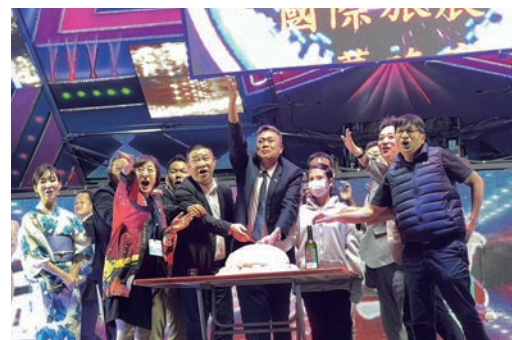
▲大台南國際旅展結束後特別設流水席宴請參展單位，讓大家都能一同體驗台灣傳統辦桌文化。

色。廟內除舉辦每年例行的點燈、普渡、中秋烤肉等活動，還有宮廟年度盛會「關聖帝君平安福宴」，於每年農曆6/24前後的時間舉辦，不僅會席設168桌宴請香客，同時結合與宗教、陣頭文化相關表演，展現台灣在地文化之精髓。