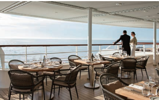
▲在龐洛郵輪上，法國餐高水準的視覺與味覺盛宴，天天呈現！