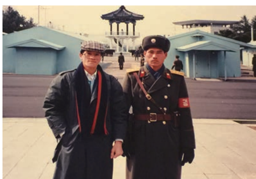
▲於板門店和北韓軍人合影。