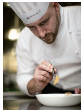
▲餐廳由摘下18顆米其林星星的傳奇主廚Alain Ducasse，設計料理。

除了主廚Alain Ducasse的餐廳，《Ducasse Conseil》之外，還有法國知名品牌Lenôtre參與，為旅客帶來法式甜點和麵包的極致享受。吳再裕強調，其中波迪手工奶油，1塊就高達半隻頂級龍蝦的價格，顯示龐洛郵輪的用料毫不手軟，就是要給客人最奢華的享受。