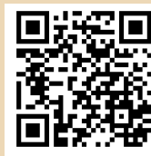
日本旅遊情報局粉絲團