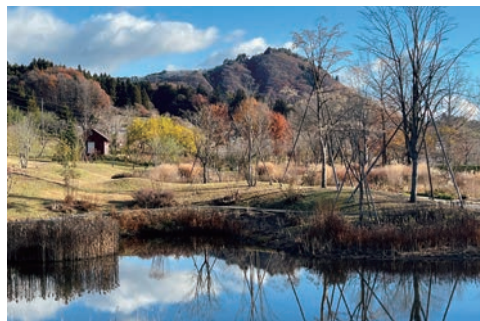
▲中之条花園冬季景色。

群馬縣「中之条花園」從12月起至隔年2月為止，開放冬季免費參觀，希望能藉此吸引遊客，同時促進中之条花園商店與美野原食堂的消費。以往冬季入園全票為300日圓，並贈送園內消費300日圓優惠券，今年調整部分營運方式，開放免費入場的同時也取消發放優惠券，3月開始則根據花季調整票價，最低300日圓起。開放時間亦有改動，除了原本的新年假期（12/27~1/5）外，新增每週四及國定假日的隔天休園。