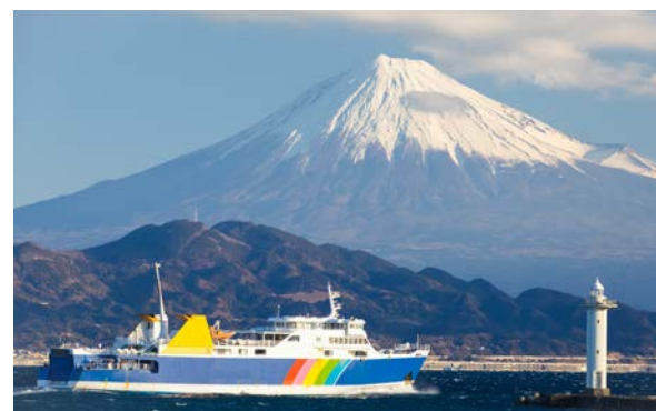
▲大井川線是日本現存僅有的Abt式鐵道，因此又暱稱為「南阿爾卑斯Abt線」。▲搭乘駿河灣渡輪，可從船上觀看的雄渾壯美富士山一覽無遺。