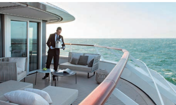
▲如果想要悠閒的在房間露台享用Room Service也不成問題。