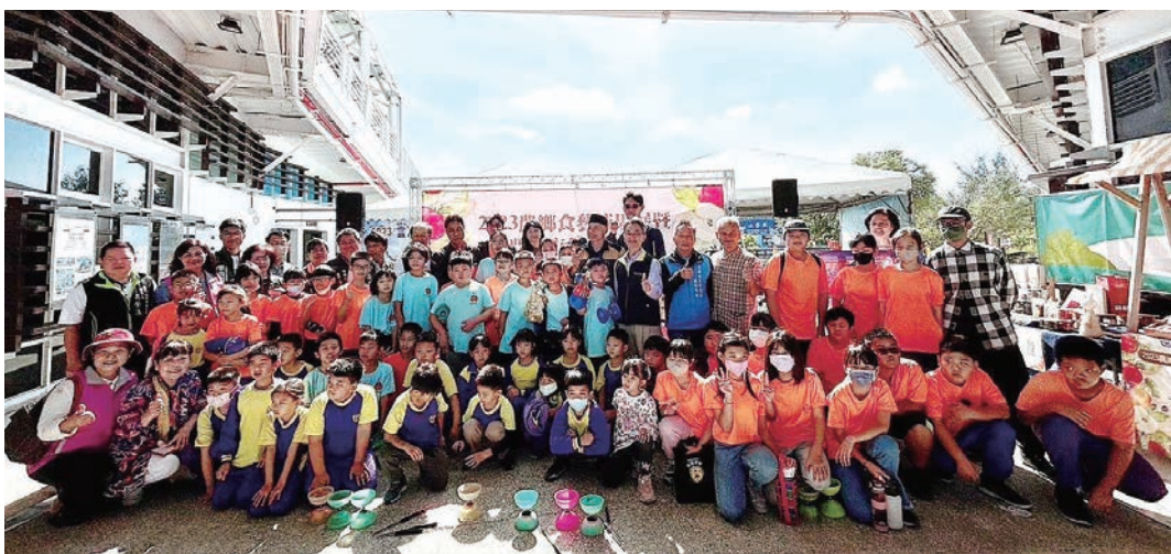
▲2023農鄉食藝成果展暨農遊市集辦理及清真認證證書頒發活動，邀請在地學童帶來精彩表演為活動拉開序幕。

「2023農鄉食藝」成果展暨農遊市集辦理及清真認證證書頒發活動，於12/5假雲嘉南濱海風景區管理處—口湖遊客中心隆重登場，現場邀請到雲林縣政府農業處處長魏勝德、交通部觀光署雲嘉南濱海風景區管理處處長許宗民、口湖鄉金湖休閒農業發展協會理事長陳玄茂及立法委員等貴賓共襄盛舉，以及22家農漁業者參與展售，並由崇文國小學童以布袋戲表演帶入主題介紹，為精彩活動拉開序幕。