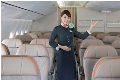
▲長榮航空日前榮獲世界旅遊大獎（World Travel Awards）頒發「亞洲最佳航空公司—2023年最佳豪華經濟艙（Asia's Leading Airline—Premium Economy Class 2023）」的肯定。