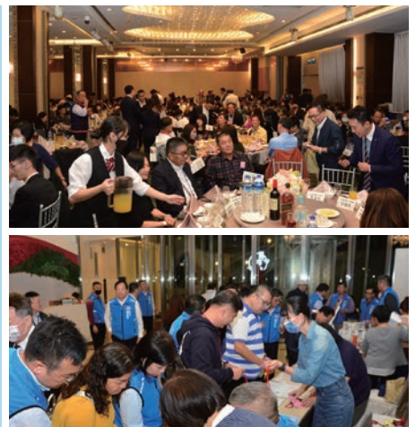
▲歲末聯歡晚會人數眾多，現場熱鬧不已。