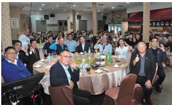
▲宜蘭縣觀光工廠發展協會舉辦歲末感恩聯歡晚會，現場嘉賓雲集。