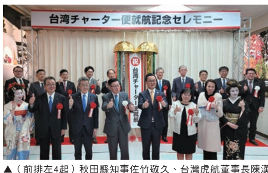
▲（前排左4起）秋田縣知事佐竹敬久、台灣虎航董事長陳漢銘、交通部觀光署駐東京辦事處主任鄭憶萍等貴賓共同歡慶首航儀式。