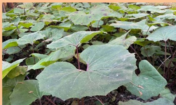
▲款冬比較圖，左為日本款冬、右為台灣款冬。