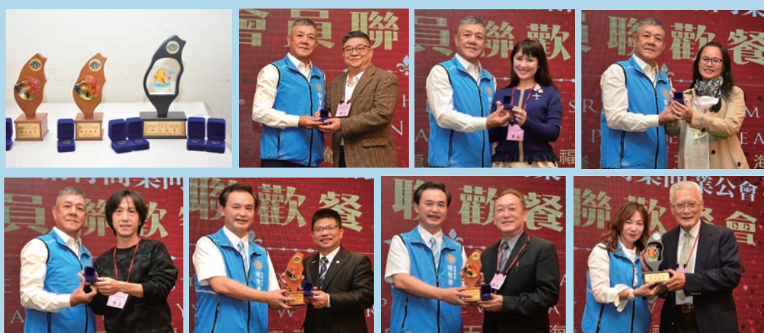
◀特別致贈獎牌表揚台北公會資深會員在旅遊業界的持續努力。