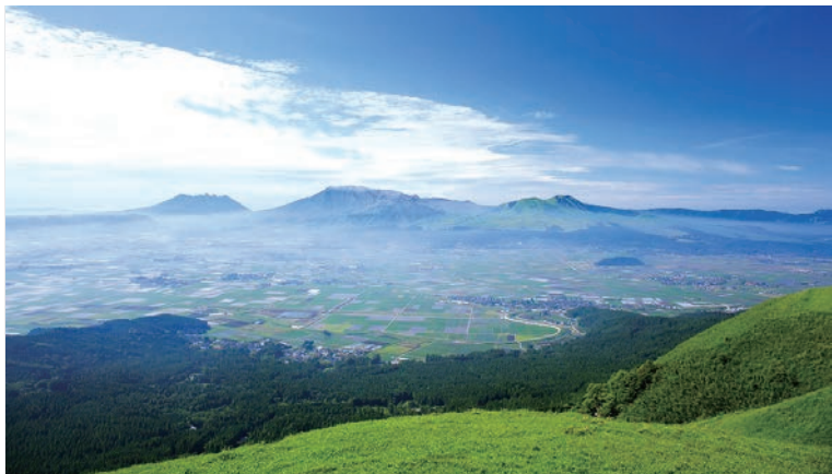
▲阿蘇市熱門景點「大觀峰」絕美風光。

為積極提升熊本觀光旅遊的便利性，作為「熊本型觀光MaaS」計畫的一環，熊本縣與當地觀光連盟合作推出連結阿蘇車站及當地熱門景點「大觀峰」的期間限定直達巴士，每日提供3班次。巴士的運行期間從11/11起至明年3/23，於週末及國定假日行駛（12/25~2024/1/5停駛）。時刻表配合觀光客的行程安排，首班車安排在早上，方便飯店退房的旅客使用；第2班與JR特急「阿蘇男孩號」到站時間配合，提供旅客轉乘服務；第3班車則配合阿蘇市內飯店入住時段；前2班車回程亦可在「Aso Milk Factory」下車。直達巴士來回車資為1,000日圓，孩童則半價，比路線公車還要便宜的價格也相當具有吸引力。