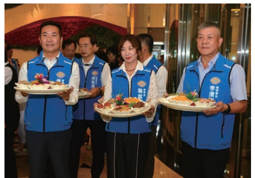
▲特別安排理監事團隊親自為會員上演「端菜秀」，以感謝一年來大家的陪伴與支持。