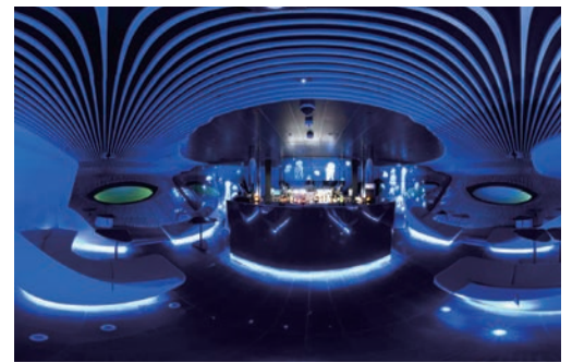
▲藍眼 (The Blue Eye) 酒吧位於水下，可以欣賞神秘的海底世界。