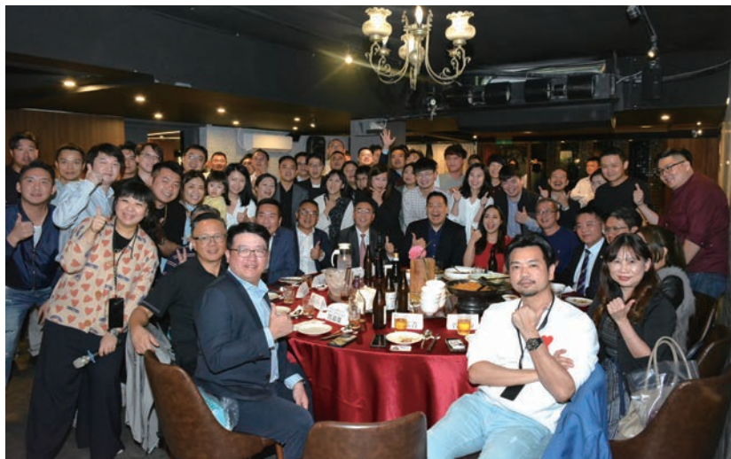
▲旅遊業二代聯誼會於12/12舉辦會長交接。