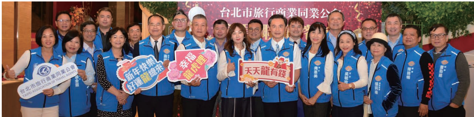
▲台北市旅行公會理監事團隊合影。