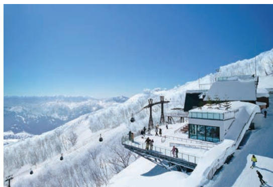
▲北海道星野TOMAMU度假村提供高達價值3萬日幣的優惠。

每日飛航2~4班，峴港、吉隆坡、檳城、雅加達、峇里島為Daily，以掌握泰國、越南觀光與商務客運市場，加強東南亞轉機北美的航網佈局。在中國大陸航線方面，