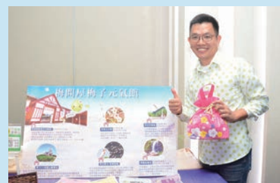
★梅問屋梅子元氣館