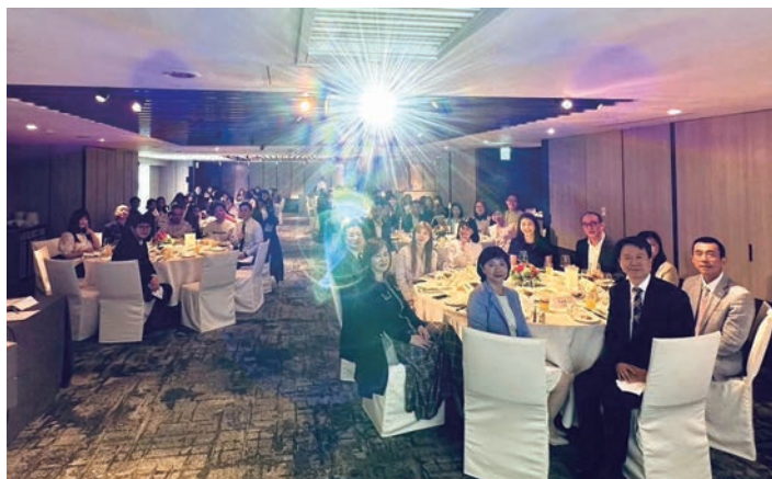
▲韓國觀光公社台北支社舉辦「訪韓獎勵旅遊、優秀旅遊商品支援制度及郵輪旅遊說明會暨年度頒獎」，廣邀合作夥伴們一起歡慶年末將至、2024青龍年即將到來。

為了協助旅遊同業們拓展市場，韓國觀光公社台北支社近來積極推動優秀商品制度，加上過去長期推動的獎勵旅遊支援等輔助，以及火熱的郵輪旅遊等，目的都是期盼提供旅遊夥伴們更多元的操作利基。