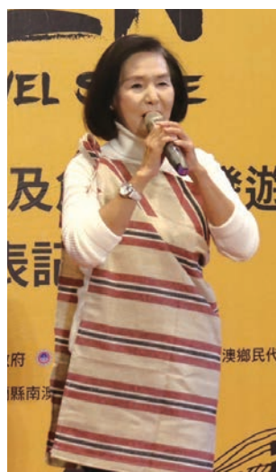
▲宜蘭縣縣長林姿妙。