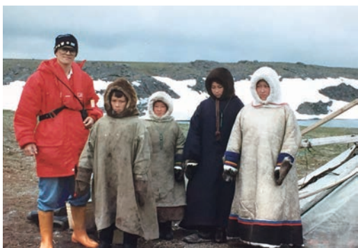
▲蘇三仁足跡踏遍5大洲7大洋，走訪超過150個國家。