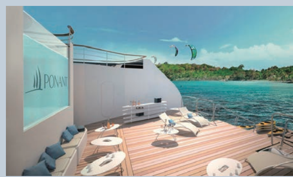
▲廣闊的戶外甲板區，讓旅客可以自由體驗各式海上活動。