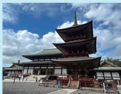
▲成田山新勝寺的三重塔裝飾華美，為國家指定重要文化財。

距離成田機場15分鐘車程的成田山新勝寺，擁有千年以上的歷史，是日本屈指可數的靈場，光是新曆元年旦起的3天內就會湧入3百萬人次前來參拜，全日本僅次於明治神宮。夏季時也會舉辦成田祇園祭，各種花車隊伍穿過參道遊行在城市內，人聲鼎沸的活動也吸引不少人潮，總計1年有超過千萬旅客來訪，集客力極為驚人。成田山新勝寺不僅歷史悠久，境內的三重塔、仁王門等許多建築都已被列入日本國家文化遺產，其中懸掛著大紅燈籠的仁王門魄力可不亞於淺草寺。除了寺廟本身外，寺廟旁的成田山公園占地16.5公頃，四季皆有不同風景，其中2月的梅祭及紅葉也很受歡迎。從JR成田站出來前往成田山新勝寺的參道兩旁林立著特產店、旅館等，購物十分方便外，還有必嘗的鰻魚料理等，成田山新勝寺可說是成田機場旁最具觀光魅力的景點。