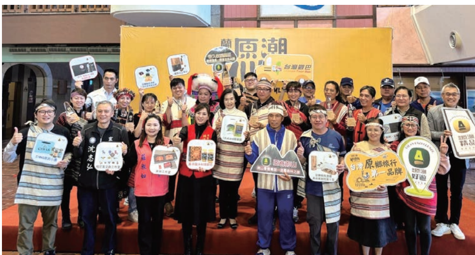
▲宜蘭縣政府辦理徵選10大原住民精品伴手禮及部落創新遊程開發，讓更多人看見宜蘭縣的「原」動力。