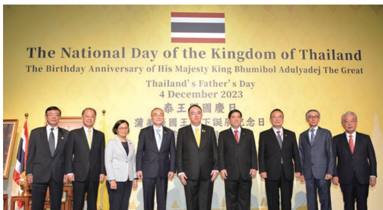
◀ (左4起) 退輔會主委馮世寬、泰國貿易經濟辦事處代理代表馬化欣、外交部常務次長陳立國與貴賓合影。