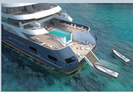
▲船尾提供小型遊艇，便利旅客探訪更深入的島嶼密境。