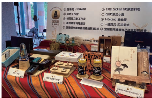
◀10大原住民精品伴手禮展現宜蘭在地文化與人文魅力。