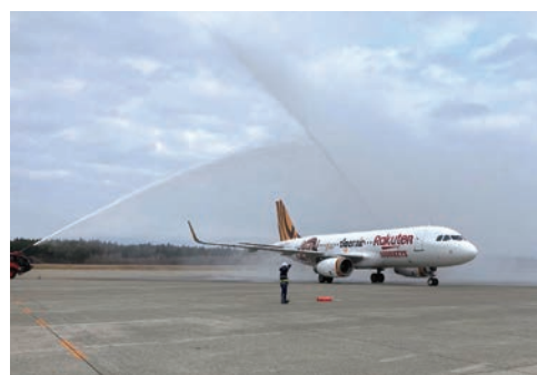
▲秋田機場安排灑水慶祝儀式迎接首航班機。

邁入日本的秋冬旅遊旺季，台灣虎航12／10正式開航桃園—秋田航線，也是繼開航桃園—高知航線後，飛航日本的第18個航點。