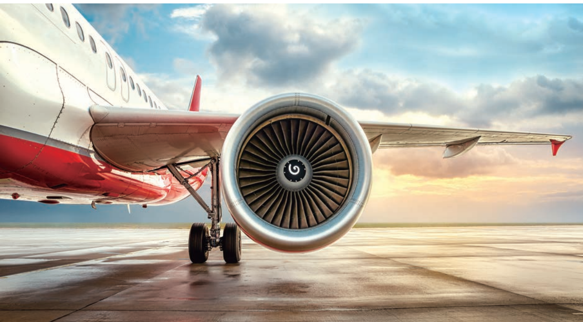
▲隨著消費者的意識抬頭，促使著越來越多航空公司投入永續的環保行列，其中SAF成為目前最佳解方之一。

客運人數則達到94億人次，超越2019年的92億人次，成長幅度達到102.5%。