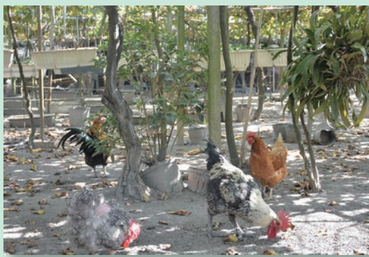
▲鵬群頂酒莊採用獨特的「有雞葡萄栽植」方式，充滿了巧思與趣味。