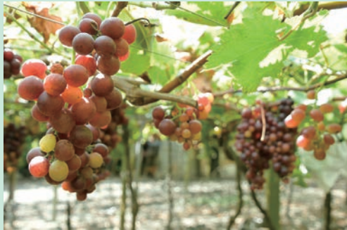
▲多樣性的釀酒葡萄，讓鵬群頂酒莊被譽為「台灣葡萄露天博物館」。