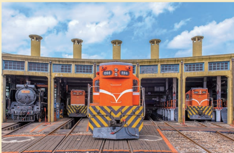
▲超過百年歷史的扇形車庫是台灣目前仍在運行的「火車頭旅館」。