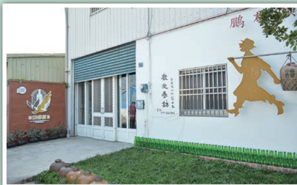
◀鵬群頂酒莊可說是彰化二林代表性的酒莊之一。