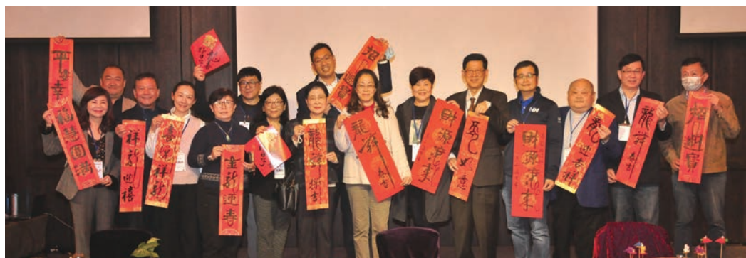
▲中華兩岸旅遊產學發展協會監事團隊合影。

中華兩岸旅遊產學發展協會1/30假君品酒店，舉辦第5屆第3次會員大會暨年終感恩餐敘，活動還特別邀請茶藝、書法、捏麵人、人像剪紙等傳統民俗技藝專業老師到場，於現場展示精深技藝，更安排有獎徵答、好禮抽獎等活動，讓參與貴賓與會員在歲末同歡。