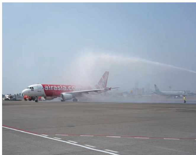
▲AirAsia於2/2開闢高雄-曼谷航線，讓台灣旅客輕鬆赴泰旅遊。

泰國觀光局台北辦事處與亞洲航空(以下簡稱AirAsia)合作，於2/2在高雄小港機場正式首航高雄-曼谷航線，這是AirAsia自疫情後從台灣出發的第9條國際直飛航線，也是高雄目前唯一直飛曼谷的低成本航空，希望藉此帶動南台灣的經濟發展，以便宜的价格輕鬆前往泰國曼谷旅遊。