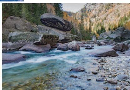
▲可可托海是哈薩克語，意思是綠色的叢林的美譽。