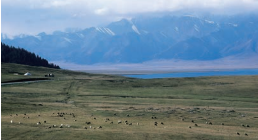
▲賽里木湖是新疆海拔最高、面積最大、風光秀麗的高山湖泊。

此外，友泰旅遊打造的新疆之旅中，旅客將探訪多樣西北地區獨特的自然奇景和文化名勝。行程首站是可可托海，這座被譽為亞洲最大高山湖泊，湖光山