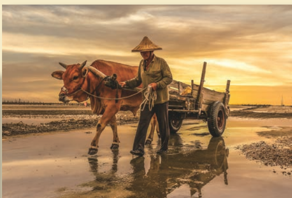
▲濱海生態景觀的芳苑鄉是體驗純樸自然風景不可錯過的景點，圖為王功知名的夕陽時分。