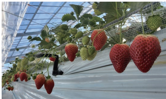
▲震災後從土耕栽培改為高架栽培的草莓，也更適合觀光發展。

東日本大地震後，宮城縣主要生產草莓的亘理町及山元町遭受到莫大波及，高達9成的栽培設施都被破壞。震災後，在當地農會及農民等的努力下，雖然農地被海水滲透，但改為導入溫室高架栽種方式，即使成本較高，但少了風雨等自然災害，幾年下來不但平均產量超越震災前，連品質都隨之提升，也讓仙台草莓（仙台いちご®）這個品牌在市場上更為受歡迎。除了內銷之外，也擴大販售通路，成功將仙台草莓（仙台いちご®）推上國際舞台。