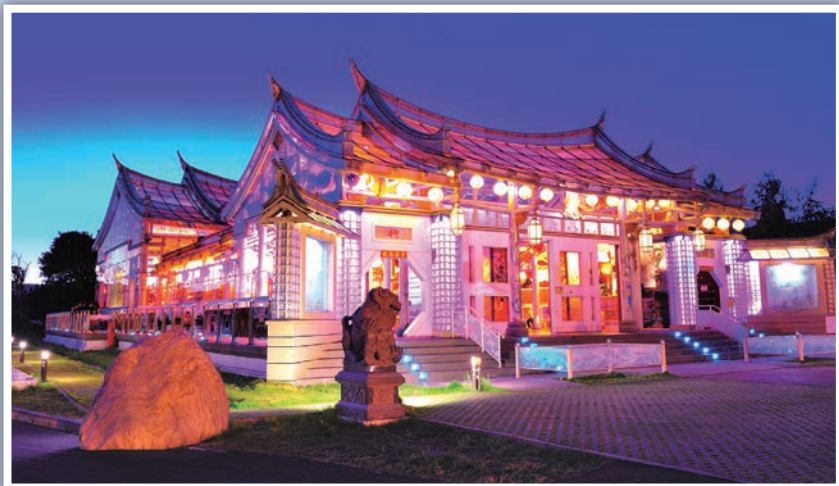
▲▼於2012年開幕的玻璃媽祖廟，以筏式水泥基座結合鋼骨作主結構，運用高科技隔熱安全玻璃作屋面及外牆材質，加上木雕、石雕精品，融合彩繪窯燒、熱塑、堆疊玻璃執行內裝修飾，可說是多元文化及藝術創作匯聚。

在這樣的聯盟合作下，台灣玻璃聚落開始成形，透過資源整合、專業分工、利潤共享，風險也分攤，達到「大單不怕趕、小單不怕煩」，好評不斷也讓IKEA主動向台明將遞出橄欖枝，1997年提供200萬美金的訂單，由於質量俱佳的成績，讓IKEA不斷放量給台灣，全盛時期的2007年，達到1年7,000多萬美金的訂單量，巨大的單量甚至讓台明將與協力廠商過年僅除夕休息，初一再度全面重返工廠施工。