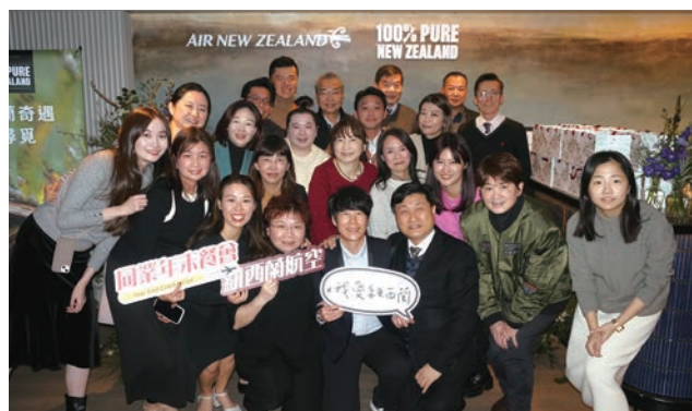
▲紐西蘭航空團隊與旅行社貴賓一起合影。

此外，紐航也觀察到，疫情之後台灣旅客前往紐西蘭市場爆發，根據供需市場也讓票價有20%的增幅，旅行社在需求團體機票空間也有限，展望2024年紐西蘭航空希望能以永續的方式經營台灣市場，而不是疫情後的一波報復性旅遊後就趨於平淡。