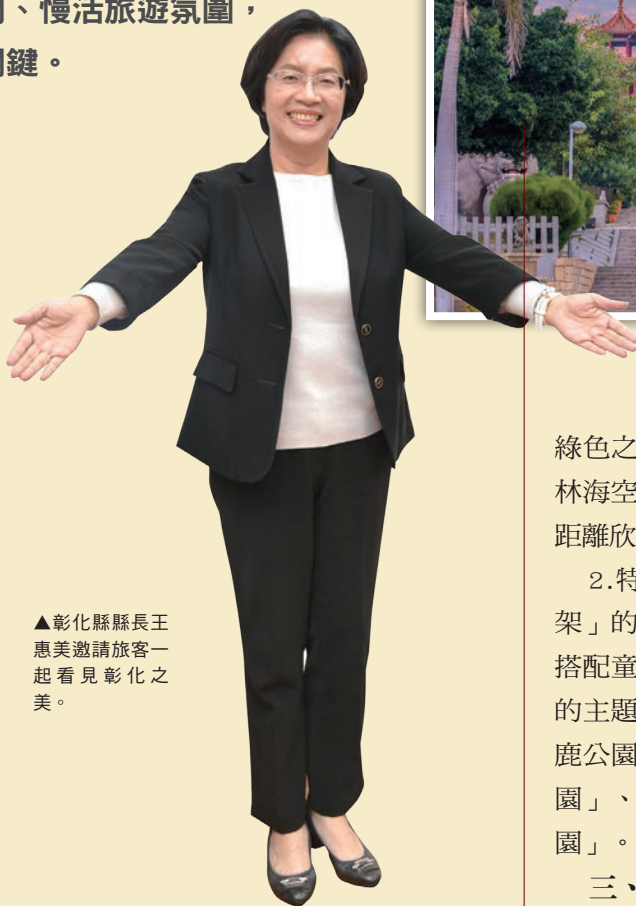
▲彰化縣縣長王惠美邀請旅客一起看見彰化之美。

造、訓練居民成為導覽員，把地方的美行銷出去。目前包括田中鎮北路社區、大村鄉新興社區、芬園鄉中崙社區、彰化市香山社區、和美鎮還社社區皆榮獲「建築園冶獎」。