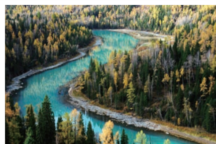
▲月亮灣是喀納斯最著名的景點，隨湖水變化而擁有多層次的美麗靜謐藍色。

在中國大陸西北地區，有著一片被譽為奇景的天堂，友泰旅遊攜手中國國際航空，精心打造一趟獨特而令人難以忘懷的11天新疆之旅。讓旅客從桃園出發，利用北京樞紐中轉，當天抵達新疆烏魯木齊；回程時則從庫爾勒直飛北京，雙點進出，避免不必要的拉車，使整趟旅程更加輕鬆愉快。