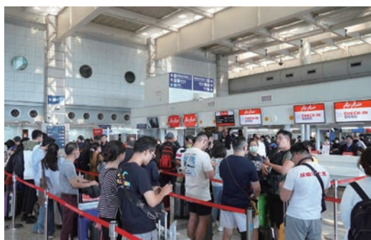
▲高雄-曼谷航線首航開賣便已有高達97%的乘載率。

同時準備泰國手作香氛小禮品提供給首航旅客，現場還展示泰國傳統服裝及傳統紙傘，讓每位乘客搶先感受滿滿泰國風情，抵台就體會到台灣的濃濃人情味。