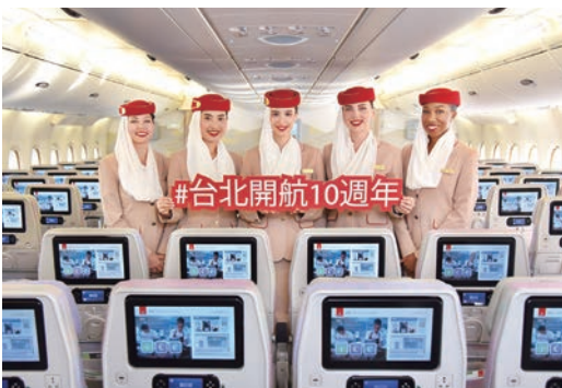
▲阿聯酋航空歡慶台北航線開航10週年，未來將持續以世界頂尖的產品與綿密的飛行網絡，滿足台灣市場的需求。

自2014/2/10首個客運航班抵達台北以來，10年來阿聯酋航空已載運超過200萬名旅客往返杜拜及台北，除了於兩地之間提供便捷的飛行服務，旅客更可經由杜拜樞紐，前往馬德里、巴塞隆納、里斯本、米蘭及開羅等阿聯酋航空全球飛行網絡中的熱門旅遊城市。