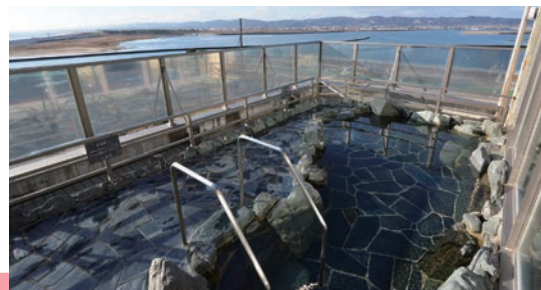
▲「亘理溫泉 鳥之海」的露天大浴場能欣賞太平洋美景。