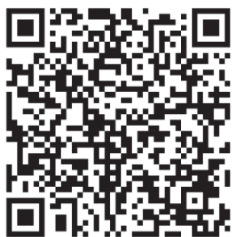
活動詳情請掃活動網頁

為刺激農曆年後訂位開票量，長榮航空與Sabre推出同業開票抽好禮活動。凡是Sabre台灣區旅行同業用戶，於活動期間開立長榮航空台灣出發FIT單程或來回機票（延伸亦適用），即可獲得禮券、長榮航空模型機、長榮航空拼圖...等多項好禮抽獎資格；而Sabre再加碼，符合活動資格之訂位代號還可獲得Sabre Get Point 30點／人，且若透過先啟Sabre QQBooking或GFIT完成訂位與開票，還可獲贈星巴克飲料券共30張，先開先贏。開票張數越多！中獎機率越高！