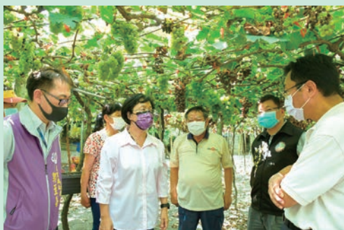
▲彰化縣縣長王惠美（左2）也曾多次造訪知名的鵬群頂酒莊。