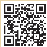
日本旅遊情報局粉絲團