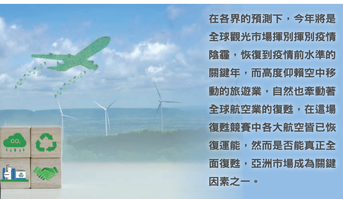
▲各大國際機構皆預測，2024年將是航空產業翻轉的關鍵一年，可望恢復到疫情前水準，甚至大幅突破。

在各界的預測下，今年將是全球觀光市場揮別揮別疫情陰霾，恢復到疫情前水準的關鍵年，而高度仰賴空中移動的旅遊業，自然也牽動著全球航空業的復甦，在這場復甦競賽中各大航空皆已恢復運能，然而是否能真正全面復甦，亞洲市場成為關鍵因素之一。