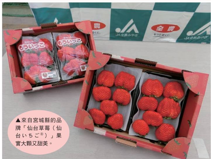
▲來自宮城縣的品牌「仙台草莓（仙台いちご®）」果實大顆又甜美。

位於東北的宮城縣自然資源豐富，在311東日本大地震前，就已是東北地區草莓生產量的冠軍，也是日本前10名之一。震災後當地更是積極於復興作業，再度成功恢復過去榮光，以該縣南部沿岸的亘理町及山元町兩處所生產的「仙台草莓（仙台いちご®）」品牌草莓為主，更將眼光放到海外市場，也促成了疫情後首次從宮城縣出口草莓至台灣的目標。除此之外，歡迎台灣朋友到宮城縣時，也能來體驗採草莓的樂趣。目前台灣有長榮航空、星宇航空每日直飛仙台航班，台灣虎航則在每週二、四、日運行，自台灣出發約3.5小時就能抵達。旅行同業若有其他宮城縣觀光資訊需求，歡迎隨時洽詢向日遊顧問有限公司。