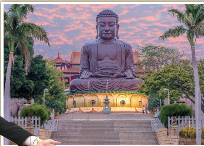
▲建縣300年的彰化，有著悠久的歷史底蘊，值得旅客一訪。

1. 建立休閒遊憩廊道：推動「烏溪水岸藍帶遊憩廊道」計畫，配合自行車廊道、週遭歷史文化特色、豐富河濱生態，打造低碳生態遊憩空間。同時，塑造彰化縣自然生態教育中心旁綠地空間及西北部沿海週邊據點，使民眾能來趟