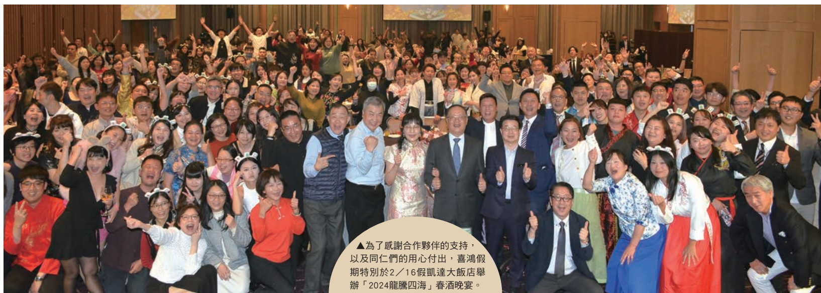
▲為了感謝合作夥伴的支持，以及同仁們的用心付出，喜鴻假期特別於2/16假凱達大飯店舉辦「2024龍騰四海」春酒晚宴。

創立於1999年的喜鴻假期，秉持「講究品質、優質團隊、創新想法」的理念經營，推出的商品總能獲得旅客喜愛，進而在旅遊市場上紮下堅實的根基，穩步朝著「永續經營、創造價值」的目標。