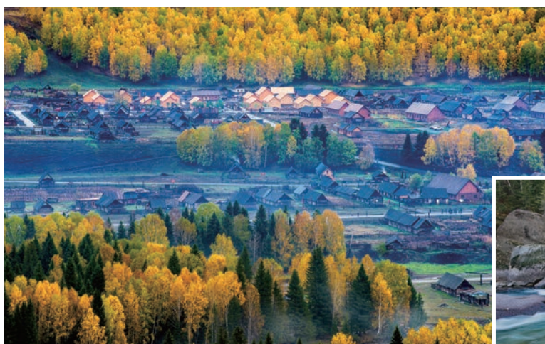
▲禾木村是圖瓦人最大的村落，白樺樹沿水成林，與山、河、草場搭配錯落有致。