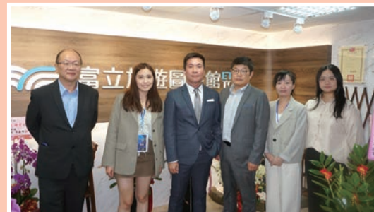
▲越南、中國大陸部門合影。