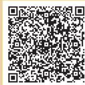
旅奇週刊官方網站

中華郵政臺北誌字第825號執照登記為雜誌交寄 本刊圖文版權所有，未經同意不得轉載或翻印！ All rights reserved.