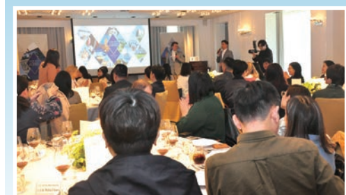
▲浪漫歐洲的瑰寶推廣會邀請業者及高階主管參與交流

名全球的施華洛世奇水晶總部也坐落於此，施華洛世奇水晶世界展示最精緻、齊全的玻璃工藝切割美學，夢幻的水晶世界是所有愛好者必訪勝地。