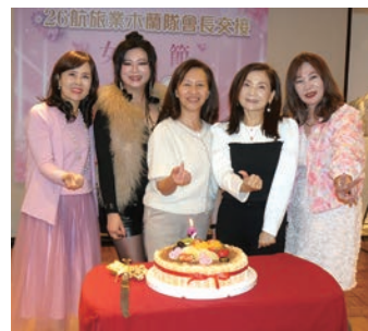
▲活動中也幫3月份壽星舉辦慶生會。