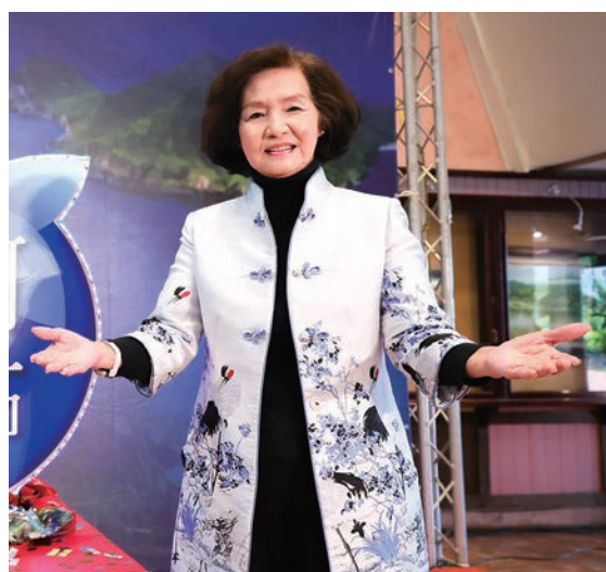
▲宜蘭縣縣長林姿妙。