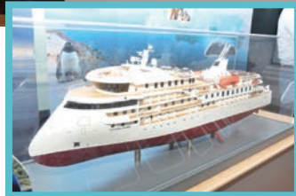
◀極地郵輪是一艘小型探險船可乘載200位旅客，突破冰川來場極地之旅。

布拉德—國家地理」建造2艘極地郵輪—國家地理耐力號（National Geographic Endurance）、國家地理果敢號（National Geographic Resolutions）。