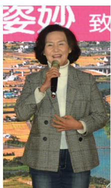
▲宜蘭縣長林姿妙推介宜蘭無限美好的觀光資源。