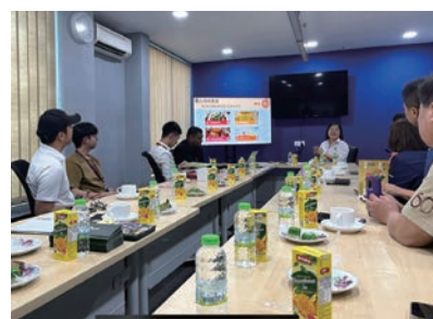
▲雪蘭莪觀光局和當地業者與台灣旅遊業者交流。

除了參觀景點外，此次活動還提供了與馬來西亞當地旅遊業者和官方代表進行交流，有助於建立人脈和促成未來的業務合作。活動的成功歸功於馬來西亞