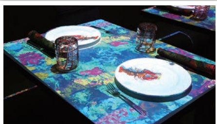
▲小廚師奇遇記 Le Petit Chef™，以聲光影像創造精彩萬分的美食饗宴。

市場的知名度，計畫邀請不同類型的旅行社加入銷售的行列，吸引不同客群的青睞，未來也會不定期的推出全球優惠商品，或針對台灣市場推出折扣航線，以吸引台灣消費者的目光。