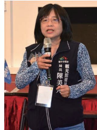
▲台中市政府觀光旅遊局局長陳美秀。