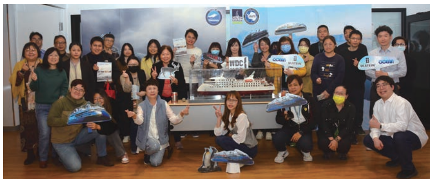
▲遠海集團於3/13舉辦「不見不散—遇見南北極 夢想生態遊」極地郵輪說明會。

遠海集團（OCEAN）成立於2001年，是一家從事新能源、綠能環保、海上風電以及極地探險船舶的國際企業。對於極區海域及生態保護格外重視，無限級（Infinity Class）新型探險郵輪交付營運與生態共舞，舞出新世代的責任與旅遊。遠海集團為海洋勝利號（OCEAN VICTORY）以及海洋信天翁號（OCEAN ALBATROS）台灣區指定船票銷售代理。