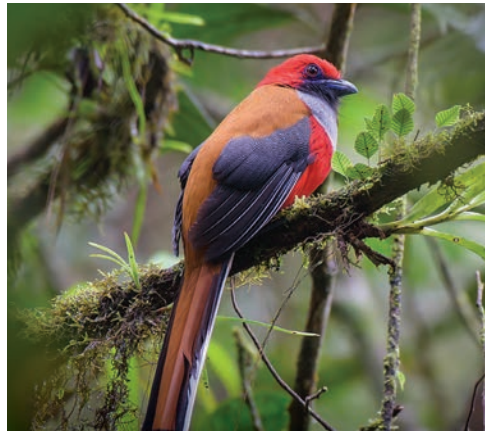
▲馬來西亞共有790種鳥類，其中包括63種特有物種和100多種候鳥。

海岸等潛在航點，提供旅客豐富的航線選擇。而針對台灣的市場布局，哈翫之提到，今年的目標訂在35萬入境人次，同時將推出有別過往的體驗遊程，如高爾夫球、水肺潛水、釣魚、觀鳥、觀星等特殊旅遊產品，讓旅客享受全新的馬來西亞旅遊，深度探索各地的隱藏秘境。