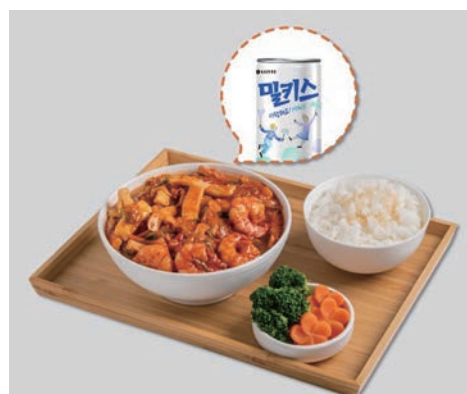
▲台灣虎航推出釜山辣炒墨魚蝦子飯機上餐。

魚蝦子飯肯定不陌生，獨特的韓式香辣調味，以香Q米飯拌炒墨魚、蝦子等海鮮入味，辣勁口感就算吃得大汗淋漓還是忍不住一口接一口，可說是到釜山必嚐的招牌美食。