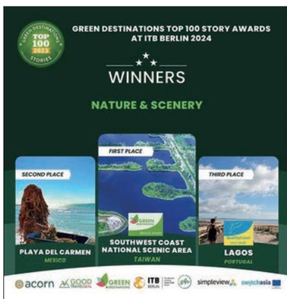
▲雲嘉南濱海風景區管理處「與水共舞－颱風過後重現的濕地與治水」故事，榮獲自然與景觀類別第1名。

該獎項由ITB柏林主辦單位與荷蘭綠色旅遊目的地基金會（Green Destinations Foundation）合作頒發，雲嘉南管理處以「與水共舞－颱風過後重現的濕地與治水」故事，榮獲自然與景觀類別第1名。故事主軸圍繞轄區內雲林口湖鄉南方甘蔗農田，該區因1986年韋恩颱風引發大量海水倒灌嚴重積水、地層下陷，農田土地因長時淹水，鹽化嚴重而無法耕種，如今變成湖泊與濕地，亦間接導致居民喪失工