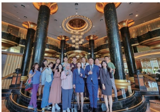
▲雙威酒店集團與台灣旅遊業者合影。