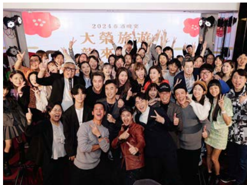
▲大榮旅遊春酒晚宴展現團隊滿滿活力。