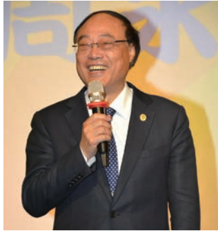
▲交通部觀光署署長周永暉。