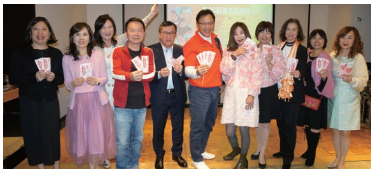
◀新舊任會長互贈禮物。