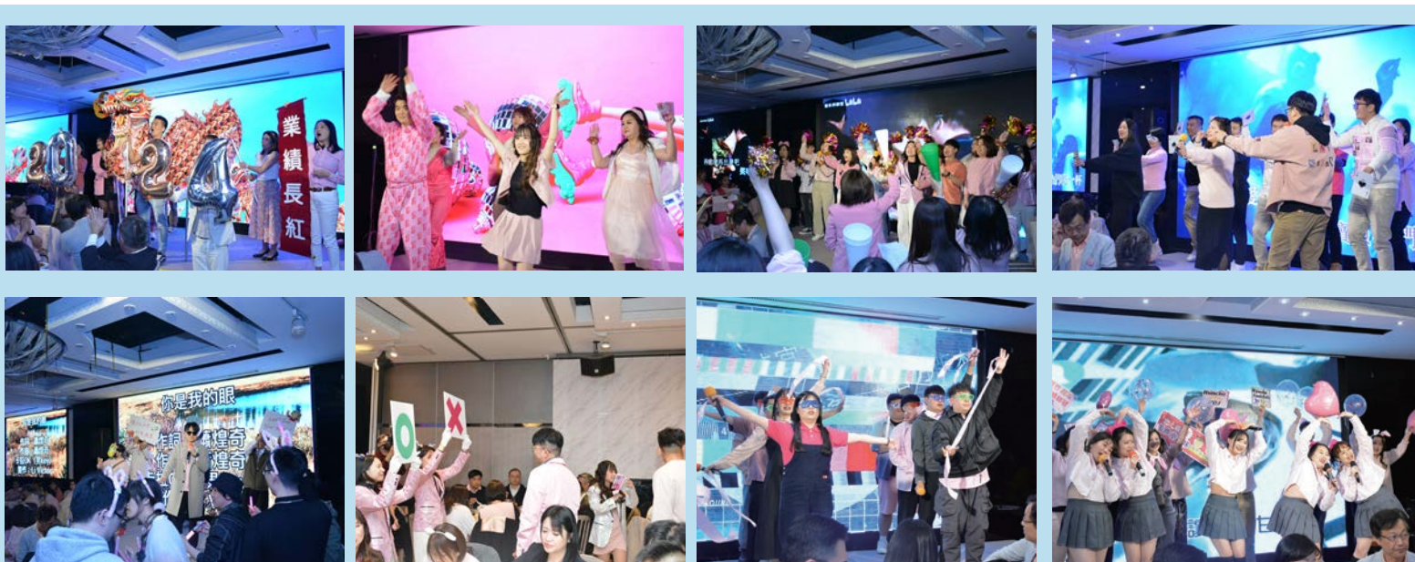
▲長汎假期同仁展現活力，帶來一場場的精彩演出。

堅 持提供卓越服務、優異旅遊商品的長汎假期，為了感謝同仁與合作夥伴的支持，特別於3/8婦女節當日舉辦春酒晚宴，長榮集團麾下的長榮航空、立榮航空、長榮航太、長榮空廚、長榮航勤、長榮空運倉儲等代表皆蒞臨，展現出關係企業之間的強大凝聚力。不僅如此，集團公司代表們也紛紛