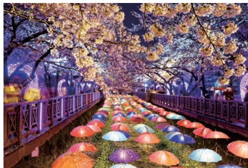
▲在夜晚欣賞櫻花也別有一番韻味。

若一覽春櫻盛放景致，韓國釜山是不少追櫻旅人的首選賞櫻勝地，為此燦星旅遊推出獨家包機，搭乘濟州航空早去晚回的班機，於機上欣賞韓國日出、探訪釜山必訪賞櫻名景、大啖當地特色美食，感受滿滿春日氣息。燦星旅遊也祭出限時搶購優惠，分別以3/27與3/31做為出發日，安排4天3夜的釜山賞櫻遊程，最低價只要15,900元起。