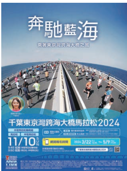
▲2024千葉東京灣跨海大橋馬拉松DM。

西元717年為了祈求漁民的海上安全跟豐收，人們在岩壁上刻了11面觀音像，爾後才蓋了觀音堂，朱紅色的觀音堂看起來就像是橫空出現在峭壁上，因此被稱為「崖觀音」，在日本國內也是十分少見，目前已被指定為館山市指定有形文化財。此外，觀音堂天花板上繪有以南房總地區植物為主的畫作，並依季節排序，精美的畫工也非常值得欣賞。