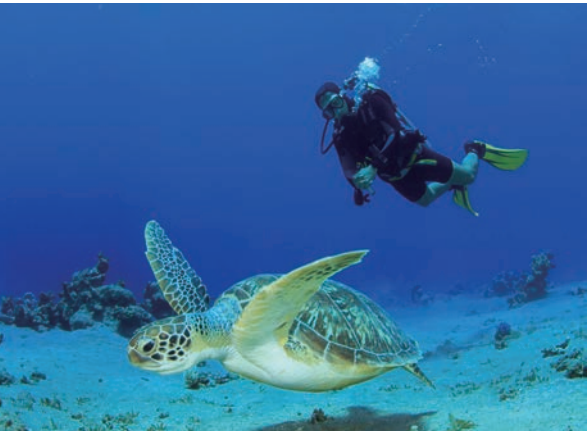
▲馬布島、西巴丹島、停泊島等都是馬來西亞著名的水肺潛點之一。