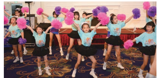
▲邀請嘉義城市啦啦隊為活動拉開序幕。

頭、菌寶貝博物館等，都積極響應旅色及減碳旅遊的理念，未來協會也會持續輔導其他業者獲取認證，期待讓全台觀光工廠都能成為重要的永續旅遊示範地。