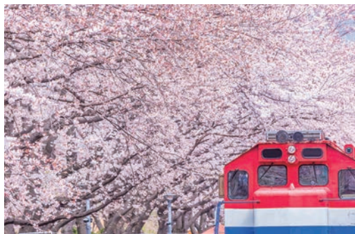
▲鎮海軍港節為韓國最大的春季慶典，慶和火車站則是當地著名的賞櫻景點。