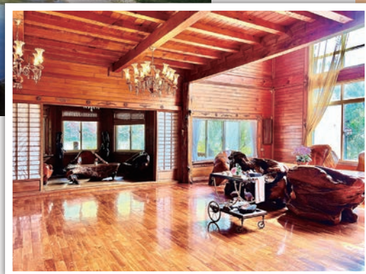
◀度假村也是著名的婚攝熱點。