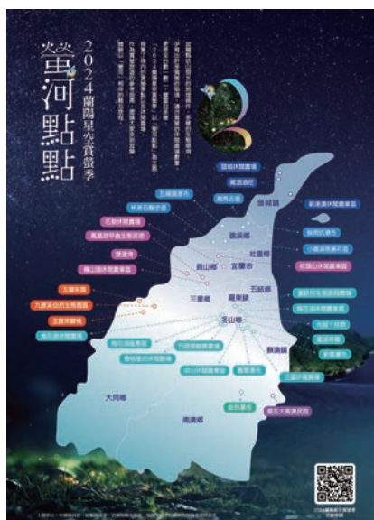
▲設計「賞螢地圖」作為民眾規劃旅遊行程的參考指南。

宜蘭縣合法旅住宿券5張、宜蘭縣合法休閒農場業者活動體驗券10組（1組2張）、野餐墊200個，數量有限請把握機會唷！