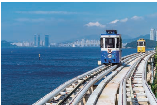
▲釜山Blue Line Park膠囊列車沿海而建，鮮豔的色彩與無邊的海景也成為打卡熱點。