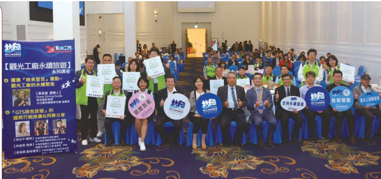
▲全國觀光工廠促進協會於2/21舉辦永續旅遊系列講座及春酒晚宴。

觀光工廠自2003年起由經濟部產發署所推動，至今已走過20個年頭，期間透過協助具產業文化與觀光教育價值的製造工廠轉型，不僅完善服務品質及完備遊憩空間，同時更滿足旅客對美學、教育的深度體驗，發展出屬於台灣觀光工廠產業的生命力。