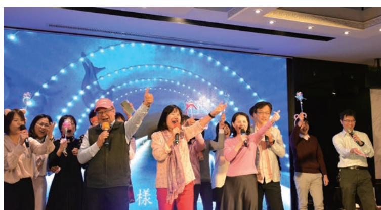
▲長汎假期副總經理、部級主管們一起獻唱《感恩的心》。