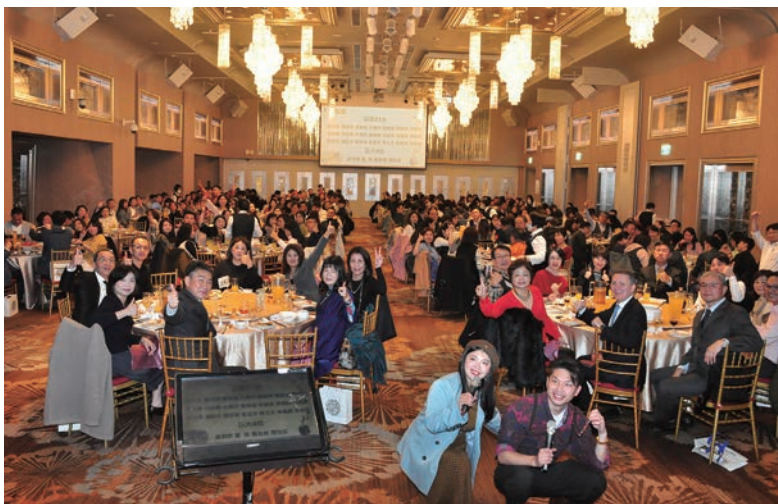
▲凱旋旅遊家族舉辦春酒聯歡晚宴，現場貴賓雲集熱鬧非凡。