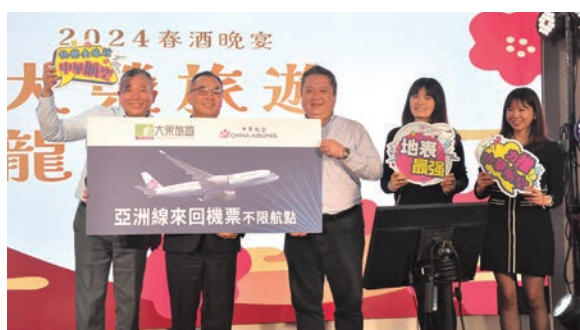
▲抽獎環節上中華航空、台灣虎航分別祭出無限航點來回機票大獎。