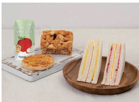
▲台灣虎航推出洪瑞珍三明治機上餐。