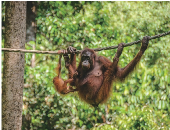
▲西必洛紅毛猩猩保護區。