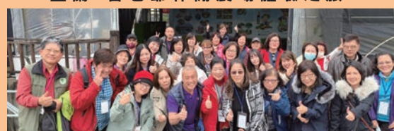
官老爺休閒農場整合農民開發規劃四季不同季節不同產業的制式與客制式農村體驗，進行遊程行銷與販售。提供場域安排套裝行程，滿足遊客暢玩在地體驗。不論是炒冰DIY、哈密瓜醬瓜DIY、豆腐乳DIY、蔥油餅DIY、竹筏秧桶船體驗。或是呷在地美食如南瓜米粉、蜜瓜鮮肉、哈密瓜杏鮑菇、哈密瓜雞湯等瓜瓜風味餐，吃喝玩樂盡在此。