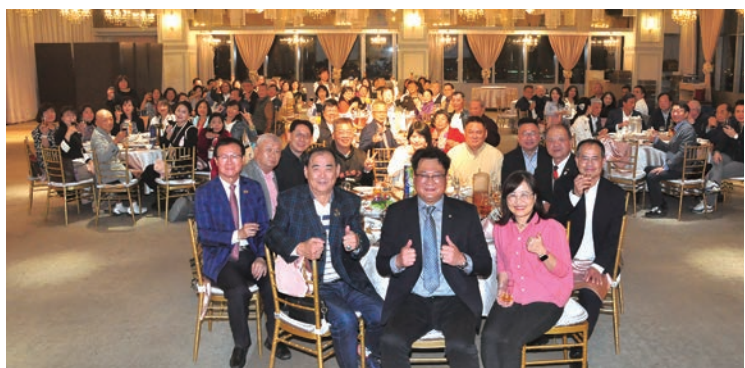
▲中華文化暨旅遊協會舉辦新春聯誼晚宴，邀請會員與各行業專業人士一同與會交流。