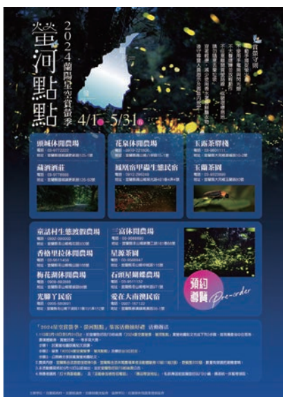
▲「2024蘭陽星空賞螢季」將與14家休閒觀光產業合作推出多元套裝行程。