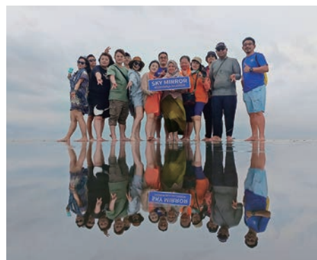
▲考察雪蘭莪天空之鏡體驗。

馬來西亞觀光局攜手亞洲航空，於3/5至3/9，在馬來西亞展開了一場精彩的考察交流活動，邀請了來自台灣的旅遊業者參與。此次活動的地點主要包括吉隆坡、布城和雪蘭莪，旨在讓台灣同業有機會深入了解馬來西亞的旅遊資源和產品。