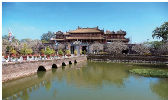
▲順化在歷史上曾作為越南首都，保留至今的順化皇城更是越南首個被列入獲得世界文化遺產的古蹟建築。

越旅航空為越南旅遊龍頭企業 Vietravel 於2019年成立，並於2020／12／1正式首航，機隊以A321機型執飛。雖成立之初即經歷疫情，但憑藉具競爭