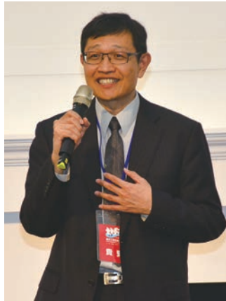
▲經濟部產業發展署主任秘書林德生。