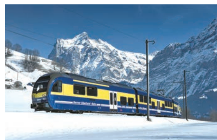
▲使用瑞士少女峰旅行通票可在期限內無限次搭乘少女峰鐵道及遊船。

少女峰鐵道為瑞士當地著名的旅遊景點，也是旅客前往瑞士朝聖「歐洲之巔」少女峰的重要交通工具，近年瑞士少女峰陸續推出新的建設與服務，為推廣相關活動與週邊旅遊景點，因此瑞士少女峰鐵道公司特於3／6聯合格林德瓦旅遊局與茵特拉肯旅遊局，假JR東日本大飯店舉辦開春業者午宴，透過