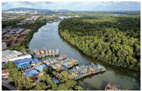
▲距離吉隆坡僅40分鐘車程的彭亨州，可徒步體驗大自然的寧靜美好。

紅樹林、雨林、山脈和海灘所組成，因此擁有多樣的自然條件及生態資源。據資料顯示，馬來西亞共有790種鳥類，包括63種特有物種和100多種候鳥，以及至少15,000種開花植物、1,500種陸生脊椎動物和約150,000種無脊椎動物，是世界上生物多樣性最豐富的國家之一。