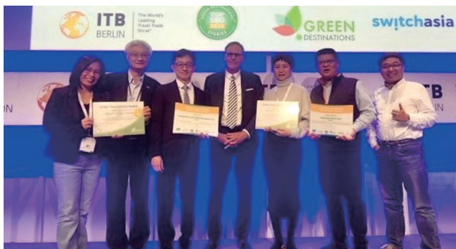
▲此次為台灣首度於ITB柏林綠色目的地故事獎榮獲最多獎項的年度。

ITB柏林綠色目的地故事獎是根據綠色目的地基金會（Green Destinations Foundation，以下簡稱GD）提名的百大故事中，以旅遊目的地的永續管理、自然與景觀、環境與氣候、文化與傳統、住民與社會福利、商業與行銷6大類別，擇選出前3名獲獎者。