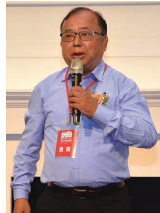
▲交通部觀光署參山風景區管理處處長曹忠猷。