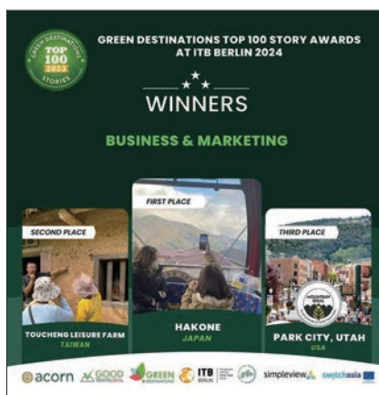
▲東北角及宜蘭海岸風景區管理處輔導業者頭城休閒農場獲得商業與行銷類別第2名肯定。