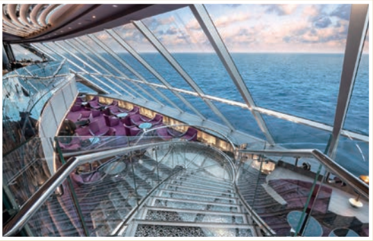
▲270°景觀酒廊位於船長室正上方，可以船長視角欣賞絕美海景。

3/24 熊本、佐世保賞櫻自主遊6天 熊本是近期台灣討論度相當高的日本旅遊目的地，知名的熊本城更是當地賞櫻名景之一，800多株櫻樹環繞，與城牆充滿時代感的氣息相互交織，猶如一幅充滿日式風情的名畫。佐世保碼頭更位處市中心，景點車程距離皆在20分鐘內即可抵達，旅客亦可透過行程加購，讓尊榮假期帶您開啟一趟尋櫻之旅。