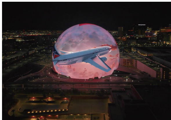
▲達美航空執行長艾德巴斯蒂安 (Ed Bastian) 宣布多項全新業界合作創舉，以滿足顧客對於未來卓越飛行的承諾。