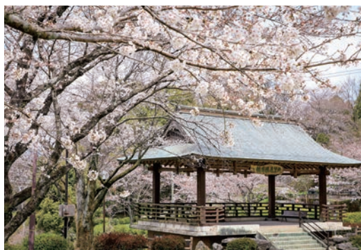
▲菊池公園是著名的九州賞櫻景點。