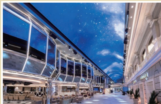
▲榮耀大道擁有「海上香榭大道」的美譽，為集結200多個國際知名品牌的購物商場。