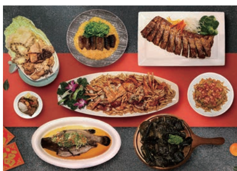
▲台北凱撒大飯店年菜套餐1/20前預訂享早鳥8折起優惠。

台北凱撒大飯店推出「蛇年如意」澎湃星級年菜外帶搶市，不僅有廣受好評的大、小福組合套餐，另有15道飯店單點美饌及5款年節禮盒，售價最低400元起。即日起至1/20前預訂年菜套餐享早鳥8折起優惠，「小福套餐」只要6,888元，「大福套餐」13,888元就能在家品嚐到飯店的5星美味。春節規劃小旅行，「新春住房迎財蛇」住房專案每晚含早4,088元起，限定期間還能獲得蛇年「刮刮樂」試試好手氣。更多詳情可上台北凱撒官網查詢： https://taipei.caesarpark.com.tw/