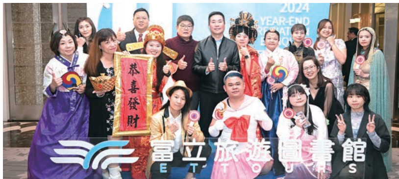
▶ 富立旅遊圖書館團隊以特殊造型與貴賓一起歡慶尾牙盛宴。