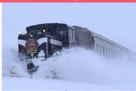
▲乘風破雪的津輕鐵道暖爐列車為青森冬季魅力亮點。

青森的高山稻荷神社創建於鎌倉與室町時代之間，主祈五穀豐收、海上平安及生意興隆，為當地重要的信仰中心。這裡特別以壯觀的朱紅色鳥居聞名，雖不及京都伏見稻荷大社般廣為人知，但其連綿不絕的2公尺高鳥居同樣令人驚嘆，與境內無數的狐狸石像一起讓人彷彿置身神秘異境。四季截然不同的景色散發獨特魅力，吸引無數遊客前來拍照留念。