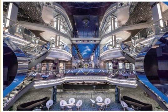
▲榮耀號中庭旋梯共鑲嵌61,440顆奧地利施華洛世奇水晶，是該船最大特色之一。

選當地熱門旅遊目的地，且不進購物站保障旅遊品質，相當適合想輕鬆享受郵輪旅遊的旅客。