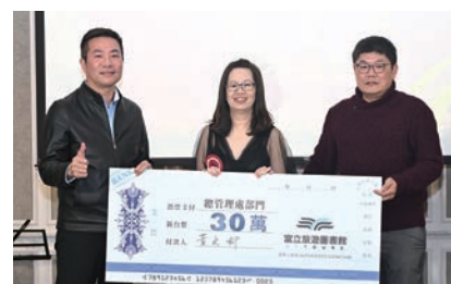
▲ 總管理處部門頒發30萬年度獎金。

里程碑。公司過去主要業務以Local服務為主，例如菲律賓和越南的市場，在越南，早已深耕多年；在菲律賓，分公司設於馬尼拉和長灘島，提供當地和台灣業者的相關服務。現在正積極拓展海外新據點，包括日本與峇里島，期望帶給旅遊同業更全方位的商機。