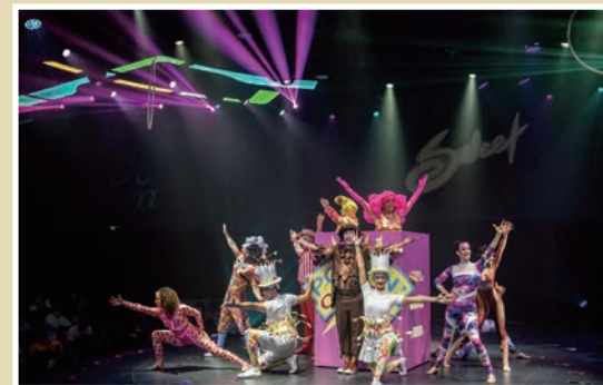
▲每晚不同主題的華麗表演秀是旅客不可錯過的獨特體驗。