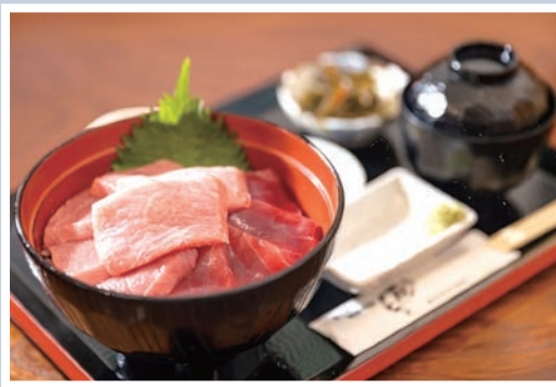
▲「大間鮭魚」為美味的品質保證。

大間崎位於下北半島，為本州最北端之地，當地捕獲的黑鮭魚也以「大間鮭魚」的品牌聞名，經常在競標時創下高價。經驗老道的漁師們只在一條釣線上掛起魚餌鈎的「一本釣」釣法展現高超技術，也是