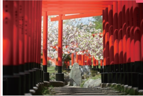
▲高山稻荷神社的千鳥居與夾雜其中盛開的櫻花風景極為美麗。