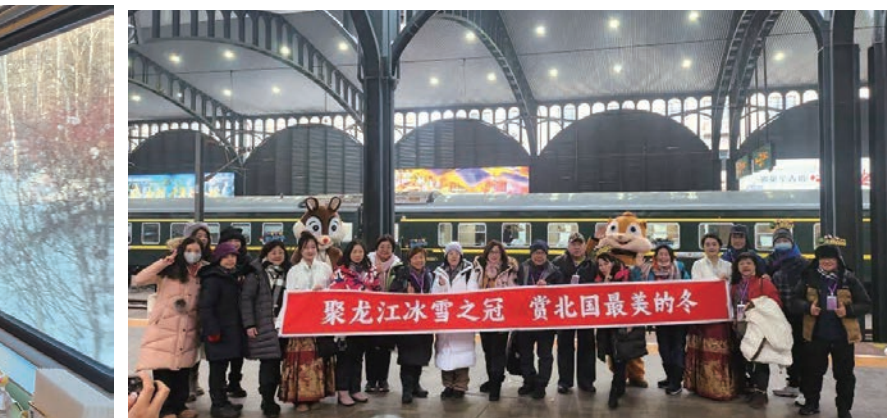
◀◀台灣旅行業者透過實地探訪，深度了解伊春號的特色。