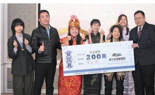
▲ 日本部門頒發200萬年度獎金。