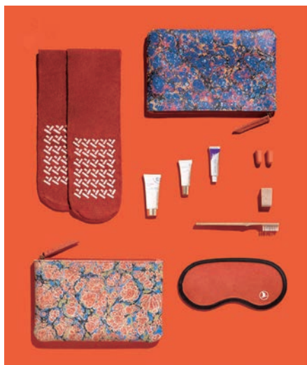
▲每套組都是對土耳其傳統藝術的現代詮釋，包括由奢華香水品牌Ex Nihilo配製的護手液、身體乳液和潤唇膏。

秉承為旅客提供無與倫比的旅行體驗的使命，土耳其航空推出「UNESCO Türkiye Series 聯合國教科文組織土耳其系列」旅行套組系列，現正將土耳其無與倫比的文化瑰寶帶上天空，展示土耳其豐富的文化遺產。這套被稱為「UNESCO Türkiye Series」的全新盥洗包系列，靈感來自土耳其6處傑出的聯合國教科文組織世界遺產，包括內姆魯特 (Nemrut)、哥貝克力石陣 (Göbeklitepe)、卡帕多奇亞 (Cappadocia)、以弗所 (Ephesus)、阿尼 (Ani) 和洛伊 (Troy)，以及4種不同的ebru (土耳其大理石紋) 設計和3種傳統的地毯紋飾。這些新套件現已在5至8小時航程的商務艙推出，而不同版本於1月中旬在8小時以上航程的經濟艙推出。