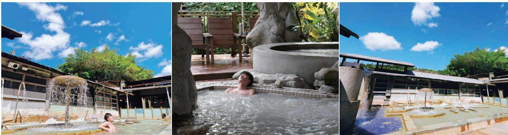
▲台灣因先天優勢造就全島皆有溫泉資源，目前全台總計有19大溫泉區，皆為本次金泉獎評選地點，都值得旅客親身體驗。

位於板塊交界處，加上熱帶及副熱帶氣候提供充沛的降雨量，得天獨厚的地理條件讓台灣大多縣市都能找到溫泉的蹤跡，僅3.6萬平方公里的小島就囊括碳酸氫鈉泉、碳酸泉、硫磺泉及罕見的泥漿泉等豐富泉種，被稱為「溫泉王國」也絲毫不為過。