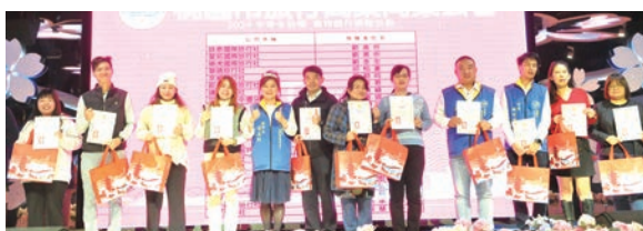
▲桃園市旅行公會特別頒發寒冬送暖捐贈活動的感謝狀給予積極響應的會員，展現公會高度重視公益活動的用心。