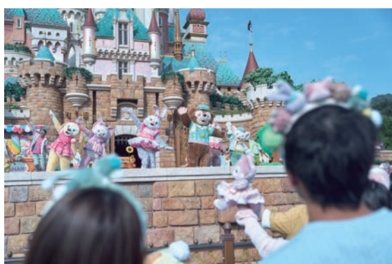
▲達菲與好友「快樂分享」小劇場將身穿全新春日服飾，獻上特色表演節目。

春天的來臨象徵著香港迪士尼樂園度假區一年一度春日盛會「達菲與好友同萌遊」即將回歸！在2／21～5／7期間，粉絲們可以帶著心愛的達菲與好友玩偶作為同行旅伴，到樂園展開一場充滿春日氣息的奇妙旅程。旅客將可搭乘香港迪士尼樂園鐵路達菲與好友春日限定列車，身處於色彩繽紛的火車廂內，體驗和達菲與好友一起遊覽樂園的喜悅。同時，換上全新春日新衣的達菲