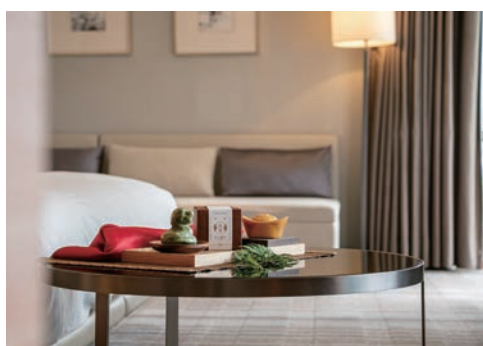
▲和逸飯店·台北民生館、台北忠孝館推新春專案「新春財蛇好預皂」，每房贈台灣百年品牌伴手禮。

和逸飯店·台北民生館與台北忠孝館搶攻為期春節連續假期商機，以「新春財蛇好預皂」住房專案及現場抽獎活動，帶來濃厚年節氣氛。即日起至2/28，預訂春節住房專案，2天1夜每晚4,788元，3天2夜8,888元起，專案含雙人早餐及台灣百年品牌「大春煉皂」生肖造型皂與金元寶皂乙組。活動期間入住或於2樓THE Lounge消費滿千元以上貴賓，可參加紅包抽獎，有機會贏得舒適客房住宿、餐飲券等多種好禮。