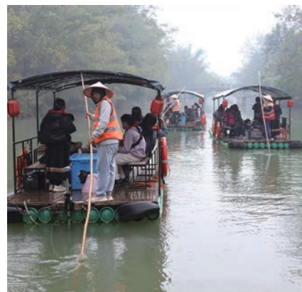
▲前往廣西、浙江、四川等地，學習兩岸歷史文化與特色產業。