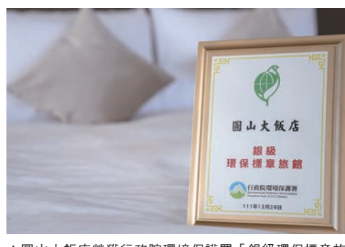
▲圓山大飯店榮獲行政院環境保護署「銀級環保標章旅館」認證，宣示響應全球2050淨零排放趨勢。

圓山大飯店為響應ESG永續發展指標，2019年起實踐永續治理與發展之理念，包含落實節能減碳、活化文化資產、積極推廣無人工添加調味品，更與政府單位合作協助台灣在地農漁業進行特色推廣，發揮飯店影響力。今年更選用地食材為原料，推出國宴級年菜，搭配圓山無人工添加調味品，建立友善環境兼具健康美味的永續饗宴；同時也首度引入3D風扇全息投影技術，打造全台飯店唯一的永續環保聖誕樹，帶給旅客創新視覺與心靈體驗的雙重驚喜。