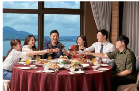
▲來福容迎新春過好年，歡樂享用星級美饌，再抽萬元住宿券。

福容台北一館推出每晚5,988元起的住房專案，餐飲方面提供港式飲茶及精緻日式套餐；福容福隆4人住宿11,888元起，免費享受海洋溫泉再加贈活動體驗券及炸雞桶。福容桃園機捷A8則推出歡喜過年驚喜價2,025元起，每日限量搶訂；還有超人氣「吉伊卡哇」IP現身愛河，福容高雄推出住房5折起。即日起至3/31，福容會員住宿或餐飲消費滿3,000元，就有機會帶走萬元以上環島任你遊住宿券大獎，餐飲滿額再贈咖啡買1送1券。