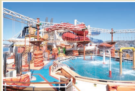
▲進8,000平方公尺的亞利桑那水上樂園，是大人小孩都喜愛的娛樂場所。