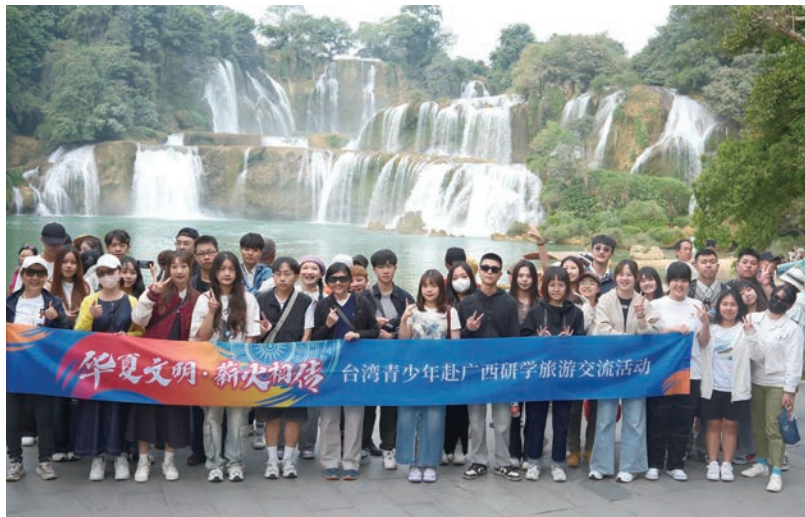
▲【华夏文明·薪火相傳】研學旅遊交流活動，帶領台灣年輕學子赴廣西進行交流。

為推動兩岸交流，中華兩岸旅遊產學發展協會從旅遊角度出發，在疫後透過考察團、拜會各部會等事宜，積極與中國大陸維繫友好感情；同時藉由研學、美食、經貿、文化等大型活動的舉辦，深化兩岸多面向的往來互動。