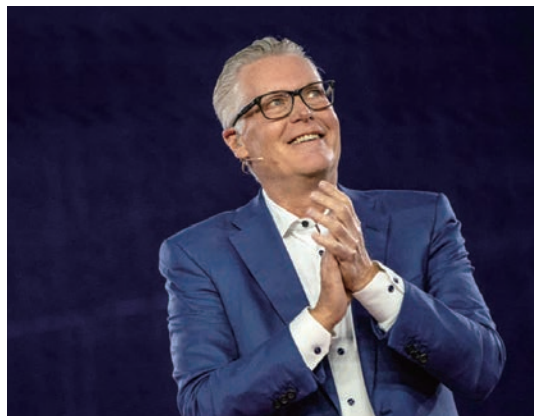
▲達美航空在拉斯維加斯「Sphere」球體館舉行2025年度國際消費電子展CES上盛大登場。