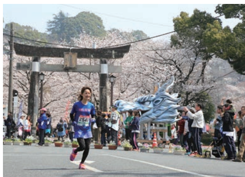
▲菊池櫻花馬拉松在一片繁花中起跑。