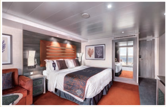
▲榮耀號擁有海上首間施華洛世奇水晶套房，提供奢華的住宿體驗。