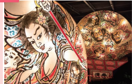
▲津輕藩睡魔村是以弘前睡魔祭為主的體驗型觀光設施。

津輕鐵道在不同季節提供觀光列車，夏天為風鈴列車，秋天為鈴蟲列車，而最廣為人知的則是冬季的暖爐列車，可說是冬日最優美的風物詩。暖爐列車於每年12月～3月期間登場，列車往返於津輕五所川原站～津輕中里站間，燒著煤炭的暖爐上烤著青森特產的魷魚，與車窗外的奧津輕雪原形成強烈對比。單趟約45分鐘車程，濃厚的在地體驗深受國內外旅客喜愛。