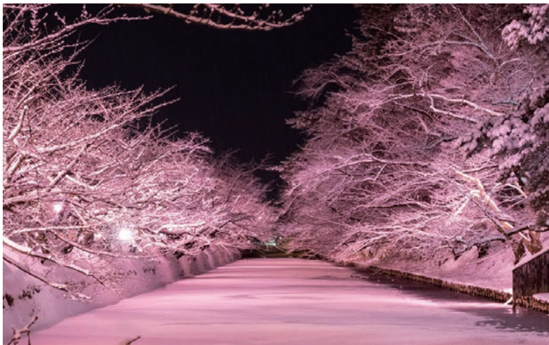
▲覆蓋弘前城護城河的白雪打上粉色燈光，有如冬夜的櫻饗宴。

由長榮航空執飛的台北—青森航線於冬季班表復飛，1週共有3班來回，於每週二、四、六運行，增加了東北地區交通的便利性。利用青森機場，更可以節省拉車時間，進行青森縣的深度旅行，其中位於本州最北端的下北半島與富含歷史文化景點的津輕半島，可利用陸奧灣渡輪連結，為商品增加移動的趣味性。推薦從青森市內出發，行經下北半島，搭上渡輪前往津輕半島，最後再移動回青森市的周遊行程安排。旅行同業若需要更多青森縣相關資料，歡迎隨時洽詢向日遊顧問有限公司。