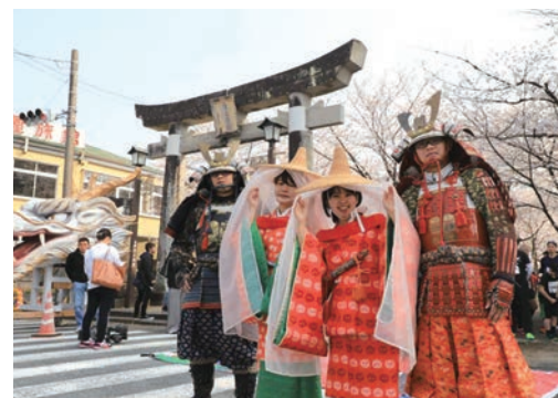
▲菊池櫻花馬拉松時有「菊池武士」沿路打氣。

熊本縣的菊池市近期話題大增，因位置鄰近台積電設廠的菊陽町，加上具有菊池一族之名加持的名勝如：日本百選森林菊池溪谷、日本百選溫泉菊池溫泉，以及九州的賞櫻名所菊池公園等，台灣自由行觀光客大增而備受注目。日前更與台南市東區簽署友好城市，以及中華航空高雄至熊本的航線於2/3開航，兩地的交流更加密集。