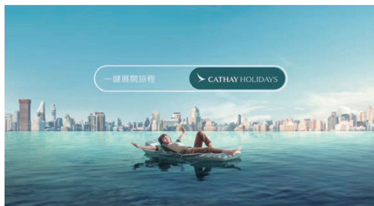
▲國泰航空全新推出一站式旅遊預訂平台Cathay Holidays。

國泰航空全新推出一站式旅遊預訂平台Cathay Holidays，與Expedia Group合作，提供旅客從規劃假期到預訂行程的無縫體驗。為迎接新平台上線，Cathay Holidays推出限時回饋，從即日起至1/28，在Cathay Holidays平台預訂飯店及住宿、「機+酒」旅遊套票或當地玩樂行程，可享3倍「亞洲萬里通」里數，最高每消費16元即可賺取3里數，單筆交易最高可累積3萬里數優惠。目前平台已於香港、日本、新加坡及台灣等地推出，旅客只要登入Cathay Holidays，就能輕鬆探索Expedia Group在全球25萬個目的地，所提供的90萬間住宿和20萬項旅遊活動，輕鬆打造完美旅程。