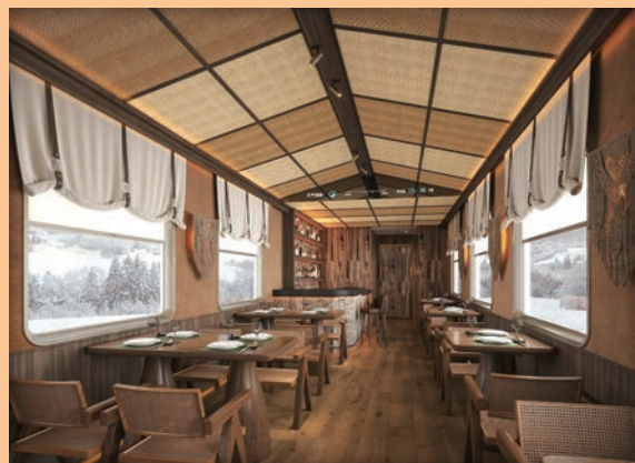
◀◀上車便是另一趟精彩旅程的開始 跟著伊春號徜徉於美景中。