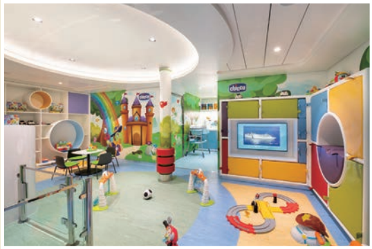
▲家庭旅客也有專屬幼兒的遊憩空間，滿足親子客群。