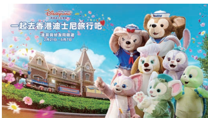
▲春日盛會「達菲與好友同萌遊」將於2／21～5／7期間限定回歸。