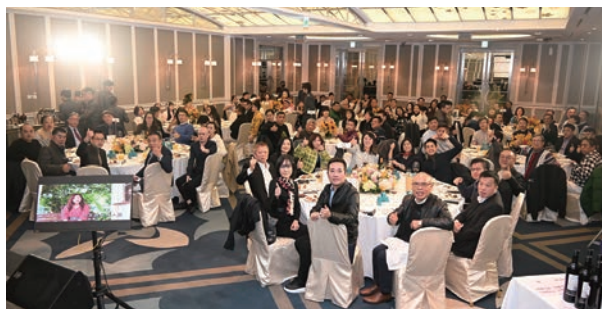
▲ 富立旅遊圖書館尾牙盛宴團隊與貴賓合影。