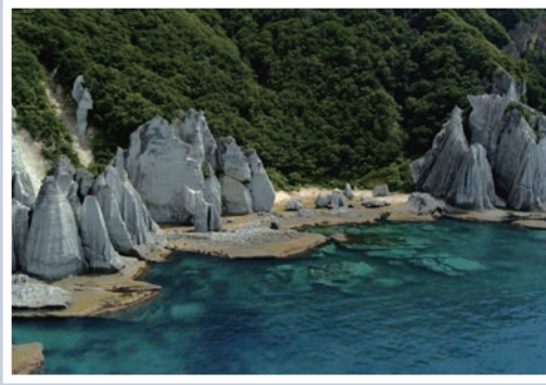
▲佛浦海岸的岩石各有其特別的佛名，十分有趣。

佛浦是一段約2公里長的白色奇岩巨石海岸，沿著碧藍的海水蜿蜒而成，被指定為青森縣的天然紀念物及日本國家名勝與天然紀念物，為下北半島知名的觀光景點。據說這些巨石是由2,000萬年前海底