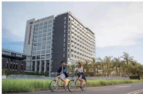
▲台南大員皇冠假日酒店合作安平特色店家，推出全新住房專案。

台南大員皇冠假日酒店隆重推出全新住房專案「漫遊安平 美食手作體驗」，攜手安平10大特色店家，共同帶來豐富多元的文化與美食體驗，即日起至3/31止，讓旅客在住宿的同時，深入感受安平的歷史與人文魅力。每房4,250元起，每房贈送「定情碼頭德陽艦園區」門票2張，以及「漫遊安平 美食／手作體驗」兌換券3張，每張兌換券可於指定安平店家兌換價值100至350元不等的美食或體驗課程，為旅客提供靈活選擇，完美規劃專屬假期。