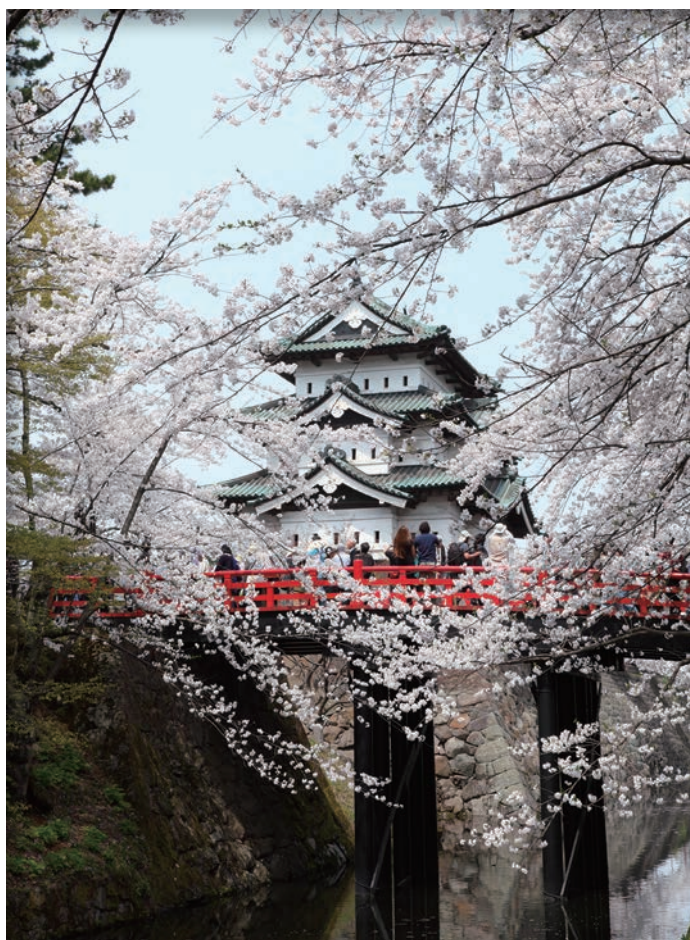
▲弘前公園約在4月下旬至5月下旬迎來櫻花盛開，同時會舉辦熱鬧的「弘前櫻花祭」活動。

位於日本本州最北端的青森縣四季分明、自然景觀壯闊且具備濃厚地方文化色彩，長久以來深受旅客喜愛。自台灣出發搭乘長榮航空直飛航班，大約3.5小時就能抵達青森機場，為了引領旅客感受更深度的青森之美，長榮航空青森航線不僅自夏季班表起從原有的每週3班次增加為5班次，旺季更會加碼推出每日直飛，提供更彈性的行程安排選擇。此外，青森市現正祭出補助金，只要符合規範條件都能申請，額滿為止歡迎盡早利用。旅行同業若有任何青森縣資訊需求，歡迎隨時洽詢向日遊顧問有限公司。