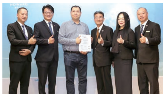
▲台中福華大飯店榮獲國際GSTC飯店認證。

觀旅局進一步說明，霧峰林家宮保第園區作為新一波取得「GTS綠色旅行標章」認證的代表案例，完美示範文化資產與永續發展的共生模式。園區以「文化為橋、永續為岸」為核心理念，落實綠色治理與地方共好，目前園區員工有8成為台中