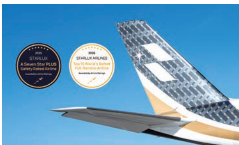
▲星宇航空名列全球權威航空評鑑機構Airline Ratings公布2026年度「最安全航空公司」第11名，以亮眼成績躋身全球航空安全表現的領先行列。

星宇航空於國際飛安認證再傳捷報！全球權威航空評鑑機構Airline Ratings公布2026年度25大「最安全航空公司」，星宇航空以最年輕航空之姿入榜，名列第11名，以亮眼成績躋身全球航空安全表現的領先行列。