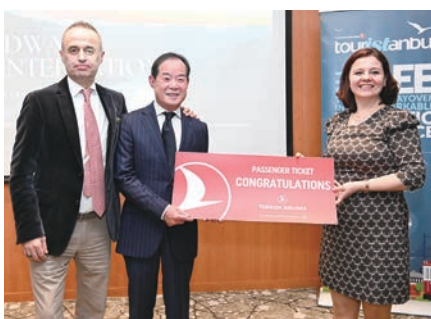
▲活動抽出土耳其航空機票與住宿遊程組合包大獎。

土耳其航空自2015開航台北－伊斯坦堡航線已逾10年，透過以伊斯坦堡為樞紐，旅客可輕鬆銜接300個以上的旅遊目的地。近期，土耳其航空持續深耕在巴爾幹半島地區的航點，透過靈活的機隊與航點優勢，提供旅客輕鬆暢遊巴爾幹半島主要城市的多元選擇。為推廣新航點服務與巴爾幹半島旅遊特色，1／14土耳其航空特別攜手位於阿