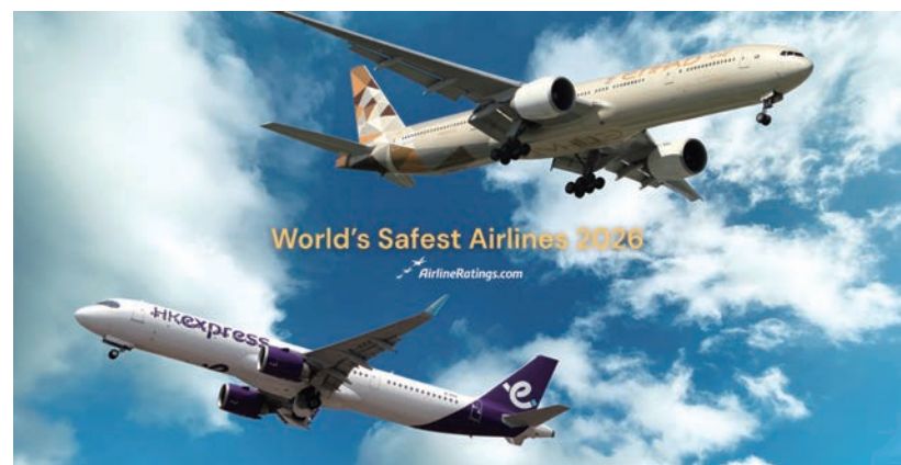
▲國際航空安全評比機構AirlineRatings.com於1月發布了「全球最安全航空公司排行榜（World's Safest Airlines）」，從全球超過320家航空公司中評選出最安全的航空公司。