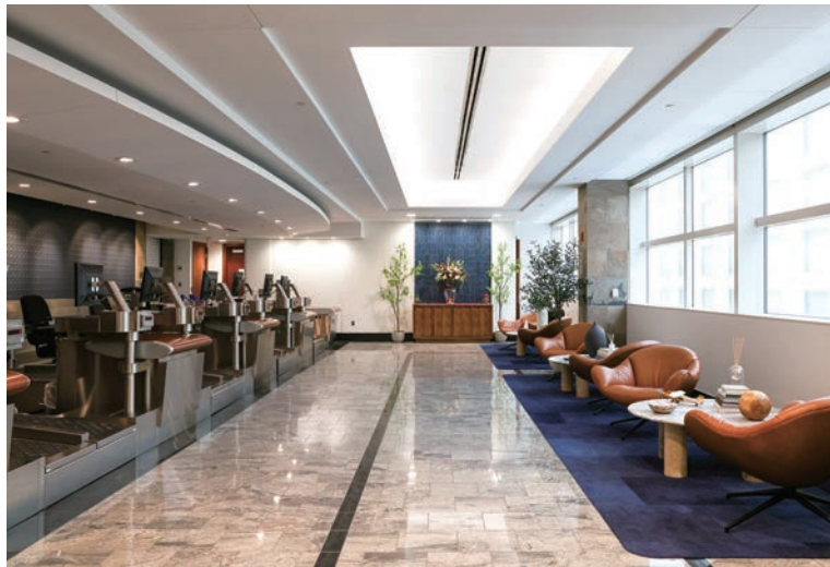
▲位於底特律都會韋恩縣機場（DTW）麥克納馬拉航廈（McNamara Terminal）的「達美至臻商務艙專屬登機報到」休憩空間，供旅客在報到前放鬆休息。

踏入機場的那一刻，便能展開一段自在而倍感關懷的旅程，這正是達美航空擴大布局「達美至臻商務艙專屬登機報到」（Delta One Check-In）的全新體驗。從辦理登機、行李託運到休憩候機，旅客皆能在這座專屬空間內一併完成。目前，這項服務已全面進駐全美設有達美至臻商務艙（Delta One）服務的樞紐機場，適逢假期旅遊高峰，致力