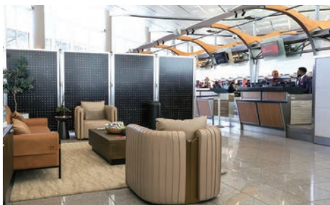
▲位於亞特蘭大哈茲菲爾德傑克遜國際機場（ATL）國際航廈的「達美至臻商務艙專屬登機報到」空間，結合報到櫃檯與休憩區域設計。

Forbes表示，達美至臻商務艙專屬登機報到」旨在為每位至臻商務艙旅客奠定旅程基調，確保他們從抵達機場的那刻起，便能開啟卓越的旅遊體驗。這項服務在既有的效率與一致性之上，進一步營造出溫馨、寧靜的環境，體現了達美航空深植人心的關懷精神與待客之道。