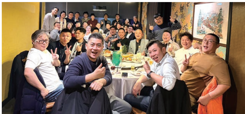
▲旅遊業二代會於1／13舉辦2026年首次例會。