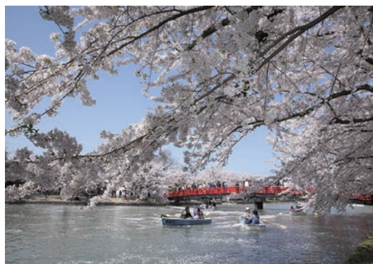
▲弘前公園賞櫻的玩法眾多，漫步公園內之外也能體驗乘船漫遊護城河內，悠閒享受粉嫩櫻花圍繞。