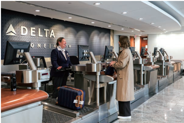
▲達美航空於美國樞紐機場設置達美至臻商務艙專屬登機報到空間，提供旅客更順暢的機場報到體驗。