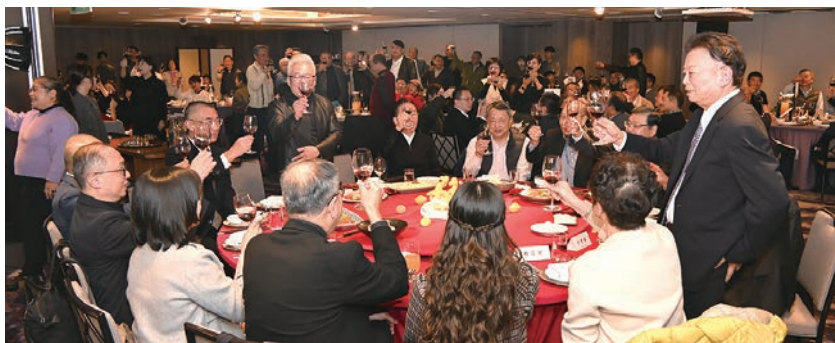
▲中華兩岸旅行協會於1/12舉辦歲末感恩餐敘，現場氣氛熱絡。