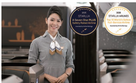
▲星宇航空以最年輕航空公司之姿，獲得Airline Ratings 7-Star PLUS最高等級認證。