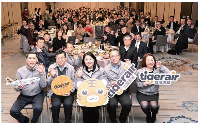
▲台灣虎航特別席開10多桌，並邀請超過百位的合作夥伴齊聚一堂。