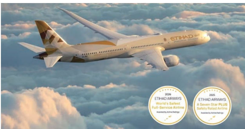
▲阿提哈德航空奪得「2026最安全的25家全服務航空公司（Full-Service）」第1名寶座。