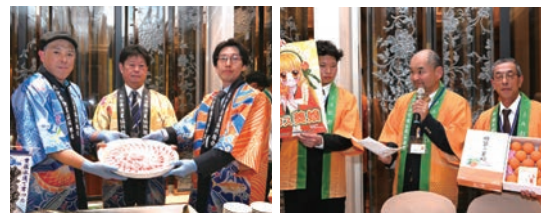
▲活動現場安排展示與解說大分縣特有農漁特產及觀光、商業資訊，讓到訪業者與媒體都能深入瞭解大分縣特色。