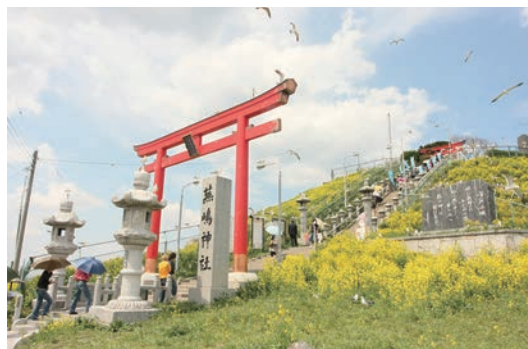
▲八戶市「燕島」是知名黑尾鷗繁殖地，每年3月中旬產卵、6月左右逐漸孵化，數千隻漫天飛舞絕景相當震撼，春夏還能兼賞黃澄澄油菜花風光。

▶青森睡魔祭每年固定在8/2～8/7期間舉行，是夏季來到青森絕不能錯過的超人氣祭典活動。