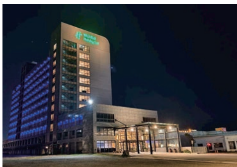
▲桃園機場假日酒店位處國際旅客往來要道，經國際酒店品牌掛名後業績可謂如虎添翼。

為積極吸引國際旅客，桃禧飯店集團近年宣布將其3間飯店加入洲際酒店集團（IHG）旗下，原有的桃園機場假日酒店、台北車站智選假日酒店、桃園智選假日飯店經過改裝升級後，正式加入IHG，盼藉由國際品牌的影響力增加更多國際客源。在今年度IHG大中華區來台巡展的展攤中，桃禧飯店集團即作為台灣唯一參展賣家，向業者展示經過重整煥新後的酒店特色與優勢。