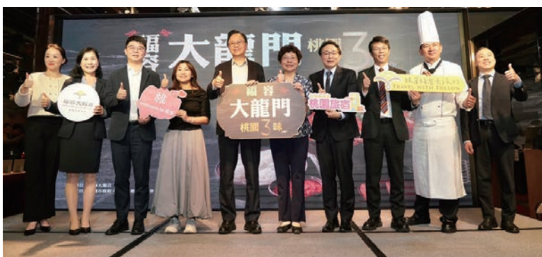
◀福容大飯店聚焦桃園，推出「福容大龍門·桃園三味」以3地特色入菜，並串聯在地觀光資源。