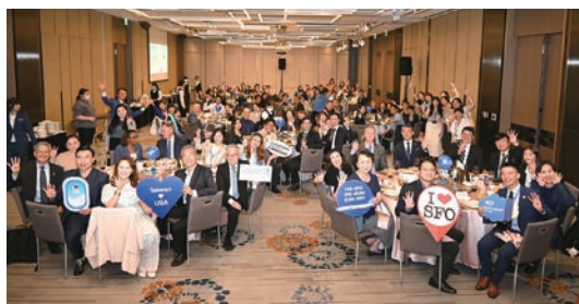
▲聯合航空（United Airlines）舉辦「UA 40黃金歲月·航向未來」同業感恩晚宴。

1. 機隊更新：台灣出發的2條航線將從B737-800升級為B737 MAX，涵蓋高雄—東京及台北—關島等航線。