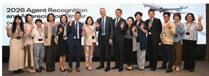
▲聯合航空（United Airlines）團隊合影。

為了慶祝美國250週年，AIT預告將在社群媒體發起「旅遊與觀光」推廣活動，邀請台灣旅客分享在美國的難忘回憶，並有機會獲得驚喜獎品。此外，AIT團隊每年也帶領台灣企業代表團參加「SelectUSA」選擇美國投資高峰會，長期以來與UA在招募與出行方面保持緊密協作。