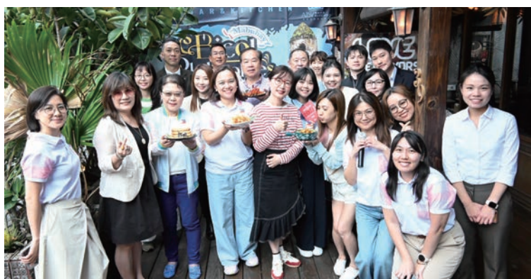
▲菲律賓觀光部台灣分處於4/10舉辦菲律賓觀光產品說明暨美食品嚐會。