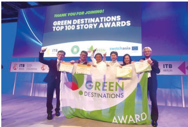
▲2024年頭城休閒農場以「綠色廚房故事」於柏林ITB旅展獲得綠色目的地故事競賽商業與行銷類別第2名。