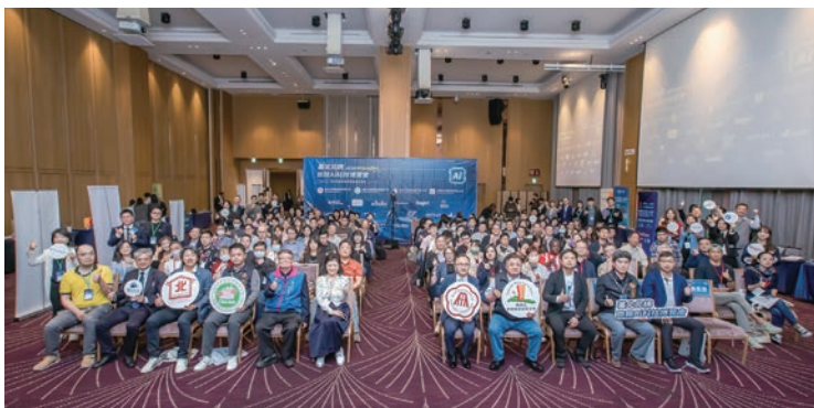
▲2026 NTAI-EXPO基北北桃旅館AI科技博覽會吸引近200家旅館業者及逾百位高階經理人參與。