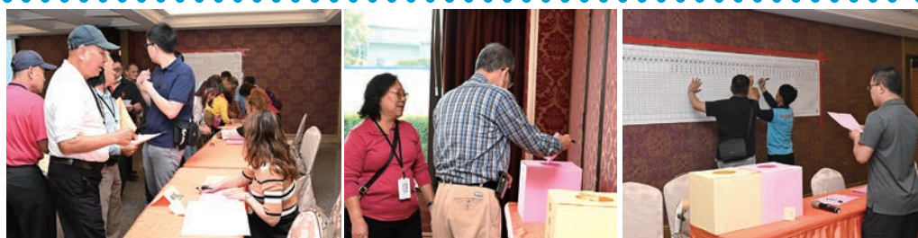
▲第5屆理監事選舉現場。