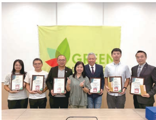
▲大東北角永續實踐故事競賽舉辦至今已至第4屆，透過行動者分享永續實踐經驗，也鼓舞更多人跟進響應。

2026年第4屆「大東北角永續實踐故事競賽」目前正持續徵件中，鼓勵地方業者、社區組織與各類觀光從業者，分享自身在永續旅遊、文化傳承與環境守護上的實踐經驗。東北角管理處指出，「大東北角永續實踐故事競賽」不僅是一項徵件活動，更是一項持續累積地方知識與經驗的過程。透過這些故事的分享與傳播，讓更多人看見地方日常裡的永續力量，也讓大東北角的永續行動持續被理解、被支持，並逐步觸發更多永續的旅遊活動。