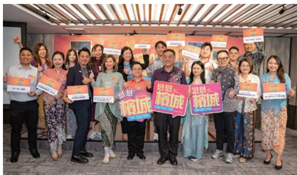
▲檳城環球旅遊機構帶領12家機構的16位業界代表來台，積極深化台檳雙邊合作。

在最新的統計資料中顯示，2025年台灣旅客共有42,386人次入境檳城，成為第4大國際客源地，展現台灣旅客對檳城的高度關注與喜愛。