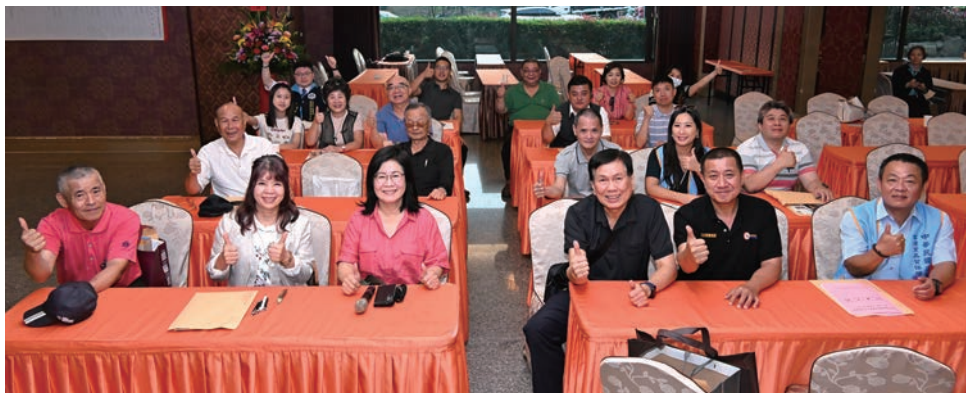
▲遊覽車客運業品質保障協會第5屆理監事團隊合影。