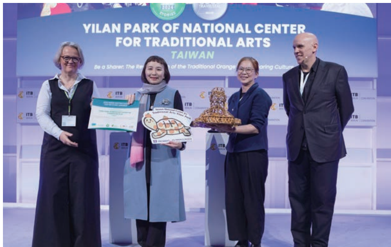
▲宜蘭傳藝園區以「柑仔龜分福文化故事」於2025年柏林ITB旅展獲得文化與傳統類別第3名。

在大東北角地區，永續並不只是政策口號，而是發生在日常生活中的具體行動。從旅宿業者落實節能減碳、餐廳選用地產食材，到社區團隊推動文化保存與海岸環境守護，看似平凡的日常實踐，正逐步累積成推動地方永續發展的重要力量。為讓這些在地行動被更多人看見，交通部觀光署東北角及宜蘭海岸風景區管理處（以下簡稱東北角管理處）持續舉辦第4屆「大東北角永續實踐故事競賽」，邀請地方觀光產業、社群團隊及行動者，透過故事形式分享發生於東北角的永續實踐。