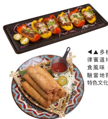
▲多樣的菲律賓地道美食風味，體驗當地獨有特色文化。

菲律賓觀光部台灣分處（以下簡稱菲觀部）於4/10於ABV南洋餐酒館，舉辦「菲律賓觀光產品說明暨Salosalo! Filipino Food Experience菲律賓美食品嚐會，現場邀請眾多經營菲律賓路線的業者、航空公司及媒體共襄盛舉，除了針對今年菲律賓市場布局介紹外，更透過地道美食風味，帶領大眾深度體驗菲律賓獨有的分享文化與熱情好客。