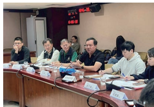
▲經濟部於4/7召開「關懷商圈塑膠製品影響現況座談會」。

府部門展開深度對話。針對塑膠製品供應現況、成本波動及應變機制提出精闢建言，充分展現商圈公協會與政府攜手穩定市場的決心。