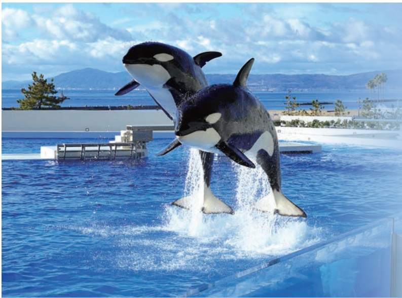
▲巨大的虎鯨伴隨音樂與指令從水中躍起，景象非常壯觀。

神戶須磨海洋世界是關西地區首屈一指的超人氣設施，結合水族館、生態教育、餐飲與住宿等功能，以「與海共生」為主題設計，位於白沙灘環繞的須磨海岸。從神戶市區開車約15分鐘即可抵達，距神戶機場約30分鐘、關西國際機場約70分鐘，交通相當便利。這裡也是西日本唯一能近距離欣賞虎鯨表演的場所，氣勢十足的跳躍與水柱搭配音樂演出，震撼又壯觀。無論暢遊活動豐富的水族館、安排住宿餐飲、或僅搭配午餐用膳皆相當推薦，歡迎同業多加利用。旅行同業若有任何神戶須磨海洋世界資訊需求，歡迎隨時洽詢向日遊顧問有限公司。