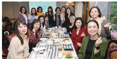
▲航旅業木蘭女子高爾夫球聯誼會於4/7舉行餐敘活動。