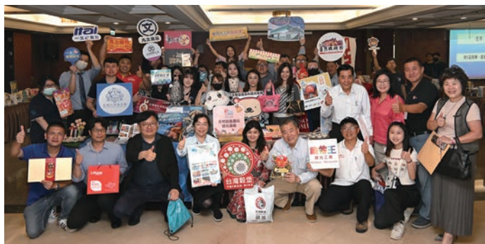
▲協會與觀光工廠促進協會合作，向會員夥伴介紹台灣在地特色產品。

遊覽車客運業品質保障協會於3/31假台中新幹線花園酒店舉辦第5屆第1次會員大會，針對各項會務進行報告及審查收支預算，並同時進行理監事的改選。最終，由鄭春綱當選理事長一職，未來將率領新團隊繼續為產業提供最優質的服務。