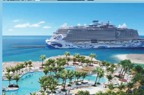
▲ 挪威郵輪成立於1966年，率先推出Freestyle Cruising®自由隨行郵輪體驗，徹底革新郵輪旅遊模式。

此次徵選活動讓我們知道美國有些很多郵輪港口，例如：紐約、西雅圖、阿拉斯加、邁阿密、羅德岱堡、夏威夷、聖地亞哥，洛杉磯、加爾維斯頓...等等著