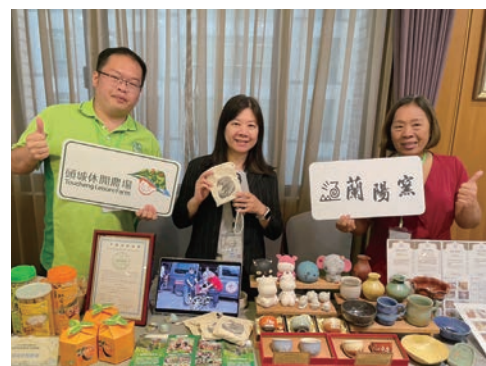
▲活動現場也邀請到眾多在地業者一同交流，如頭城休閒農場、蘭陽窯等知名代表共襄盛舉。