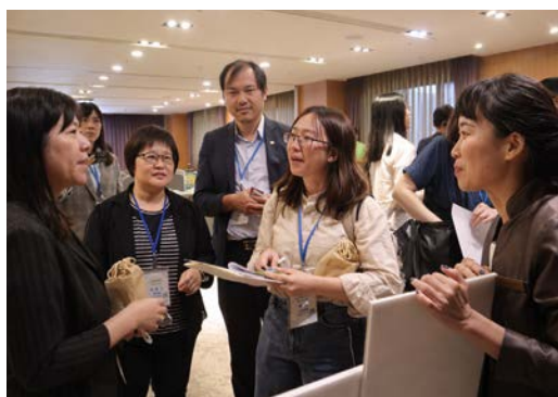
▲與穆斯林驗證業者面對面交流，展示特色服務並促進與旅行社媒合，強化穆斯林旅客需求。

大東北角觀光圈擁有豐富自然景觀與多元旅遊資源，並具備鄰近台北都會區之地理優勢。未來，東北角管理處將持續推動穆斯林友善旅遊環境優化，並透過產業合作與國際行銷，提升大東北角觀光圈於穆斯林旅遊市場之競爭力，打造具國際吸引力之友善旅遊目的地。