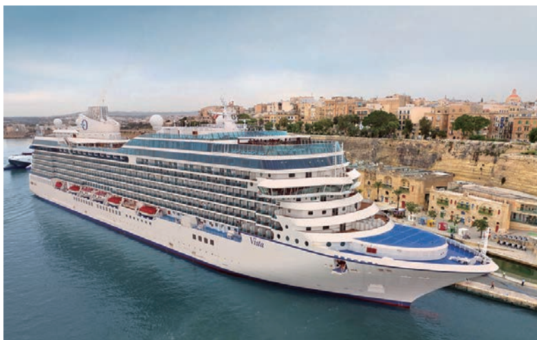
▲大洋郵輪2027年環遊世界航程選擇由2023年下水的新世代船艦Vista（綺麗號）執航。

大洋郵輪以精緻餐飲、舒適空間與深度航線著稱，像是2027年推出最長達244天的環球歷險之旅（Epic Global