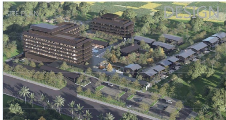
▲桂田集團將於台東推出以溫泉度假為核心的「桂田禾嶼紅葉溫泉度假酒店」。

桂田集團4/8於台東鹿野紅葉溫泉區舉行「桂田禾嶼紅葉溫泉度假酒店」開工動土典禮，為集團布局東部觀光市場的重要里程碑。酒店整體規畫以溫泉度假為核心，結合獨棟Villa、室內外湯泉設施、多元房型與精緻餐飲空間，打造兼具休憩與深度體驗的度假環境。在設計上則強調空間美學與自然景觀融合，串聯室內外場域，營造舒適放鬆的旅宿氛圍，讓旅客在享受溫泉之餘，也能感受都蘭山景與台東特有的寧靜慢活節奏。桂田集團在台東除擁有台東桂田喜來登酒店外，年底亦將推出桂田安悅月子中心與桂田璞域酒店，串聯媽咪月子服務、親子旅宿，未來「桂田禾嶼紅葉溫泉度假酒店」的成立，將更加深完整的東部幸福旅遊體驗。