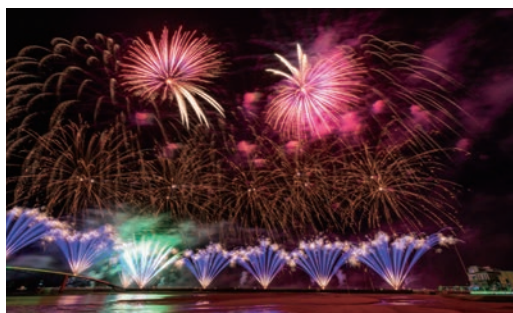
▲2026 澎湖花火節即將盛大舉行，今年度特別與《七龍珠Z》熱血聯名，勢必吸引動漫迷前往朝聖！

看準澎湖旅遊熱潮，立榮航空與長汎假期再次強強聯手，推出2026年度「澎藍心動·跳島秘境遊」澎湖特色行程！行程跳脫傳統澎湖本島遊程，帶領旅客深入較難抵達的東北海小島，開箱澎湖秘境，並結合與熱門IP《七龍珠Z》聯名的澎湖國際海上花火節遊程，從白天美到深夜。除團體遊程之外，「立榮假期」也祭出機加酒優惠，讓旅客能更輕鬆地打造專屬的澎湖假期。