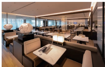
▲商務艙休息室（西側）經擴建後，總面積已成為仁川國際機場內規模最大的休息室。

現場烹飪台提供由仁川君悅酒店星級主廚團隊精心製作的各式新鮮餐點，自助餐區設計多元，滿足旅客不同口味需求。此外，旅客還能品嚐到仁川君悅酒店甜點師手工製作的各式甜點、藥果等韓式傳統茶點、新鮮時令水果及香醇軟冰淇淋。酒吧區則常駐專業調酒師，可依旅客個人偏好，現場調製各色創意雞尾酒及飲品。