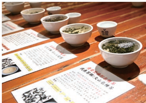
▲藉由品茗感受不同茶葉在鼻腔與口腔所散發出的多層次香氣，還能認識各款茶葉的特色。

從乾燥的茶葉開始，展示5款茶葉的型態與味道，在沖入熱茶後看著茶葉舒展開來，隨之而來的是不同茶種散發出的獨有香氣。最後透過啜吸法小口啜取茶湯，讓空氣與茶在口腔裡流動，感受不同茶在口中散發出的多層次味覺饗宴。