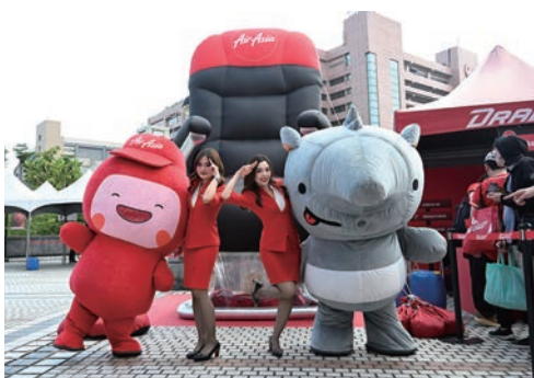
▲AirAsia於4/17~19在天母棒球场推出「亞洲領航 氣勢如紅Batter up, Buckle up聯名航空主題日」。