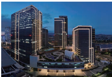
▲台北南港大地雅詩閣酒店外觀。