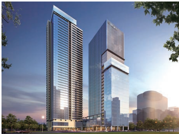
▲酒店建築由國際知名建築事務所HANDEL Architects與BLINK Design Group操刀設計，整體空間結合品牌與城市意象。

萬豪國際集團與馥華集團攜手打造的「台北板橋馥華艾美酒店」即將正式開幕。作為萬豪國際於台灣少見的直營據點，酒店不僅象徵國際品牌正式進駐新北核心區域，更被視為高端旅宿版圖向板橋延伸的重要里程碑。相較傳統商務型酒店，艾美品牌更強調藝術、人文與生活風格，為當代旅客提供兼具靈感與品味的住宿體驗。從區位條件來看，板橋具備3鐵共構的交通優勢，位於桃園國際機場與台北松山機場之間，並可串聯雙北城市軸線與週邊觀光資源。同時，板橋亦為串聯雙北外圍觀光的重要門戶，可快速連結三峽、鶯歌等文化聚落，延伸至茶文化與陶瓷工藝等深度旅遊體驗，進一步強化其作為雙北關鍵樞紐的發展潛力。