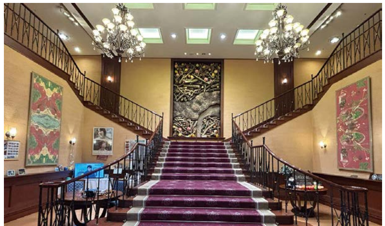
▲館內迎賓大廳裝潢高雅又氣派，是許多遊客喜愛的拍照留念地點。

館內具備和室、洋室、和洋室等共43間客房，大多數為雙床房型，也可對應無障礙客房特殊需求，不用踏出房門，就有機會直接從窗外眺望富士山，或欣賞「新日本3大夜景」之一的甲府盆地百萬夜景，日夜皆有迷人風情。館內男女有別的大浴場最晚至午夜12點都有開放，可享受有助於恢復疲勞、舒緩關節或肌肉痠痛的鹼性單純溫泉，浴場使用天然石頭打造而成，營造出獨特的放鬆氛圍，天氣晴朗時更可一邊泡湯，一邊欣賞富士山與甲府盆地璀璨夜景，洗去旅途疲憊。