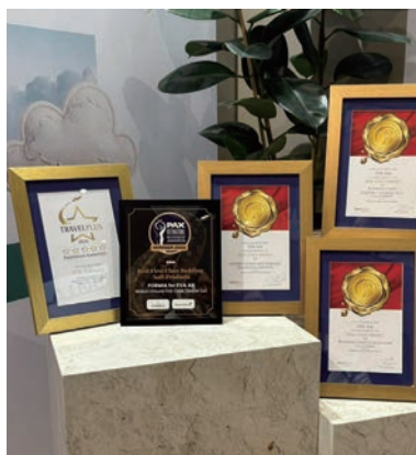
▲長榮航空從TravelPlus和PAX International雜誌所舉辦的頒獎典禮中，一舉榮獲多項大獎肯定。

長榮航空（以下簡稱長榮）機上服務用品廣受旅客喜愛，此次在德國漢堡舉行國際旅遊餐飲和機上服務用品博覽會（WTCE），便一舉榮獲6大獎項肯定，包括TravelPlus所舉辦的TravelPlus Airline Amenity Bag Awards，榮獲「最佳亞洲商務艙睡衣（Maison