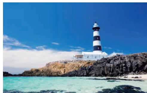
▲目斗嶼黑白燈塔與清澈大海完美同框，是旅客必訪的打卡熱點，也可以感受北方離島的寧靜氛圍。

8/25熱血登場，長汎假期也規劃了花火觀賞體驗，卡位最震撼的觀賞視角，確保旅客能以最舒服的方式直擊煙火展演。