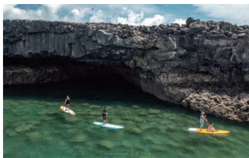
▲旅客划著SUP直抵鐵砧嶼，近距離感受玄武岩帶來的視覺震撼。

「澎藍心動·跳島秘境遊3日」團體行程，跳脫常見的大眾打卡路線，解鎖澎湖東北海離島。行程包括前往澎湖最北端的無人島「目斗嶼」、登上曾入選全球10大秘密島嶼的「虎井嶼」、可以在有「台版馬爾地夫」之稱的澎澎灘體驗SUP立槳。餐食部分特別安排西嶼人氣小吃外坵炸粿，讓旅客同步品味在地海味，每人只要14,999元起，立即享受金獎等級的全包式假期。