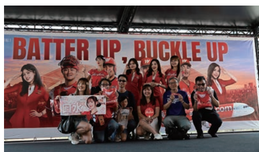
▲AirAsia於現場精心準備多個舞台及抽獎活動。

為深化台灣市場經營、拉近與在地粉絲的距離，AirAsia亞洲航空（以下簡稱AirAsia）首度跨界與中華職棒味全龍合作，於4/17~19在天母棒球场推出「亞洲領航 氣勢如紅Batter up, Buckle up聯名航空主題日」，正式開啟航空品牌與台灣棒球文化的全新合作。