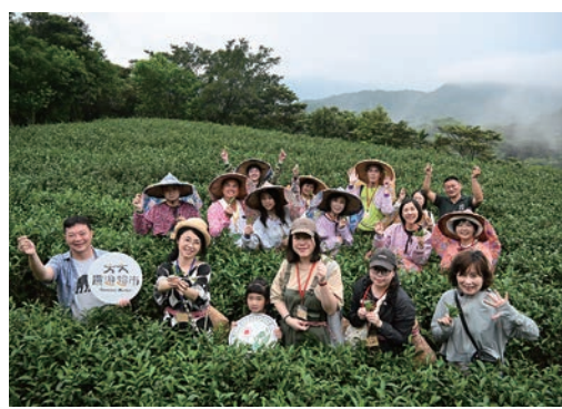
▲穿上採茶衣體驗當1日茶農的同時，還能欣賞茶園雲霧飄渺的美景。

穿上專業採茶裝備化身成採茶農，在茶園以第1視角體驗茶農生活。過程中不僅能學習採茶技巧，更能近距離聞到新鮮的茶葉清香，沉浸在雲霧繚繞的茶園之中，俯瞰別於城市的靜謐山林美景，令人心曠神怡。