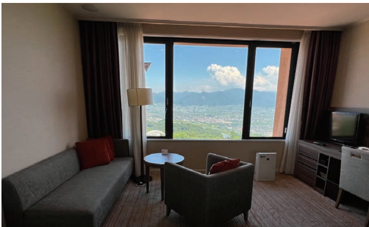
▲標準雙床房具備大片窗台，可飽覽周圍自然風光。