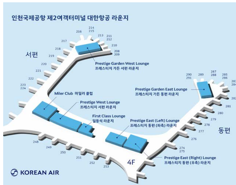
▲大韓航空近期將機場休息是全面翻新擴建，整體休息室面積大幅提升。

為提升旅客便利性，持有Morning Calm會員資格及希望使用休息室優惠券的旅客，現可通過大韓航空官方網站及手機APP的「休息室提前預約服務」，