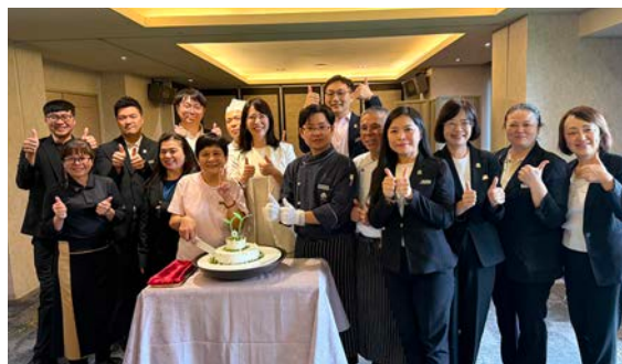
▲大地酒店走過11個年頭，特別感謝資深員工一路以來的支持與辛勞。

北投5星溫泉酒店領導品牌大地酒店，於4/15正式宣布將引進全球頂尖公寓「雅詩閣」(Ascott)，於南港軟體園區核心地帶打造頂級公寓式酒店「台北南港大地雅詩閣酒店」，預計於2026年第4季開幕。