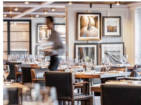
▲大洋郵輪以精緻餐飲、舒適空間與深度航線著稱，2027年推出最長達244天的環球歷險之旅，特別提供分段參與的彈性，讓旅客能依自身節奏規劃旅程，實現環遊世界夢想。