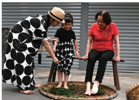
▲現以腳踩揉捻茶葉的方式已不多見，在遊程中卻能親身嘗試這不可多得的體驗。

從採茶、萎凋、浪菁、殺菁、揉捻至乾燥，完整體驗到製茶「採、凋、菁、揉、乾」5大過程，看著親手將鮮採的翠綠茶葉經過一系列的製程，成為熟悉的乾燥茶葉樣貌，同時還能嘗試到現已十分少見的腳踩揉捻等傳統技法，更能感受到製茶文化的不易與職人精神。