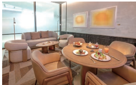
▲頭等艙休息室無論在休憩空間與餐食服務皆明顯升級，給予旅客最尊貴的服務體驗。

餐具的選擇除沿用頭等艙機上頂級選品外，更特別引進韓國李基祖作家的白瓷與李亨根作家的鉛青銅器，為旅客帶來獨具匠心的差異化用餐體驗。此外，休息室內隨處可見的藝術珍藏亦是點睛之筆。休息室內亦設有淋浴間、健康區等便利設施，進一步提升旅客的出行舒適度。在獨立的私密空間內，旅客可使用按摩椅舒緩身心。寬敞的淋浴間內，化妝區與淋浴區獨立分區，並配備高品質盥洗用品及專屬拖鞋，致力於為旅客打造極致的休憩體驗。