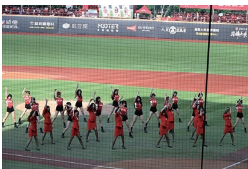
▲AirAsia空服員跨界與味全龍啦啦隊「小龍女」進行開場表演。