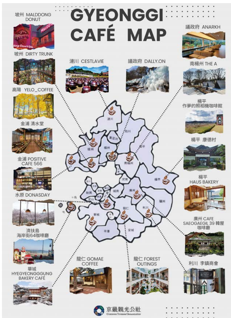
▲京畿道大型景觀咖啡廳地圖。