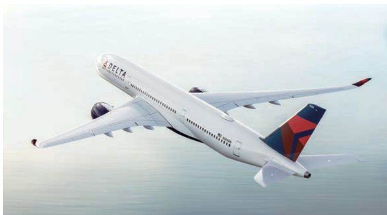
▲達美航空台北—西雅圖航線目前由Airbus A350-900執飛。