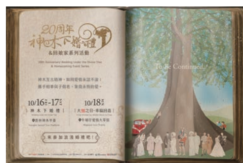
▶今年活動邁入20週年，邀全球新人來阿里山體驗浪漫婚禮。

台灣最具國際代表性的婚慶盛事—「阿里山神木下婚禮」，今年正式邁入第20週年！交通部觀光署阿里山風景區管理處（以下簡稱阿里山管理處）於5/19在華山1914文創園區光點華山電影館影像穿廊辦理「2026神木下婚禮20週年暨回娘家記者會」。在交通部觀光署、林鐵處等眾多貴賓的共同見證下，以種下一株永恆—「索恩娜的誓約」正式啟動。