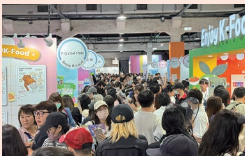
▼ 韓國文化觀光大展吸引滿人潮。