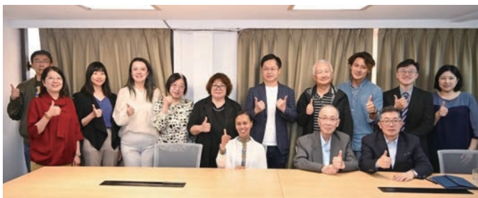
▲旅行同業、媒體、KOL共同見證總代理合作備忘錄簽署儀式。

2024年，衣索比亞航空的機隊規模已達成135架以上的里程碑，且擁有非洲最年輕的現代化機隊，包括波音787夢幻客機與空中巴士A350系列。其總部設