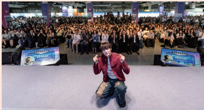
▲韓國男團MONSTA X成員玟赫。