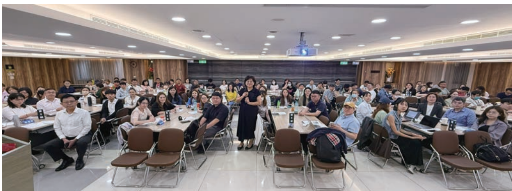
▲旅行業品質保障協會於5/21舉辦台北場旅遊糾紛處理教育訓練課程。

為協助業者應對旅遊糾紛，並從根本減少糾紛案件之產生，交通部觀光署特別委任旅行業品質保障協會（以下簡稱品保）定期舉辦「旅遊糾紛處理教育訓練課程」，此次課程特別聚焦「旅遊定型化契約及相關法規」及「糾紛案例分析及研習」，並於北、中、南、東共舉辦4個場次的研習活動。此外，品保亦協助推動調處委員職能認證，凡業者參加28小時培訓、8小時法規及糾紛相