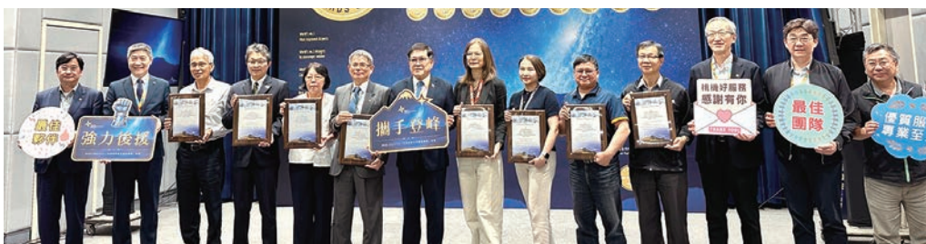
▲機場公司於5/19舉辦頒獎典禮，公開表揚台灣世曦、桃園航勤、長榮航勤、星宇航空等8家關鍵合作單位。