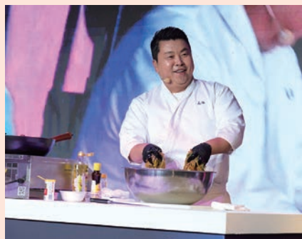
▲《黑白大廚2》等節目獲得高人氣的鄭鎬泳主廚。

韓國文化體育觀光部公布今年第1季訪韓外國觀光客約為476萬人，較去年同期增加了23%。其中，訪韓市場全球排名第3的台灣觀光客約54萬人次，較去年同期大幅成長38%。為達到2026年台灣訪韓觀光客232萬人次目標，韓國觀光公社5/15~17特別假華山1914文化創意產業園區東2館舉辦「韓國文化觀光大展」。除了豐富多元的K-Culture內容，也邀請多組藝人和韓國表演團隊，包括韓國男團MONSTA X成員玟赫、因《黑白大廚2》等節目獲得高人氣的鄭鎬泳主廚，以及來自大田的啦啦隊成員南珉貞等