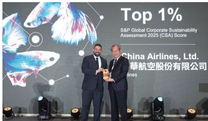
▲中華航空憑藉卓越的ESG經營表現，9度入選標普全球永續年鑑，勇奪企業永續評比全球航空業最高分。

天合聯盟SkyTeam「航空飛行挑戰」，持續發想並推動多元永續方案，進而導入日常營運航班，歷年榮獲「永續航空燃油轉型獎」、「最佳前瞻策略獎」、「最佳機上用品供應鏈獎」、「最佳應用創新獎」、「最佳貨運永續創新獎」及「最佳員工參與獎」等多項肯定；同時2度榮獲「台灣企業永續獎TCSA」永