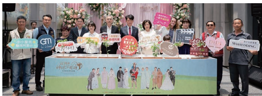
◀「阿里山神木下婚禮」於5/19以種下一株永恆—「索恩娜的誓約」正式啟動。