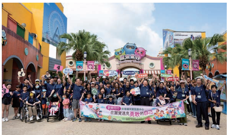
▲麗寶樂園渡假區攜手彰化基督教兒童醫院兒童發展中心，邀請120位共30組罕病與發展遲緩兒家庭走進樂園。

麗寶樂園渡假區長期關注多元平權與友善共融議題，持續透過實際行動推動CSR與ESG理念，5/17更特別攜手彰化基督教兒童醫院兒童發展中心，邀請120位共30組罕病與發展遲緩兒家庭走進樂園，舉辦「歡樂同行，在麗寶遇見勇敢的自己」關懷活動，透過陪伴與互動，打造真正友善且無障礙的共融環境。麗寶樂園渡假區表示，ESG的核心精神不只是環境永續，更包括對社會弱勢的關懷與支持。此次活動不僅是企業社會責任（CSR）的具體實踐，更希望將樂園轉化為一座「共融教育場域」，讓罕病兒童與家庭能自在參與公共休閒空間，感受平等與尊重，進一步落實DEI（多元、平等、共融）精神。