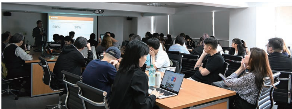
▲旅行業品質保障協會於北、中、南舉辦多場說明會，讓業者能加速銜接業界新訊。

旅遊界的奧斯卡「國際金質旅遊獎」於即日起開放收件，為讓業者更加瞭解細項與新增規範，旅行業品質保障協會（以下簡稱品保）特別舉辦國際金旅獎輔導暨產業發展說明會，除分享今年評選新增內容與分享撰寫技巧外，亦針對交通部觀光署今年提出的旅遊業補助政策作說明。交通部觀光署為加速旅遊產業數位轉型，今年推出總額約9,000萬元的旅行業發展方案補助，除補助公協會教育訓練外，另針對首次建置電子商務管理系統業者及取得永續標章提供補助。其中建置電子商務管理系統涵蓋ERP企業資源規畫系統、CRM客戶關係管理系統、財務會計系統、線上報名平台與電子支付串接，不限廠商與方案，於今年度首次建置系統皆可申請，若為更換或升級既有系統、非正式商業系統者則不列入補助範圍。