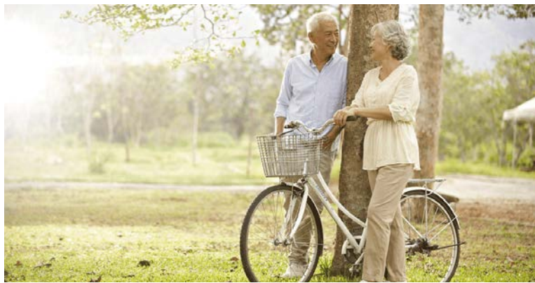
▲理想大地渡假飯店特別提供「專屬In-Room Check-in」服務，讓旅程一開始就為長輩多保留一分體力。

理想大地渡假飯店宣布與花蓮5家優質飯店：太魯閣晶英酒店、瑞穗天合國際觀光酒店、遠雄悅來大飯店、美侖大飯店及福容大飯店花蓮，共同呈獻「樂齡1+1花蓮雙宿聯名住房專案」，活動專為年滿60歲的旅人設計，每房每晚8,500元起。即日起至6/30，旅客於參與飯店之任一官網訂購本專案，入住第1間飯店後即可獲贈另1間飯店住宿券，以此種雙宿模式，賦予了樂齡族群更自主、更具彈性的度假選擇。理想大地特別提供「專屬In-Room Check-in」服務，抵達後即可由管家引導進入客房休息、優雅辦理手續，並同步進行飯店設施與園區導覽介紹，並準備「睡眠呼吸引導卡」，協助長輩在陌生的度假環境中也能安心入睡。