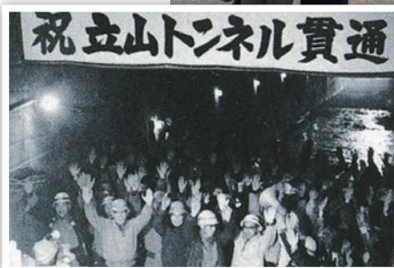
▲2026/05/19，現時點雪之大谷的雪牆仍高達11公尺。