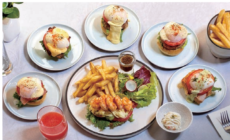
▲The Café推出「經典班尼迪克蛋」系列，套餐均附沙拉、脆薯等副餐及飲品。

汐止福泰大飯店1樓「The Café」西餐廳，即日起推出6款「Brunch套餐」，包含5款「經典班尼迪克蛋」系列，以及特製款「酪梨滑蛋鮮蝦開放式麵包」。6款口味各有特色：「菠菜燻鮭魚」帶出海味鹹香、「起司厚牛肉」飽足肉感、「青醬奶油嫩雞」香濃中不失清爽、「豬排切達起司」焦香經典不敗、「植物肉松露」蔬食低負擔；另特製款「酪梨滑蛋鮮蝦開放式麵包」，以嫩滑炒蛋取代水波蛋，風格更為輕盈。汐止福泰大飯店坐擁近郊自然環境優勢，完成山徑活動、晨跑、騎單車自我挑戰後，套餐以蛋、肉類、海鮮為核心，以嚴選的原型食材搭配精準烹調，提供優質的動、植物蛋白來源。