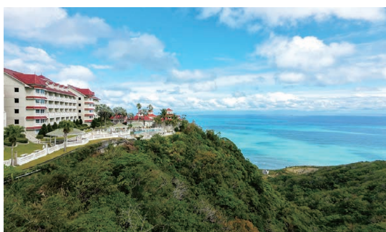
遠雄悅來大飯店獲國際雙榮耀，入選米其林指南並蟬聯謬思酒店大獎金獎。

遠雄悅來大飯店近期再度於國際舞台大放異彩，一舉榮獲2026年《MICHELIN Guide米其林指南》飯店評鑑入選，並於2026年、2025年連續2年獲得《MUSE Hotel Awards謬思酒店大獎》家庭全包飯店金獎，以卓越的旅宿品質、全齡友善服務、在地深度旅遊探索，獲得國際專業評鑑肯定。為與旅人共享榮耀與喜悅，遠雄悅來大飯店FB粉絲專頁特別舉辦網路活動，留言慶賀遠雄悅來大飯店獲得國際雙獎，即可抽萬元住宿券、自助餐券等大獎。同時於夏季推出「山海狂饗曲」住房專案，特別規劃2泊7食的專案內容，提供精心準備的餐食、池畔狂歡派對，午後以烤肉饗宴、夏日特調揭開序幕，夜晚則由專業樂團帶來精彩演出，讓歡樂氛圍從白天延續至夜晚。