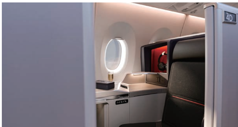
▲套房式的達美至臻商務艙 (Delta One) 座位提供更舒適且具隱私感的長

隨著春夏旅遊季到來，達美至臻商務艙 (Delta One) 機上備品包也迎來全新升級。由Missoni設計的包款現推出5種季節限定色，並以靈感來自達美全球航網中的代表城市作為命名，同時加入全新機上保養組合，包括澳洲高端保養品牌Grown Alchemist的Hydra-Restore眼膜。這項機上獨家產品於正式零售上市前，率先於達美至臻商務艙登場，其靈感來自保濕研究與近期受到關注的美容趨勢。