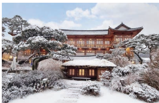
▲華城Hyegyeongggung Bakery Café。