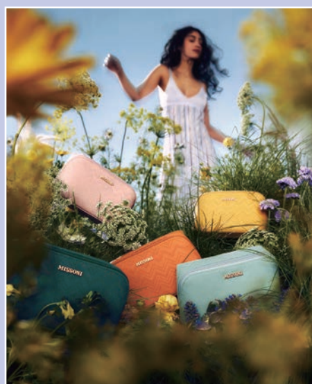
▲Missoni機上備品包推出5款季節限定色，以靈感來自達美全球航網中的代表城市為設計概念。