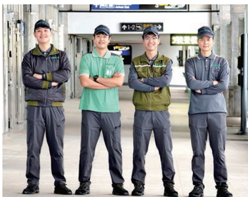
▲立榮航空5/15宣布勤務服務團隊即日起全面更換新一代制服。

立榮航空於5/15宣布勤務服務團隊即日起全面更換新一代制服，包括機坪作業及行李託運勤務人員。此次迎來的制服大改款，不僅蒐集第1線同仁的意見反饋，更是聚焦「極致穿著機能」與「高效率作業便利性」2大設計理念，結合企業精神與視覺美學，展現立榮航空專業和充滿活力的服務品牌形象。