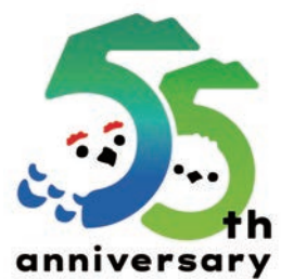
▲立山黑部55週年Logo貼紙

貼紙設計精美且極具收藏價值，數量有限送完為止，絕對是造訪遊客不容錯過的紀念小物！