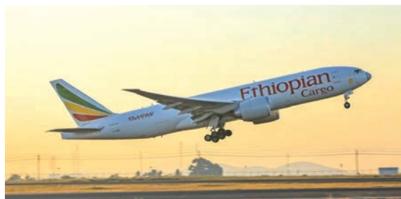
▲衣索比亞航空的機隊規模已達成135架以上的里程碑，且擁有非洲最年輕的現代化機隊。

為了提升旅客體驗，衣索比亞航空更展現了極大的誠意，凡中轉時間超過8至24小時的旅客，航空公司將免費提供過境旅館住宿、餐飲及簽證服務，讓旅