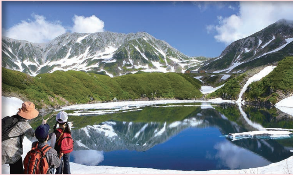
▲夏季融雪之後的御庫裏池，呈現白雪與綠地交錯美麗湖景。

立山黑部阿爾卑斯山脈路線可說是日本首屈一指的高山觀光路線，今年正式迎來全線開通55週年！自1971年開通以來，立山黑部阿爾卑斯山脈路線便以得天獨厚的雄偉大自然震撼無數旅客，春季擁有魄力滿點的「雪之大谷」，初夏融雪後的「御庫裏池」宛如高山藍寶石般美麗、黑部水庫能欣賞氣勢磅礴洩洪奇景，入秋後紅葉遍佈景象更是無與倫比，在不同時節皆展現出無可取代的迷人風貌。為了感謝海內外遊客長年來的支持，並慶祝橫跨半世紀的輝煌里程碑，立山黑部特別在今年策劃一系列紀念活動，涵蓋數位互動、實體集章、社群串聯與限定紀念品等，讓到訪旅客能以更多元的視角體驗與感受立山黑部魅力。