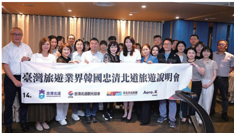
▲韓國忠清北道北部圈代表團訪問台灣，展開一系列精準的市場推廣活動。