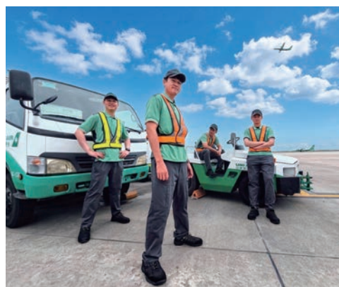
▲制服聚焦「極致穿著機能」與「高效率作業便利性」2大設計理念。

立榮航空於5/15宣布勤務服務團隊即日起全面更換新一代制服，包括機坪作業及行李託運勤務人員。此次迎來的制服大改款，不僅蒐集第1線同仁的意見反饋，更是聚焦「極致穿著機能」與「高效率作業便利性」2大設計理念，結合企業精神與視覺美學，展現立榮航空專業和充滿活力的服務品牌形象。