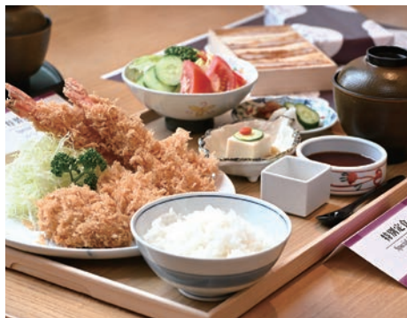
▲迎向百年的里程碑，銀座梅林始終秉持著「以美味款待賓客（おもてなし）」的初衷。

無須特地到日本辛苦排隊，來台北大倉久和大飯店就能體驗橫跨一世紀的極致美味！來自東京銀座的百年名店「銀座梅林」即將迎來創立100週年的輝煌時刻，為了將這份極具紀念意義的百年慶典獻給台灣，大倉久和大飯店特別邀請「銀座梅林」於5/21~5/23，在飯店內5樓日本料理