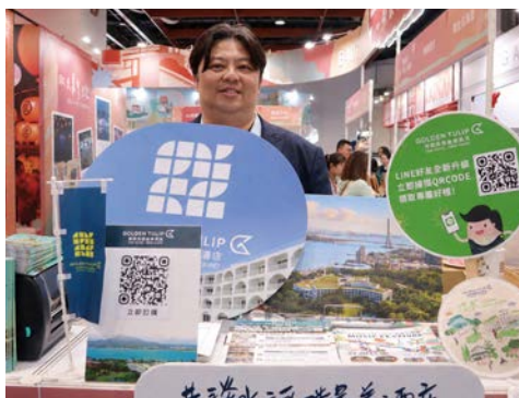
▲將捷金鬱金香酒店祭出住宿、餐券多種限量超殺優惠。