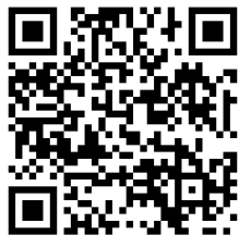
▲兒童套餐供應餐廳清單。

深谷花園PREMIUM OUTLETS®集結了約130間品牌，包含Adidas、ARMANI、BEAMS、COACH、MICHAEL KORS、Nike、New Balance、PUMA等國際知名品牌，以及新進駐的BANANA REPUBLIC與MARK & LONA。此外還有SANRIO、SEIKO、T-FAL、成城石井超市等，涵蓋時尚服飾、戶外運動、生活雜貨等多元品類。商場內將於6/11~6/21舉辦「PREMIUM OUTLETS SALE」特賣活動，讓旅客享受超值的購物樂趣。設施另一大亮點為極具魅力的「親子友善」服務，境內貼心設有投幣式嬰兒車租借、哺乳室與尿布更換台外，更有自開幕來廣受歡迎的兒童專屬遊樂區「嘎哩嘎哩君冰棒樂園」（部分設施需另付費），親子同樂元素十分充實。餐飲方面則集結約30間店家，包含埼玉縣在地人氣名店在內，提供多樣化的餐飲選擇，且多達18間餐廳更提供專屬兒童套餐，讓全家大小的購物與美食體驗一次滿足，歡迎掃描QR Code進一步查看。