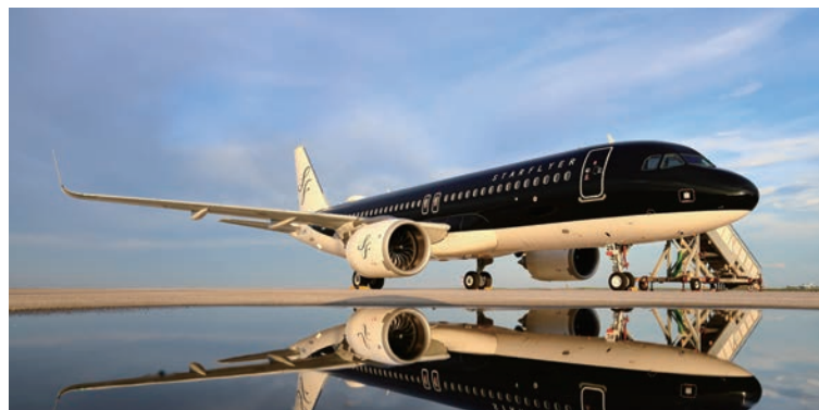
▲以黑色時尚為外觀的星悅航空，創造大膽前衛的形象。

星悅航空宣布「北九州—台北（桃園）」航線將於9/2起正式復航。該航線規畫每週提供3班往返，北九州出發（班號7G801）為週日、三、五深夜；台北出發（班號7G800）則為週一、四、六清晨。為了照顧深夜與清晨出發的旅客，星悅航空特別準備了具日本特色的輕食、名產點心及飲品，致力於提供舒適的空中旅程。有關個人票價及開放訂位的詳細時間，預計將於6月左右公布。星悅航空表示，將持續提升服務品質，誠摯邀請旅客再次搭乘體驗。此外，鳳凰、信安、五福、易飛網、可樂、旅天下、百威、駿樺皆有推出相關產品，歡迎逕洽。