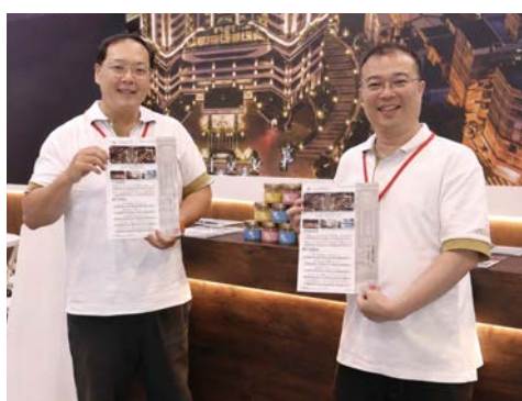
▲村却國際溫泉酒店推出多元優惠。