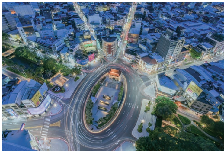
▲新竹是座充滿驚喜、兼具歷史感、科技感與生活感，且「剛剛好」的城市。

很多人對於新竹市的第一印象往往是高科技的「台灣矽谷」，但其實對於許多國際觀光客而言，新竹其實是座充滿驚喜、兼具歷史感、科技感與生活感，且「剛剛好」的城市。