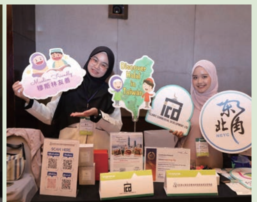
▲透過台灣觀光推廣會向當地民眾及旅遊業者介紹東北角觀光圈四季旅遊資源、多元主題遊程及穆斯林友善旅遊環境。