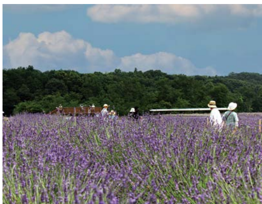
▲千年之苑薰衣草園在6月綻放夢幻紫色花海。

每年6月上旬至下旬「千年之苑薰衣草園」迎來薰衣草盛開季節，旅客可以漫步於廣闊的紫色花海中，感受初夏特有的浪漫氛圍與花香。搭配深谷花園PREMIUM OUTLETS®的購物行程，是6月份最具代表性的東京近郊自然賞花景點。