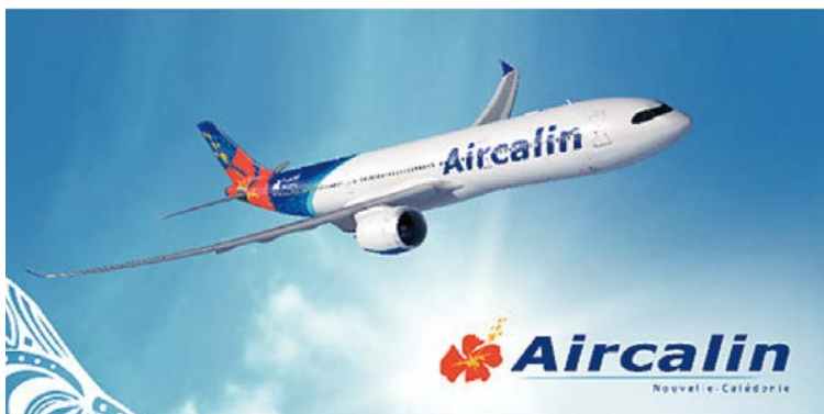
▲AIRCALIN成立於1983年，是新喀里多尼亞（New Caledonia）的國家航空公司。

新喀里多尼亞的國際航空公司—喀里多尼亞航空（以下簡稱AIRCALIN）宣布，自6/1起，正式任命APG Taiwan 豪全旅行社擔任其台灣區總代理（GSA），全面負責AIRCALIN在台灣市場的市場推廣、客運銷售及旅行社票務協助等業務。此次強強聯手，展現了AIRCALIN深耕台灣及亞洲市場的決心，也為台灣旅客前往南太平洋度假天堂提供了更便捷的管道。APG Taiwan擁有深厚的航空代理經驗與完善的同業通路網路，未來，將全力協助AIRCALIN推廣其現代化的飛航服務，並與台灣各大旅行社緊密合作，包裝出更多元、具吸引力的南太平洋旅遊產品，引領台灣旅客探索新喀里多尼亞的無限魅力。