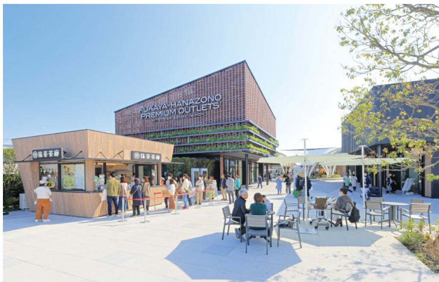
▲深谷花園PREMIUM OUTLETS®商場建築融合當地紅磚以及自然特色。