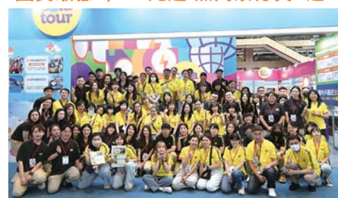
▲可樂旅遊團隊大合照。