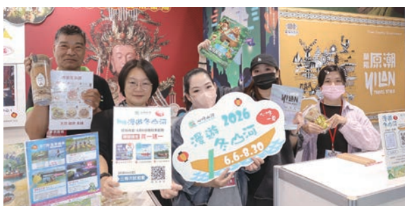
◀宜蘭縣政府團隊與業者合影。