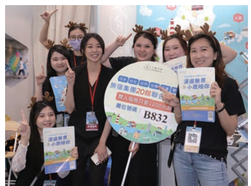
▲小鹿文娛團隊合影。