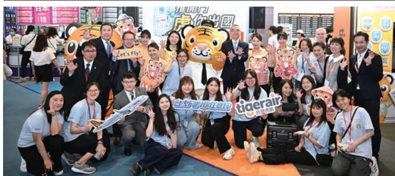
▲台灣虎航以沉浸式體驗、豐富的活動，以及正式亮相的「虎加酒tigertel」，成為旅展最熱門的攤位之一。