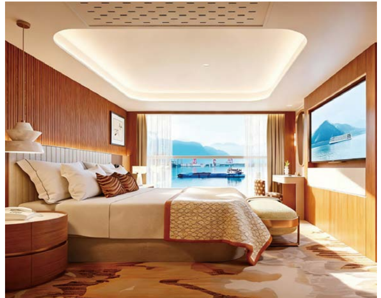
▲客房以「移動式江景宅」為概念，全數江景房配備180度獨立觀景陽台。

高 端河輪品牌世紀遊輪正式宣布，全新旗艦船「世紀夢想號（Century Vision）」將於9/21正式首航，投入重慶至宜昌三峽航線象徵長江高端旅遊正式邁向新世代，以更高規格的硬體、服務與沉浸式體驗，重新定義亞洲內河遊輪旅行。