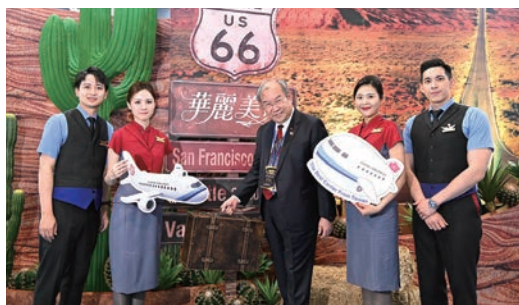
▲中華航空董事長高星漢（中）與空服員在中華航空展區前合影。