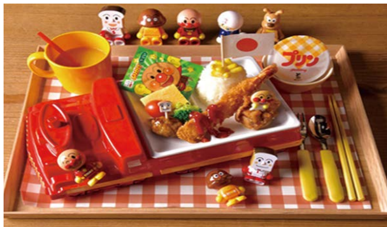
▲以鰻魚料理聞名的瓢六亭餐廳，推出結合麵包超人特色的兒童套餐。

位於埼玉縣深谷市的「深谷花園PREMIUM OUTLETS®」，自東京都內出發車程約80分鐘，亦可搭乘秩父鐵道至「深谷花園站」步行3分鐘，串聯首都觀光圈交通便捷。館內網羅約130間店鋪，主打充實遊具與親子友善環境，非常適合家庭客群造訪。初夏期間造訪，6/13~6/28推薦結合坐擁2萬株薰衣草的「千年之苑薰衣草園」，即日起至6/21前亦可前往幸手市「權現堂公園」的繡球花祭欣賞萬株繡球花勝景。此外，週圍還有川越老街或能感受急流與奇岩怪石的長瀨溪谷遊船可體驗，打造充實多彩的關東近郊1日之旅。旅行業者如有任何相關資訊需求，歡迎隨時聯繫向日遊顧問有限公司。