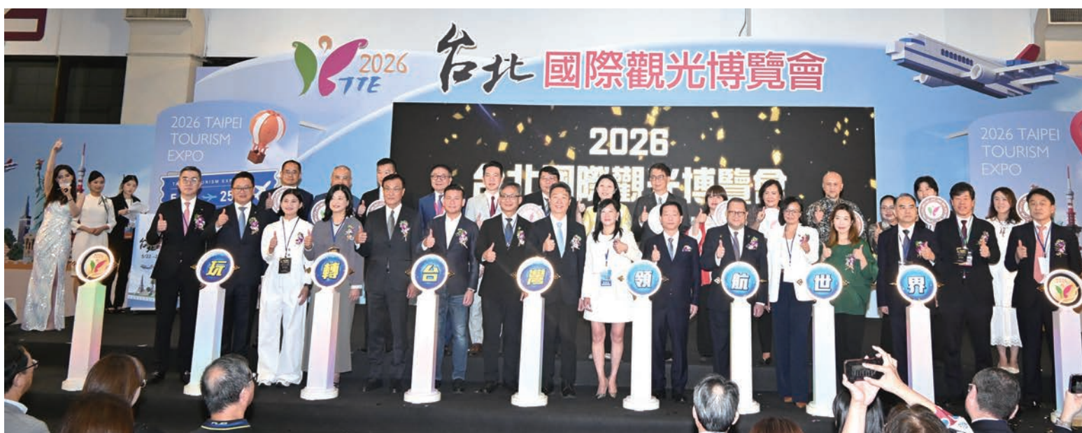
▲作為北台灣上半年最大規模的旅展，TTE台北國際觀光博覽會於5/22~5/25盛大舉辦。

TTE台北國際觀光博覽會於5/22~5/25盛大舉辦，首日便吸引大批民眾湧入，為即將到來的暑期假期做最後衝刺。