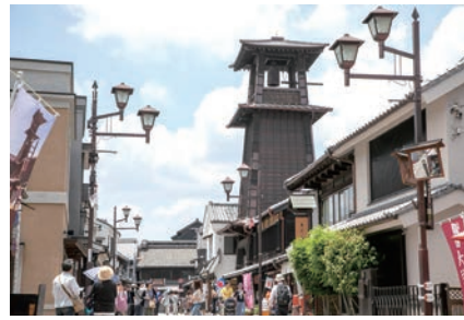
▲川越老街古韻十足，傳統建築非常適合旅客漫步拍照。

「川越」又被稱小江戶，以保留完整的江戶時代藏造傳統建築與著名地標時之鐘聞名，滿溢著濃厚的歷史氣息。漫步於古色古香的街道，旅客不僅能體驗穿越時空般的日本傳統文化，還能品嚐番薯點心等各式在地傳統美食。將川越老街與深谷花園