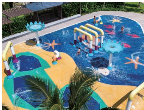
▲度假村亦重視親子客群，設有噴泉與兒童遊具的淺水池。

在週邊設施上，結合私人海灘俱樂部、無邊際泳池、頂樓景觀牛排餐廳、全天候國際餐廳、海灘酒吧與泳池酒吧及完整會議設施，提供豐富多元的餐飲與休憩娛樂體驗，同時加上SPA、健身中心、親子設施與水上活動，以及魚露