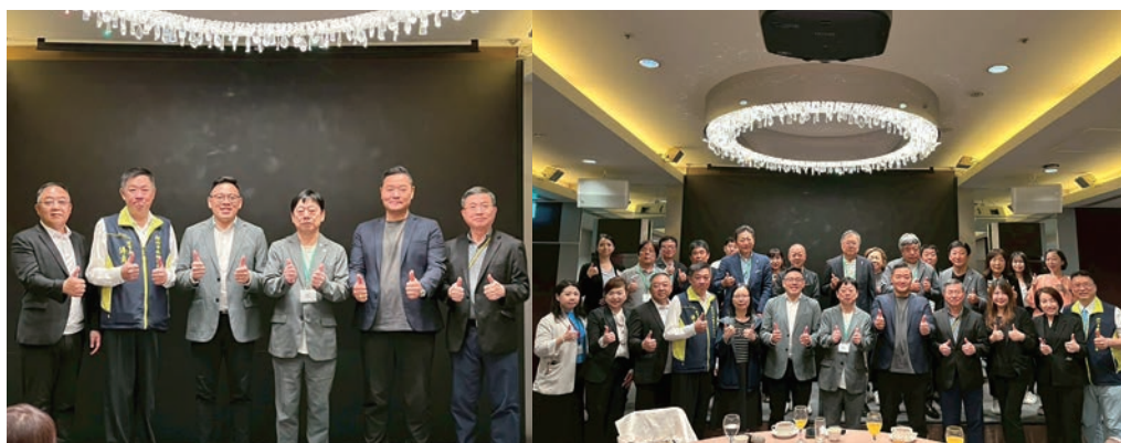
▲日本東京都旅行業協會暨旅行新聞新社來台參訪，也特別拜會這座與日本淵源甚深的國際城市。

其次是東南亞市場的快速成長，歸功於新竹科學園區強大的產業鏈帶動，去年菲律賓以超過3.1萬人次、高達10.8%的占比，躍升為新竹外籍住客的第2大來源國，加上新加坡、馬來西亞等地的旅客，讓東南亞成為新竹觀光成