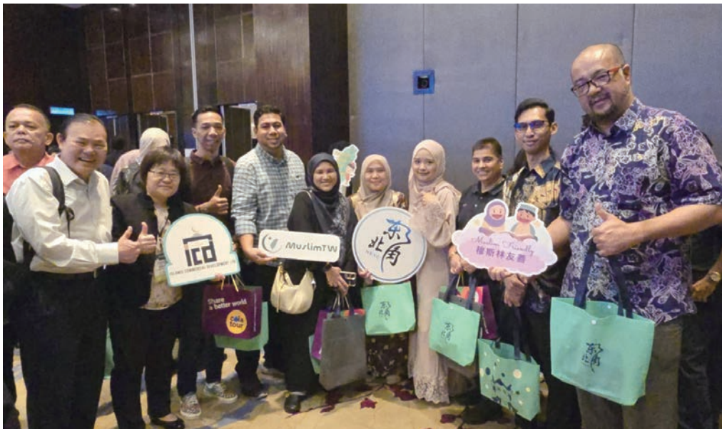
▲交通部觀光署東北角及宜蘭風景區管理處參加台灣旅展（Taiwan Travel Fair），積極拓展馬來西亞旅遊市場。

為拓展馬來西亞國際觀光市場，交通部觀光署於5/15~17在馬來西亞檳城Queensbay Mall辦理「台灣旅展（Taiwan Travel Fair）」，5/19於吉隆坡針對穆斯林及華人2個市場客群，分別辦理2場「台灣觀光推廣會」，交通部觀光署東北角及宜蘭風景區管理處（以下簡稱東北角管理處）也參與推廣，並向當地民眾及旅遊業者介紹東北角觀光圈四季旅遊資源、多元主題遊程及穆斯林友善旅遊環境。