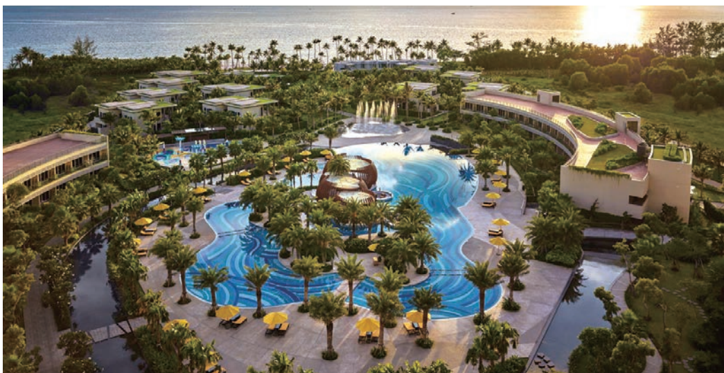
▲富國島鉑爾曼海灘度假村擁有331間現代化客房、泳池別墅。

隨著全球商務與高端旅遊市場全面復甦，大都會（綜合）旅行社正式宣佈，取得雅高酒店集團（Accor）旗下頂級品牌「富國島鉑爾曼海灘度假村」之台灣市場代理權，並積極布局高端海島度假與MICE企業獎勵旅遊市場，搶攻東南亞新興旅遊藍海。