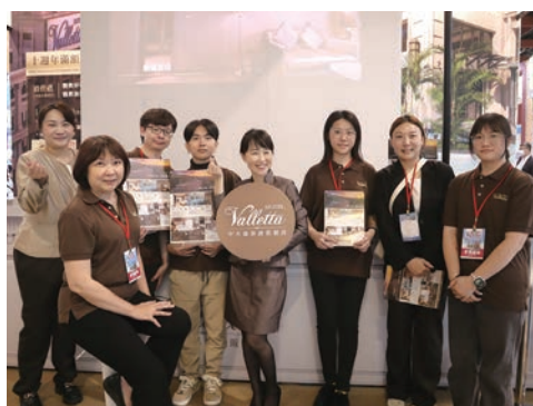
▲中天溫泉渡假飯店團隊合影。