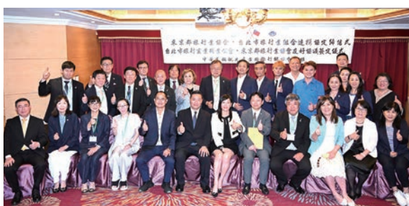
▲在觀光產業國際行銷協會牽線下，於台北天成飯店隆重舉行「台日觀光產業交流商談會暨交流晚宴」。

在觀光產業國際行銷協會牽線下，於台北天成飯店隆重舉行「台日觀光產業交流商談會暨交流晚宴」。本次盛會的核心亮點為東京都旅行業協會與台北市旅行公會正式簽署友好協議，在多位政府長官及業界代表的見證下，開啟台日觀光深度合作的新篇章。