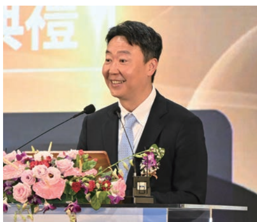
▲交通部部長陳世凱。

示，觀光不只是產業，更是連結世界、帶動希望的重要力量，今年TTE聚焦3大方向，包括深度體驗、智慧旅遊、永續旅遊，除了集結近380家旅遊品牌，20多個縣市政府以及12國觀光單位參展，