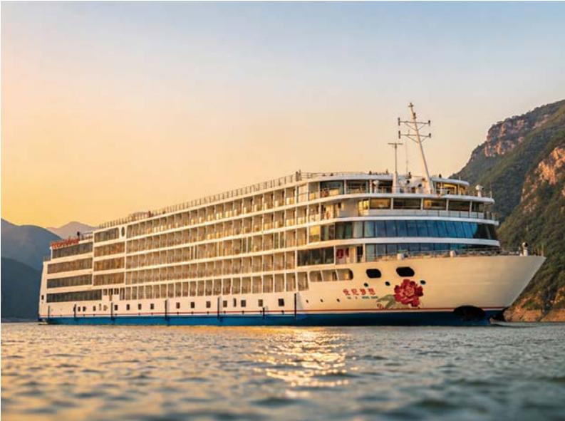
▲世紀夢想號即將於今年9/21正式首航。