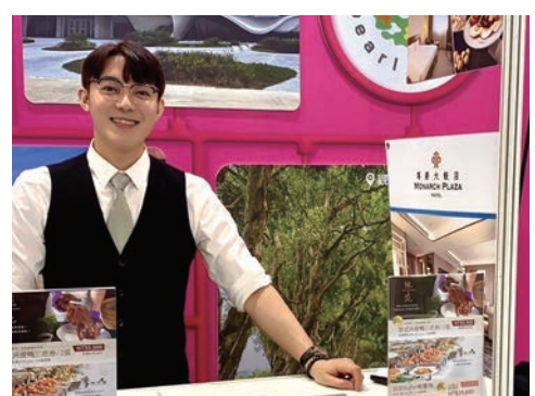
▲尊爵大飯店旅展優惠線上、實體同步開跑。