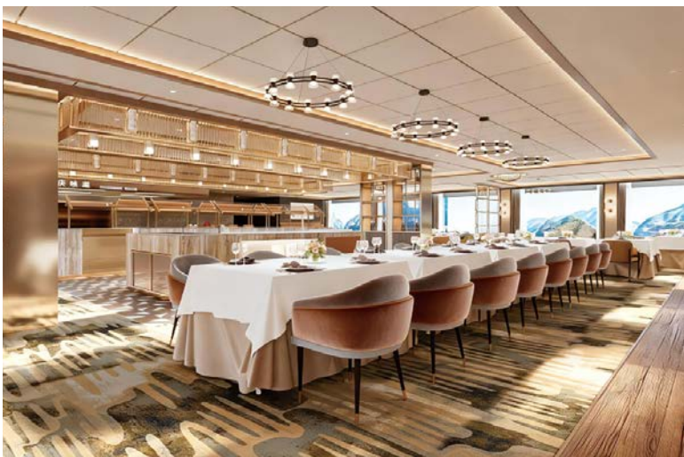
▲餐飲強調「長江文化餐桌」，提供24小時餐飲服務。

品牌以「傳遞生活的優雅與美好」為宗旨，航程版圖從長江拓展至歐洲、埃及等國際航線，期待將東方高端河輪服務標準推向世界市場，持續打造屬於華人市場的國際級豪華河輪品牌。