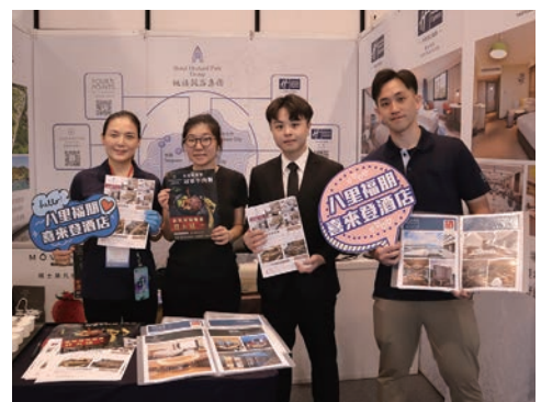
▲桃禧飯店集團團隊合影。