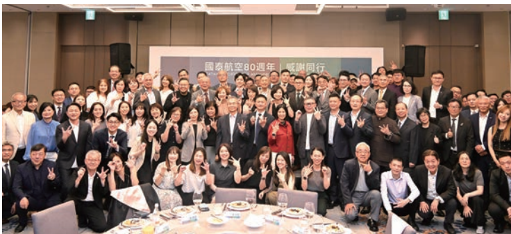
▲國泰航空特別於5/27假國泰萬怡酒店舉辦「80週年感恩晚宴」，並邀請緊密合作的旅遊及貨運業者共襄盛舉。