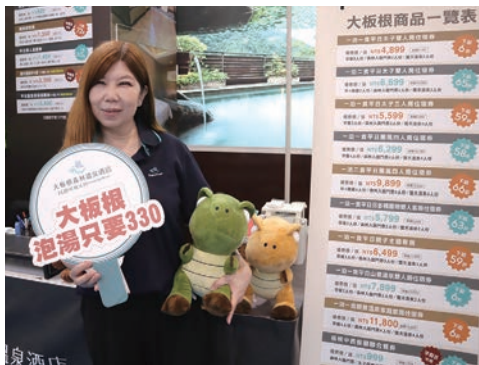
▲大板根森林溫泉酒店推出大板根雨林溫泉假期與優惠活動。