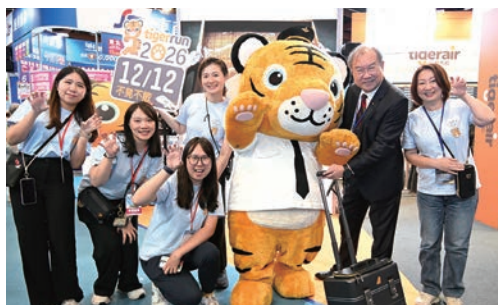
▲中華航空董事長高星漢（右2）與台灣虎航團隊合影。