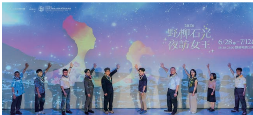
▲「野柳石光夜訪女王」活動記者會5/26於台北舉辦，邀集多位貴賓一同共襄盛舉。

合藝術共創，展現仿真雙后的迷人面貌；俏皮公主區「公主的畫室」以岩壁為巨型畫布，投影「雙后傳承」動畫光雕秀，融合在地學童與藝術家的細膩筆觸，將自然地景轉化為動人的色彩敘事；儂影湖區「儂影幻境」以靜謐浪漫的沉浸氛圍，引導遊客前行至女王頭區「女王的畫布」，透過藝術大師的創意筆觸，勾勒女王跨越古今的獨特美學。