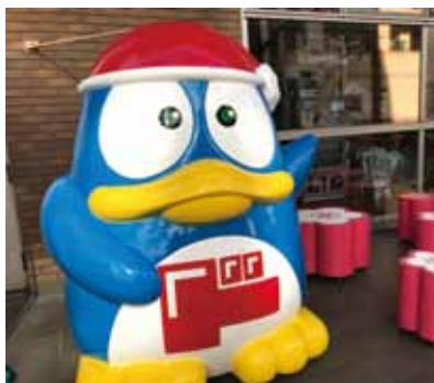
▲天神本店外設有招牌吉祥物唐企鵝吸睛。