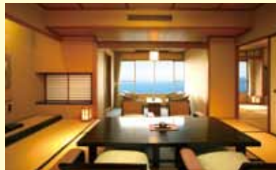
▲寬敞和室房可欣賞湖景。