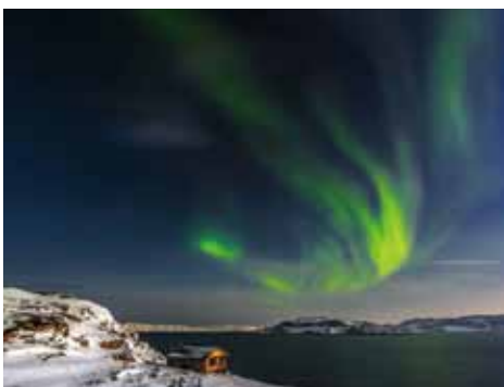
▲透過俄羅斯航空綿密的航線網絡，能輕鬆造訪北方大城—莫曼斯克，欣賞浪漫的舞動極光。