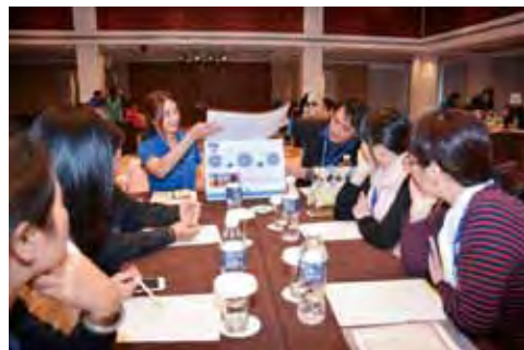
▲透過商討會的方式介紹JV產品。