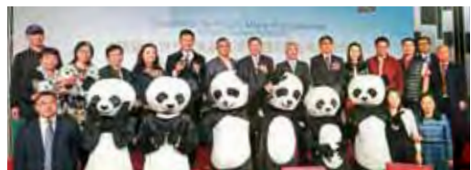
▲四川旅遊桃園場推介會活動熱鬧登場。

四川省旅遊協會帶來4種不同風格的線路行程，有四川自然與人文風光之旅，走訪稻城亞丁尋找最後的香格里拉，到丹巴美人穀拜訪最美麗的鄉村，同時體驗少數民族風情；或是親自踏上以「雄、奇、秀、險」著稱的劍門關，見證古蜀道上最險要的關隘，回味三國