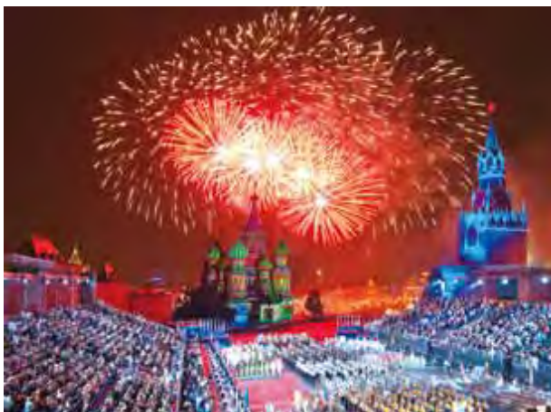
▲俄羅斯以深厚的歷史文化和迷人風光，吸引台灣旅客慕名前往。

俄羅斯、波蘭、3小國13天」等，豐富的行程內容，住好吃好，配合超值促銷價格，同業價52,900元起，成為市場唯一超值選。