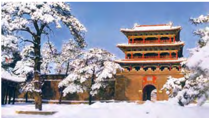
▲瀋陽清福陵在冬季白雪覆蓋下別有風情。