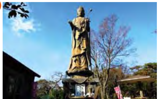
▲位於歷史悠久的館山寺院內，可參拜高達16公尺的聖觀音菩薩。