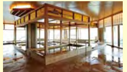
▲以浮世繪展現雅緻和風氣氛的溫泉浴場。

地址：靜岡縣濱松市西區館山寺町2178 電話：+81-53-487-1112 官網： http://hamanako-kokonoe.jp/chinese/