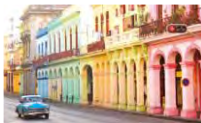
▲前往古巴感受中南美洲的熱情奔放。