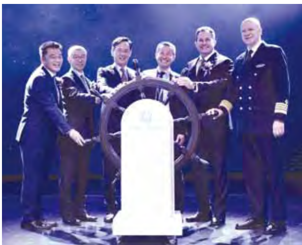
▲(左起)雲頂郵輪集團業務部高級副總裁吳明發、雲頂郵輪集團總裁朱福明、新加坡樟宜機場集團董事總經理林振杰、特邀重量級嘉賓新加坡旅遊局局長楊漢忠、星夢郵輪總裁戴卓爾·布朗及星夢郵輪船長合影。