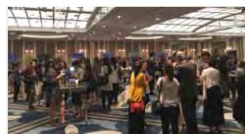
▲希爾頓集團日本、韓國感謝週台北場，活動盛大熱鬧。

為 進一步在台推廣希爾頓品牌，希爾頓全球酒店集團特別於11/7假台北文華東方酒店舉辦「日本與韓國希爾頓感謝週台北場」，來自日本及韓國16家酒店的總經理及銷售代表，(希爾頓集團3家品牌：康萊德、希爾頓以及希爾頓雙樹酒店)，與台灣業者與合作夥伴熱情交流。此次是第4次來台舉辦活動，除了保持良好的合作關係，更帶來全新的產品服務與酒店，例如今年6月新開幕大阪康萊德酒店，以及釜山希爾頓酒店，提供業者更多元優質的銷售選擇。