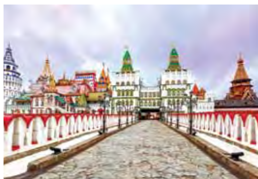
▲近年來俄羅斯旅遊詢問度高，繽紛的古城深受台灣旅客喜愛。

為進一步在台推廣俄羅斯旅遊，俄羅斯航空代理中大旅行社與莫斯科台北經濟文化協調委員會駐台北代表處等單位，在今年10月份共同舉辦「2017 Visit Russia 推廣說明會」，特別邀請莫斯科 Mouzenidis Intour、Rus China Travel、聖彼得堡 Do Travel、KMP Group、伊爾庫次克地接社 Baikal Top 和莫斯科樂天酒店等共12家業者來台，與台灣業者深度交流，增進台俄雙方交流，攜手再創俄羅斯旅遊市場商機。