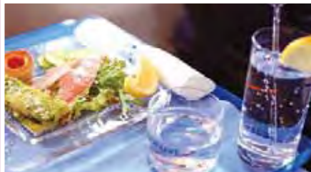
▲俄羅斯航空餐食精緻，受到旅客喜愛。

俄羅斯航空是俄羅斯國家級航空公司，是世界上歷史最悠久、歐洲最大且最知名的航空集團之一，以極佳飛安紀錄和優質客戶服務，多次被評選為「東