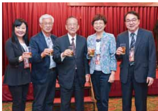
▲（左起）台灣觀光協會副會長戴啟珩、台中市觀光旅遊局局長陳盛山、台中市副市長林陵三、台灣旅遊交流協會理事長賴瑟珍、交通部航港局局長謝謂君。