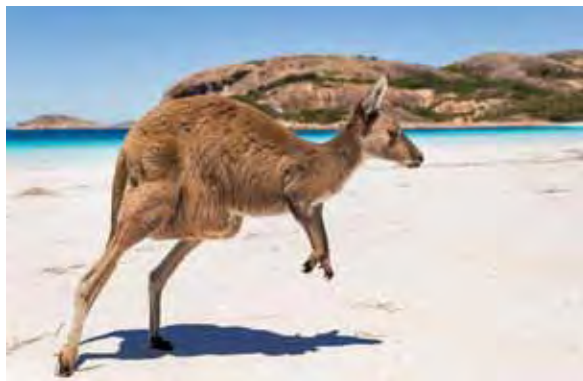
▲袋鼠島上可以看到袋鼠自由的奔跑。