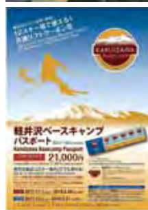
▲超值好用的長野輕井澤滑雪套票首度開賣。