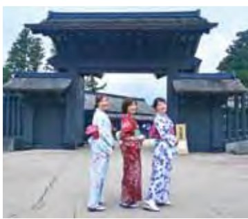
▲箱根關所和服散策。

湖畔旁，是江戶時代全日本53處關所中規模最大的一座，以控管往來的旅客。遊客能在重現昔日光景的日式建築中散策，並登上瞭望台俯瞰蘆之湖景致。此外，關所旁的「旅物語館」提供和服租借，1日租金1,600日圓。