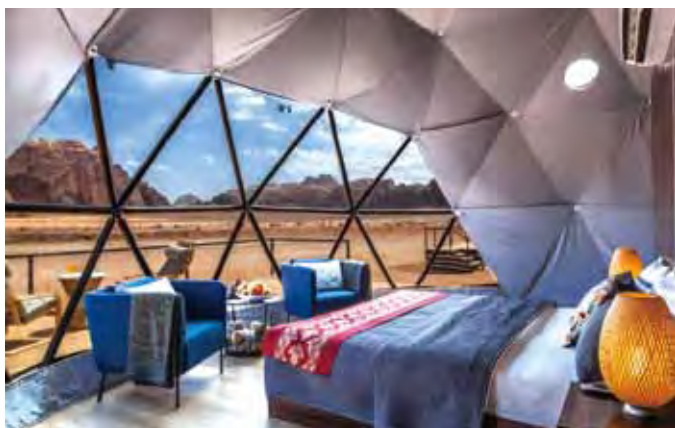
▲位於瓦地倫沙漠的帳篷旅館—火星屋，透過偌大的景觀窗，沙漠美景盡收眼底。