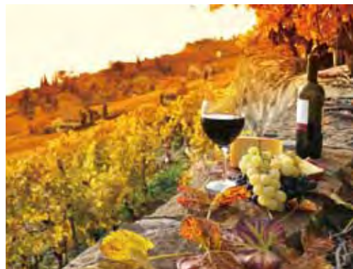
▲旅客可以走入酒莊，品嚐美味紅白酒。