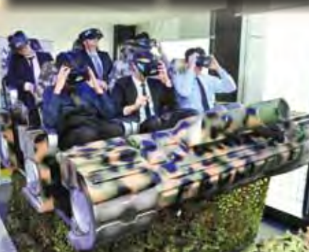
▲東海大學學生體驗最新穎的VR科技。