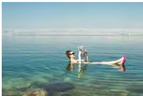
▲來到以色列，不可錯過獨特的死海飄浮體驗。