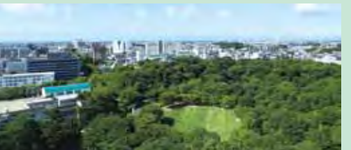
▲客房南側可欣賞濱松城公園美麗景觀，北側則可眺望南阿爾卑斯山脈風景。

地址：靜岡縣濱松市中區元城町109-18 電話：+81-53-457-1111 官網： http://concorde.co.jp/