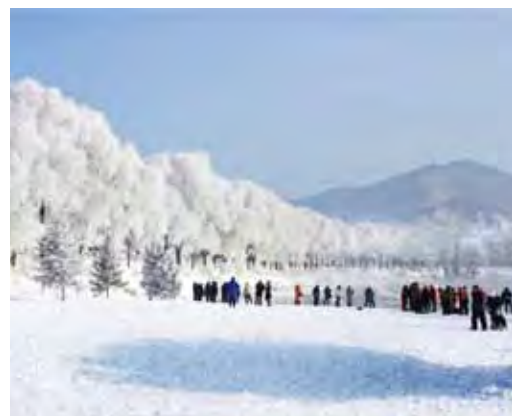
▲透過瀋陽航點進出，還可延伸周邊欣賞霧淞，產品更多樣化。