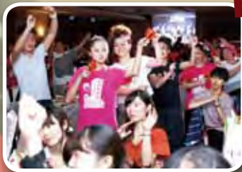
◀來自香港的百位旅客特別出席踩舞祭，顯示出台中的魅力已散播到國際。

台中國際踩舞祭感恩餐會中， 來自日本與台灣的表團輪番上台演出， 將舞蹈家熱情與活力蘊露無遺。