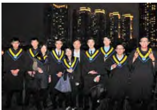
▲行程安排珠江夜遊，欣賞兩岸夜景及眺望廣州塔。

南學院、廣東財經大學華商學院熱烈交流 體現兩岸一家情懷 世界工廠到世界市場的變革 吸引台灣學子進入大陸市場就業