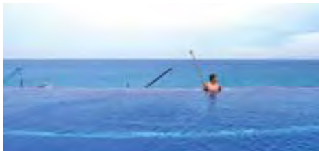
▲可眺望富士山的無邊際游泳池。