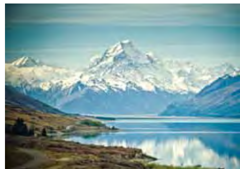
▲紐西蘭12天部分，特別規劃走訪如庫克山等5大精選國家公園，為行程精采度大大提升。

如同榮獲金質獎肯定的「尊榮紐西蘭南北島國家公園冰河船12天」為例，不但走訪如庫克山、峽灣、亞瑟隘口、雅斯碧林、西海岸等5大國家公園，更保證全程使用3年內的新車來載運客人，更安排入住庫克山隱士飯店、入住冰河區飯店等，總價值超過坊間同級商品成本逾萬元的3大保證，讓同業銷售上更增添利基。