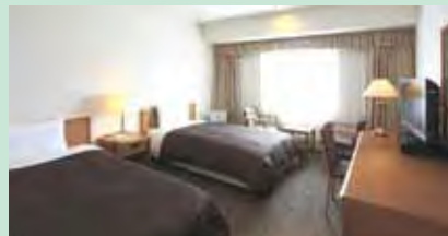
▲簡約而明亮的標準雙人房內，放鬆身心。