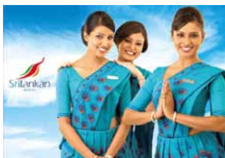
▲斯里蘭卡航空獲選服務最優質的航空公司。

斯里蘭卡航空始於1979年，憑藉著舒適、安全、值得信賴及班機準時等優勢，以完美的服務成為全球航空界的領導者之一。斯里蘭卡航空的樞紐位於可倫坡之班達拉奈克國際機場(CMB)，提供全球便捷的航線並延伸至歐洲、中東、南亞、東南亞、遠東區、北美、澳洲與非洲等46個國家96個目的地。目前斯里蘭卡航空擁有包含A330、A320及A321機隊共21架，以充足運力打造出最全面的飛航網絡，機上更配有足夠間距與寬度的機上座椅，並供應寬螢幕設施的機上娛樂系統及最新音頻、視頻點播功能遊戲機，讓客人擁有高畫質的視覺享受！