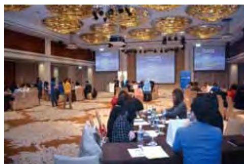
▲每10分鐘換桌，提高同業專注力。

聯合航空與ANA合作共同事業（Joint Venture），自2012年來邁入第6年，為了與同業共歡，特別於11／22舉辦年度桃園大溪OUTING產品說明會，JV共同事業簡介、JV企業方案、JV票價介紹、NH產品介紹、UA產品介紹、ANA飛行常客計畫（AMC哩程俱樂部）、聯合航空前程萬里飛行計劃等項目，透過每10分鐘響鈴換桌的商討會方式，讓同業針對每個細項產品更加深度了解。說明會結束後並前往慈湖欣賞湖光山色，雖然當天氣候不佳，但細雨濃霧下的慈湖更顯得幽靜絕美，讓同業更加心曠神怡。