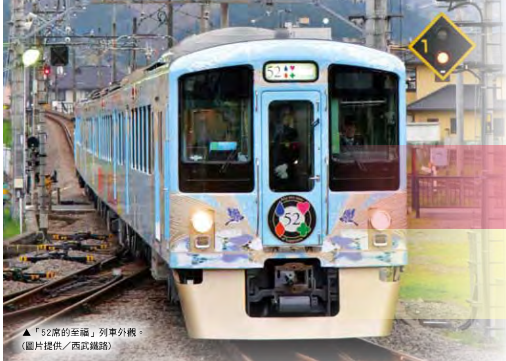
▲「52席的至福」列車外觀。