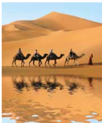
▲撒哈拉沙漠是世界第3大荒漠，也是許多旅客夢想的旅遊目的地。

北非旅遊專家—巨大旅遊，針對明年度起推出一系列高品質且價格超值之產品，從北非摩洛哥、突尼西亞到以色列、約旦等市場少見特殊路線，精心安排入住5星級豪華飯店、特色帳棚旅館，並且創新的行程內容，與市場上產品做出區隔，提供旅客明年出遊探險的最佳選擇。