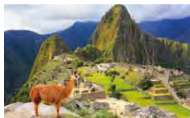
▲秘魯馬丘比丘的古城魅力吸引無數訪客造訪。