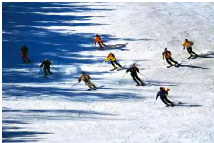
▲瀋陽擁有知名的東北亞滑雪場、怪坡滑雪場等，提供旅客多樣選擇。

時節進入冬季，正是前往大陸東北旅遊的最佳時機，位於遼寧省省會的瀋陽市，擁有豐富迷人的冰雪資源，例如超人氣瀋陽國際冰雪節、冬捕節，以及東北亞滑雪場、怪坡滑雪場等多樣雪上玩法，瀋陽已成為近年來冬季旅遊的首選地。