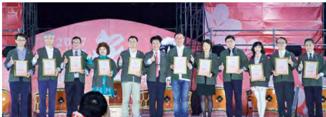
▲台中市市長林佳龍（左6）感謝各大贊助公司的協助。