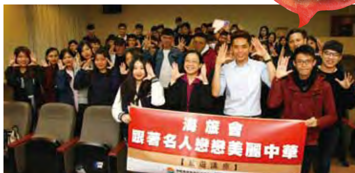
↑明星旅遊作家Eric李昂霖於台北城市科技大學講座中與同學們俏皮合影。