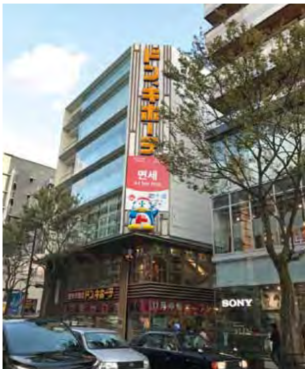
▲11/17隆重開幕的福岡天神本店。