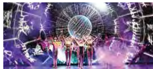
▲星夢郵輪「雲頂夢號」星座劇院陸續上演精彩表演。

吉島，走進恬靜而美妙的北峇里，探訪風情獨具的泗水。為了給旅客提供專屬尊享的度假體驗，星夢郵輪首次將加勒比海郵輪特色的私人海島概念引入亞洲，以新加坡母港出發的全新航線帶領旅客到訪緬甸的天堂秘境丹老海島。