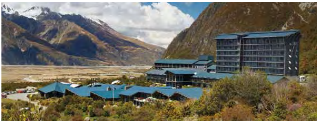
▲尊榮假期 (享趣旅行社) 針對庫克山隱士飯店採取先需求房後開團的方式，讓同業安心銷售無負擔。

城、奧克蘭作為交叉運用，同時尊榮假期 (享趣旅行社) 也掌握各家航空公司的機位作搭配，讓整體商品供應鏈更加完善，藉此舒緩市場的龐大需求。