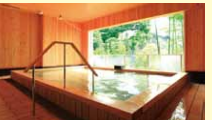
▲溫泉可盡情享受28種浴池的暢快。

地址：靜岡縣濱松市西區館山寺町1891 電話：+81-53-487-1111 官網： http://wellseason.jp/chinese/