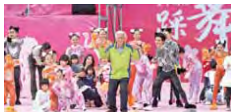
▲台中市觀光旅遊局局長陳盛山特別帶領著裝扮成貓咪的華岡藝校等學生表團，與民眾進行進行近距離的舞蹈教學，將踩舞祭「全民共舞」的精神發揮到淋漓盡致。

中踩舞祭，將日本街頭表演與台中在地舞蹈、音樂元素完美結合，以街道為舞台、國家歌劇院為背景進行表演，既能妝點城市的精采度，亦能讓踩舞祭成為台中的特殊文化品牌。」