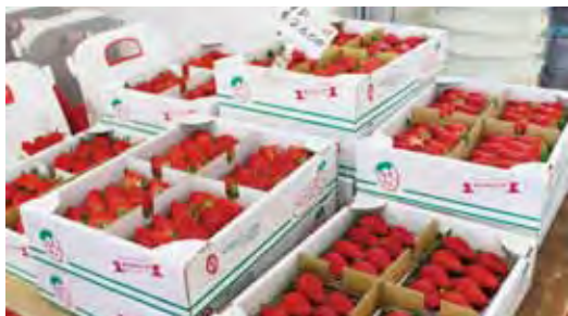
▲可品嚐靜岡招牌的「章姬」和「紅頰」草莓。