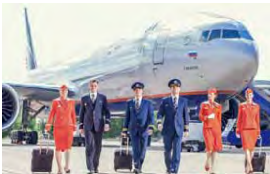
▲俄羅斯航空多次被評選為「東歐最佳航空公司」，是歐洲最大且最知名的航空集團之一。