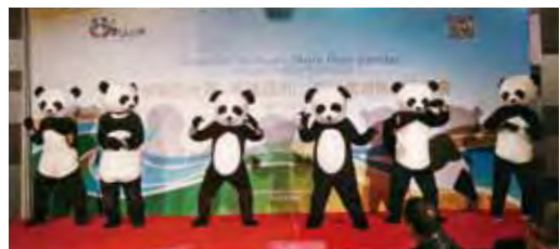
▲四川旅遊桃園場特別安排熊貓熱舞，成功炒熱現場氣氛。

古文明；大熊貓文化交流及學校參訪研學之旅，擔任熊貓義工，瞭解熊貓保育工作；此外還規劃了舌尖上的四川美食之旅，帶旅客品嚐川西蓉派川菜的精緻細膩，感受四川多樣迷人魅力。