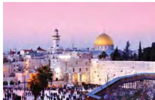
▲巨大旅遊掌握一手資源，包裝多款北非、中東等創新產品。