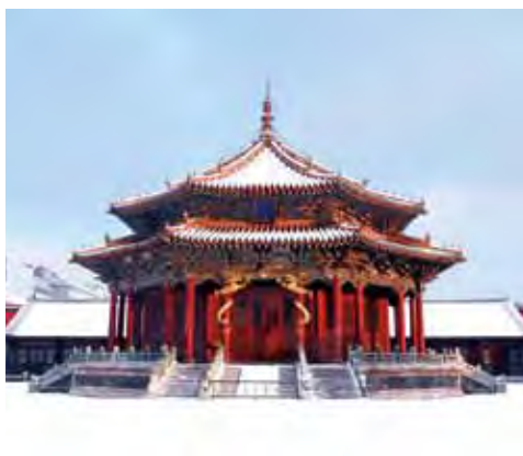
▲瀋陽故宮是大陸東北超人氣景點之一，到了冬季呈現不一樣的美感。