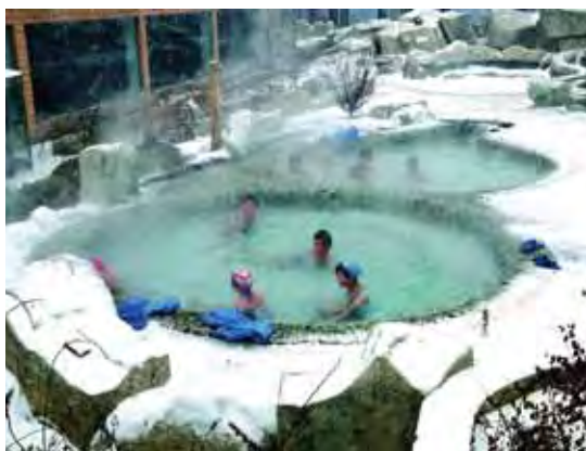
▲冬季來到瀋陽還可體驗優質泡湯。

若想感受春節氣氛，還可來到瀋陽盛京廟會、新春皇寺廟會，體驗當地過大年的熱鬧，或是來到瀋陽周邊的撫順滿族農莊過大年、盤錦冬季稻草藝術節、冬釣節和採摘節、鐵嶺蓮花湖燈會，到本溪遊滿鄉、品冰酒、過大年，錦州奉國寺春節廟會，阜新泡冰雪溫泉過蒙古大年等特色旅遊節會，深度感受遼寧冬季的迷人魅力。