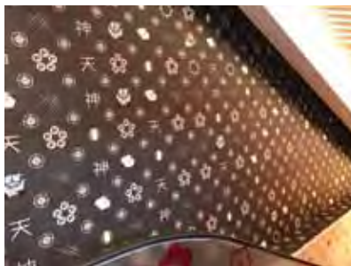
▲空間設計隨處可見福岡縣花「梅花」圖樣。

近3個月，台幣對日圓升值約2.94%，與去年同期相比，更大幅升值7.25%，隨著日圓匯率持續低迷，前往日本的台灣遊客人數不僅持續成長，消費金額也相當亮眼，根據最新統計，台灣遊客在日本的購物支出平均每人超過41,000日圓，以實惠價格能夠一次滿足藥妝、家電、雜貨等多樣商品購物需求，還能提供免稅的著名量販賣場「驚安殿堂・唐吉訶德」，近年相當受到青睞，24小時營業也吸引更多遊客。代理「驚安殿堂・唐吉訶德」的向日遊特別提供同業索取「歡迎！優惠券（YOKOSO Coupon）」，不僅可提供遊客至店內消費使用的「免稅8%+現金折扣」優惠券，更有最高5%的團體送客回饋，可逕洽向日遊顧問公司。