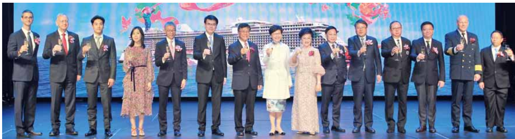
▲香港特別行政區行政長官林鄭月娥（中）、雲頂香港主席兼行政總裁丹斯里林國泰（左7）、「世界夢號」教母潘斯里黃可兒（右7）、雲頂香港集團總裁區福耀（右6）、雲頂郵輪集團總裁朱福明（左5）與政府及啟德郵輪碼頭官方代表、集團管理層為「世界夢號」首航祝酒。

雲頂香港所屬的雲頂郵輪集團旗下星夢郵輪第2艘全新15.1萬噸豪華巨型郵輪「世界夢號」於2017/11/17抵達香港母港，雲頂郵輪集團盛邀各國旅遊同業和媒體夥伴參與「世界夢號」首航典禮，星夢郵輪台灣代理旅行社和媒體亦獲邀參加3天2夜的首航公海巡遊，搶先體驗亞洲最新5星豪華郵輪的華麗魅力！星夢郵輪特於香港啟德郵輪碼頭為「世界夢號」舉行隆重首航典禮暨命名儀式，沿襲西方郵輪業傳統，由香港特別行政區行政長官林鄭月娥及「世界夢號」教母—雲頂香港主席兼行政總裁丹斯里林國泰夫人潘斯里黃可兒共同啟動盛大擲瓶禮，祈願新船在下水後一帆風順。