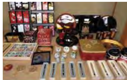
▲加賀物產祭展出石川精品工藝。

已於11/3~11/5於北投加賀屋展出的「加賀物產祭」今年邁入第二屆，是由小松市商工會議所主導，邀集六家業者共同來台，提供日本酒試飲，展出的傳統工藝包括九谷燒、山中漆器、輪島漆器，鎖定頂級客群，從筷子、服裝、雜貨到擺飾品，其中相當具有特色的就屬取得義大利玩具搖搖馬授權的九谷燒Rody，找來多位藝術家創作，每一隻都是手工製作，為獨一無二的設計，目前已有63種圖樣。另外也規劃針對加賀屋住客，搭配正宗抹茶的和果子體驗，更帶來多樣石川縣食材，於早餐的天祥廳供應，讓饕客親嚐加賀原味。