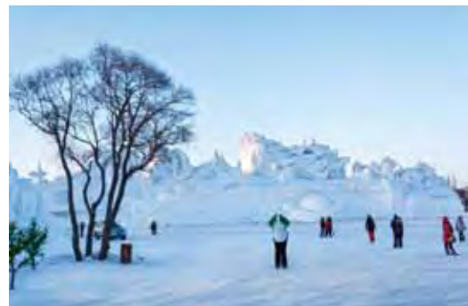
▲太陽島國際雪雕藝術博覽會成功打造冰雪旅遊品牌。