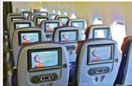
◀俄羅斯航空機上娛樂系統豐富，提供超過百種中英文電影和遊戲。