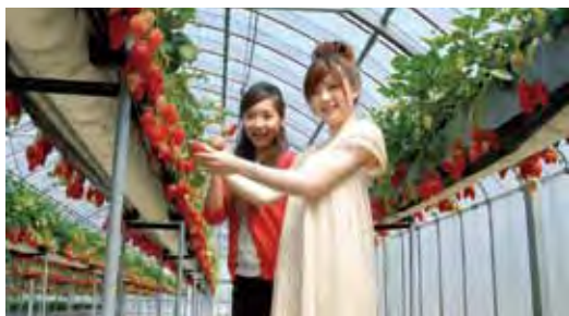
▲高架式採草莓相當輕鬆。

靜岡草莓在日本相當著名，採草莓更是春季魅力素材，12月初至5月上旬可在「濱松花卉公園」周邊的多家果園體驗採草莓，溫度宜人的溫室果園內採高架種植，不僅讓草莓充分享受日照，也可以很輕鬆採收，主要品種是靜岡招牌的「章姬」和「紅頰」，果實碩大酸度較低，甜香度高，依季節不同，吃到飽30分鐘1,100日幣起，蘸上煉乳能享受更上一層的甜美，20人以上即可享團體優惠。