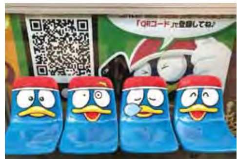
▲特別設置吉祥物唐企鵝的等候座椅。

強調「地區最便宜」，讓人能夠興奮的遊逛其中，「福岡天神本店」空間設計運用充滿日本風情的燈籠與福岡縣的縣花「梅花」，為了讓人一眼就能找到，店鋪外觀則設有巨型的招牌吉祥物唐企鵝，更設置唐企鵝的等候座椅，期盼引發話題成為天神地區的地標。樓地板面積達到2,000平方公尺的建築從地下一樓至五樓都規劃了琳瑯滿目的商品，以大型便利商店為概念，最適合作為伴手禮的食品、零食位於地下一樓，也有豐富的調理速食讓周邊居民補貨。依序