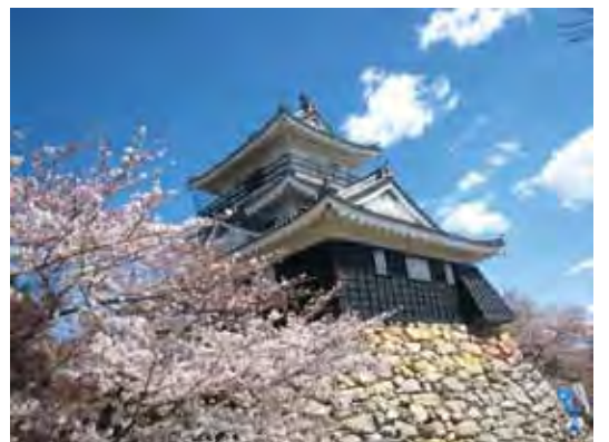
▲濱松城公園內是濱松地區最佳的賞櫻景點，自從「濱松協和飯店」徒步約5分即達。