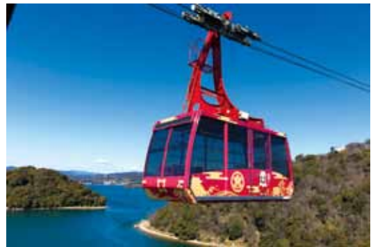
▲日本唯一橫跨湖面的纜車體驗「館山寺纜車」。