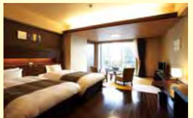
▲提供西式與和室客房多樣選擇。