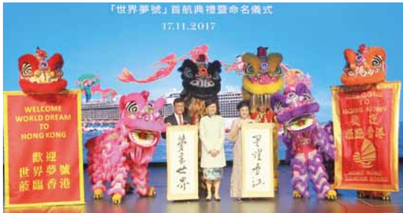
▲（左起）雲頂香港主席兼行政總裁丹斯里林國泰、香港特別行政區行政長官林鄭月娥、「世界夢號」教母—雲頂香港主席兼行政總裁林國泰夫人黃可兒。