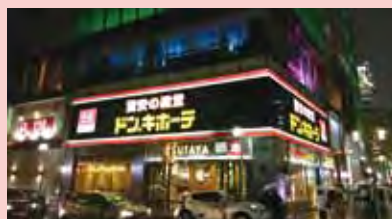
▲福岡地下鐵沿線有三家店鋪，緊鄰天神的「中洲川端」也有中洲店。

「驚安殿堂・唐吉訶德」推出許多貼心服務，積極招攬外國遊客，除了免稅，提供無線網路、可使用外幣消費之外，更聘請各國服務人員，還有外國人專用的「歡迎！優惠券（YOKOSO Coupon）」。旅行同業可提出申請簽約，提供給客人前往日本旅遊消費時，使用「免稅8%+現金折扣」優惠券（每人1張），只要消費金額免稅後超過5,000日圓，即可折價200~2,000日圓（當日在同家店鋪只能使用一張），出示「歡迎！優惠券」同享會員價格，依消費金額還可獲得贈品，滿10,000日圓以上贈送吉祥物「唐企鵝」玩偶，而簽約的旅行同業則可獲得總消費金額的3%作為回饋。若是由導遊、領隊陪同前往店鋪消費，事先告知，只要當天團體消費含稅金額超過10萬日圓，更可享受有5%回饋，以上能夠採每月結算，同業可多加申請利用。