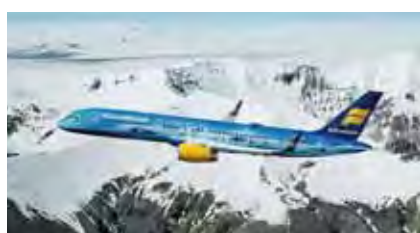
▲冰島航空打造全球第一架「冰河」—瓦特納號(Vatnajökull)彩繪飛機。

冰島被列為世界幸福報告中「在地球上最幸福的地方」之一，也被評為世界最友好的國家，更是冬季欣賞北極光的最佳地點之一。