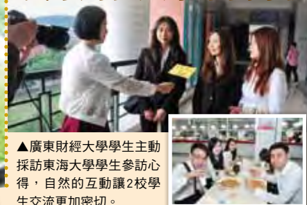
▲廣東財經大學學生主動採訪東海大學學生參訪心得，自然的互動讓2校學生交流更加密切。