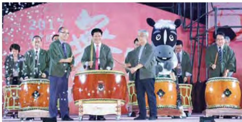
▲（中間左起）交通部觀光局主任秘書林坤源、台中市市長林佳龍、台中市觀光旅遊局局長陳盛山與眾嘉賓一同歡慶第2屆台中國際踩舞祭的開展。