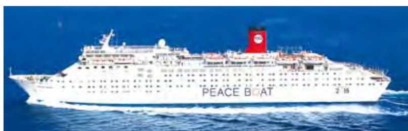
▲和平號(Peace Boat)2018年度在台推出5/12、9/1共2個航次。