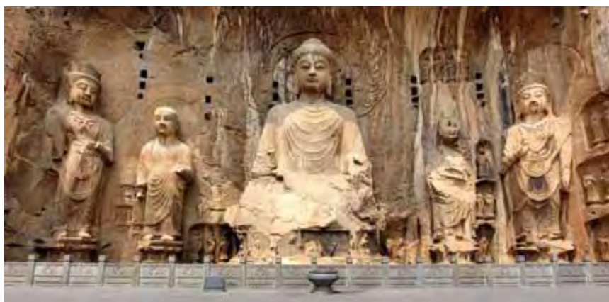
▲龍門石窟是中國石刻藝術寶庫之一。

燦星旅遊致力整合虛擬通路及實體店面，提供精彩多元的旅遊產品，更以溫暖人心的企業標語「人是需要旅行的，人是需要交朋友的」，拉近台灣與世界的距離，也與同業的合作關係更加密切。