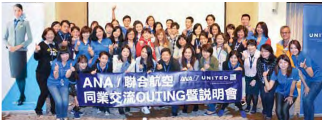
▲ANA與聯合航空團隊與同業一同合影。