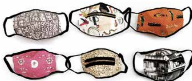
▲疫情期間，香港也催生出各式設計感防疫小物，相當吸睛。

此外，亞洲協會香港中心也與香港畫廊協會合作舉辦為期1個月的雕塑藝術展，展出香港及國際畫廊協會成員畫廊的精選作品，除了線上展覽導賞，還有Facebook直播藝術講座；而集結香港藝壇創辦的「ART Power HK」線上展演平台，內容豐富多元，包括畫廊導