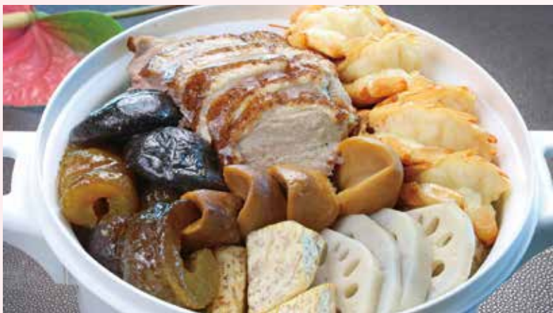
▲台中金典酒店母親節外帶餐點—港味聚寶盆菜。

另推精選套餐及優惠 多元選擇歡慶母親節 4款母親節蛋糕 繽紛口味 早鳥預購享8折