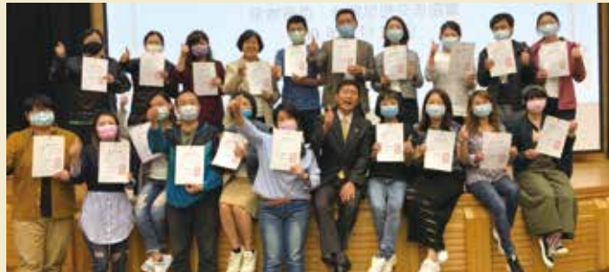
◀◀學員順利通過結業測驗且獲滿分頒發證書以資鼓勵。