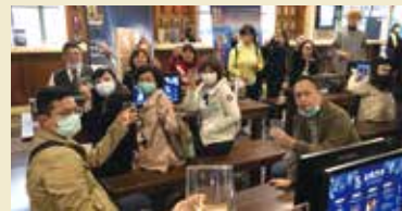
▲旅館班學員赴宜蘭礁溪金車嶼瑪蘭威士忌酒廠實地考察。