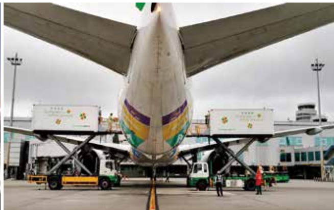
◀長榮航空為台灣首家執行客艙載貨航班的航空公司。