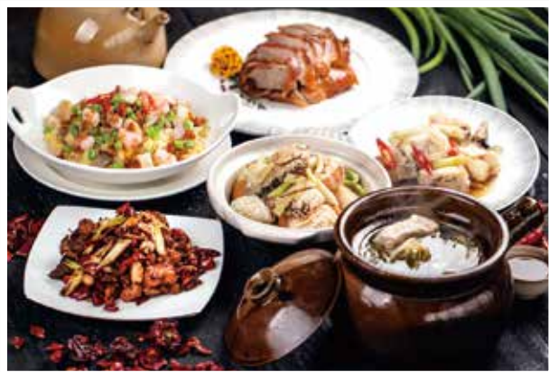
▲台南大員皇冠假日酒店推出「冠軍主廚美饌外帶外送享優惠」經典豐味組合餐適合小家庭享用。

里的免費外送服務，一推出獲得回響，訂單已陸續湧入，預計每個月可多增加20多萬元的餐飲營收。