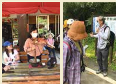
▲旅行社學員課程特與觀光局推廣之小鎮漫遊及山脈旅遊結合，透過資深解說老師帶領體驗浪漫台三線上的獅山客家擂茶文化，並品嚐客家便當美食及尋訪六寮古道實際踩線。