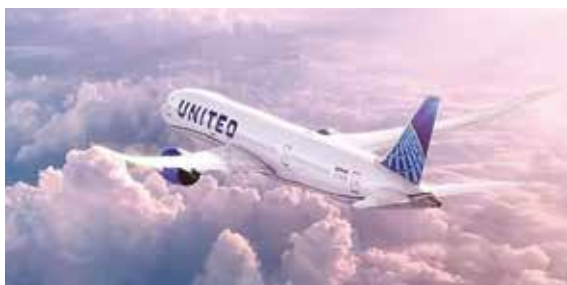
▲聯合航空珍惜與您的夥伴關係，更重視您與旅客間的合作關係。

聯合航空特別推更多元免費退改票方案如下，方便您可即時且靈活地為每位旅客變更行程。