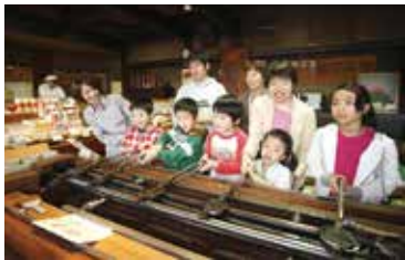
▲盛岡手作村提供多元項目能夠體驗。

盛岡手作村為結合體驗工房與伴手禮中心的複合式設施，遊客可體驗製作南部仙貝、盛岡冷麵或彩繪岩手獨特的洽咕洽咕馬兒木雕等，根據項目不同花費時間介於20~60分鐘，約有數十種體驗可自由選擇，不僅適合安排親子旅遊，也非常推薦結合教育旅行商品使用。