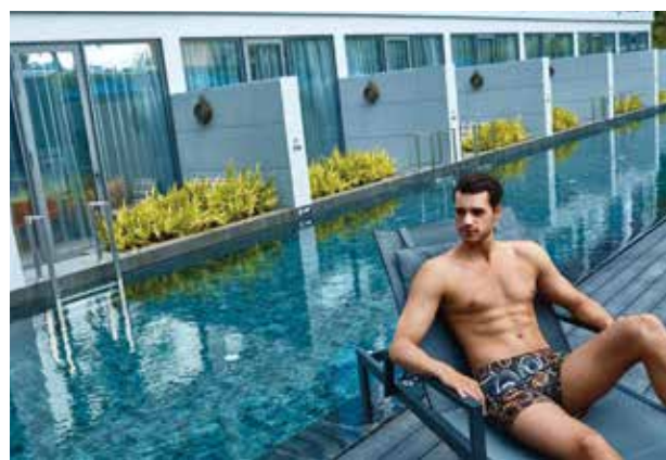
▲泰普輕美學PAK行程特別安排入住英迪格酒店兩晚，好好享受飯店的泳池和日光浴。