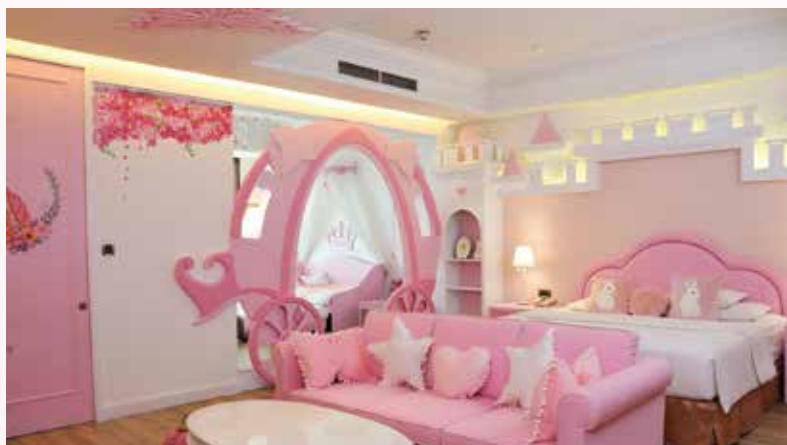
▲即日起透過義大皇家酒店官方粉絲頁的小編預訂有機會升等全粉紅色系主題套房，陪媽媽當公主。

媽媽們心目中都仍有自己的童話故事！義大皇家酒店幫您滿足媽媽心願，即日起透過官方粉絲頁的小編預訂，並且在5/4~5/10期間入住，每日前5名訂房的可免費升等至價值近萬元的親子主題套房入住1晚，讓您陪媽媽在粉紅公主房裡重回少女夢幻時光；或是在有熱氣球造型的飛行屋裡，翱翔天際航向美好世界，6種造型主題房，色系主題迥異鮮明，讓媽媽來義大當網美。另外，透過小編預訂官網任一住房專案，加贈1組「媽咪愛漂亮」小禮盒，內含安妮絲薇珍珠奶茶面膜與艾芙美清爽防曬乳，都是要特別獻給媽媽的保養品。