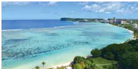
▲關島杜夢灣的美景。

各位關島的好夥伴們，如果您們公司有需要關島觀光局派講師安排及提供轉型和升級的課程，歡迎跟關島觀光局提出申請，並祝您和家人防疫期間平安健康！美國關島觀光局旅遊推廣介紹和復甦計畫包括：