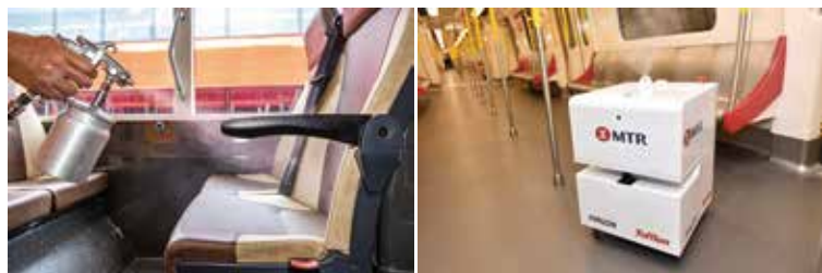
▲香港針對港鐵、巴士和計程車皆採取更嚴格的清潔消毒程序和服務。