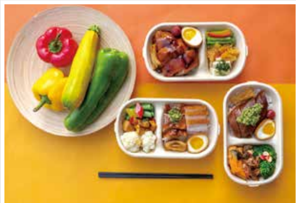
▲六福萬怡推3款老廣味經典便當，配菜暗藏創意小心機，每款售價180元。

便當風潮正熾，台北六福萬怡酒店的粵亮廣式料理也推出老廣味便當，維持七分傳統、三分創新的特色，設計出「廣式三寶飯」、「粵亮烤鴨飯」、「經典油雞飯」等3款5星便當，每款皆只要180元，揪上同事或親朋們一起團購，還可享買10個再送1個優惠。在配菜部分，主廚除了每天都會挑選最新鮮時蔬與下飯的配菜來變換菜色外，還暗藏會讓人驚呼的創新小心機，放入鹹辣開胃的客家辣蘿蔔，並以溏心蛋取代滷蛋，滑嫩蛋黃可直接入口，或拌到白飯上都是美味，還有最令人驚豔的漬無花果，便當中那一點嫣紅，鹹甜又帶著水果清香，具有畫龍點睛的效果。