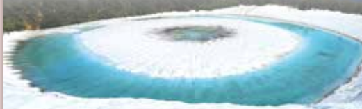
▲絕美的龍之眼景觀每年期間限定登場。

自然資源富饒的八幡平地區，每年4月中旬起就能探訪綿延約27公里的雪之迴廊，5月下旬至6月上旬更有因融雪而成的特殊奇景「龍之眼」，夏秋兩季為登山健行者的天堂，能夠感受被新綠或金黃紅葉包圍的絕美體驗，冬季期間則化身為滑雪聖地，還能兼享溫泉陶冶，四季獨特魅力不間斷。