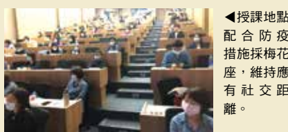
▲授課地點配合防疫措施採梅花座，維持應有社交距離。