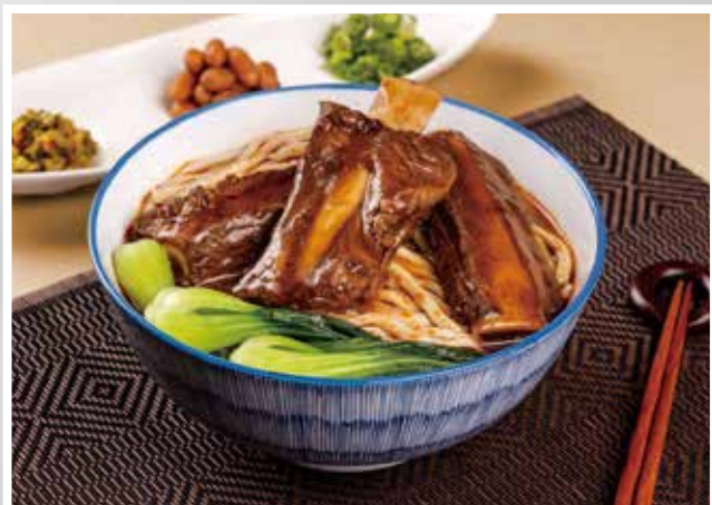
▲福容線上食堂推出「冠軍極黑戰斧牛肉麵」。

鮮食料理皆由飯店廚師親手製作，更大方送出限時限量100份的寶島三杯雞讓消費者免費品嚐。