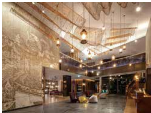
▲泰普輕美學PAK精選多家高檔飯店和VILLA，行程包裝下來價格非常划算。

目前推出5種以上精彩行程，以5／6日為主，尤其在PAK專業團隊用心設計之下，與市場上制式內容截然不同，價