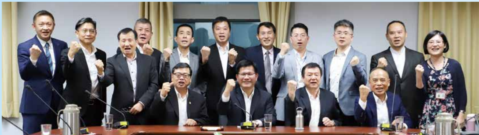
▲「旅行業紓困衝鋒隊」前進交通部，與交通部部長林佳龍（前排左2）、觀光局代理局長張錫聰（前排左1）一同商討，讓補助與紓困政策更貼近市場需求。

交通部日前推出「紓困2.0」的補貼要點，旅行社總公司補貼10萬元、分公司5萬元，連續3個月，雖然對於某些大型旅行社杯水車薪，但相較於全台80%都屬於中小型的業者來說，可說是及時雨般的來臨。能從原先僅補助1個月的策略延長到3個月，得歸功於一場關鍵會議、一個來自旅行公會全聯會（簡稱全聯會）與六都一省所組成的「旅行業紓困衝鋒隊」。