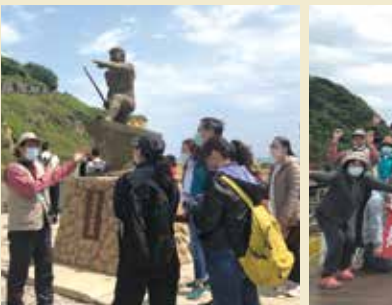
▲旅行社學員走進和平島地質公園，實地瞭解山與海之間的文化歷史，及北台灣最新的地質景觀設施。