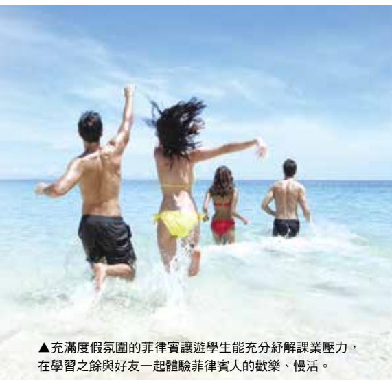
▲充滿度假氛圍的菲律賓讓遊學生能充分紓解課業壓力，在學習之餘與好友一起體驗菲律賓人的歡樂、慢活。