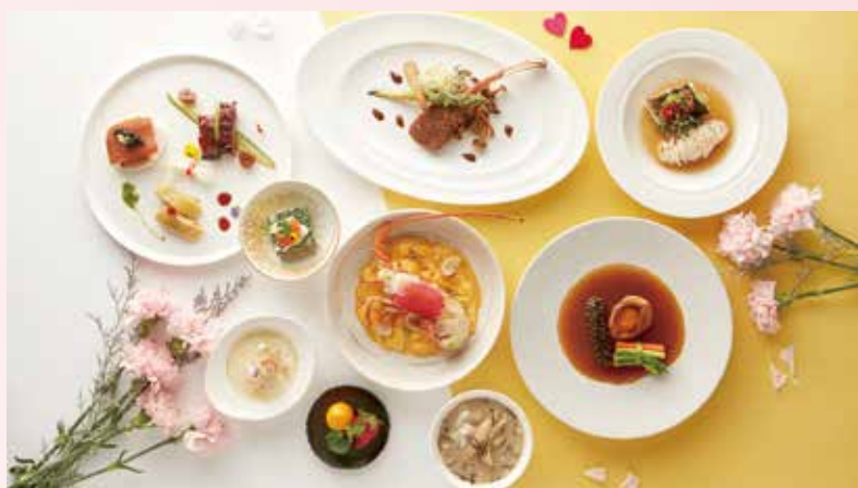
▲台北寒舍艾美酒店「綻采心漾」寒舍食譜母親節套餐。

「探索廚房」無限供應帝王蟹、明太子大蝦 4人同行用餐送澳洲天然保養品、VIP療程