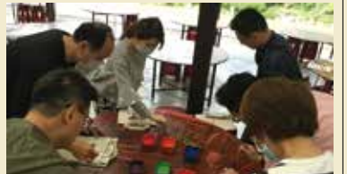
▲頭城休閒農場體驗手作DIY及生態農牧餵養作業。