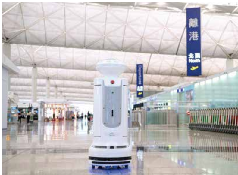
▲領先全球，香港國際機場成為首個應用智慧消毒機器人於非臨床醫療環境中的機場。