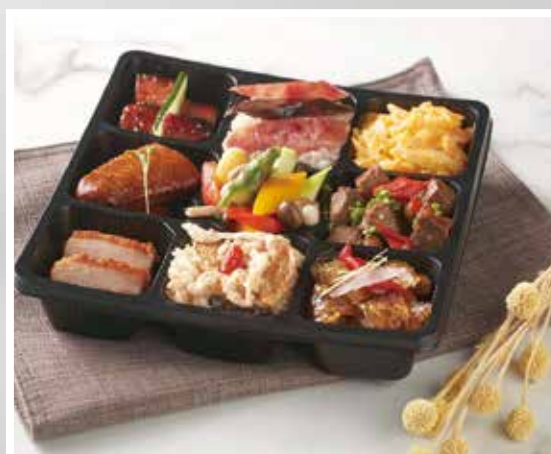
▲台北寒舍艾麗酒店推出「奢華九宴」九宮格便當。

烤腿排」、懷舊古早味家鄉菜的「蔥燒醬滷豬大排」、清甜海味鹹香的「菊島酸菜蒸時鮮」，與香辣首選的「川式乾燒鮮蝦球」等，5/31前豐富的外帶便當限時特價每盒200元。