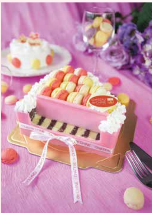
▲琴頌母愛母親節蛋糕。

翰品酒店花蓮翔雲西餐廳祭出「寵愛媽咪·幸福饗宴」，於母親節當週5/8~5/10推出限定黑松露燴雞及蜂蜜芥末現切火腿等料理，加值不加價，3人以上持自助晚餐券用餐加贈母親節特製外帶蛋糕1個。除了讓媽咪吃好料以外，凡5/1~5/10至館內消費者加購母親節超值福袋享8折優惠。另外，5/10入住的女性們也享有康乃馨1朵及五行堂腳底按摩抵用券、全身按摩抵用券各1張，帶媽咪跟家人出外旅遊好好放鬆。而母親節蛋糕一直是節慶重頭戲，限量手工製作鋼琴造型蛋糕—「琴頌母愛」，5/5前預訂享早鳥優惠價520元，售完為止。