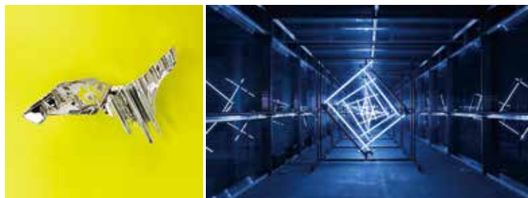
▲防疫期間為了使民眾在家依舊能體驗社交與娛樂的樂趣，香港開創嶄新藝術線上觀展模式。

新冠肺炎全球蔓延，作為高度國際化的城市—香港積極防疫，藉由創新的科技策略，帶來新興生活型態。健康安全方面包括香港機場和港鐵公司皆導入自動化防疫步驟，提前防範看不見的角落，同時更積極開創新穎的藝術觀展模式，不僅世界知名的「2020香港巴塞爾藝術展」轉為線上導賞，多家藝術平台亦力拚數位轉型，讓全民在防疫期間仍能保有藝術陶冶的饗宴，打造防疫與樂趣都不妥協的美好生活。