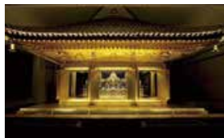
▲金色堂被譽為平安時代佛教藝術的最高峰。

世界遺產平泉主要由5處設施構成，分別為中尊寺、毛越寺、觀自在王院遺跡、無量光院遺跡和金雞山，呈現出佛教淨土思想與理念的寺院和庭園擁有超過千年歷史，靜謐之美讓人彷彿來到另一個世界。入列日本國寶的中尊寺「金色堂」外觀以金箔點綴、雕刻工法無比細膩，為平泉不可錯過必訪景點。