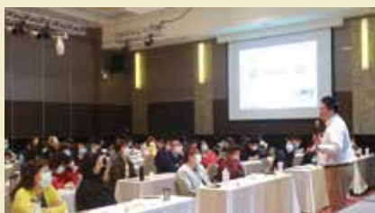
▲培訓課程特別嚴選如台北集思北科大會議中心、晶華酒店與台北花園大酒店的授課場地，因交通便利、場地挑高寬敞舒適，大獲學員一致好評。