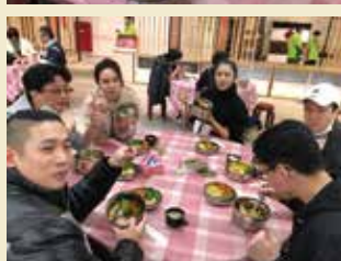
▲課程每日提供健康美味的便當盒餐。