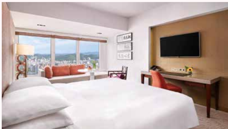
▲融合東方禪意與西方明快設計風格的君悅客房。

即日起到4/28晚間11時59分59秒止，台北君悅酒店推出史無前例，不分平假日皆可使用，每張4,888元的1泊2食住宿券；以及一中二西三款選擇的母親節6人外帶套餐，和一網打盡「凱菲屋」與「彩日本料理」正餐，平均下來每人千元有找的1+1自助餐套票等三大破盤商品。5/10前，更推出4款母親節蛋糕，從旋轉起舞的芭蕾女伶，到繽紛飛揚的彩蝶；從對法國的思鄉，到對台灣的依戀，將那些顯而易見或深藏不露的情感，濃縮成一口口甜蜜，以愛之名。不分實體或網路，4月底前訂購付款，皆享8折優惠。