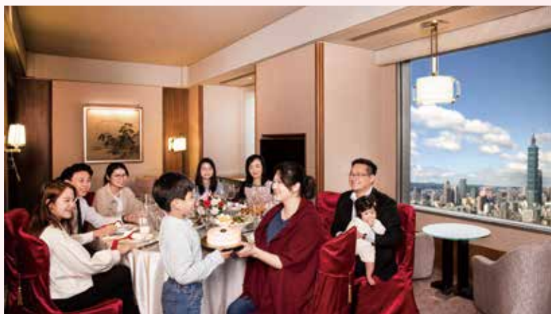
▲母親節中式桌菜特別提供於客房用餐每桌22,888元起享用果汁無限暢飲及贈送母親節蛋糕1個。

餐費每桌10人只要22,888元起 史無前例 同步推出2款佳節限定蛋糕 獻給母親大人