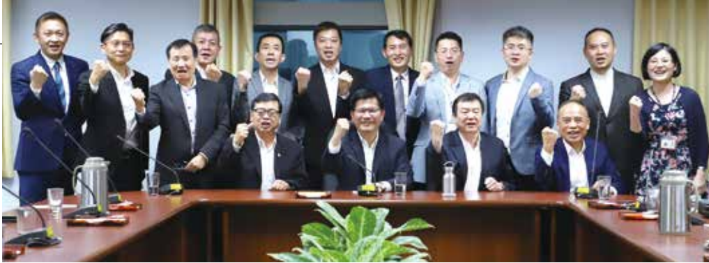
▲因為政府對於觀光產業的重視，加上旅行業紓困衝鋒隊的全力爭取，讓紓困2.0能更貼近市場需求。