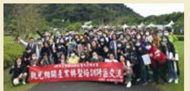
▲旅館班學員考察礁溪老爺溫泉旅館房間設施及露營地戶外教學