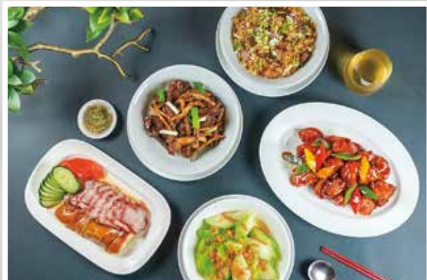
▲台北君悅酒店推出粵味雙享4人套餐。

台北君悅酒店即日起推出「中式經典」、「粵味雙享」、「健康蔬食」（全素可食）與「印度風味」等4項全新菜單，將口感Q彈清新的鳳梨薑黃海鮮炒飯、齒頰留香的蒜苗臘味炒飯、健康養生的南瓜子紅藜蒸飯，與特調配方的印度蔬菜飯及烤餅不同主食，搭配微醺怡人的花雕醉雞、酸香開胃的彩椒醋溜鮮魚、香辣帶勁的素麻婆豆腐、厚實多汁的坦督里烤蘑菇等精選菜色，為中午與晚上帶來更多選擇。君悅美饌家宴，每套售價1,500元（4人份，3天前預訂），內容包含5道美味佳餚適合闔家四口一同享用；4/30前透過線上訂購享8折優惠。