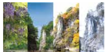
▲擁有多元面貌的狹鼻溪，四季都能搭配組合魅力商品。

日本百景之一的狹鼻溪，溪谷全長約2公里，來回約1個半小時的船程中途會停靠1次，讓遊客前往「運玉之洞」投擲運玉測試手氣，聽船夫悠悠唱起船歌「狹鼻溪追分」飽覽溪谷風光。冬季期間會推出特殊的「暖桌船」，只要事前預約就能在船上品嚐美味的「木流火鍋」，歡迎同業多加參考與利用。