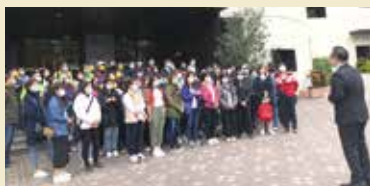
▲旅館班學員赴礁溪考察特色旅館—山形閣大飯店進行業務交流。