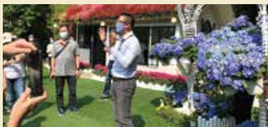
▲旅行社學員赴花露休閒農場考察台灣休閒農業旅遊搭建日後強大商機。