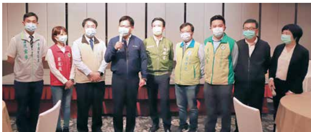
▲台灣旅遊交流協會舉辦轉型培訓課程深獲好評，交通部部長林佳龍（左4）特別出席，攜手觀光局代理局長張錫聰（右2）、台南市市長黃偉哲（左3）等人一同為學員們加油打氣。

因應疫情對於觀光產業所造成的嚴重情勢，交通部觀光局特別推出紓困方案，其中針對補助方面，推出「協助重大疫情影響觀光相關產業轉型培訓實施要點」，讓旅遊產業從業人員能以訓代賑，學習新知與獲得相應補助。台灣旅遊交流協會特別申請辦理培訓課程，北台灣的課程舉辦期間為4/6~4/24，包括台北晶華酒店舉辦「觀光旅館班」，「旅行社班」則分別由集思北科大與台北花園酒店同步登場，各場各自有3梯次，每梯次80人，總計共有720名學員受惠。