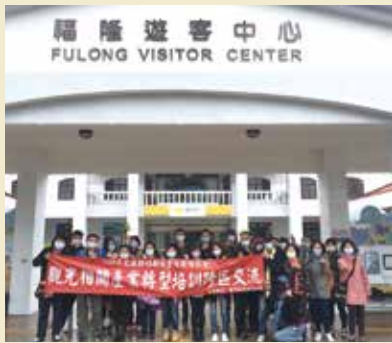
▲▼旅行社學員們前往北觀處富貴角燈塔及東北角舊鐵道考察北海岸港灣旅遊及自行車之旅。