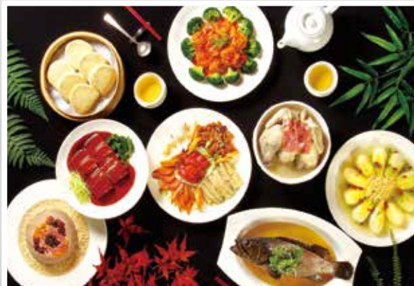
▲天成飯店集團推出「聚團圓—母親節合菜饗宴」，由廚藝精粹的專業主廚團隊量身打造。

天成飯店集團看準外帶及外送商機，聯合旗下3館：台北天成大飯店、台北花園大酒店及世貿國際會館於即日起至6/20止推出當日現做「聚團圓—母親節合菜饗宴」，由資歷豐富的主廚團隊精心規劃，嚴選新鮮海陸食材入菜，用料升級、加量不加價，打造適合小家庭的6人份合菜，7道精緻美饌每套優惠價3,999元，常溫供應只要稍加加熱即可享用；此外，為使讓消費者安心在家防疫也能輕鬆準備豐盛料理，消費者點餐後，可選擇由配合的計程車專屬