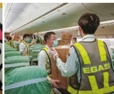
◀長榮航空BR56貨品主要為協助防疫之醫療物資。