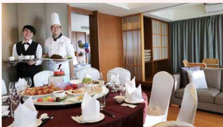
▲福容大飯店提供在飯店的頂級套房內用餐。

本專案每天只招待8組客人 把握機會預訂 再贈送10張福隆海水浴場門票 夏季玩水樂