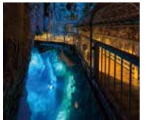
▲龍泉洞目前開放參觀區域長約700公尺，能夠行經3處地底湖。

龍泉洞與山口縣秋芳洞、高知縣龍河洞並列日本三大鐘乳石洞，被列為國家級天然紀念物，終年氣溫介於10度上下，洞穴裡的「地底湖」擁有世界上數一數二的清澈度，散發出如綠寶石般的光芒，沿途鬼斧神工的鐘乳石奇景也讓人驚嘆不已。