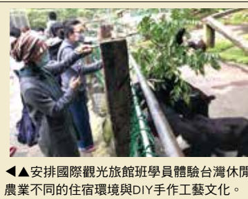
▲安排國際觀光旅館班學員體驗台灣休閒農業不同的住宿環境與DIY手工藝文化。